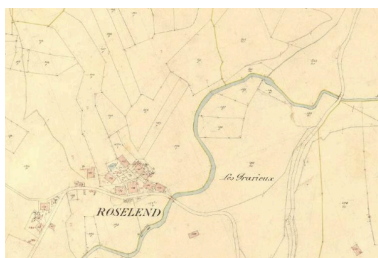
Premier cadastre français, Beaufort, 1935, Section F, feuille 3 (FR.AD073, 3P 7400). IVR84_20187300053NUCA