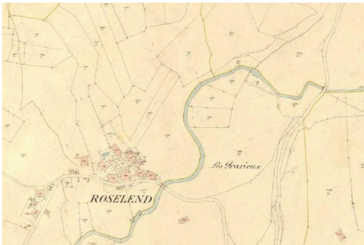
Premier cadastre français, Beaufort, 1935, Section F, feuille 3 (FR.AD073, 3P 7400).