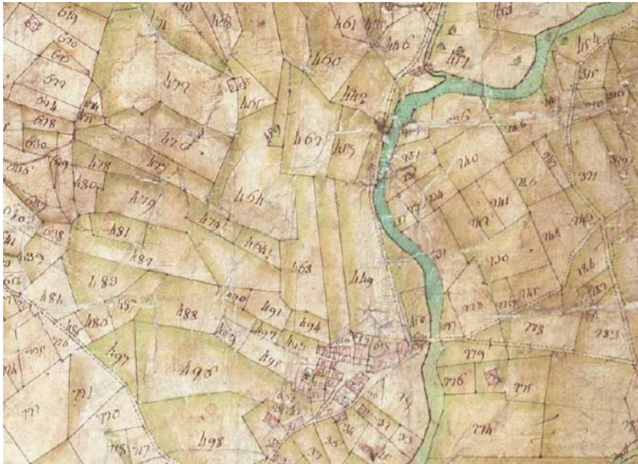
Cadastre de 1728, Beaufort, 1732 361, Vue 17 (FR.AD073, C2155).