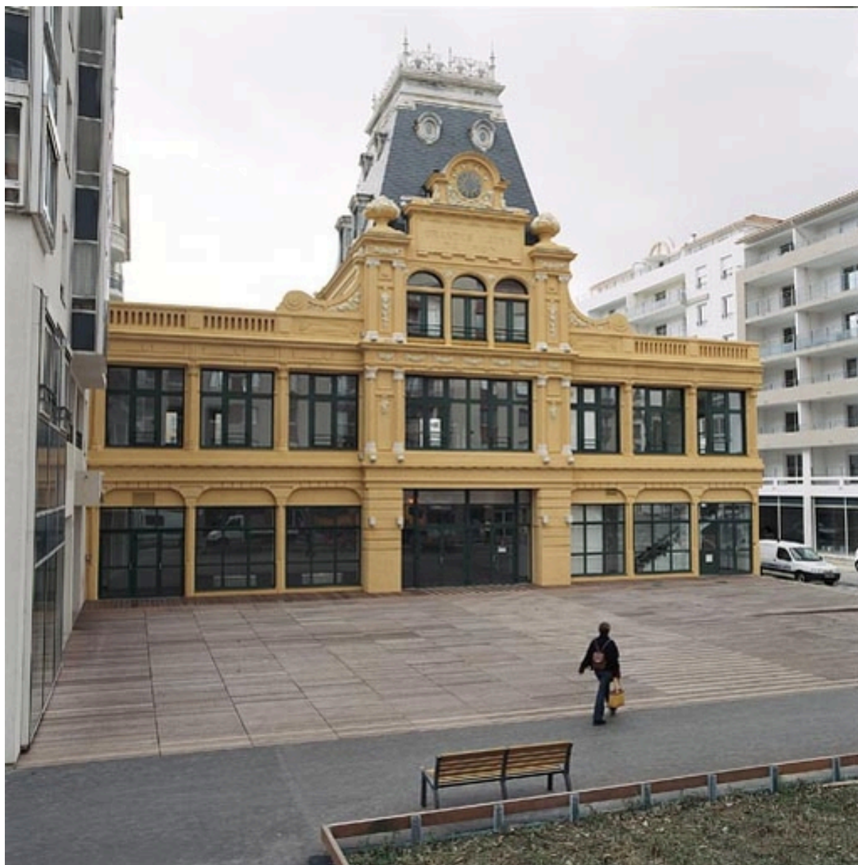
Vue générale nord