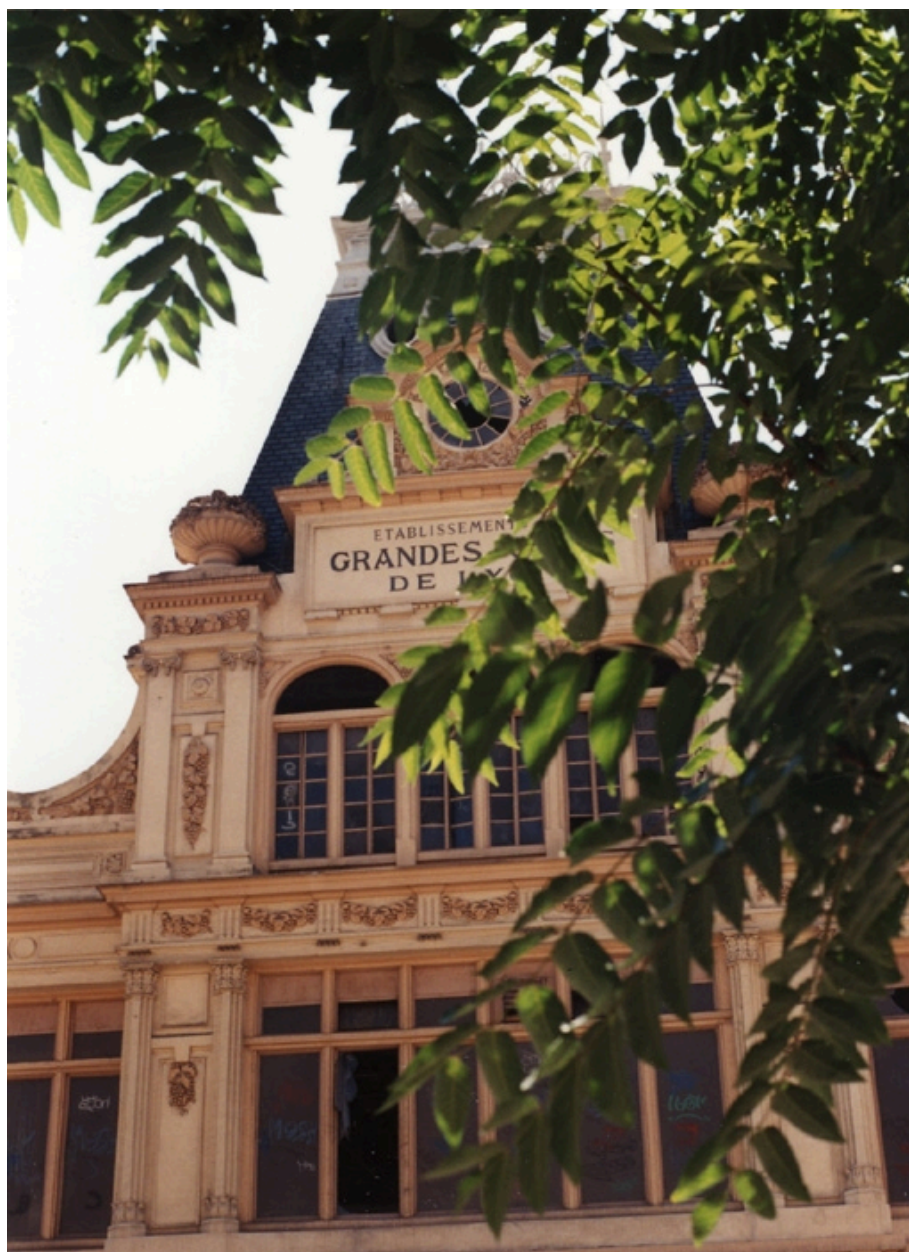
Détail enseigne (vers 1995)