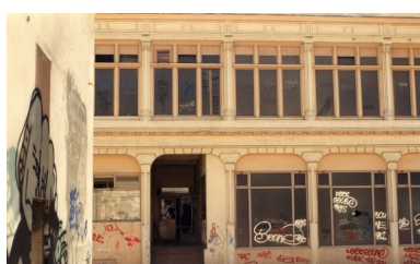
Détail aile latérale IVR82_20086901821NUCA