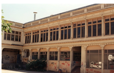
Vue aile latérale sud IVR82_20086901822NUCA