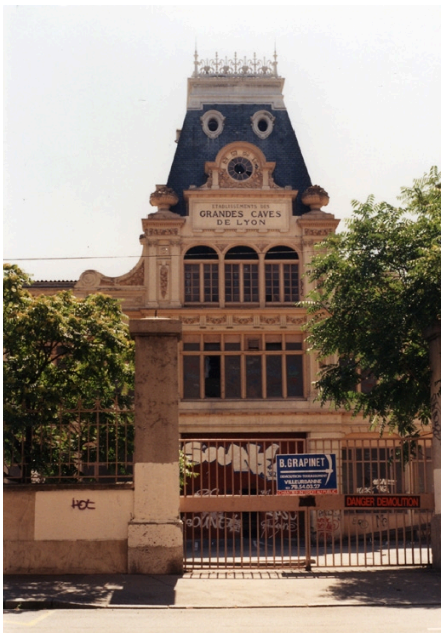
Vue nord du pavillon centrale