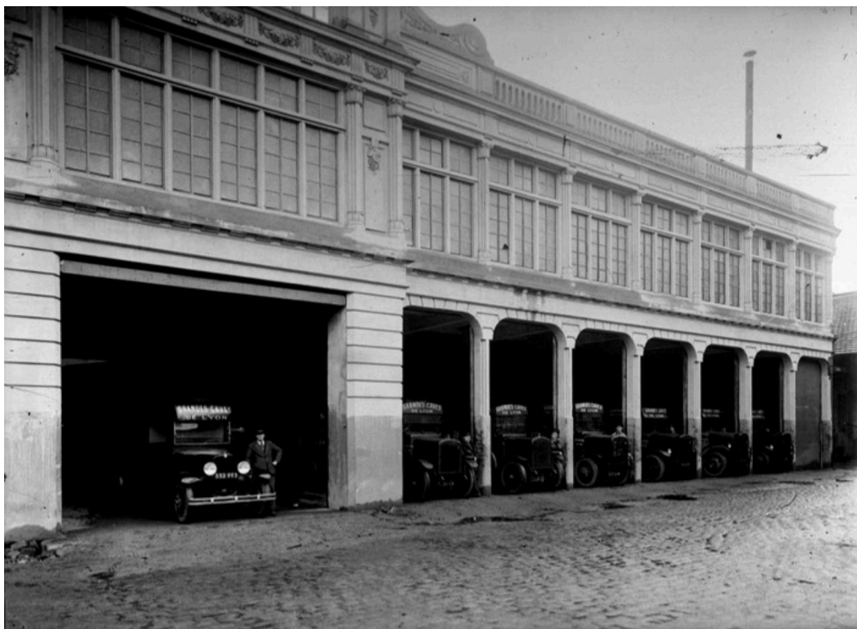
Vue du rez-de-chaussée, garages des véhicules de livraisons, BM Lyon Collection Sylvestre vidéralp, 1930