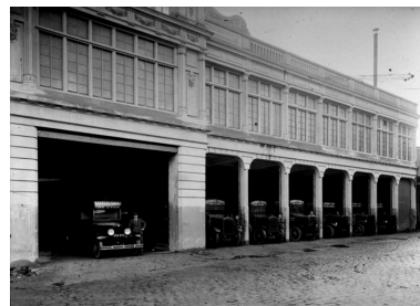
Vue du rez-de-chaussée, garages des véhicules de livraisons, BM Lyon Collection Sylvestre vidéralp, 1930 IVR82_20036901552NUC