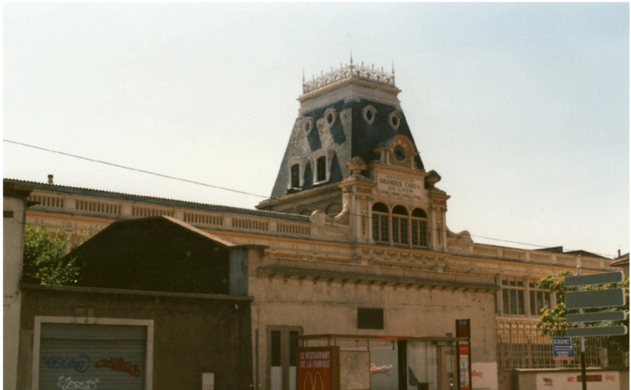
Vue sud-est du site (vers 1995)