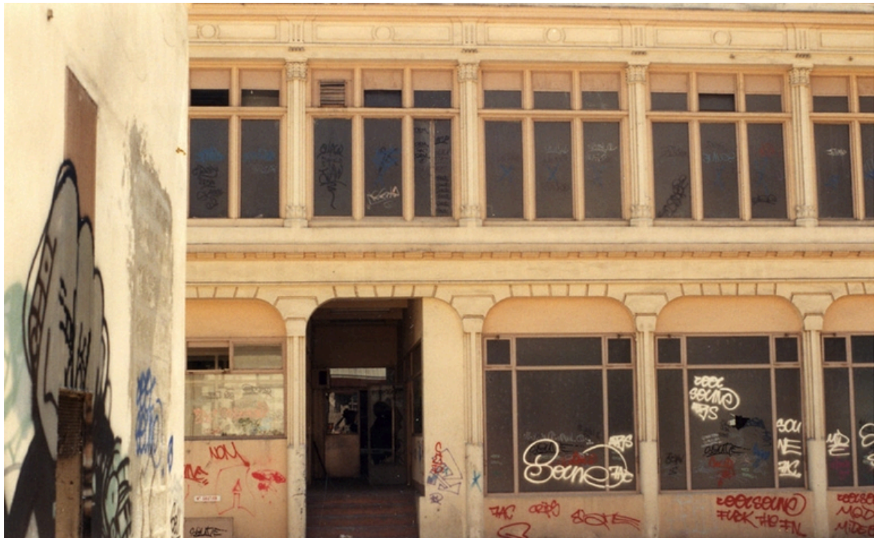
Détail aile latérale