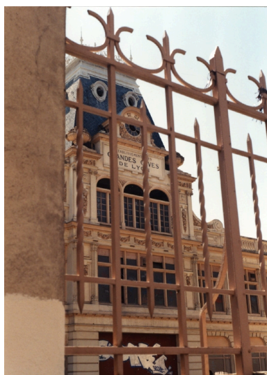
Pavillon centrale et enseigne