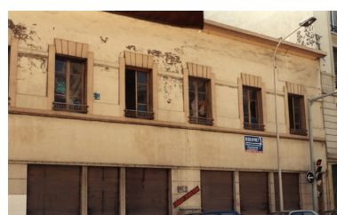
Bâtiment en alignement sur l'avenue Lacassagne (vers 1995)