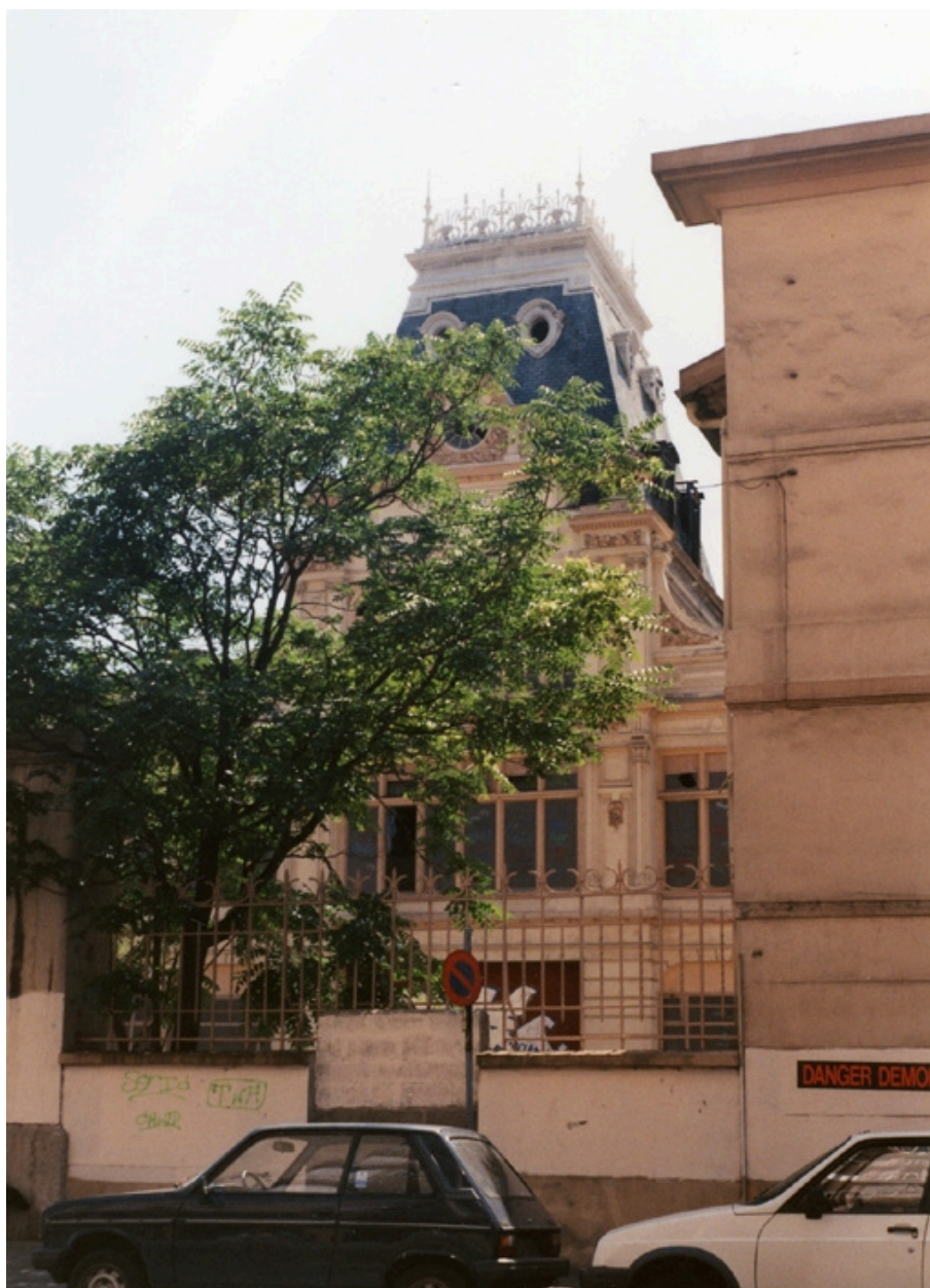
Vue nord (vers 1995 avant démolition)