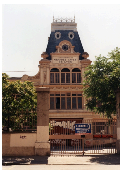
Vue nord du pavillon centrale IVR82_20086901818NUCA