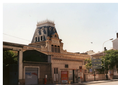
Vue sud-est du site avant démolition (vers 1995)