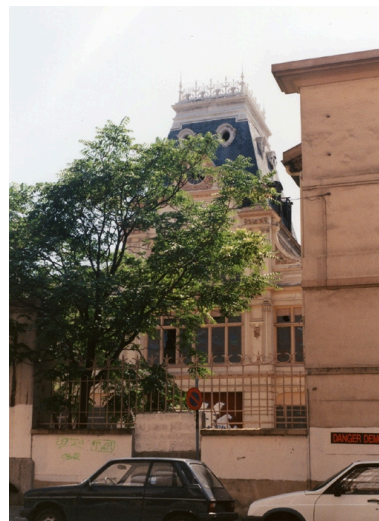
Vue nord (vers 1995 avant démolition) IVR82_20086901826NUCA