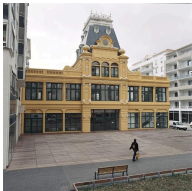
Vue générale nord IVR82_20036901843XA