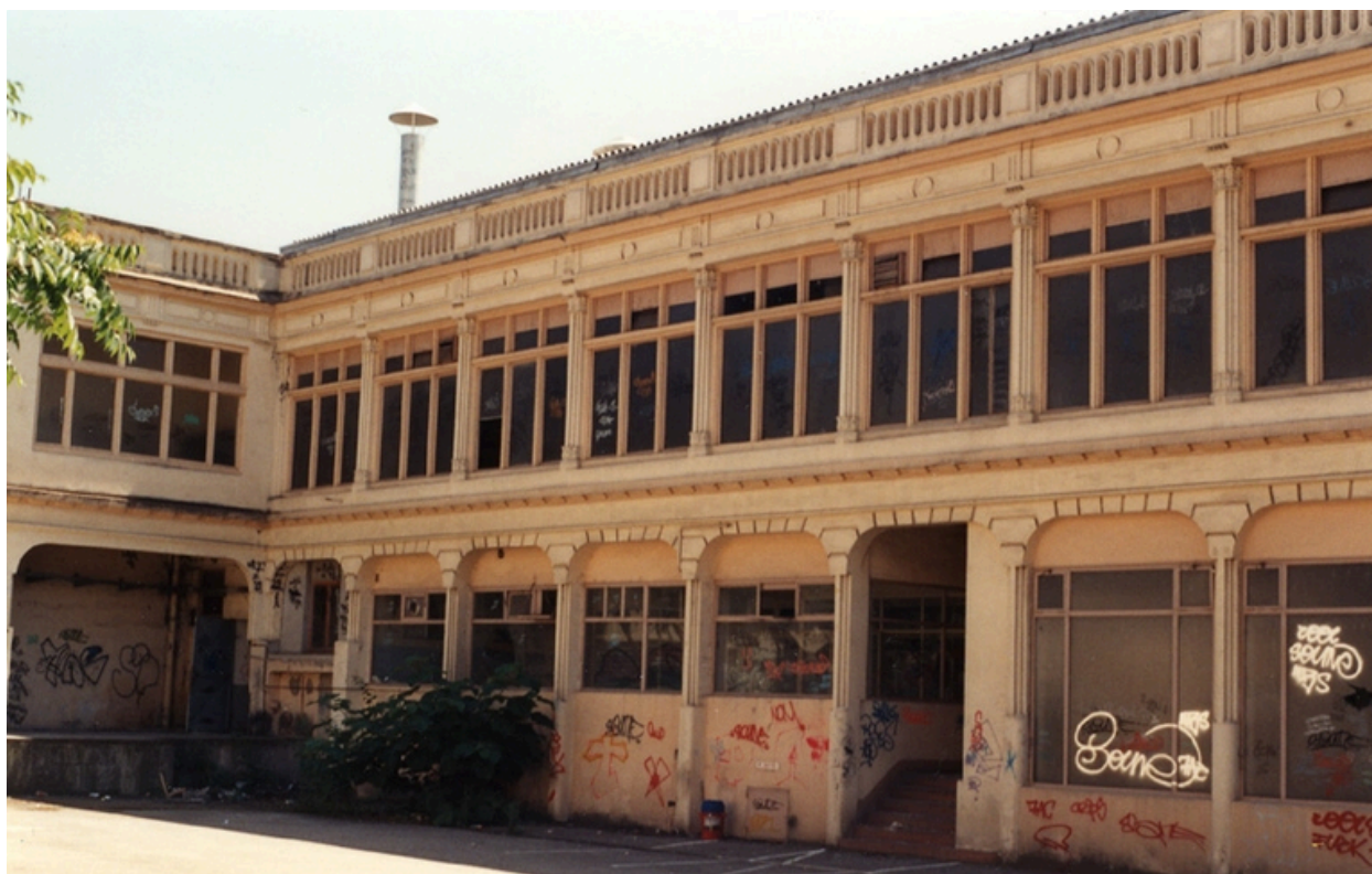
Vue aile latérale sud