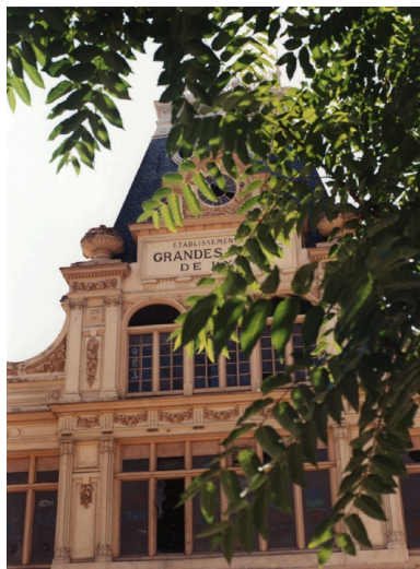
Détail enseigne (vers 1995) IVR82_20086901824NUCA