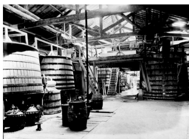
Vue des cuves de stockage des grandes caves de Lyon