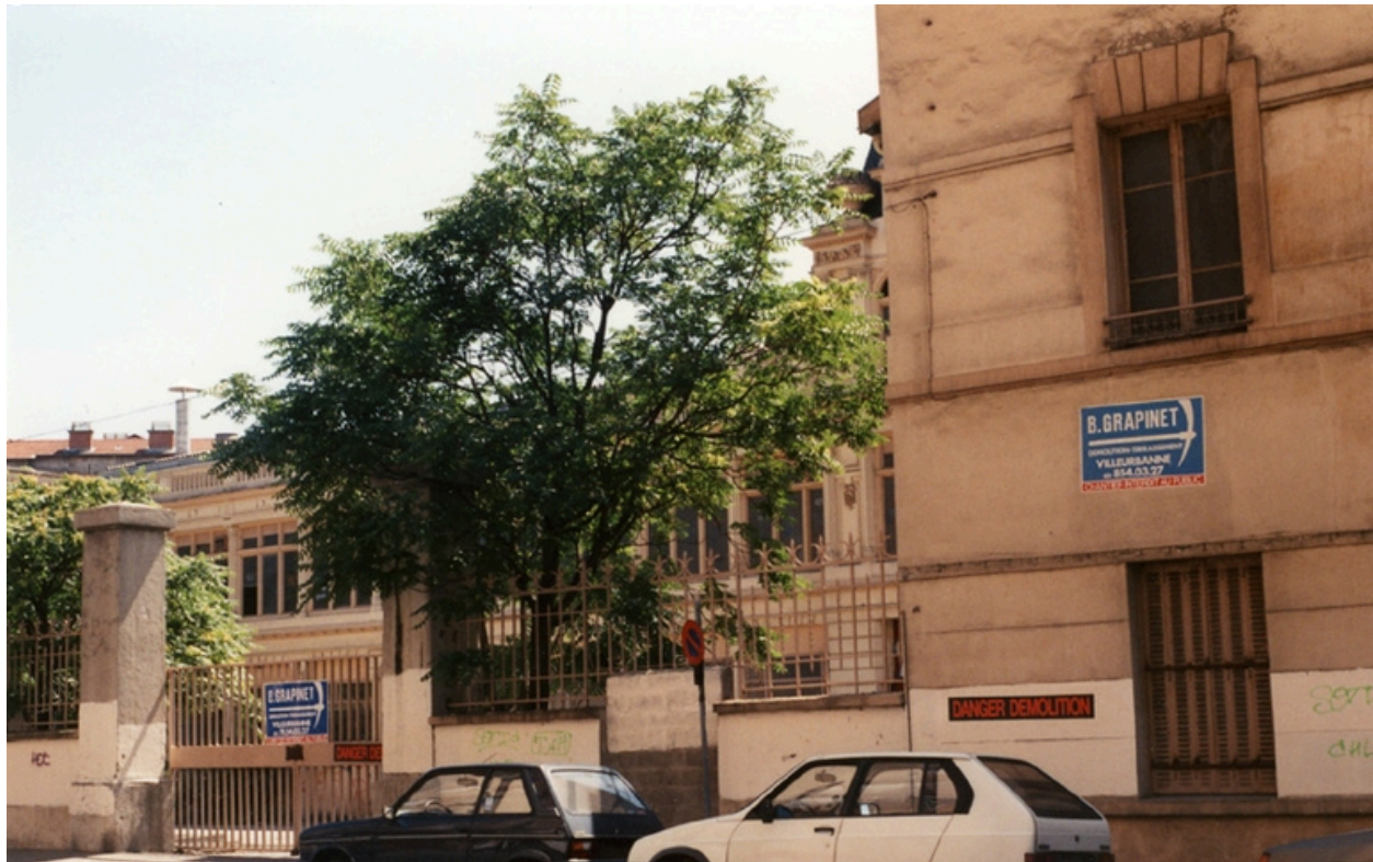
Clôture en alignement sur l'avenue Lacassagne (vers 1995)