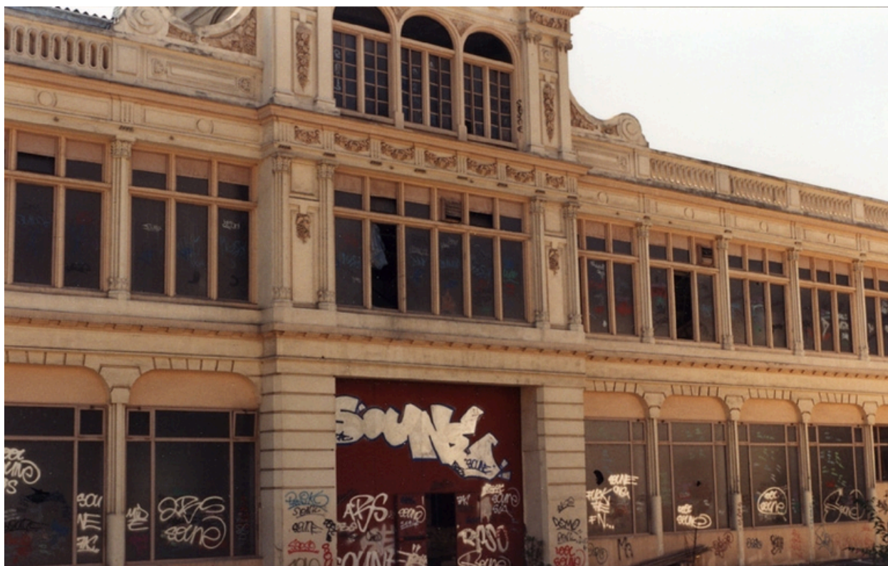
détail aile latérale (vers 1995)