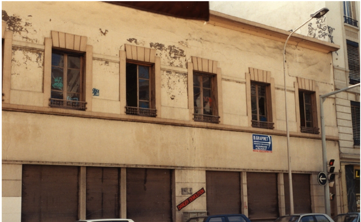
Bâtiment en alignement sur l'avenue Lacassagne (vers 1995)