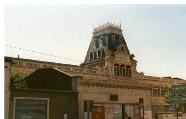
Vue sud-est du site (vers 1995) IVR82_20086901817NUCA