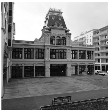
Vue générale IVR82_20036901686X