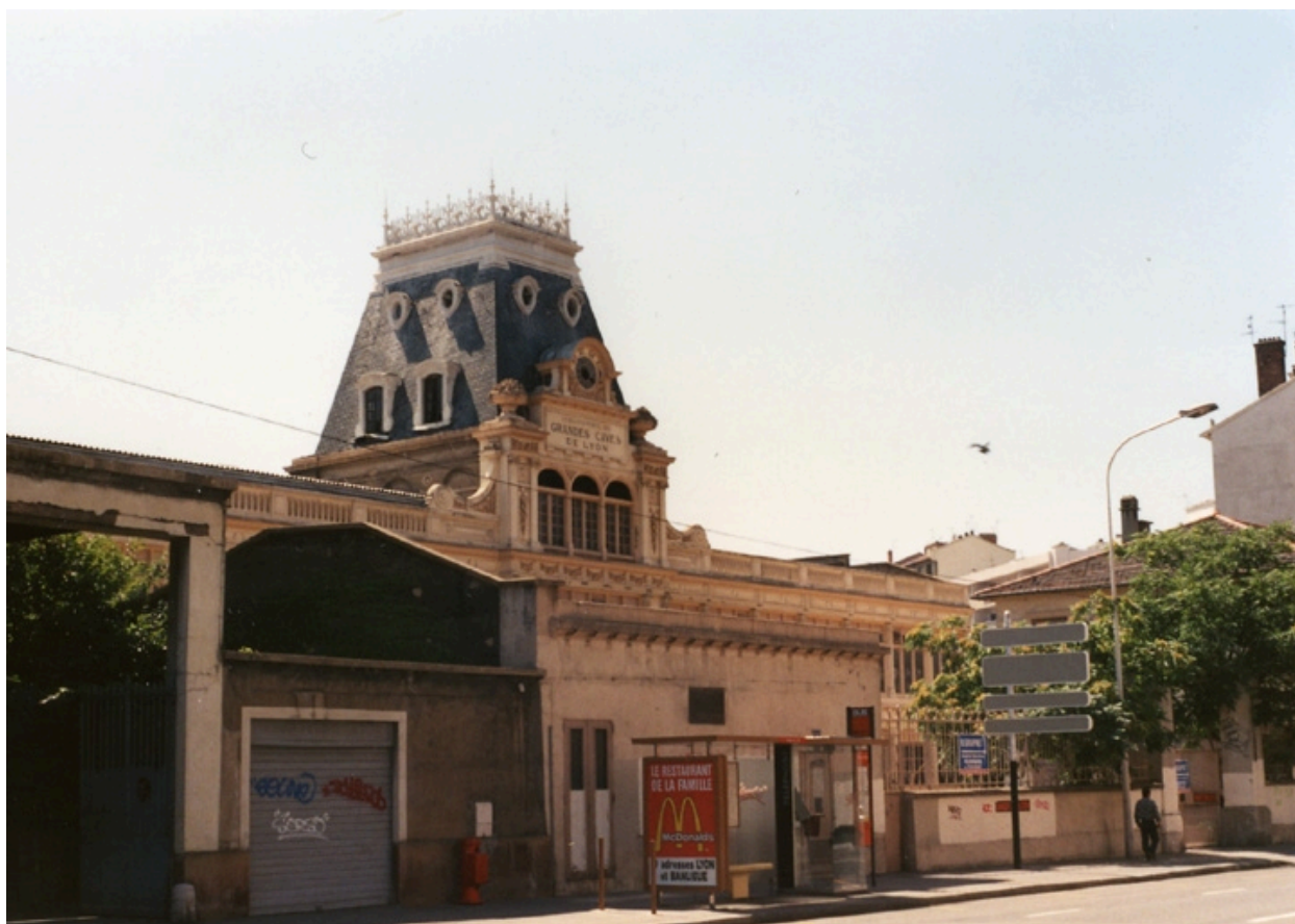
Vue sud-est du site avant démolition (vers 1995)