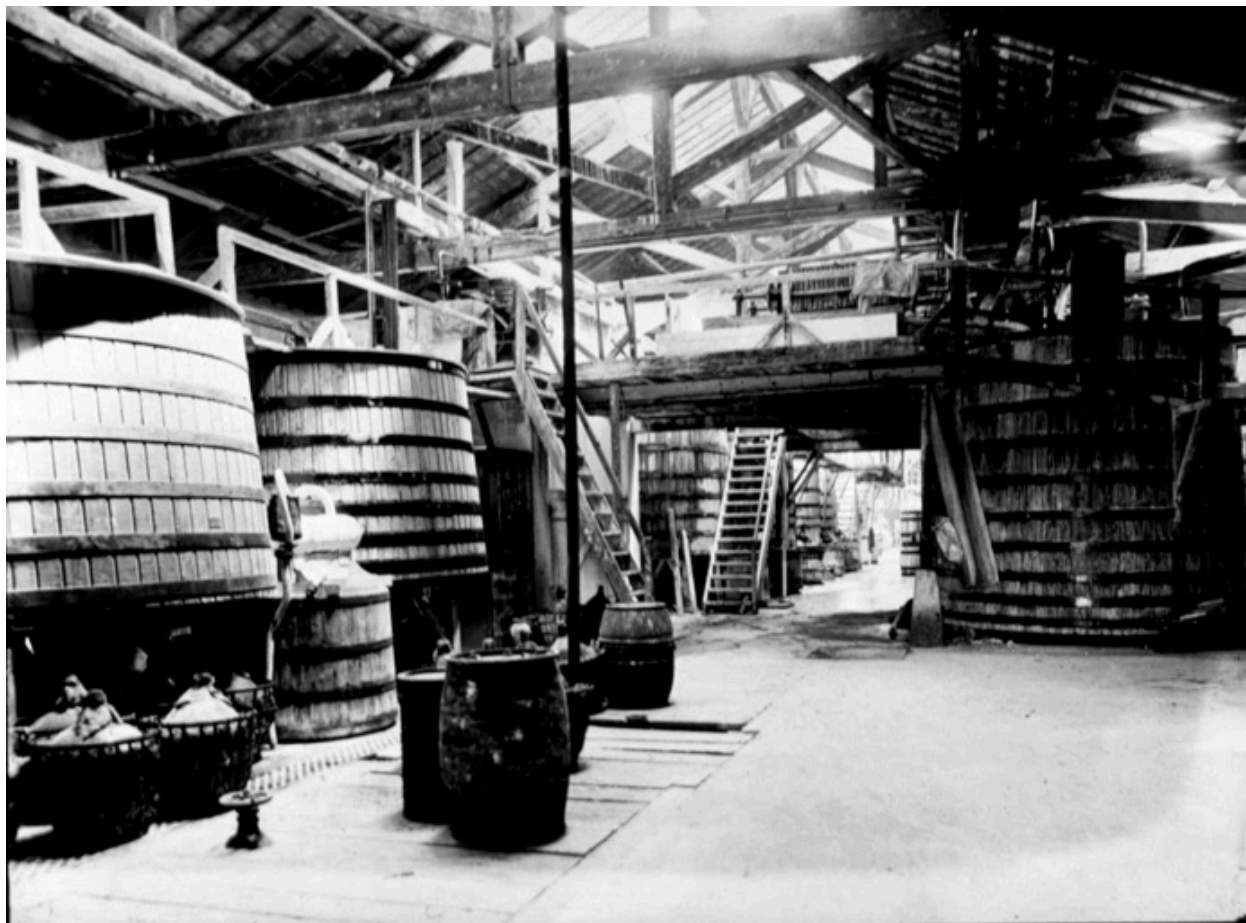
Vue des cuves de stockage des grandes caves de Lyon, BM Lyon-vidéralp collection Sylvestre 1930