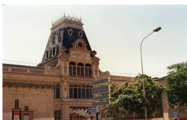
Vue est du site (vers 1995) IVR82_20086901816NUCA