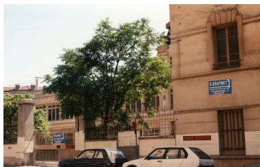
Clôture en alignement sur l'avenue Lacassagne (vers 1995) IVR82_20086901825NUCA