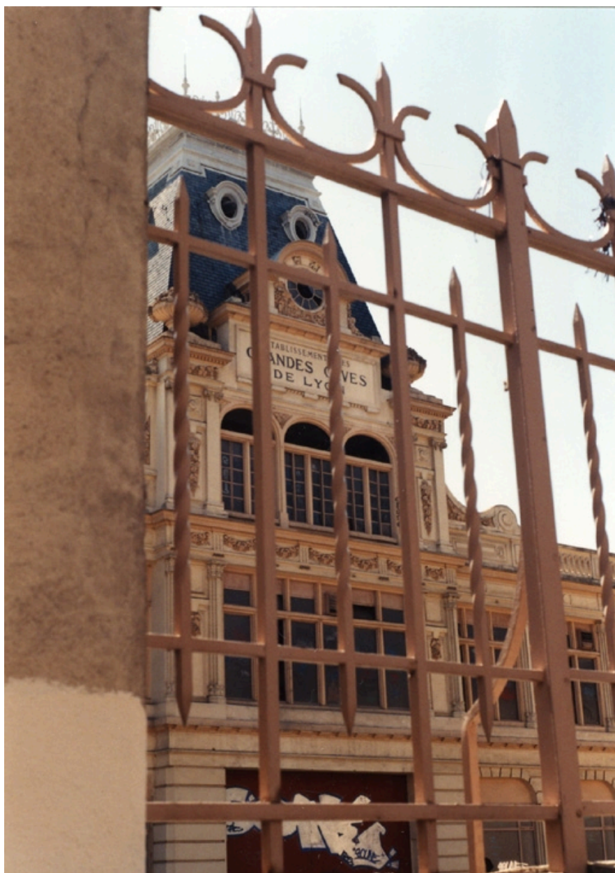
Pavillon centrale et enseigne