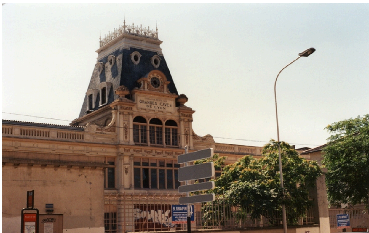
Vue est du site (vers 1995)