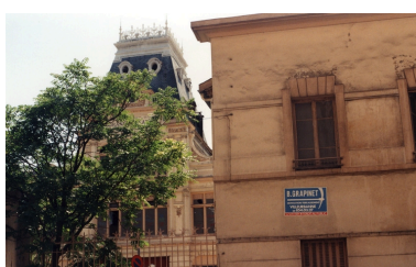
Vue nord-ouest IVR82_20086901819NUCA