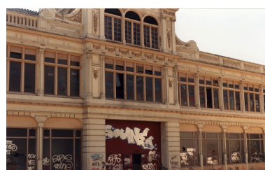
détail aile latérale (vers 1995,) IVR82_20086901820NUCA