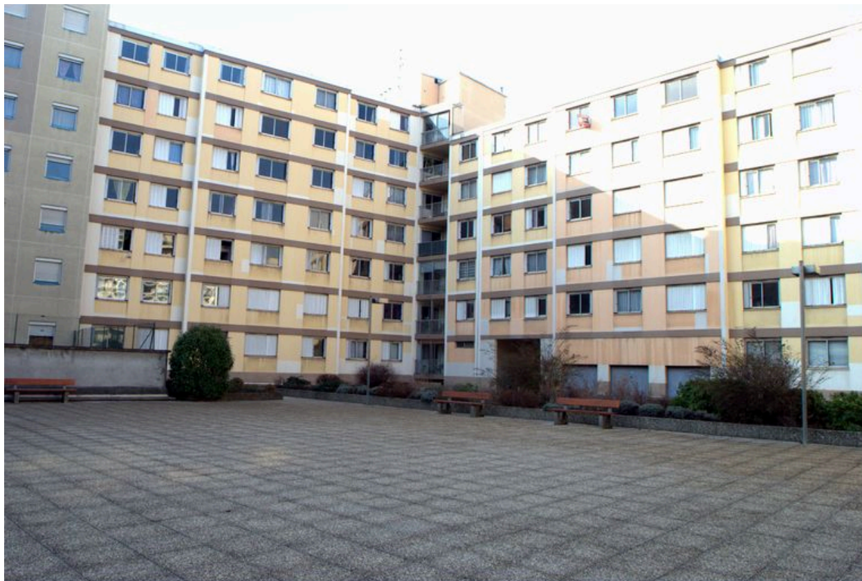
Elévations sur cour