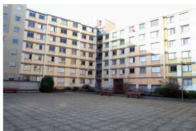
Elévations sur cour IVR82_20116904148NUCA