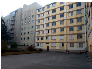
Elévation postérieure méridionale IVR82_20116904149NUCA