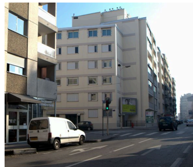
Vue d'ensemble depuis l'ouest IVR82_20116904146NUCA