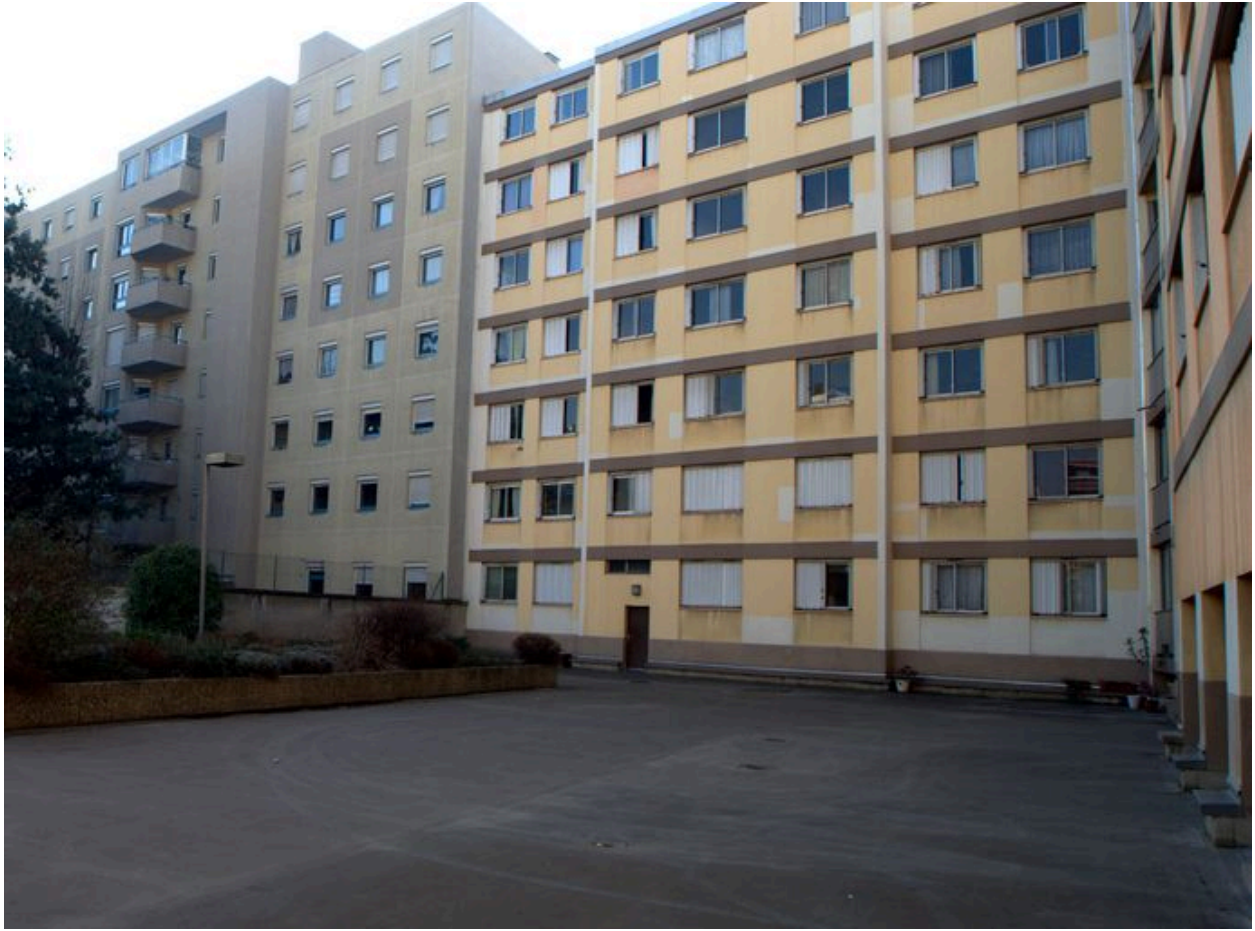
Elévation postérieure méridionale