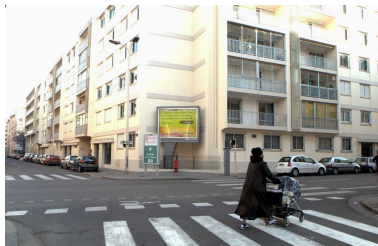
Vue générale IVR82_20116904147NUCA