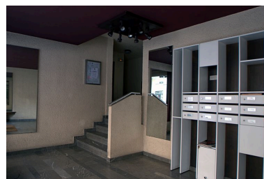
Vestibule IVR82_20116904150NUCA