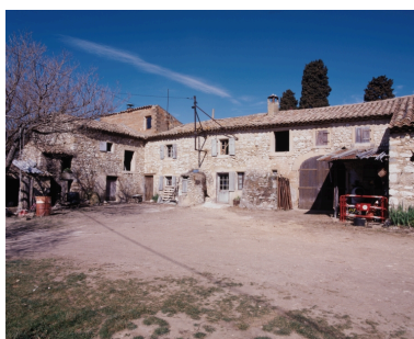
Cordeil. Vue partielle des élévations sur cour.