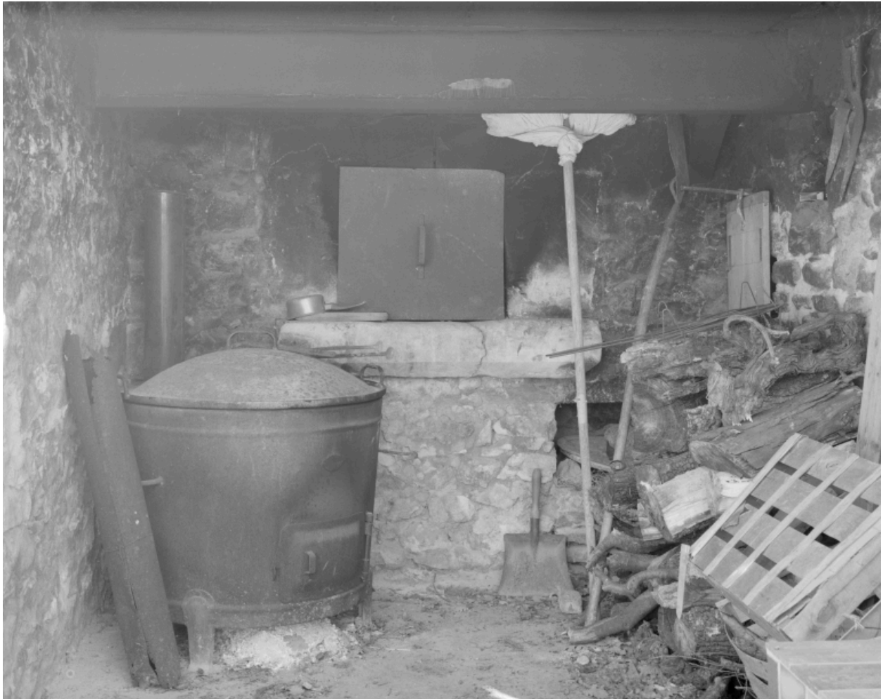
Alligier. Détail du four à pain et d'une chaudière.