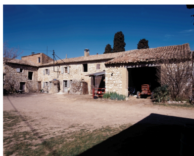
Cordeil. Vue de trois-quarts de la ferme depuis l'est.