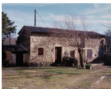
Les Echaravelles. Dépendance agricole : étables et porcherie.