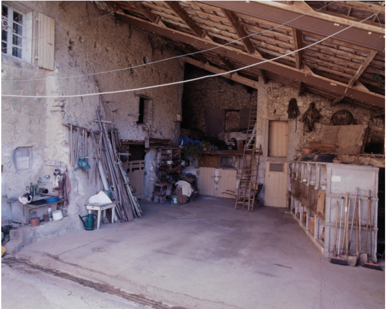
La Tuilière. Vue du hangar donnant sur cour et accolé au logis.