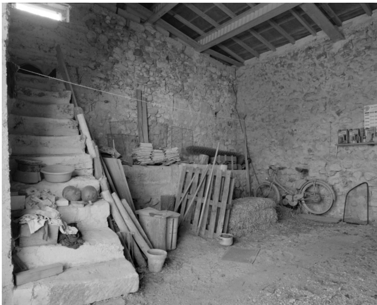
Les Echaravelles. Etable et escalier menant anciennement au fenil.