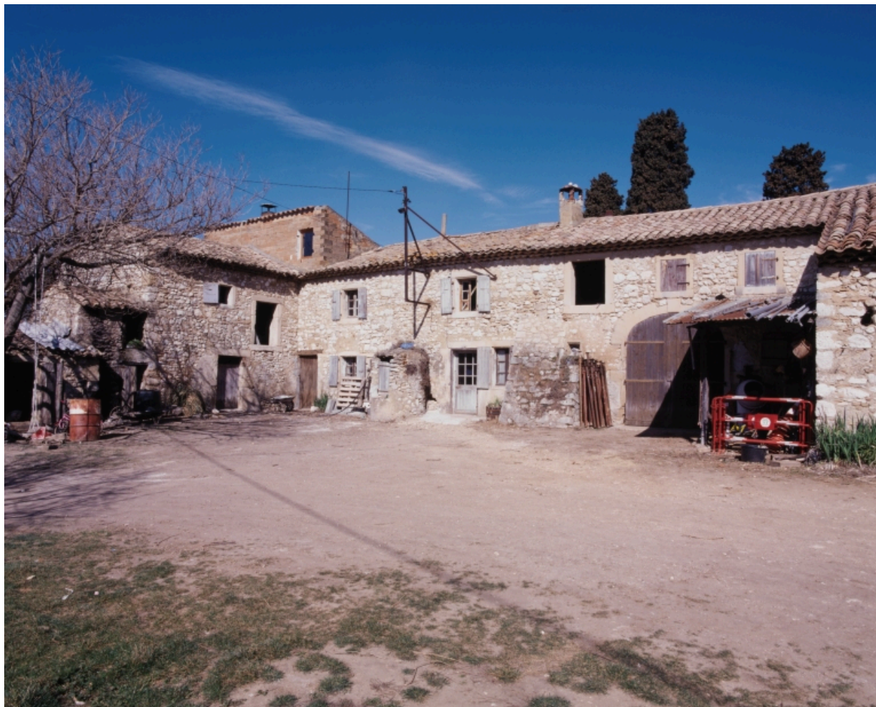
Cordeil. Vue partielle des élévations sur cour.