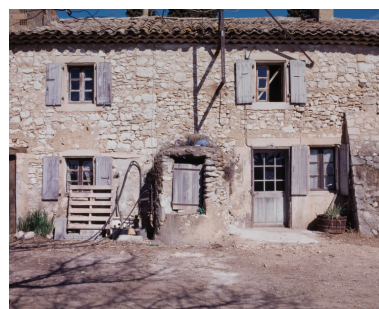
Cordeil. Façade sur cour : vue partielle du logis et puits accolé.