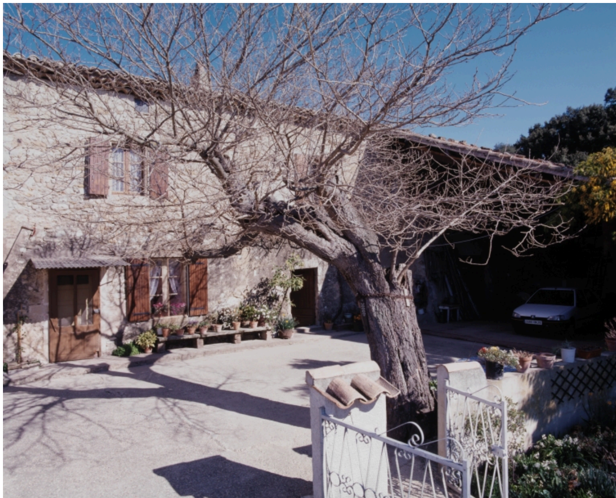
La Tuilière. Vue partielle sur cour : logis et hangar.