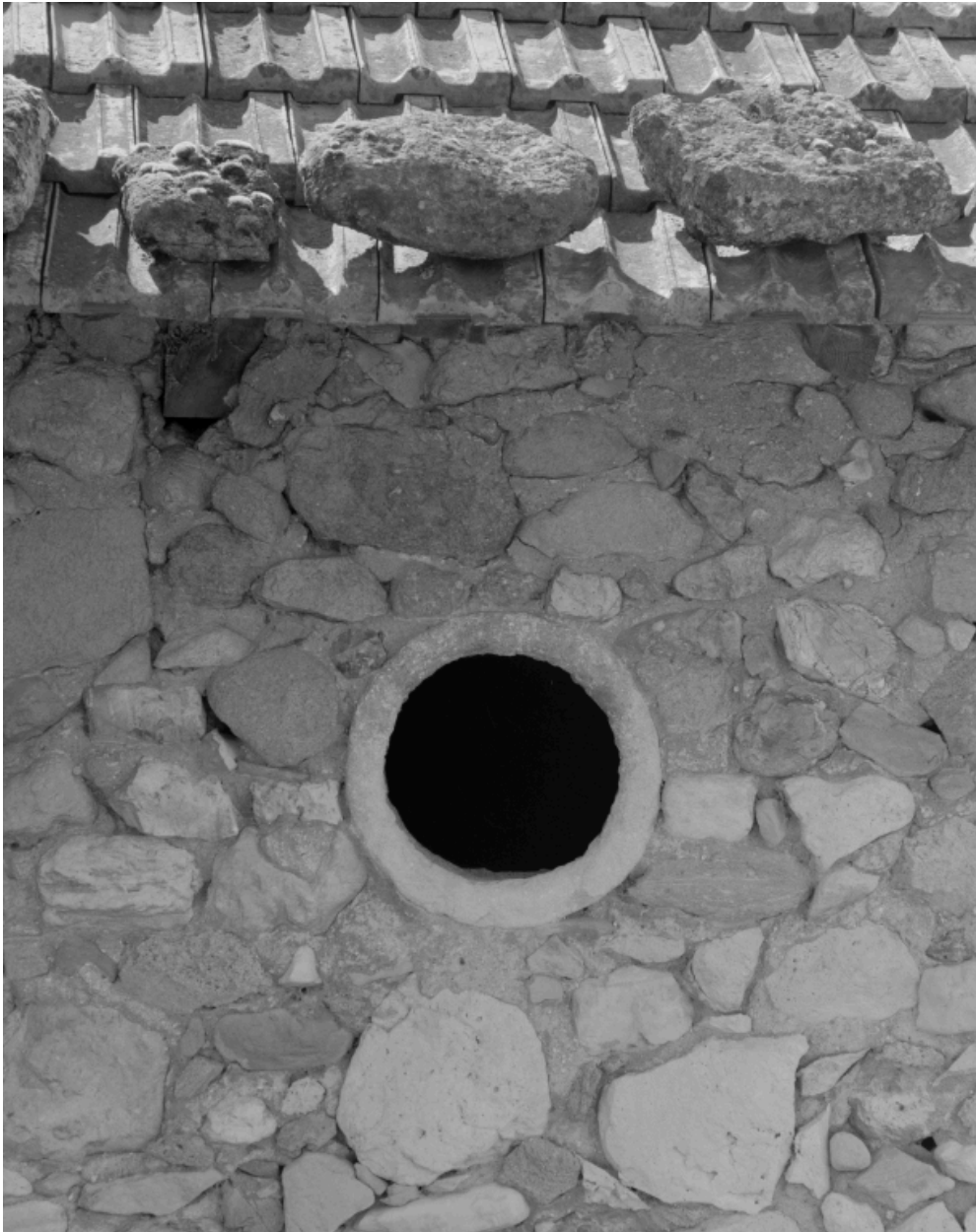
La Tuilière. Détail d'un oculus dans l'élévation postérieure de la ferme.