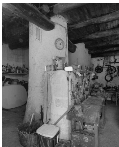
La Mège. Rez-de-chaussée : détail du pilier soutenant la charpente.