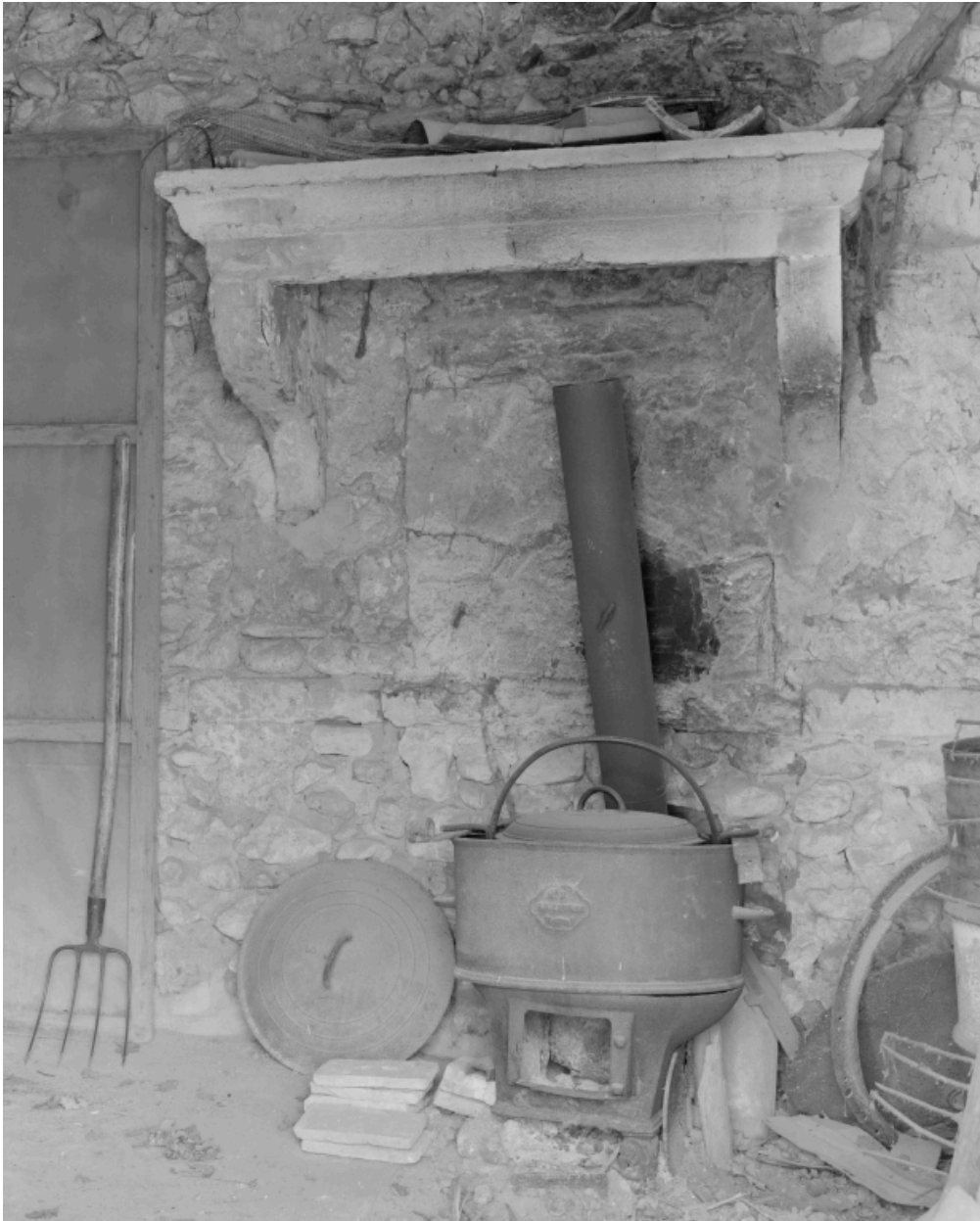
Les Echaravelles. Détail de l'ancien four à pain et chaudière.