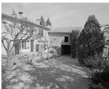
La Mège. Vue partielle de l'élévation principale du logis et dépendances accolées.