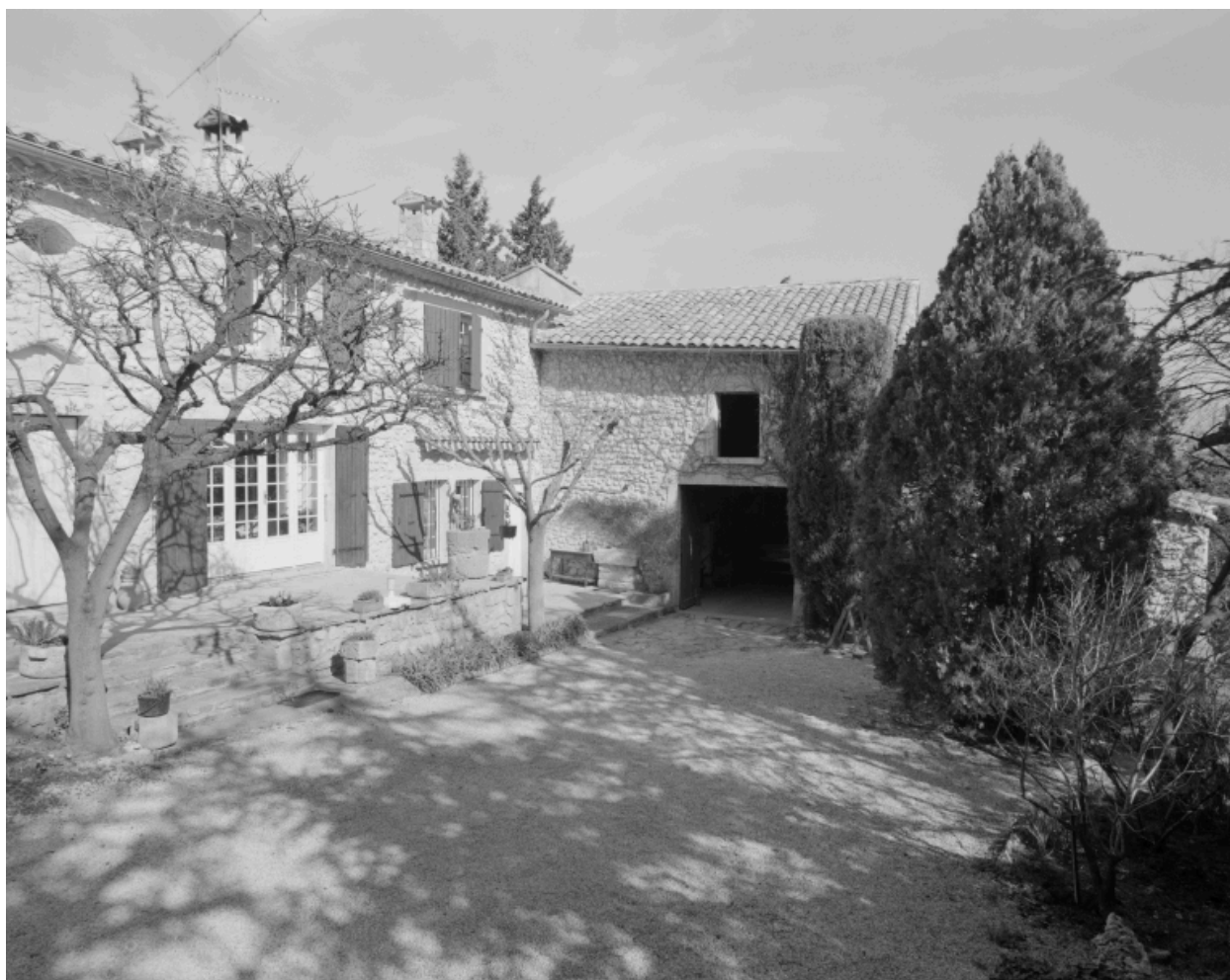
La Mège. Vue partielle de l'élévation principale du logis et dépendances accolées.