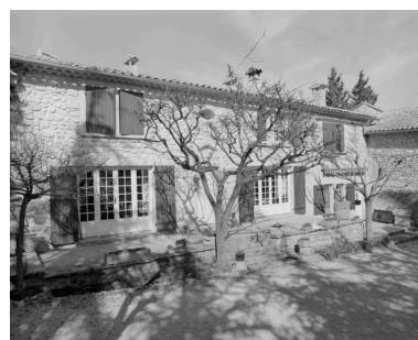
La Mège. Elevation principale du logis.