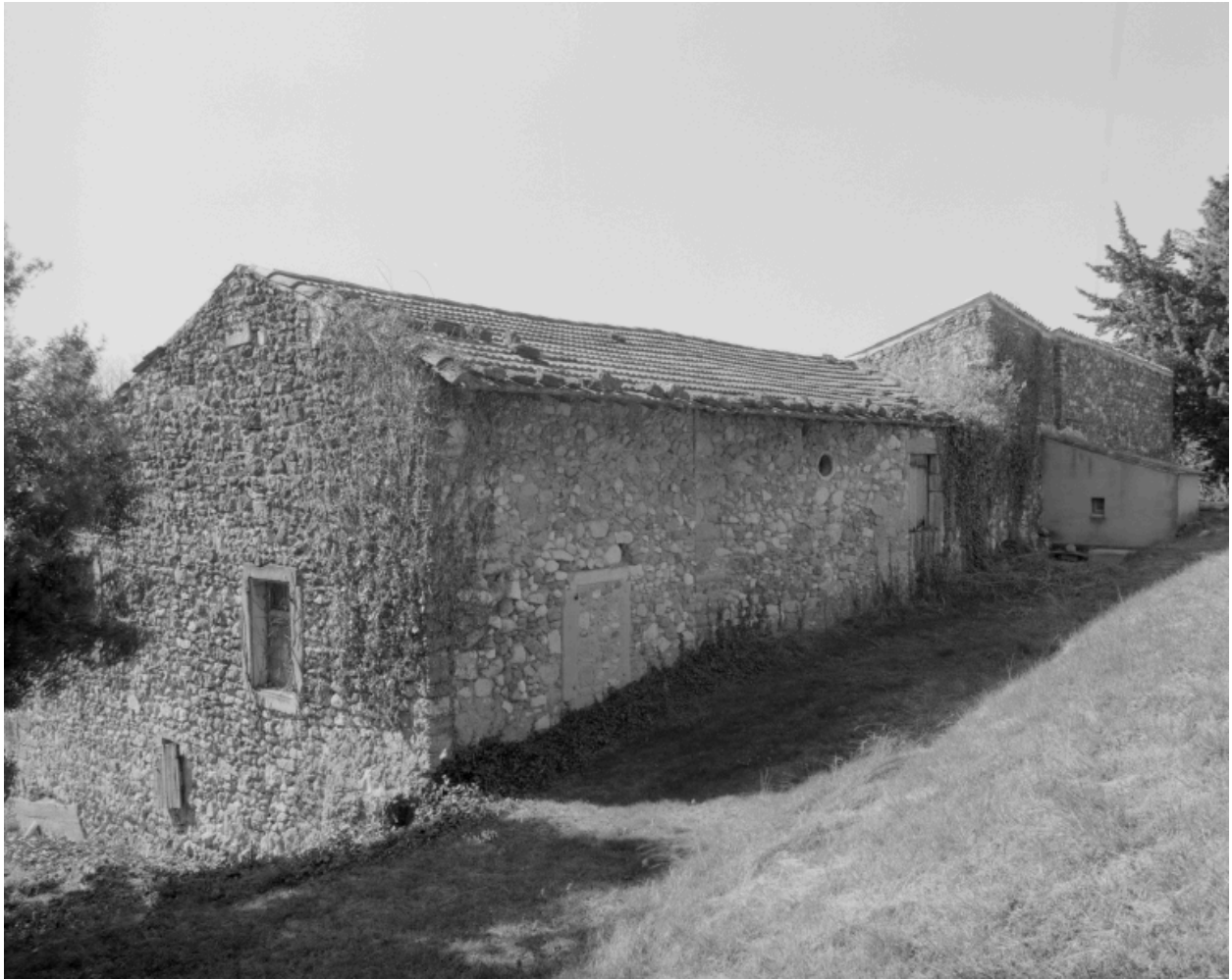
La Tuilière. Élévation postérieure.