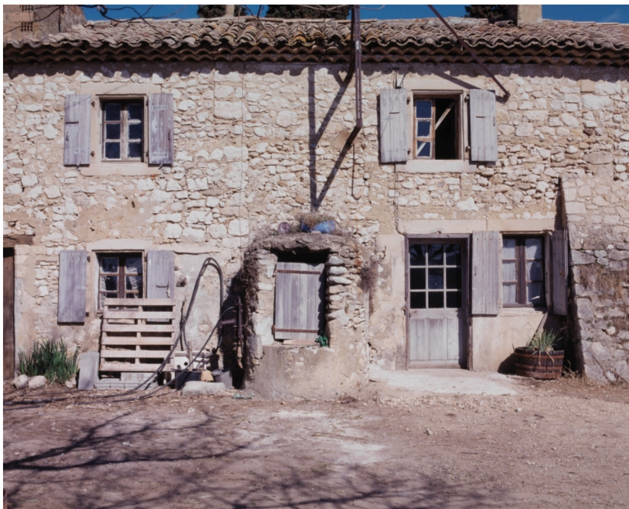
Cordeil. Façade sur cour : vue partielle du logis et puits accolé.