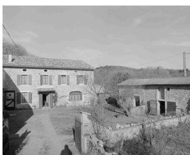
Les Echaravelles. Vue du logis et d'une partie des dépendances sur cour.