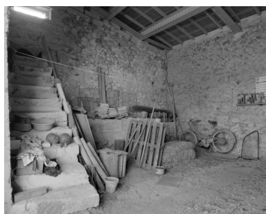
Les Echaravelles. Etable et escalier menant anciennement au fenil. IVR82_20002600108X