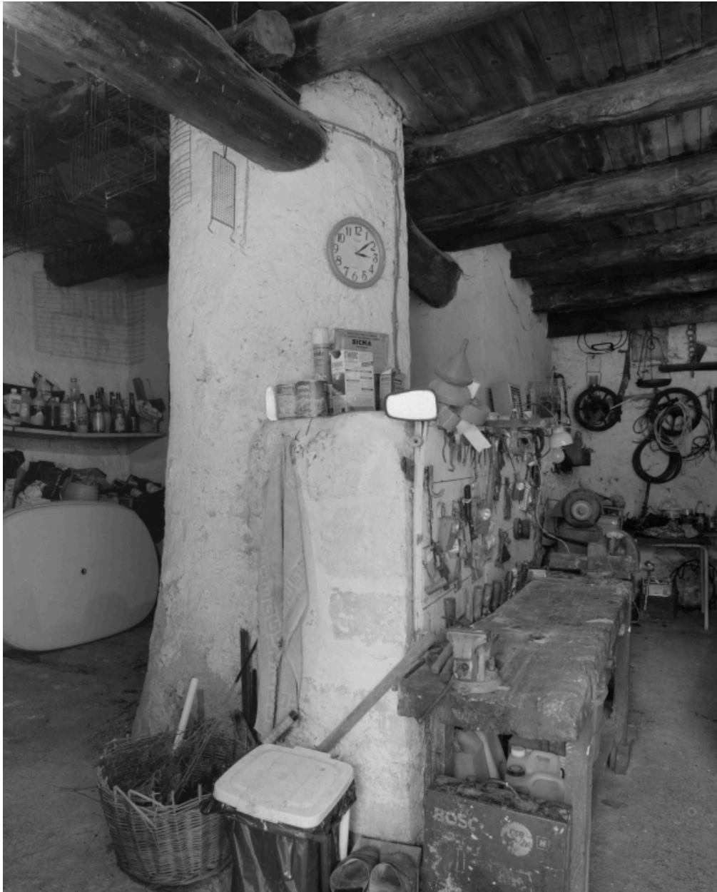
La Mège. Rez-de-chaussée : détail du pilier soutenant la charpente.