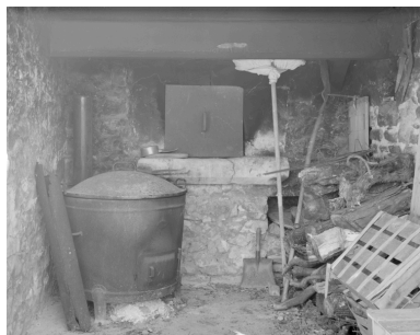
Alligier. Détail du four à pain et d'une chaudière. IVR82_20002600091X