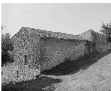
La Tuilière. Elévation postérieure. IVR82_20002600064X