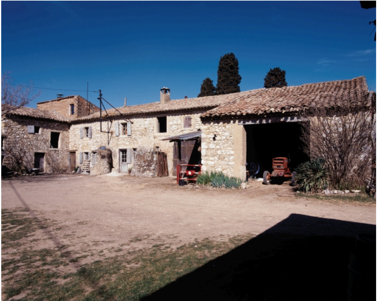
Cordeil. Vue de trois-quarts de la ferme depuis l'est.