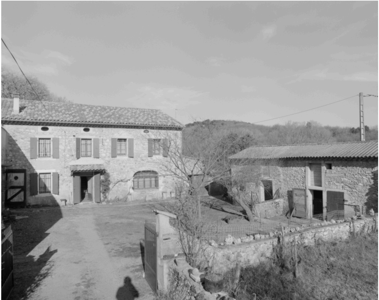
Les Echaravelles. Vue du logis et d'une partie des dépendances sur cour.