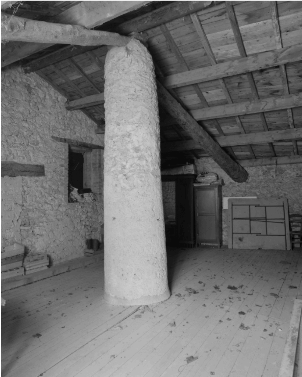
La Mège. Comble, pilier soutenant la charpente.