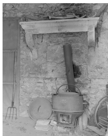
Les Echaravelles. Détail de l'ancien four à pain et chaudière.