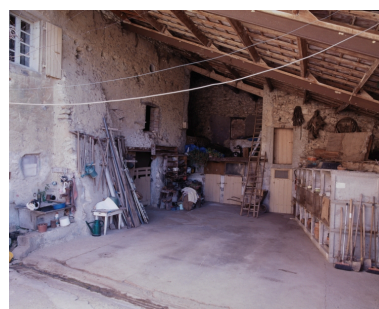
La Tuilière. Vue du hangar donnant sur cour et accolé au logis.