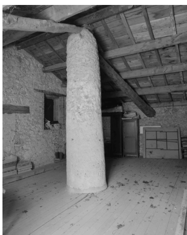
La Mège. Comble, pilier soutenant la charpente. IVR82_20002600081X