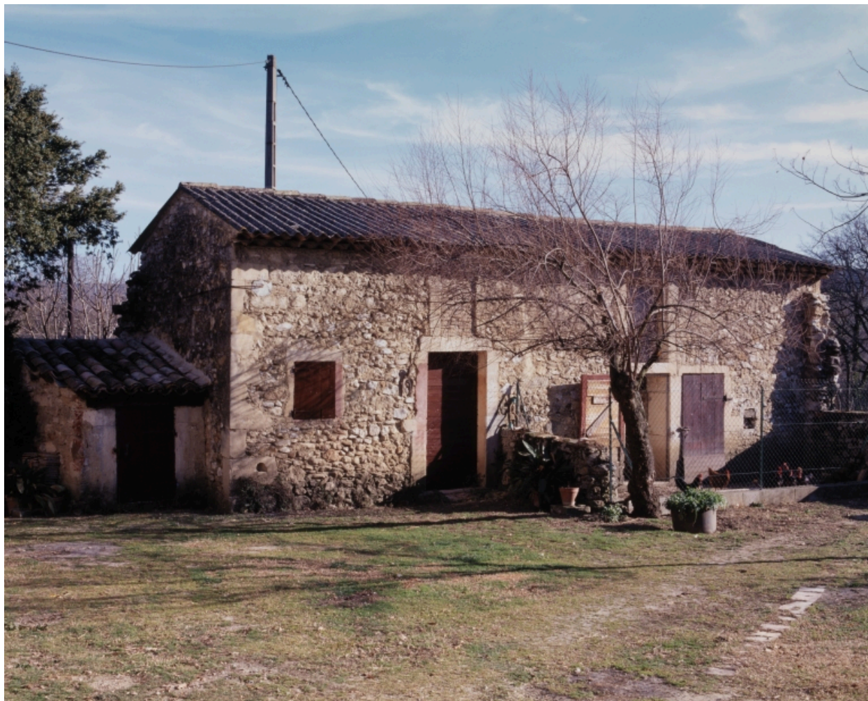
Les Echaravelles. Dépendance agricole : étables et porcherie.