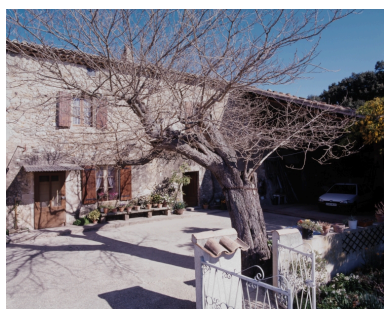
La Tuilière. Vue partielle sur cour : logis et hangar.