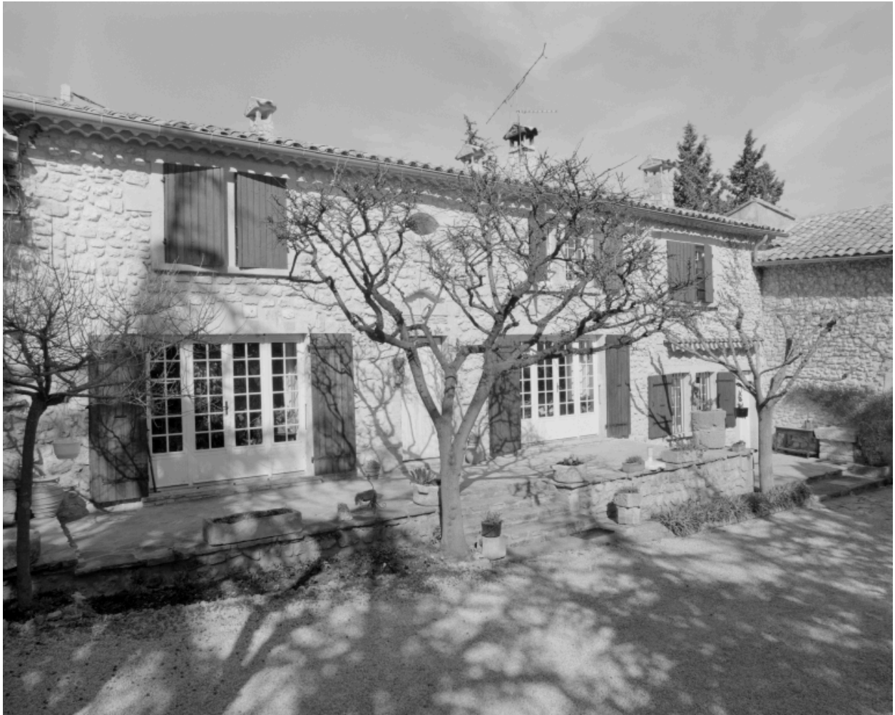
La Mège. Elevation principale du logis.