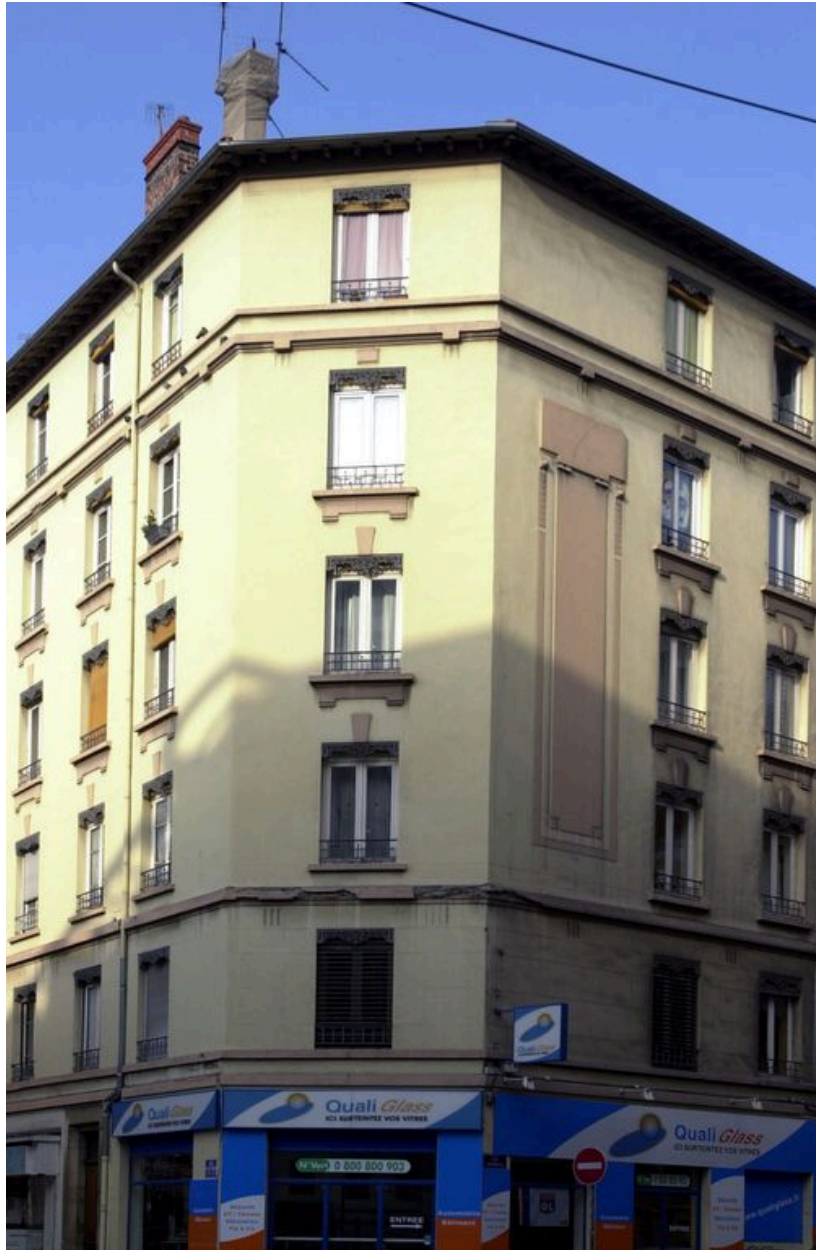
Détail de la travée d'angle