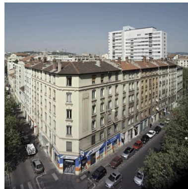
Vue d'ensemble depuis le sud-est IVR82_20076902423NUCA