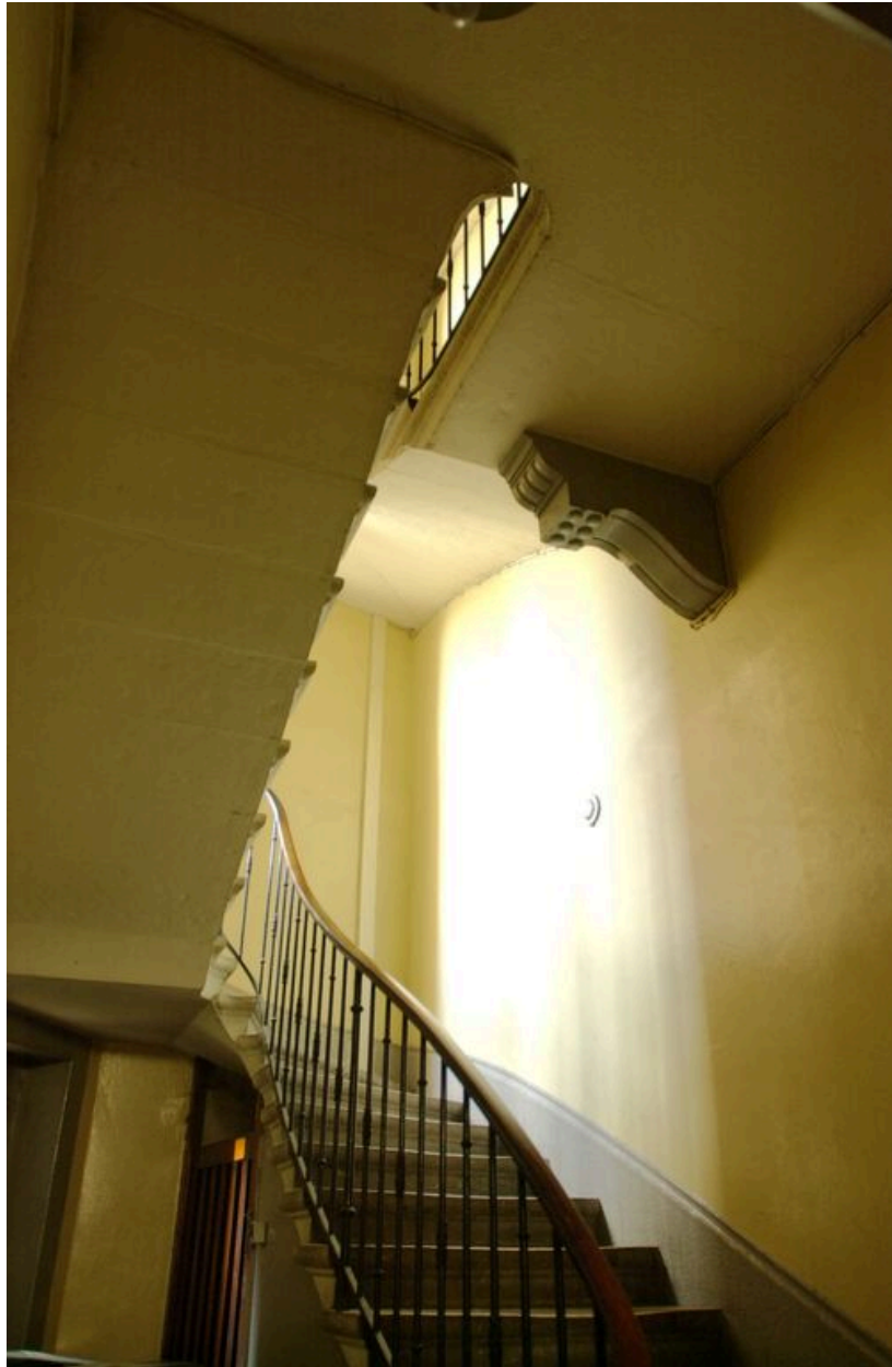
Vue de la cage d'escalier et du palier soutenu par une console