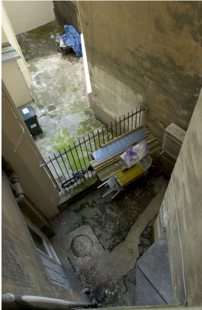
Vue des cours du 7 et du 5 rue de l'Abbé-Boisard depuis l'est