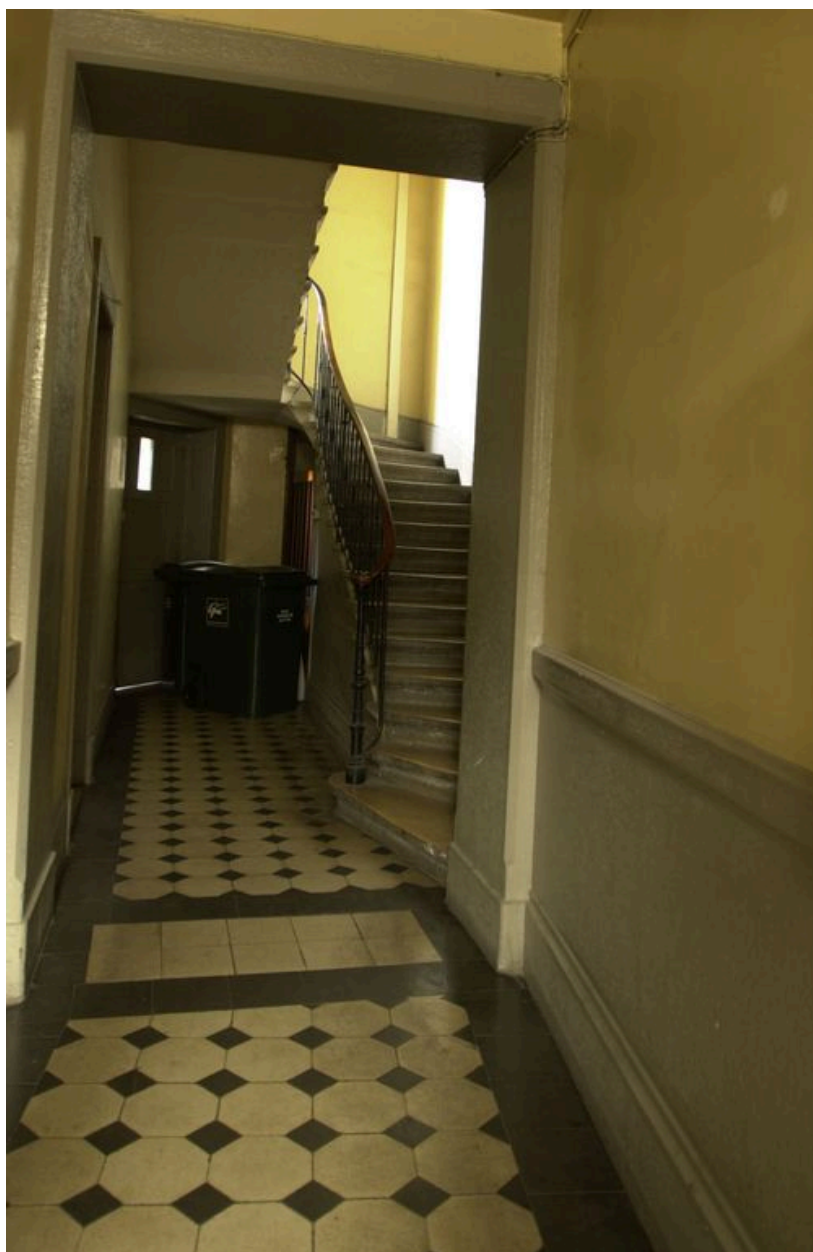
Vue du couloir d'entrée vers la cage d'escalier