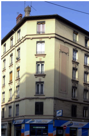
Détail de la travée d'angle IVR82_20086900632NUCA