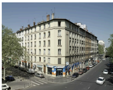
Vue depuis le sud-est IVR82_20076902425NUCA