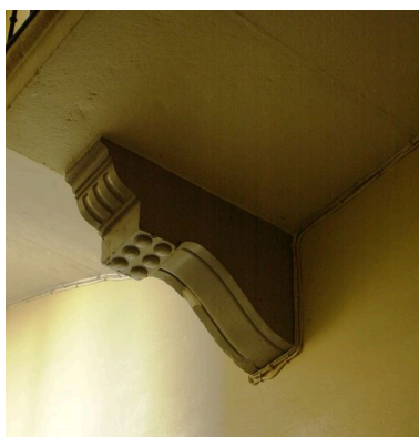
Détail d'une console moulurée soutenant le palier IVR82_20086900636NUCA