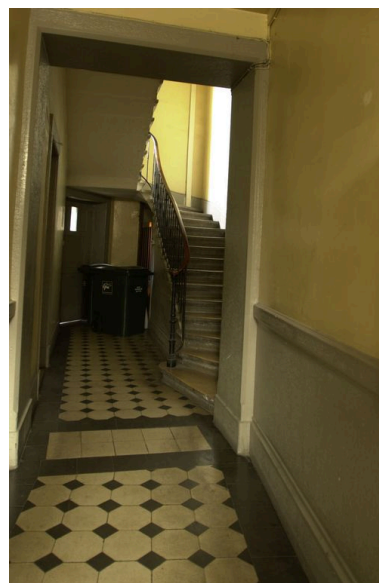
Vue du couloir d'entrée vers la cage d'escalier IVR82_20086900634NUCA