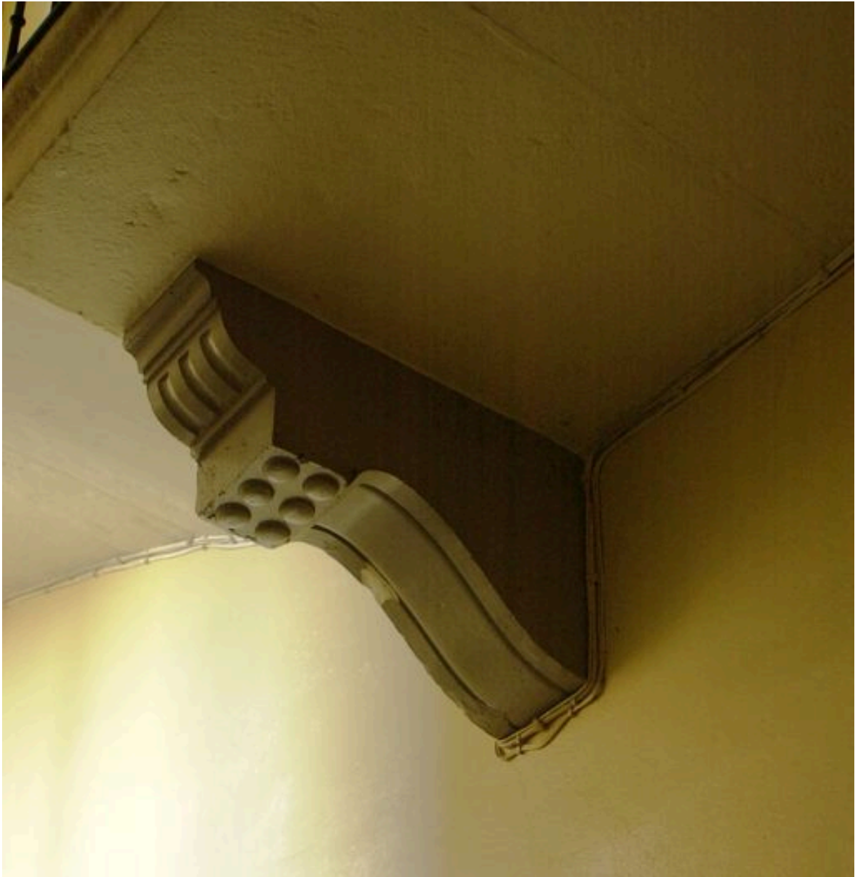
Détail d'une console moulurée soutenant le palier