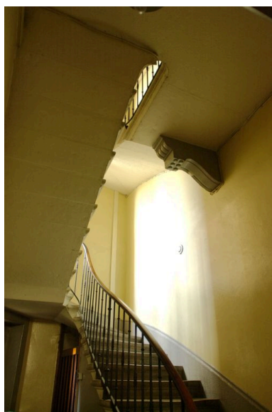
Vue de la cage d'escalier et du palier soutenu par une console IVR82_20086900635NUCA