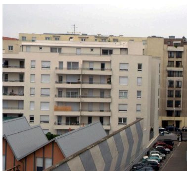
Élévation postérieure, vue partielle depuis l'est IVR82_20116904975NUCA