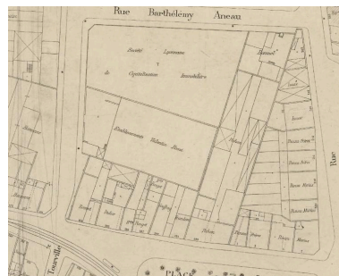
Plan de la ville de Lyon, détail : implantation de l'usine Valentin Rossi, 1935 (AC Lyon, 4 S 234) IVR84_20166901830NUCA