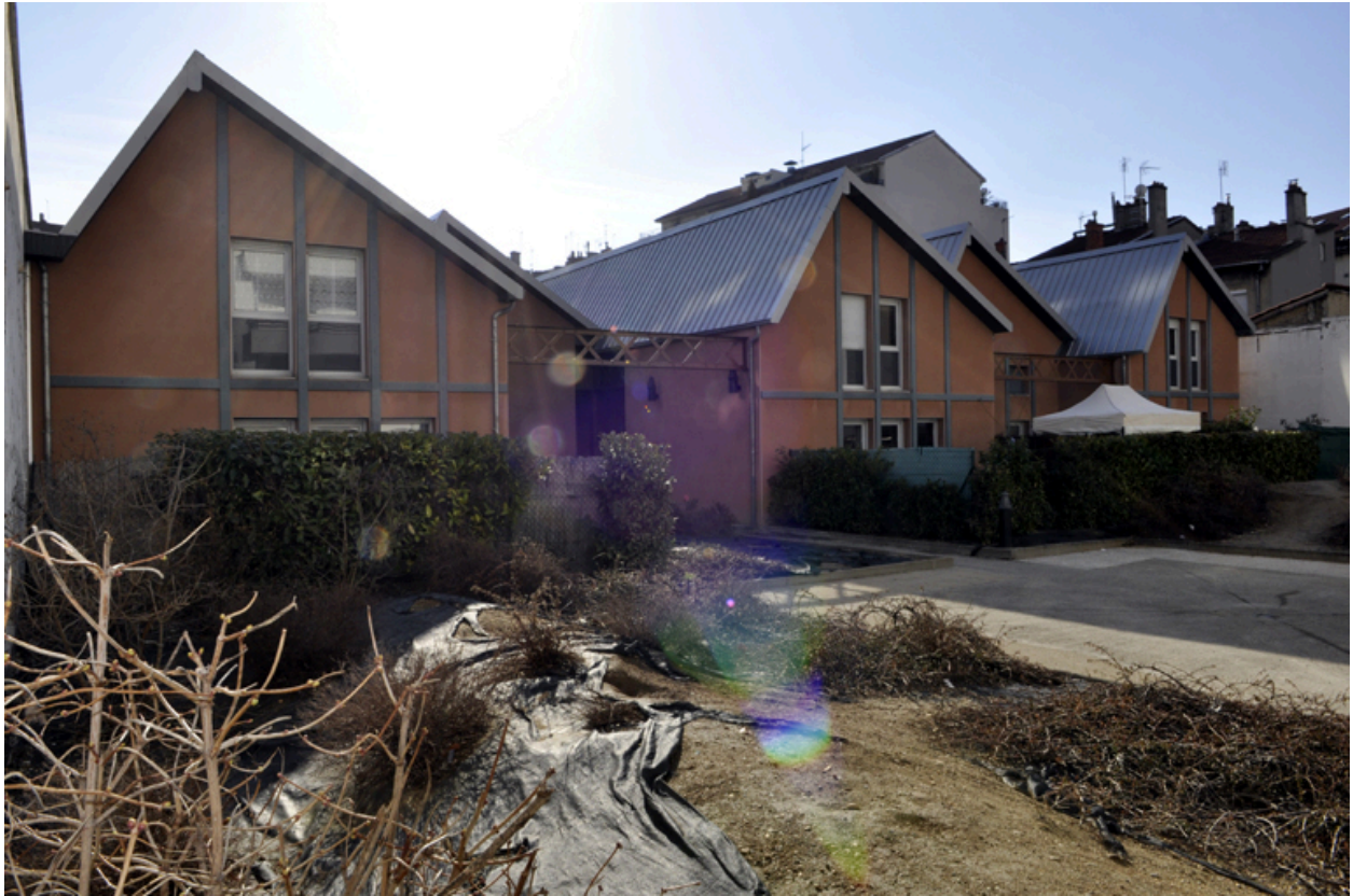
Vue d'ensemble rapprochée depuis l'entrée rue André Philip