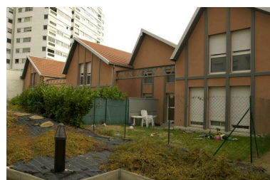
Vue depuis le sud-ouest IVR82_20086900661NUCA