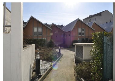
Vue d'ensemble depuis l'entrée rue André Philip