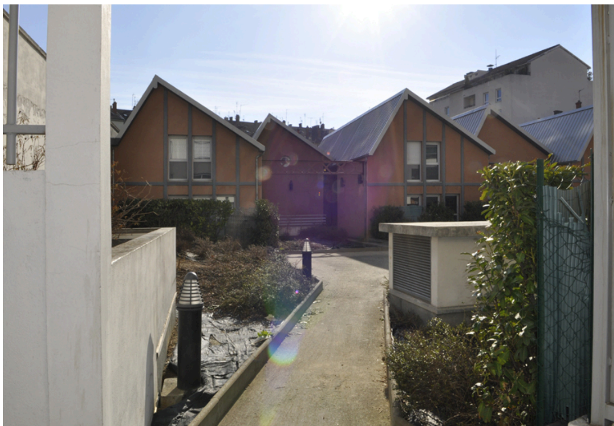
Vue d'ensemble depuis l'entrée rue André Philip