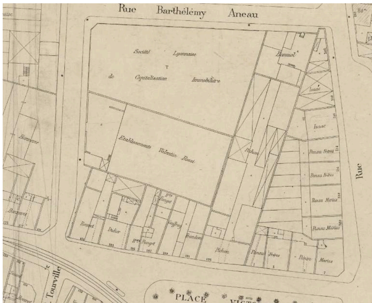
Plan de la ville de Lyon, détail : implantation de l'usine Valentin Rossi, 1935 (AC Lyon, 4 S 234)