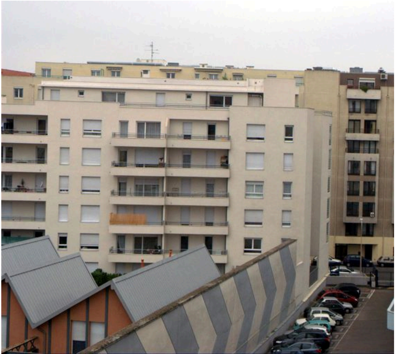
Elévation postérieure, vue partielle depuis l'est