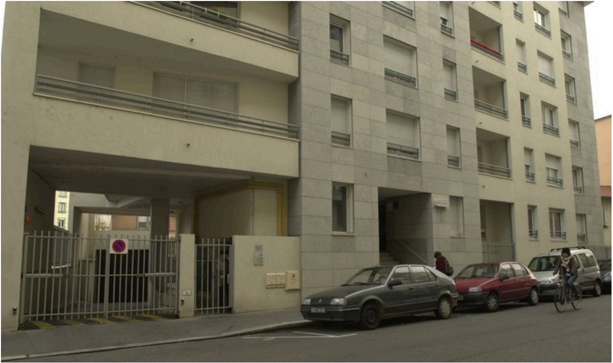
Entrée de l'immeuble rue André-Philip