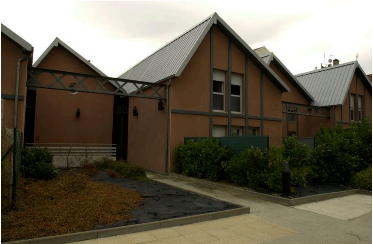
Vue depuis le nord-ouest