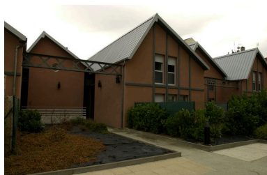
Vue depuis le nord-ouest IVR82_20086900662NUCA