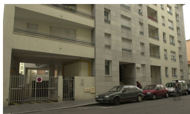
Entrée de l'immeuble rue André-Philip IVR82_20086900665NUCA