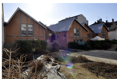
Vue d'ensemble rapprochée depuis l'entrée rue André Philip IVR82_20126902404NUCA