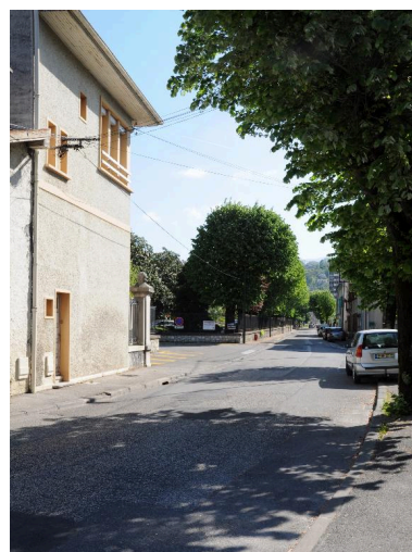
Vue du boulevard, à hauteur de l'hôpital