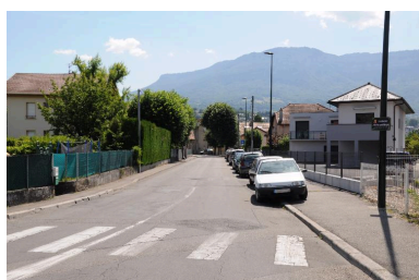
Vue du boulevard, à hauteur de la voie ferrée IVR82_20147301112NUCA