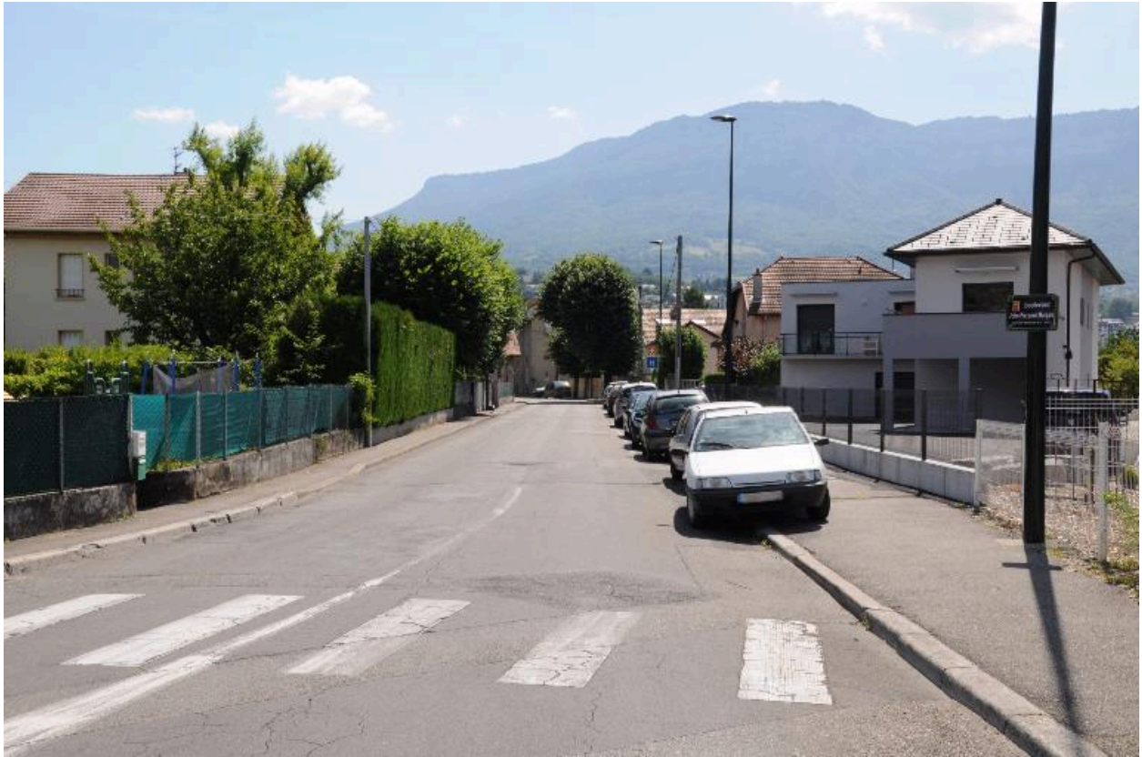
Vue du boulevard, à hauteur de la voie ferrée