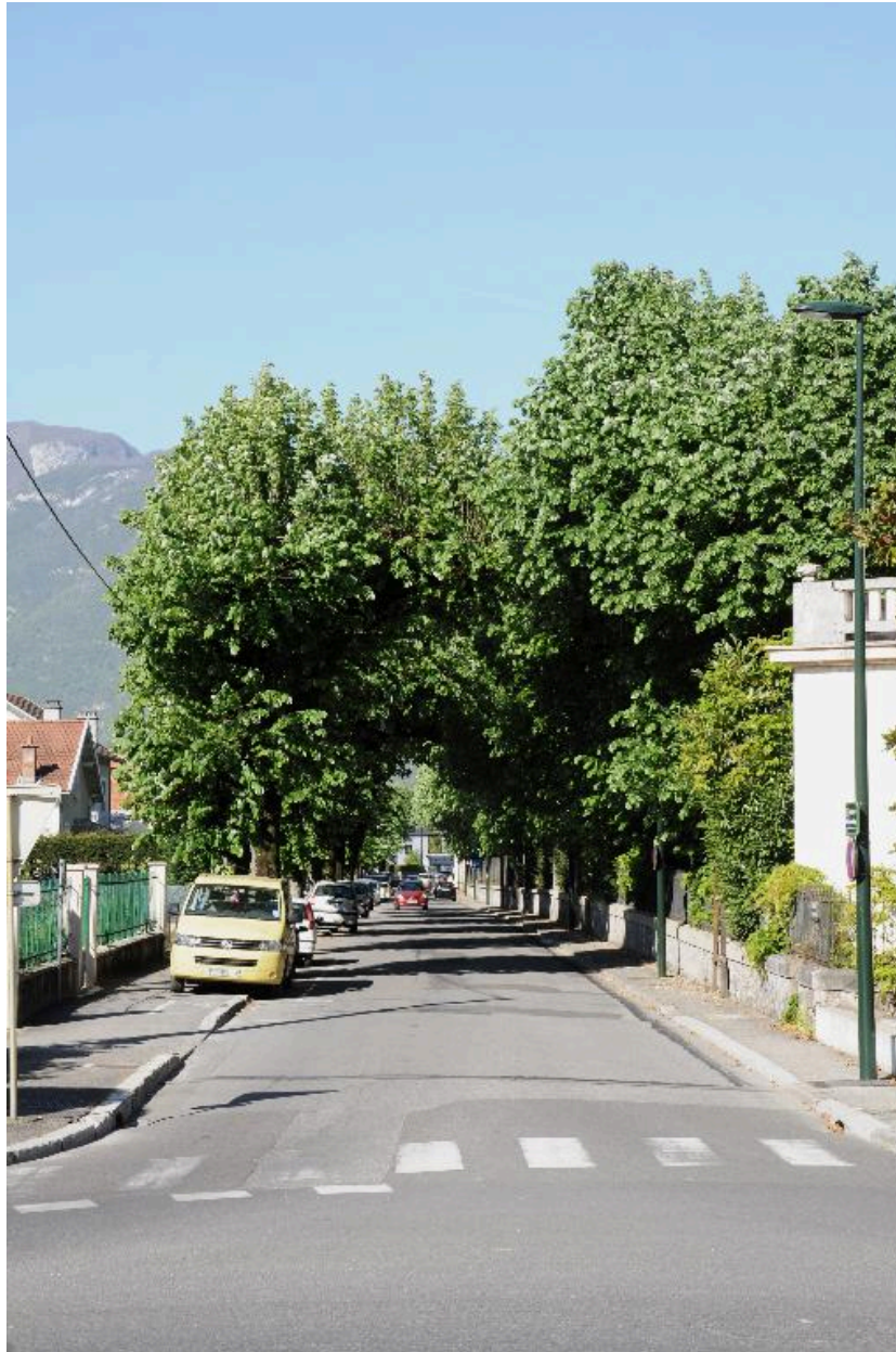
Vue vers l'est depuis le rond-point des hôpitaux