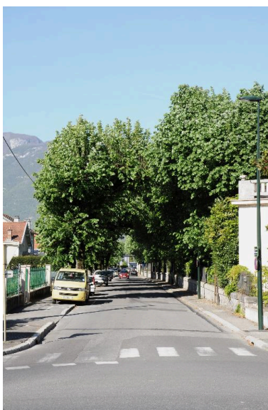
Vue vers l'est depuis le rond-point des hôpitaux IVR82_20147300333NUCA