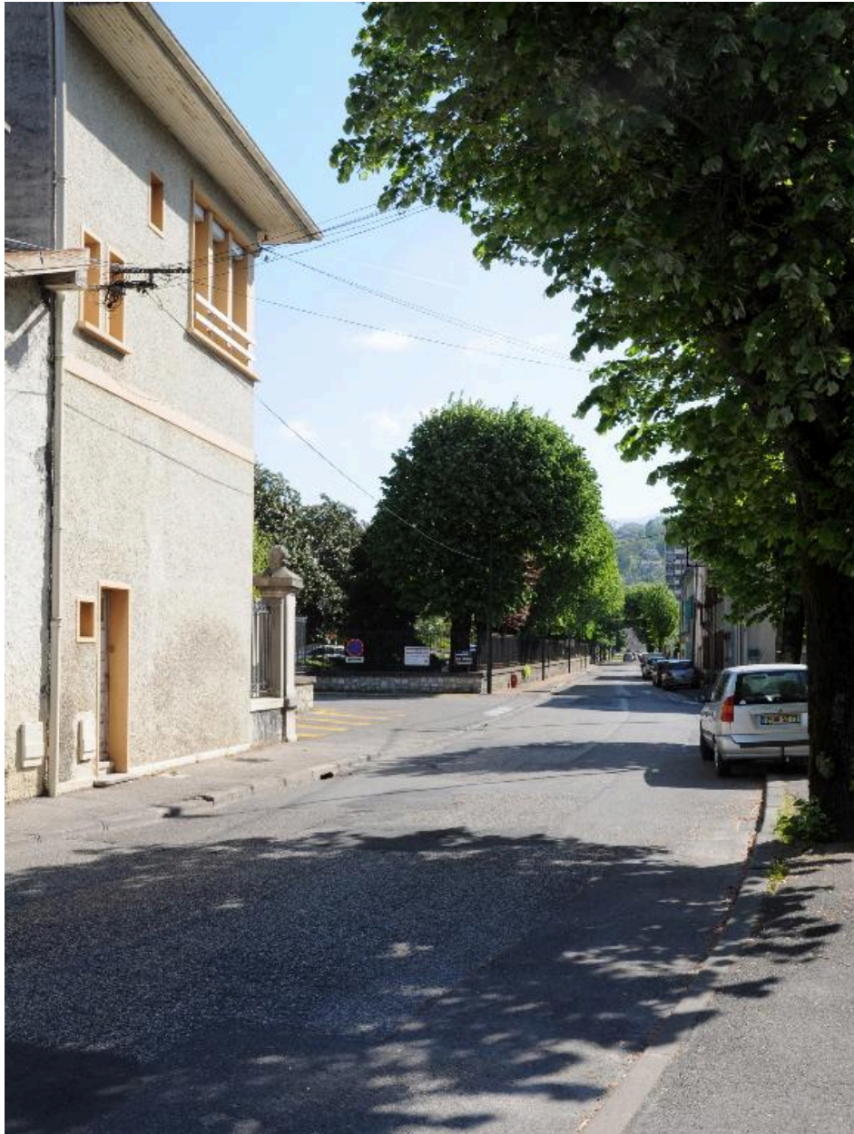
Vue du boulevard, à hauteur de l'hôpital