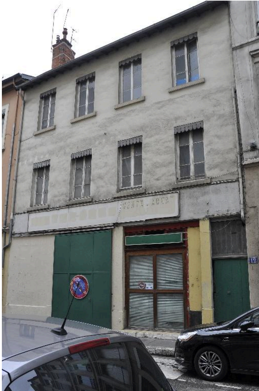
Vue générale de l'élévation sur rue