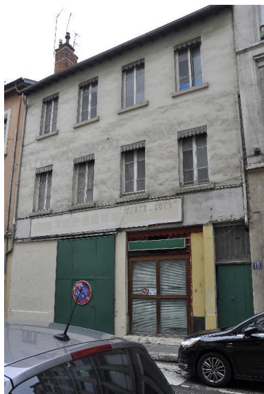
Vue générale de l'élévation sur rue