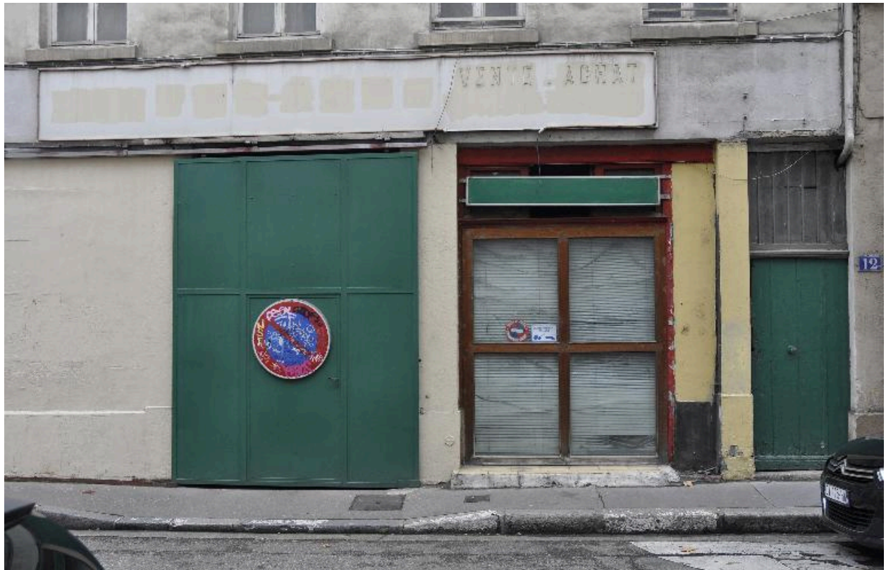
Vue rapprochée du rez-de-chaussée