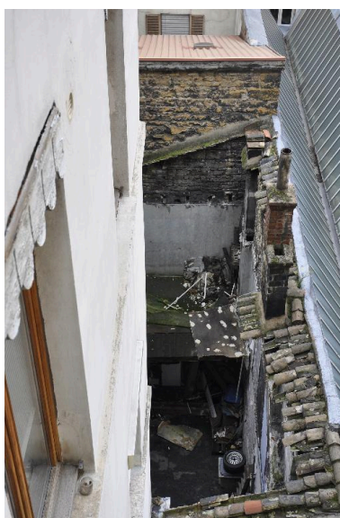
Vue des bâtiments ruinés dans la cour IVR82_20146902933NUCA