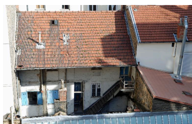
Vue générale de l'élévation sur cour IVR82_20146902934NUCA