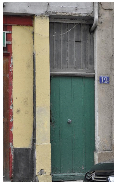
Vue rapprochée de la porte IVR82_20146902931NUCA