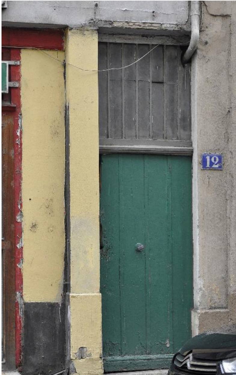
Vue rapprochée de la porte