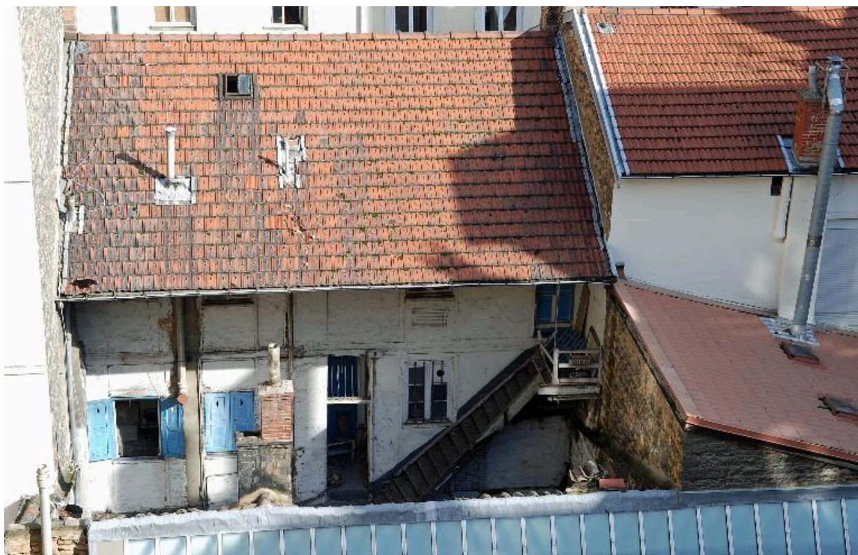
Vue générale de l'élévation sur cour