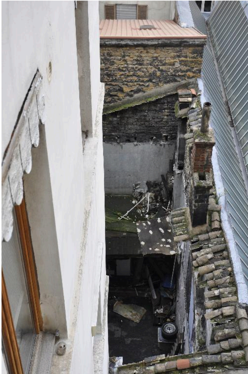
Vue des bâtiments ruinés dans la cour