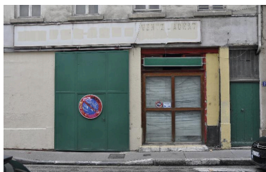
Vue rapprochée du rez-de-chaussée IVR82_20146902932NUCA