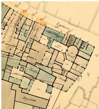
Plan des immeubles du lotissement dont trois sont reconstruits, extrait du projet de prolongement de la rue d'Oran depuis la rue Constantine jusqu'à la rue de la Platière, 18 janvier 1857 IVR82_20056902012NUCA