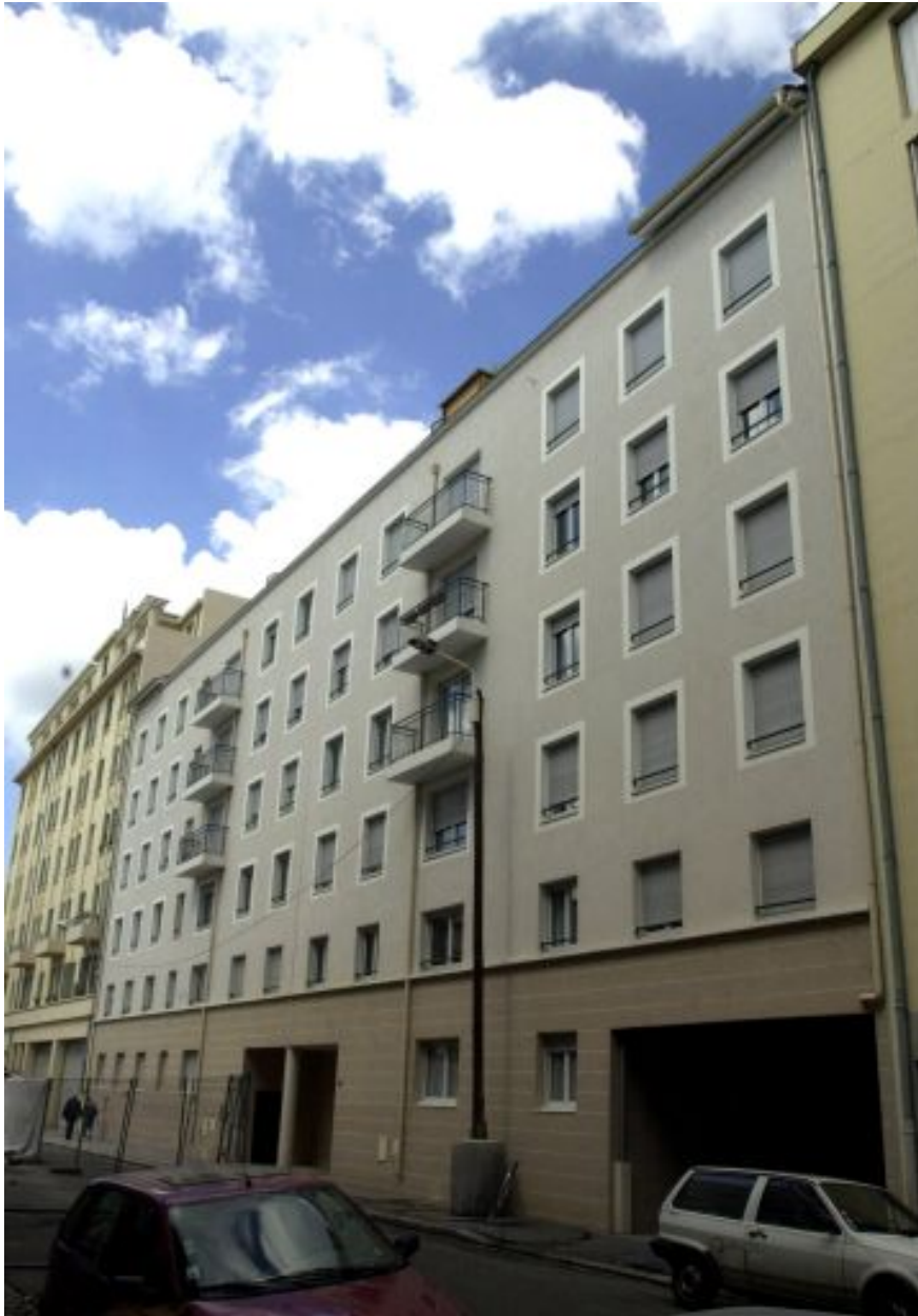
Elévation principale, rue Smith