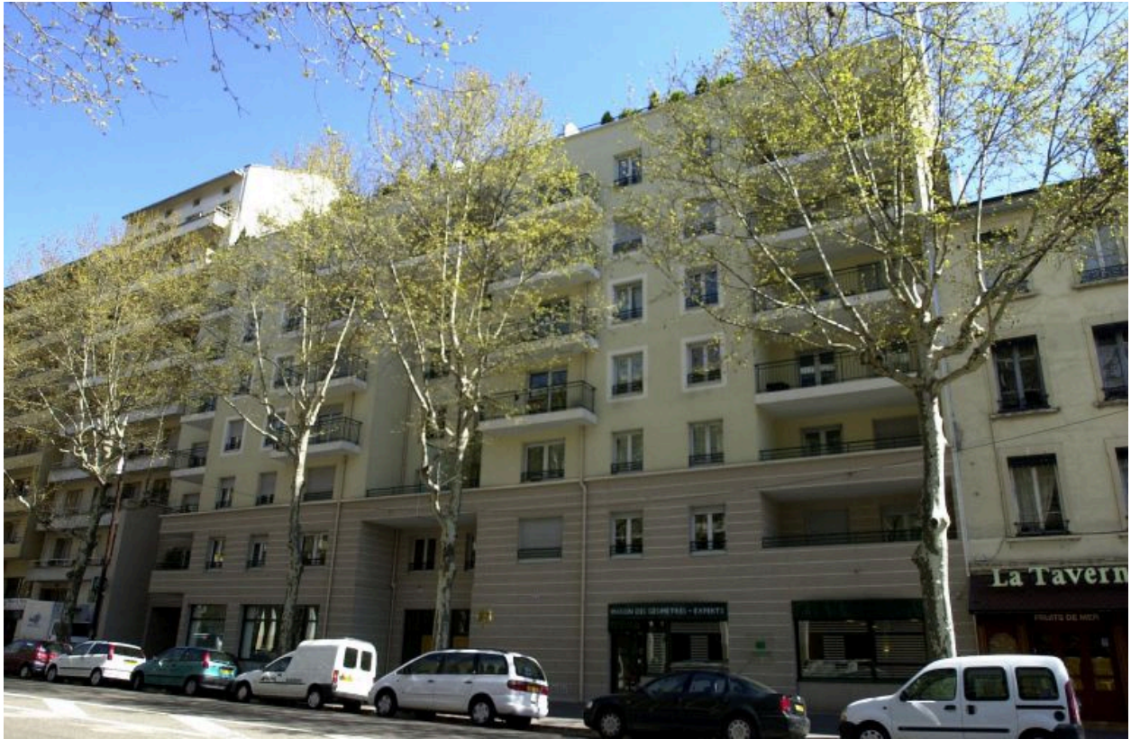
Elévation principale, cours Charlemagne