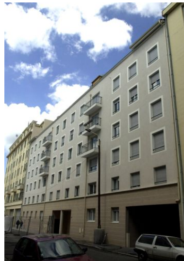
Elévation principale, rue Smith