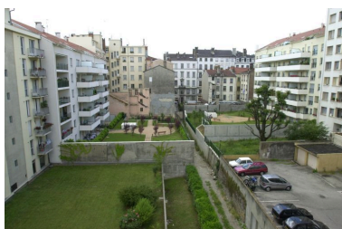
Elévation postérieure et jardin de l'immeuble rue Smith