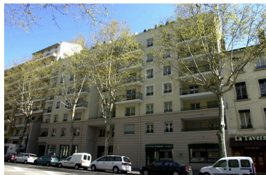
Elévation principale, cours Charlemagne IVR82_20036900370NUCA