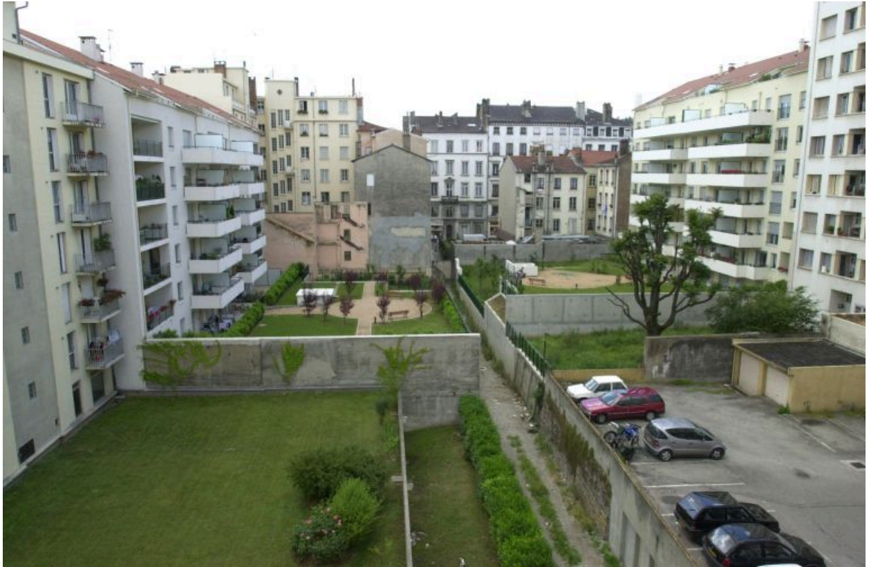
Elévation postérieure et jardin de l'immeuble rue Smith