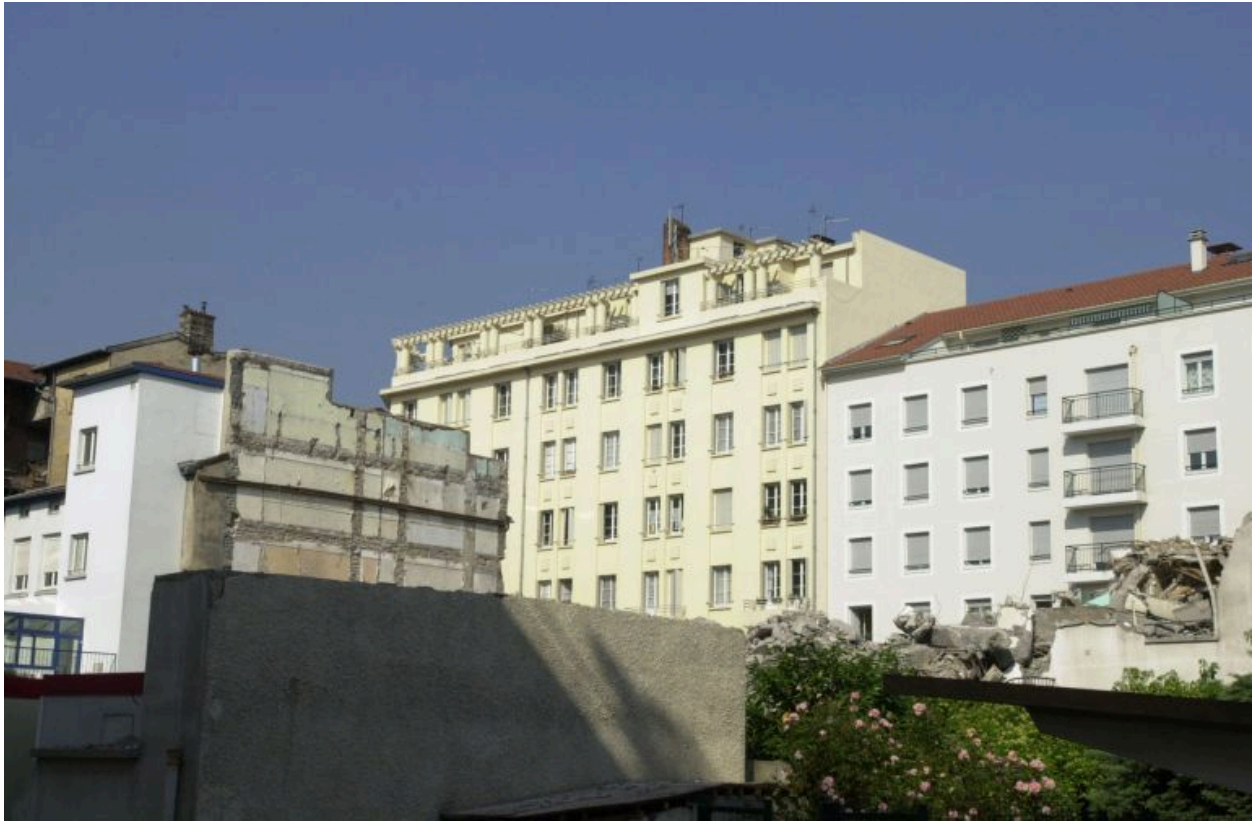
Elévation rue Smith depuis la rue Quivogne