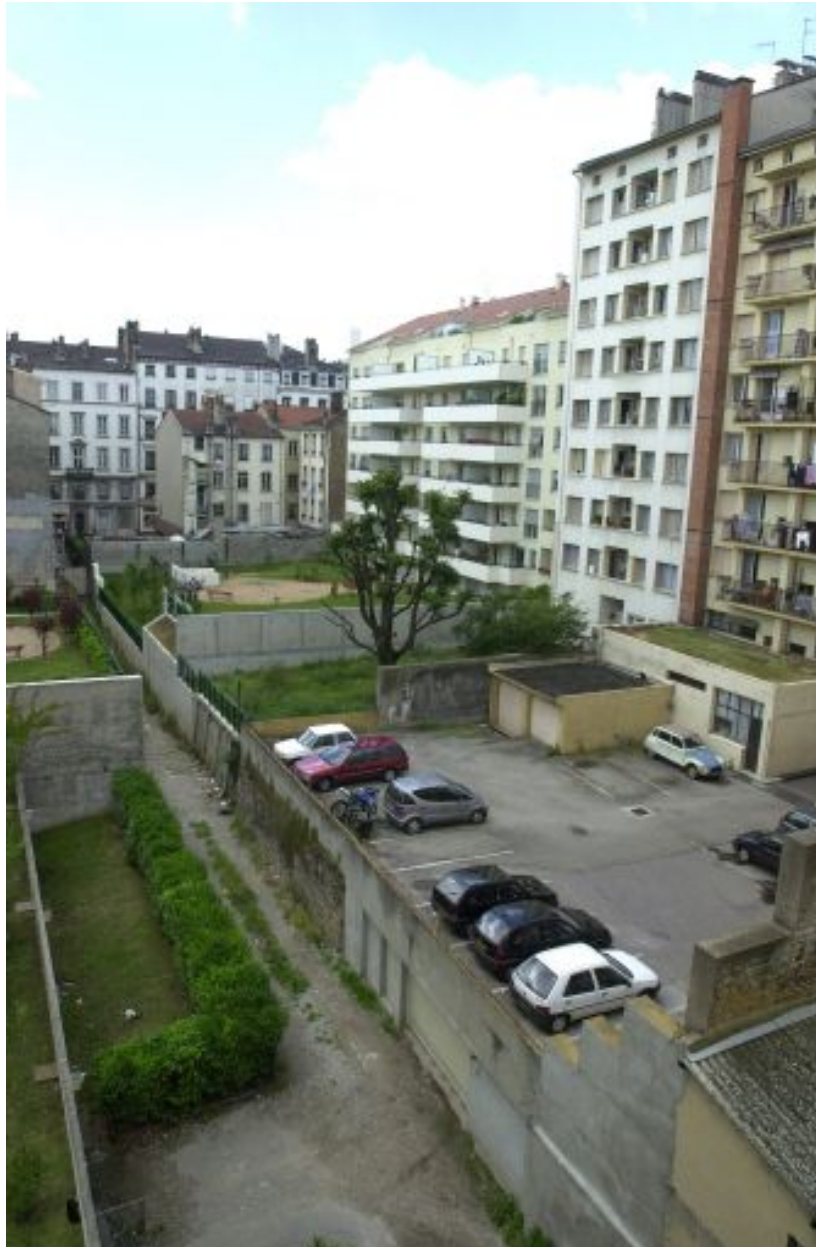
Elévation postérieure de l'immeuble cours Charlemagne