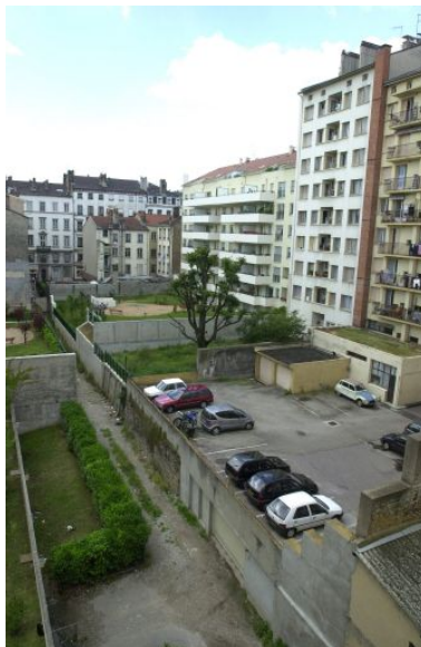
Elévation postérieure de l'immeuble cours Charlemagne IVR82_20016901981NUCA