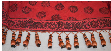
Vue générale du type de tissu n°1 à n°4 IVR84_20226303447NUC4A