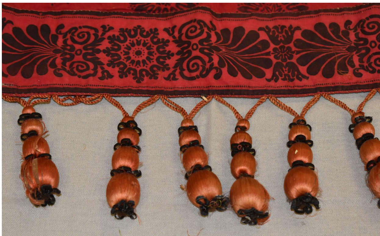
Vue générale du type de tissu n°1 à n°4 : détail des glands