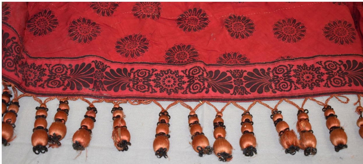
Vue générale du type de tissu n°1 à n°4