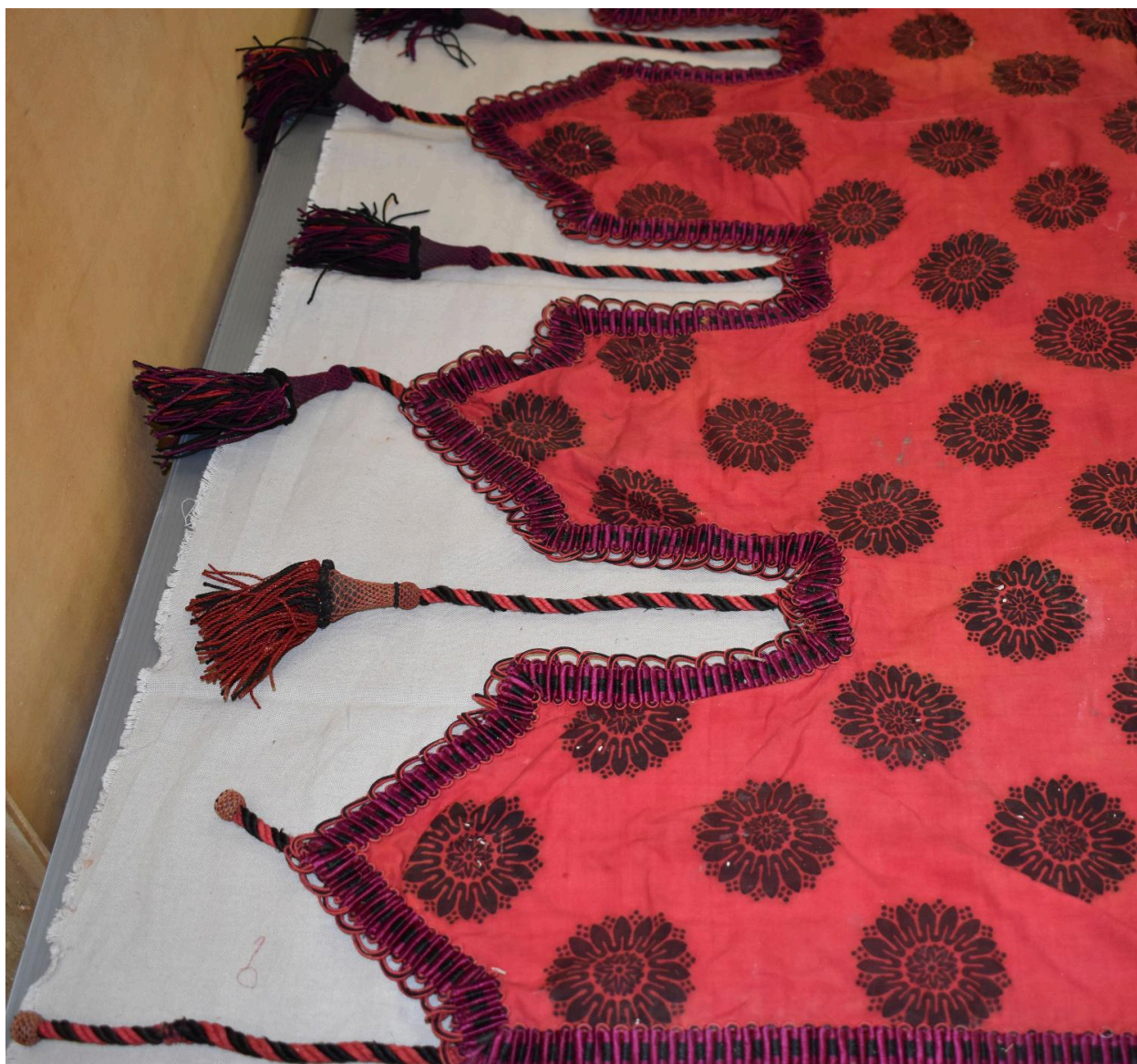
Vue générale du type de tissu n°6