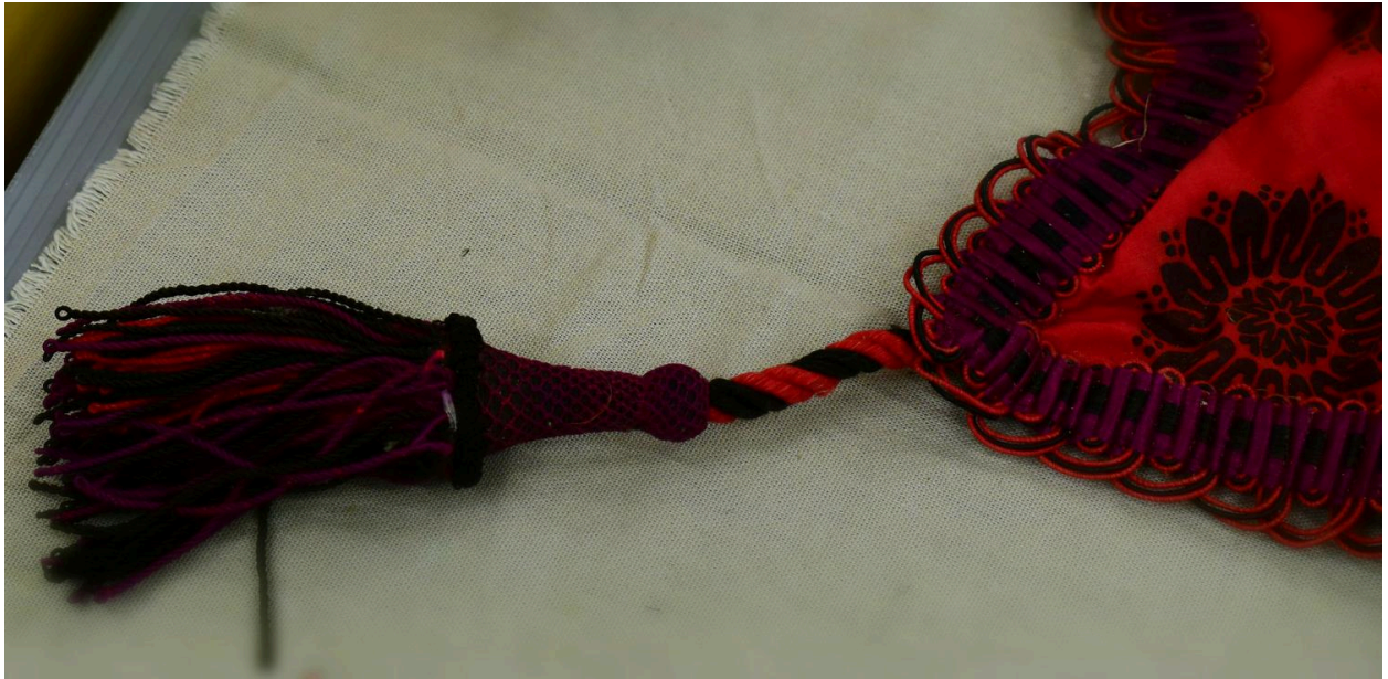
Vue générale du type de tissu n°6 : détail du gland