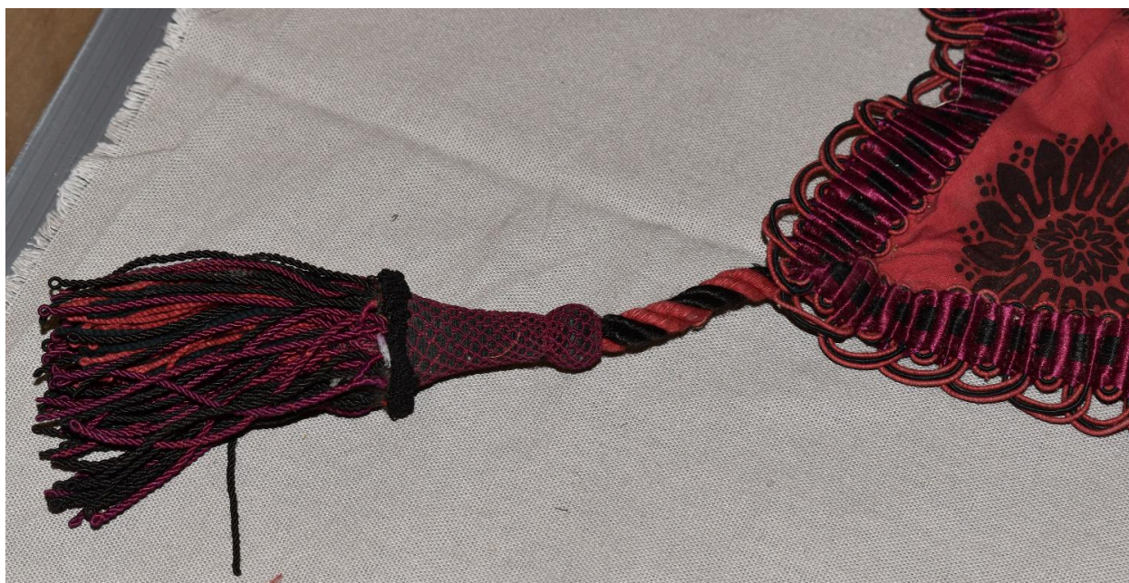
Vue générale du type de tissu n°6 : détail du gland