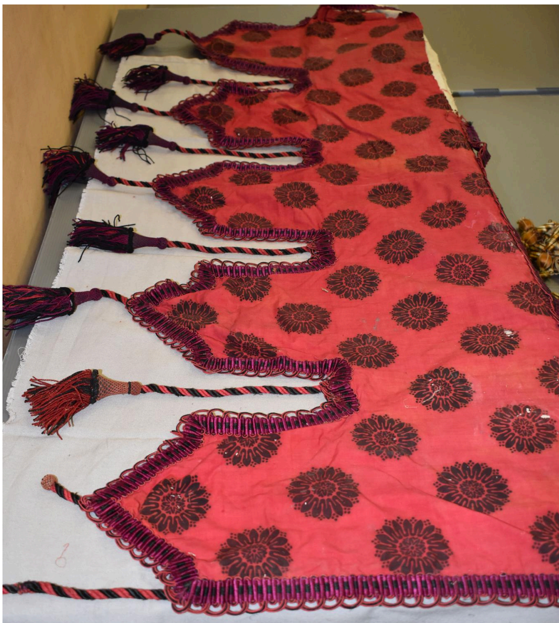
Vue générale du type de tissu n°6