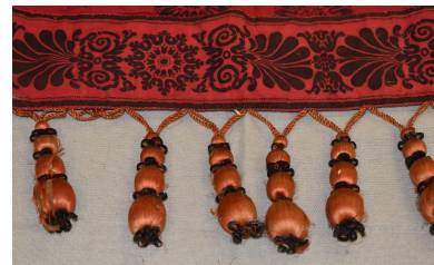
Vue générale du type de tissu n°1 à n°4 : détail des glands IVR84_20226303449NUC4A