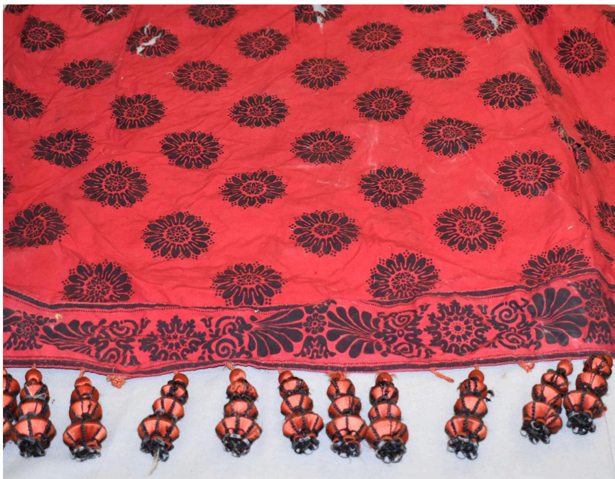
Vue générale du type de tissu n°5