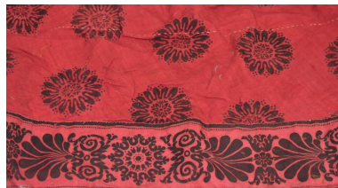
Vue générale du tissu n°1 à n°4 IVR84_20226303448NUC4A