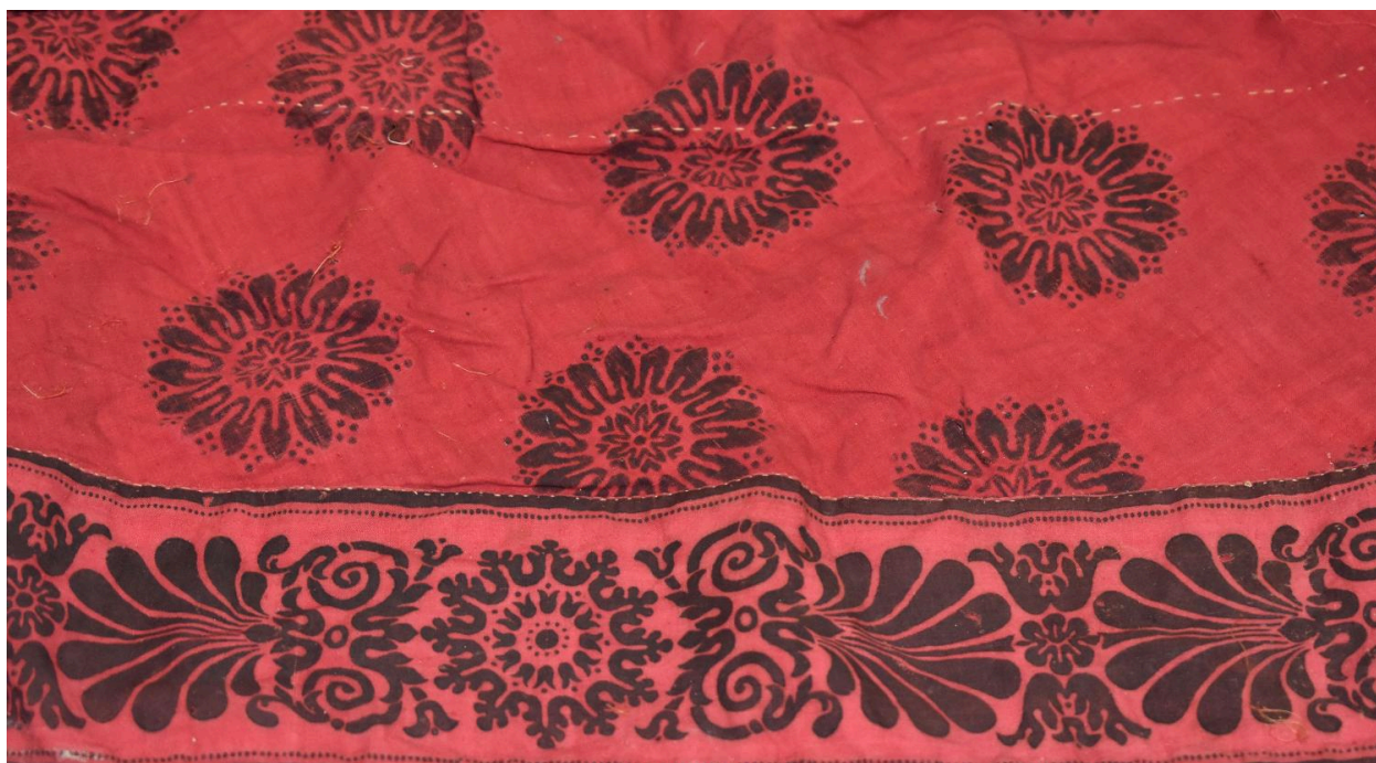
Vue générale du tissu n°1 à n°4