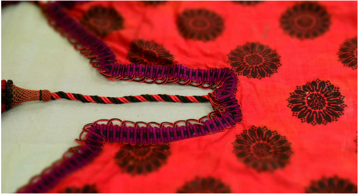
Vue générale du type de tissu n°6 : détail du galon