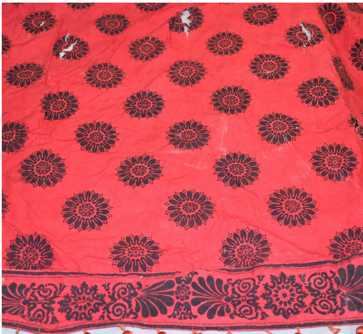
Vue générale du type de tissu n°5