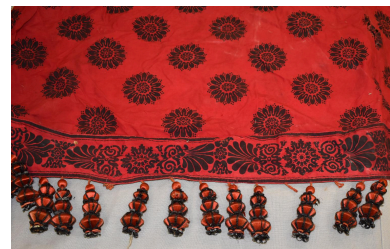
Vue générale du type de tissu n°5 : détail des glands coniques IVR84_20226303452NUC4A