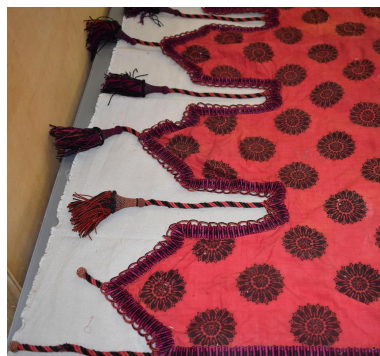
Vue générale du type de tissu n°6