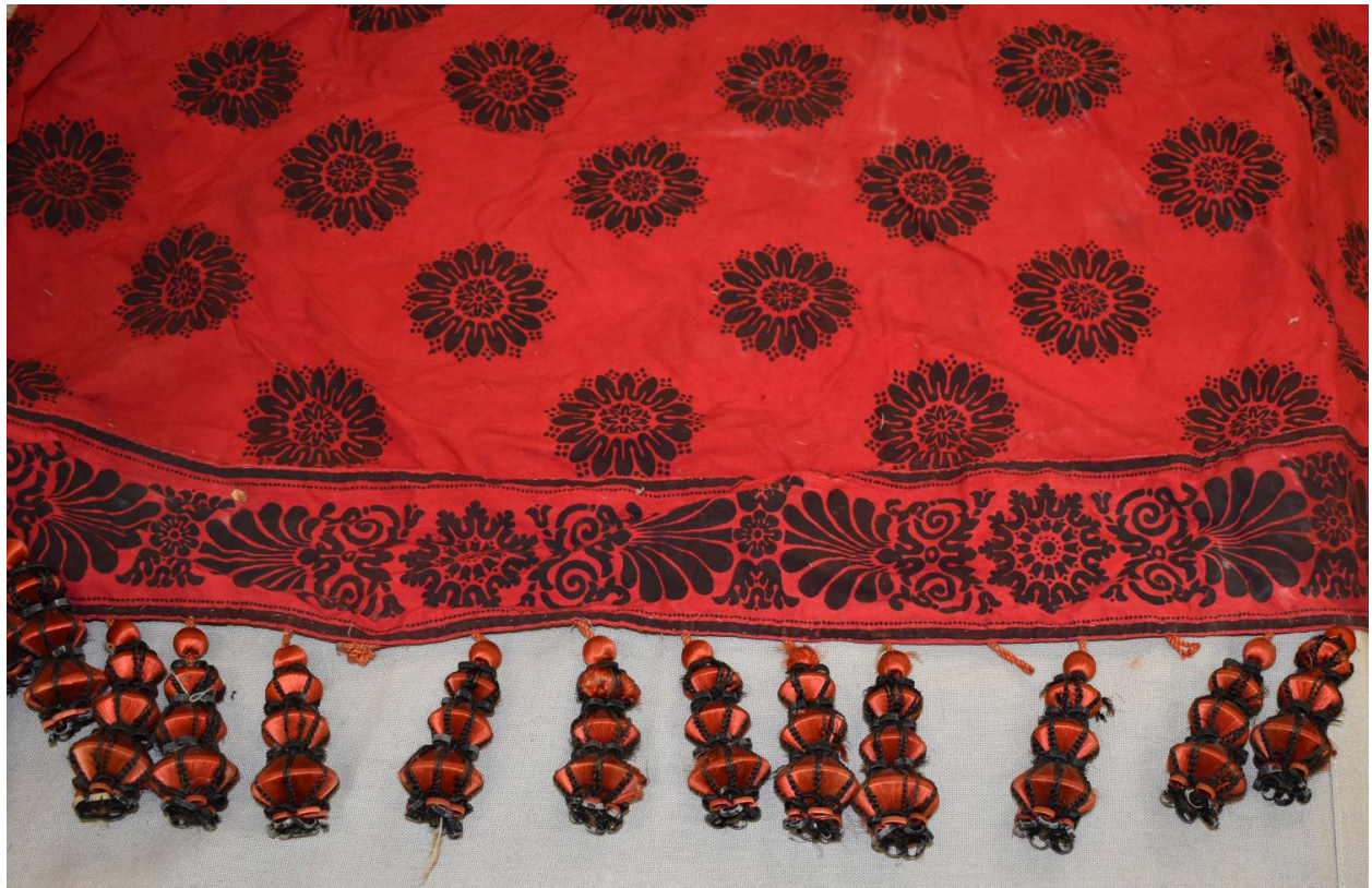
Vue générale du type de tissu n°5 : détail des glands coniques