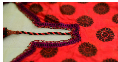
Vue générale du type de tissu n°6 : détail du galon IVR84_20226303455NUC4A