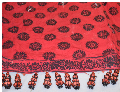
Vue générale du type de tissu n°5