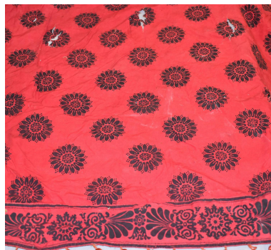
Vue générale du type de tissu n°5 IVR84_20226303451NUC4A