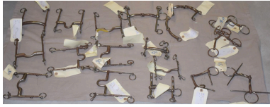
Vue générale IVR84_20226302540NUC4A