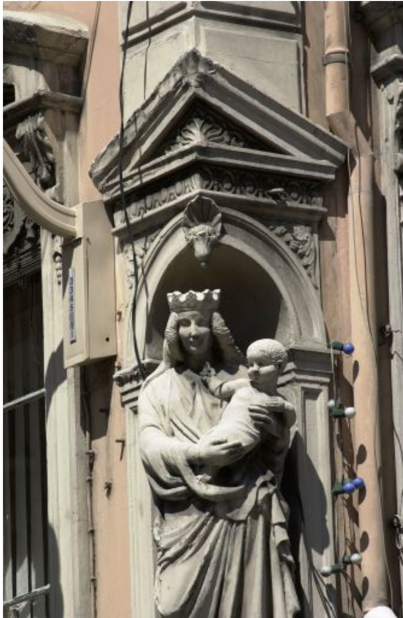
Détail de la niche à l'angle des 2 façades