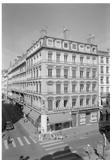
Vue générale IVR82_20056901735P