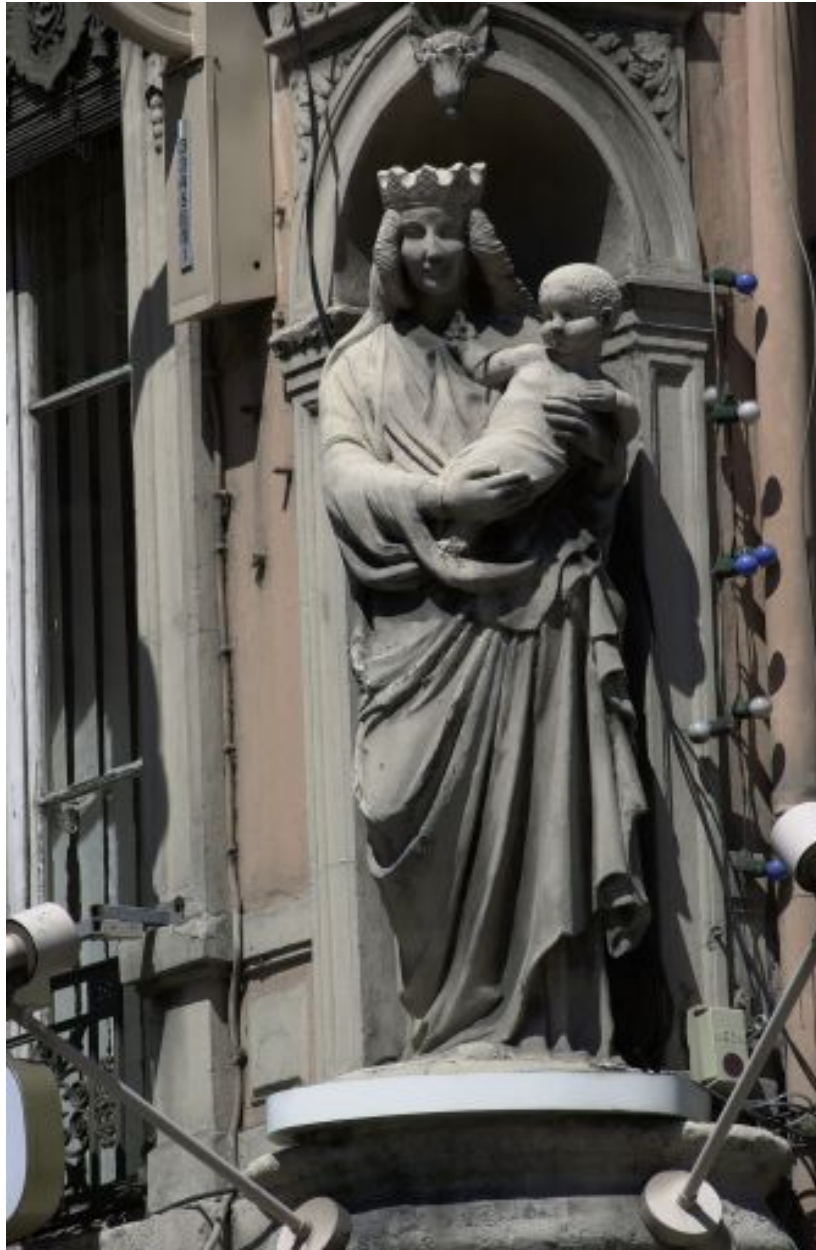
Statue à l'angle des 2 façades