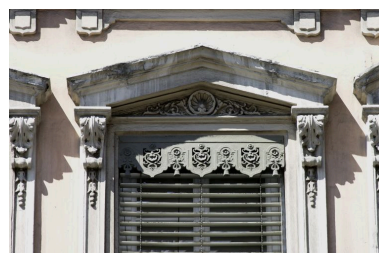
Façade principale, 3e niveau, 2e fenêtre, détail de la partie supérieure IVR82_20046900903NUCA