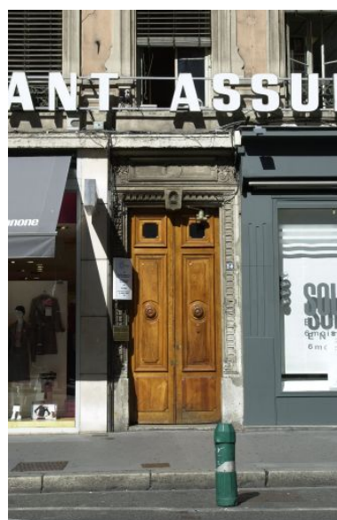
Façade principale, porte