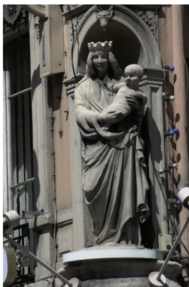
Statue à l'angle des 2 façades