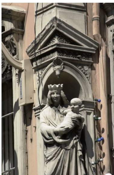
Détail de la niche à l'angle des 2 façades IVR82_20046900905NUCA