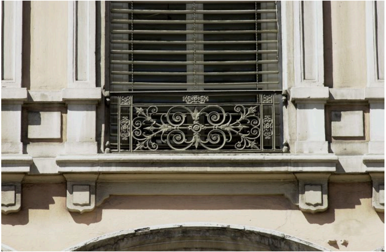
Façade principale, 3e niveau, 2e fenêtre, détail de la partie inférieure