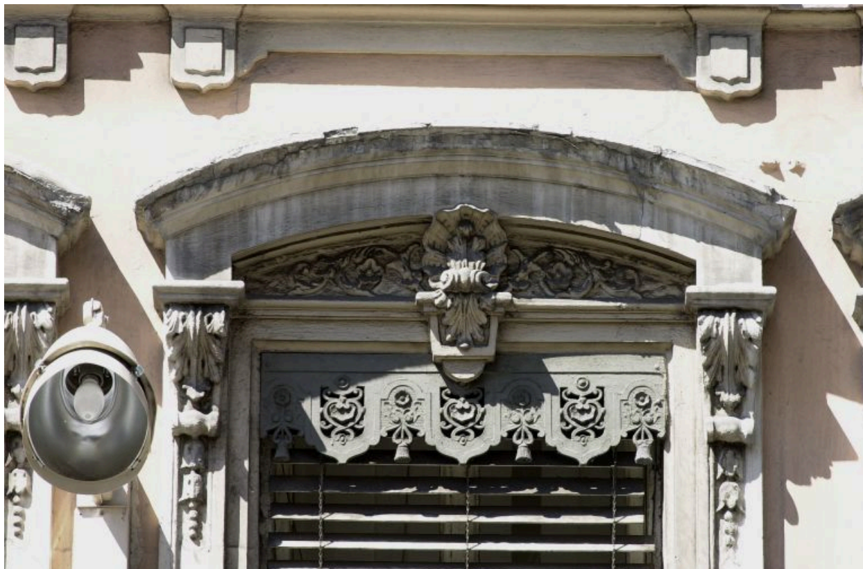
Façade principale, 2e niveau, détail du couronnement de la 2e fenêtre