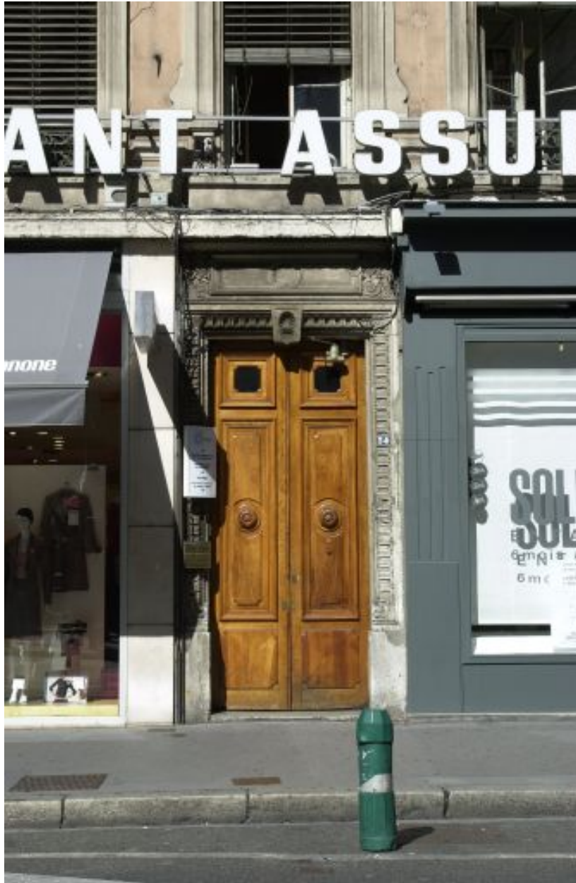
Façade principale, porte