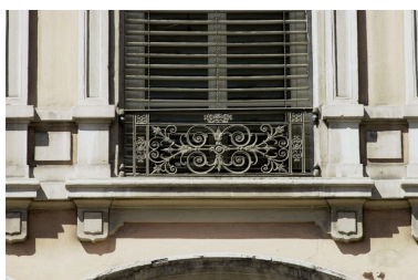
Façade principale, 3e niveau, 2e fenêtre, détail de la partie inférieure IVR82_20046900902NUCA