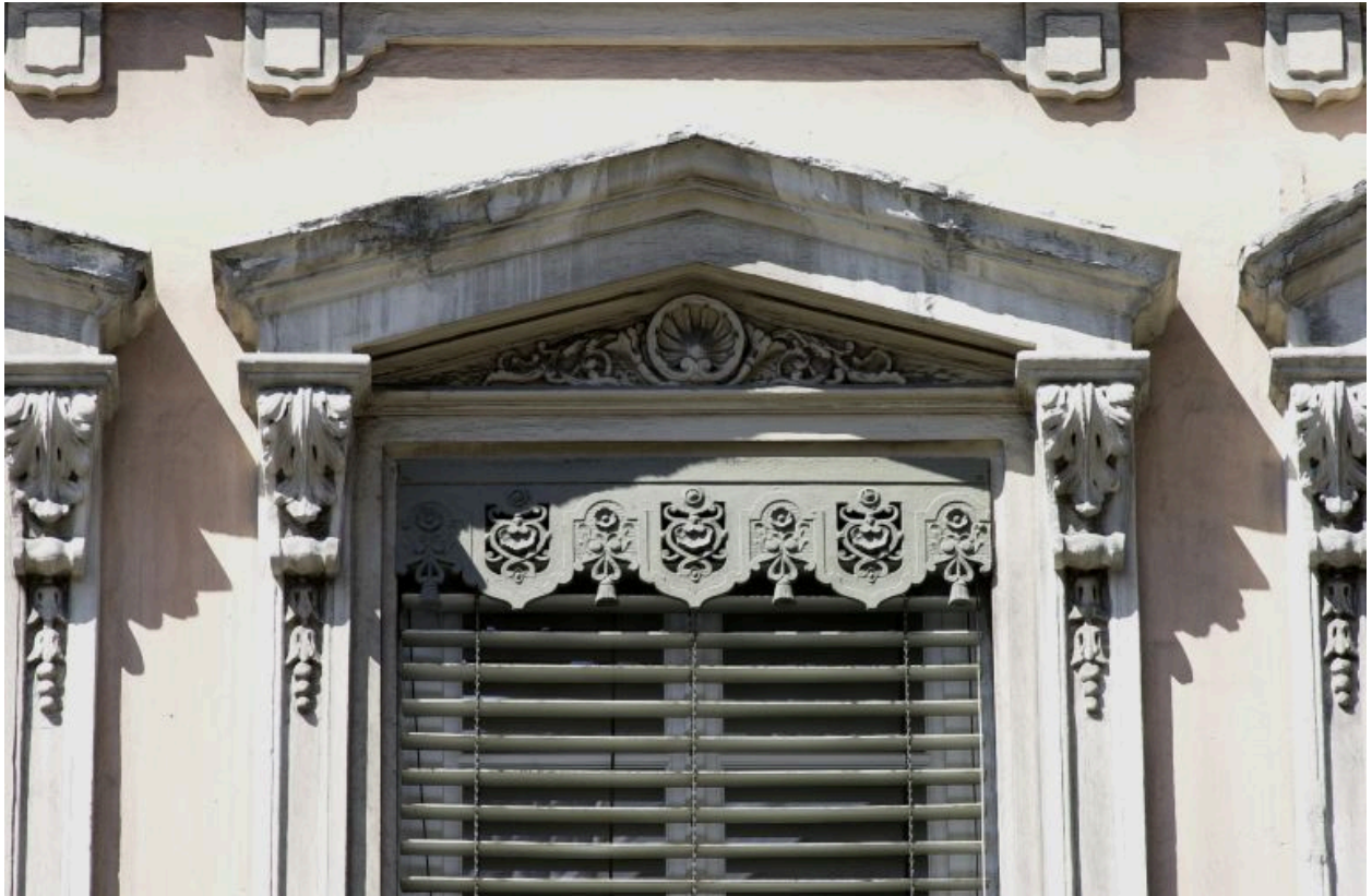
Façade principale, 3e niveau, 2e fenêtre, détail de la partie supérieure