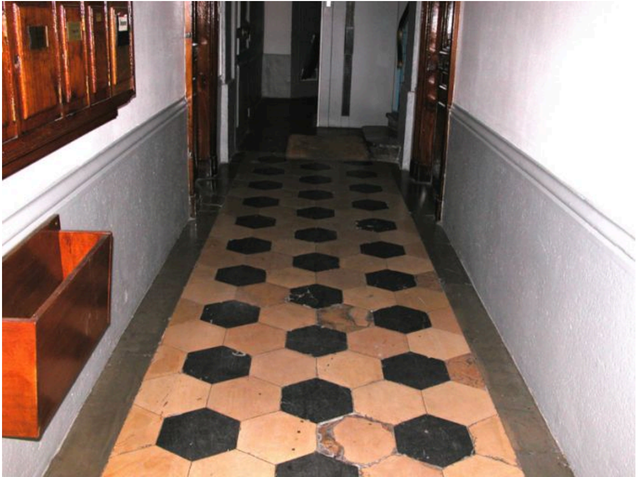
Sol de l'allée