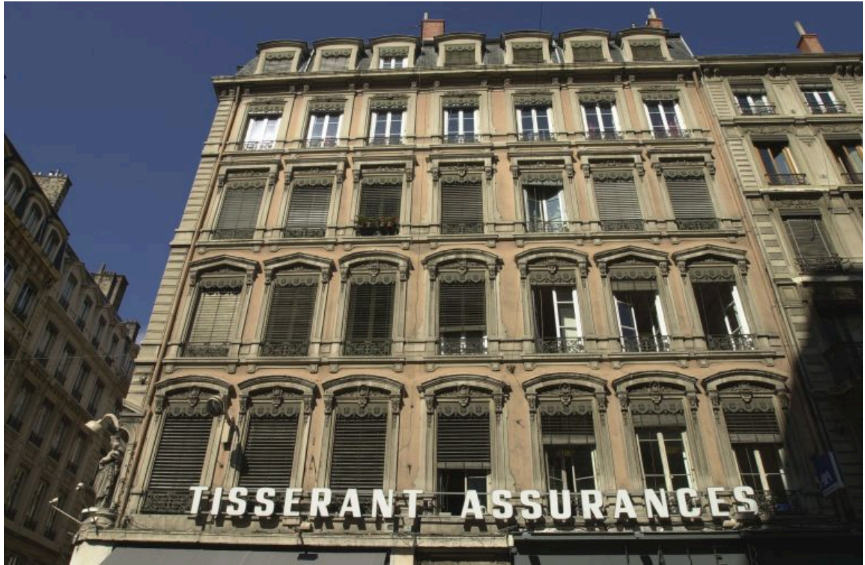
Façade principale rue du Président-Edouard-Herriot, vue générale par-dessous