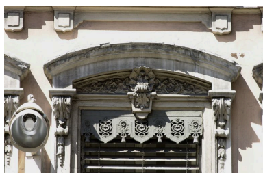
Façade principale, 2e niveau, détail du couronnement de la 2e fenêtre IVR82_20046900901NUCA