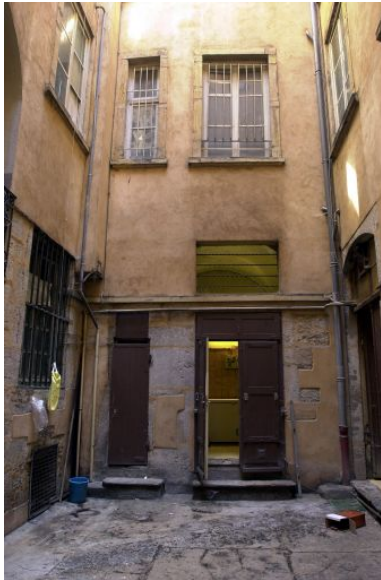
Aile gauche, partie inférieure de la façade sur cour IVR82_20036901331NUCA