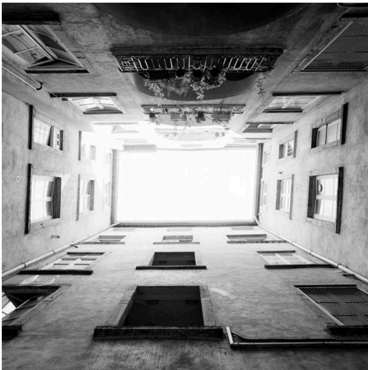
Cour, vue générale par-dessous