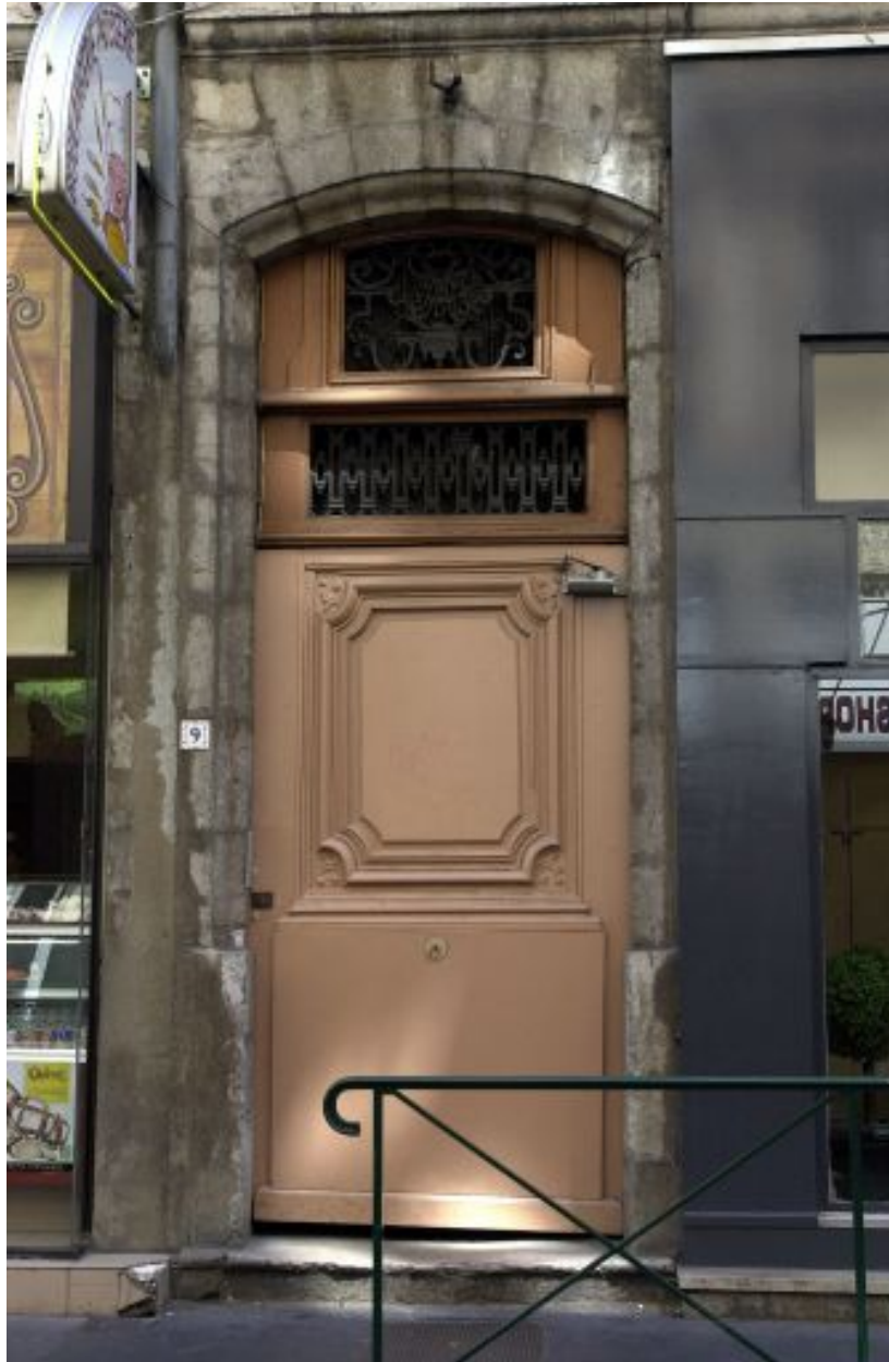
Façade sur rue, porte