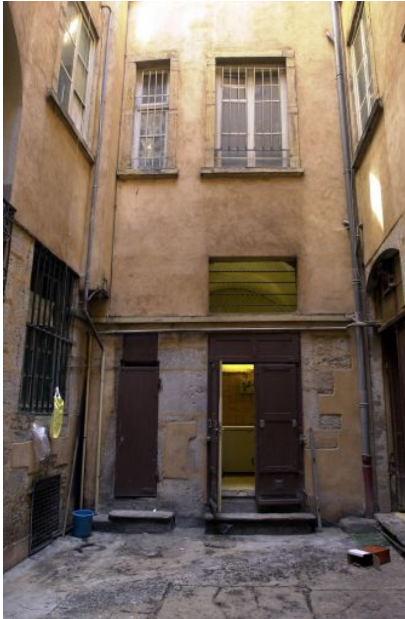
Aile gauche, partie inférieure de la façade sur cour