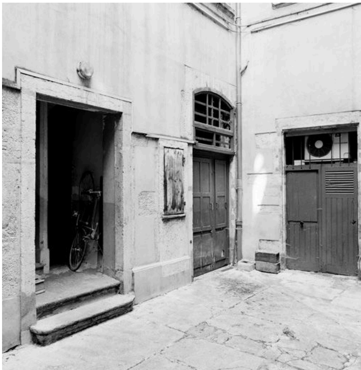
Angle du bâtiment en fond de cour (à gauche) avec l'aile droite. Entrée du 2e escalier et puits