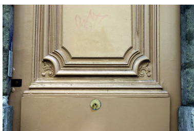
Façade sur rue, porte, détail du vantail IVR82_20036901327NUCA