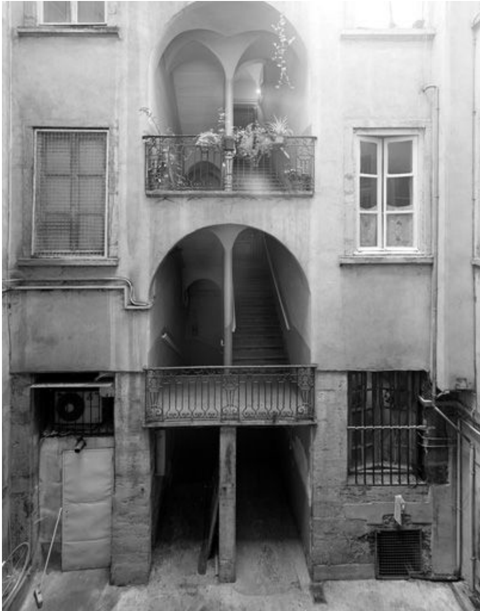
Cour, élévation du 1er bâtiment, détail des premiers niveaux