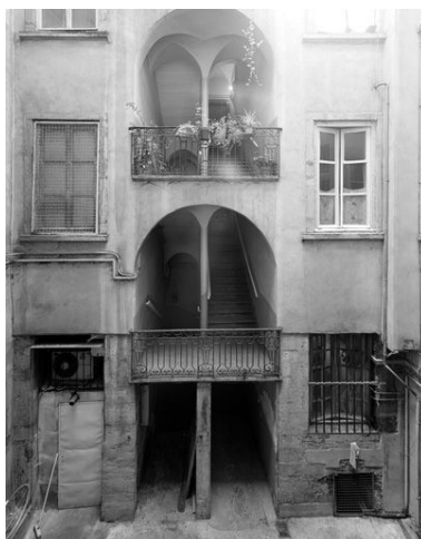
Cour, élévation du 1er bâtiment, détail des premiers niveaux IVR82_20056902532V