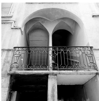
Cour, 1er bâtiment, garde- corps du 1er repos de l'escalier IVR82_20056902501X