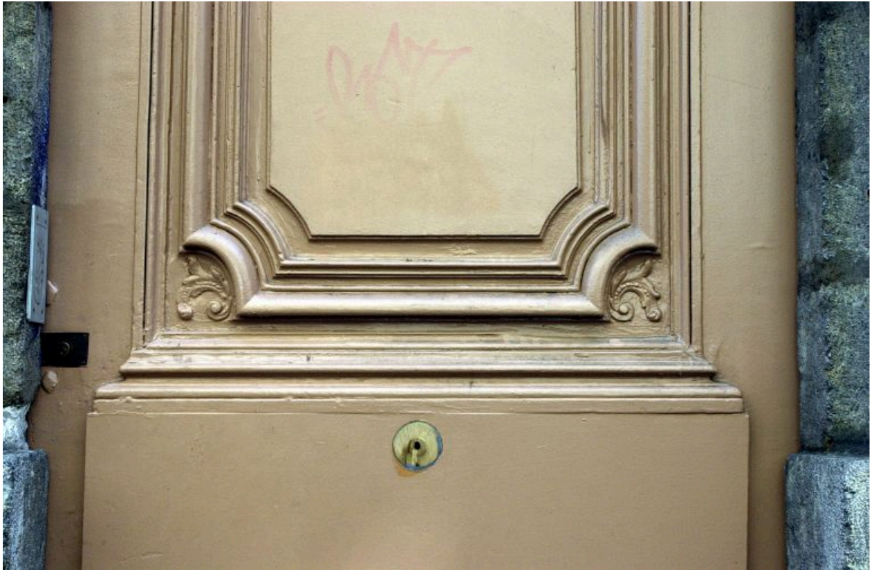
Façade sur rue, porte, détail du vantaill