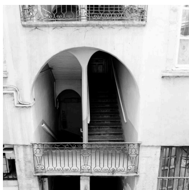
Cour, 1er bâtiment, rez- de-chaussée de l'escalier