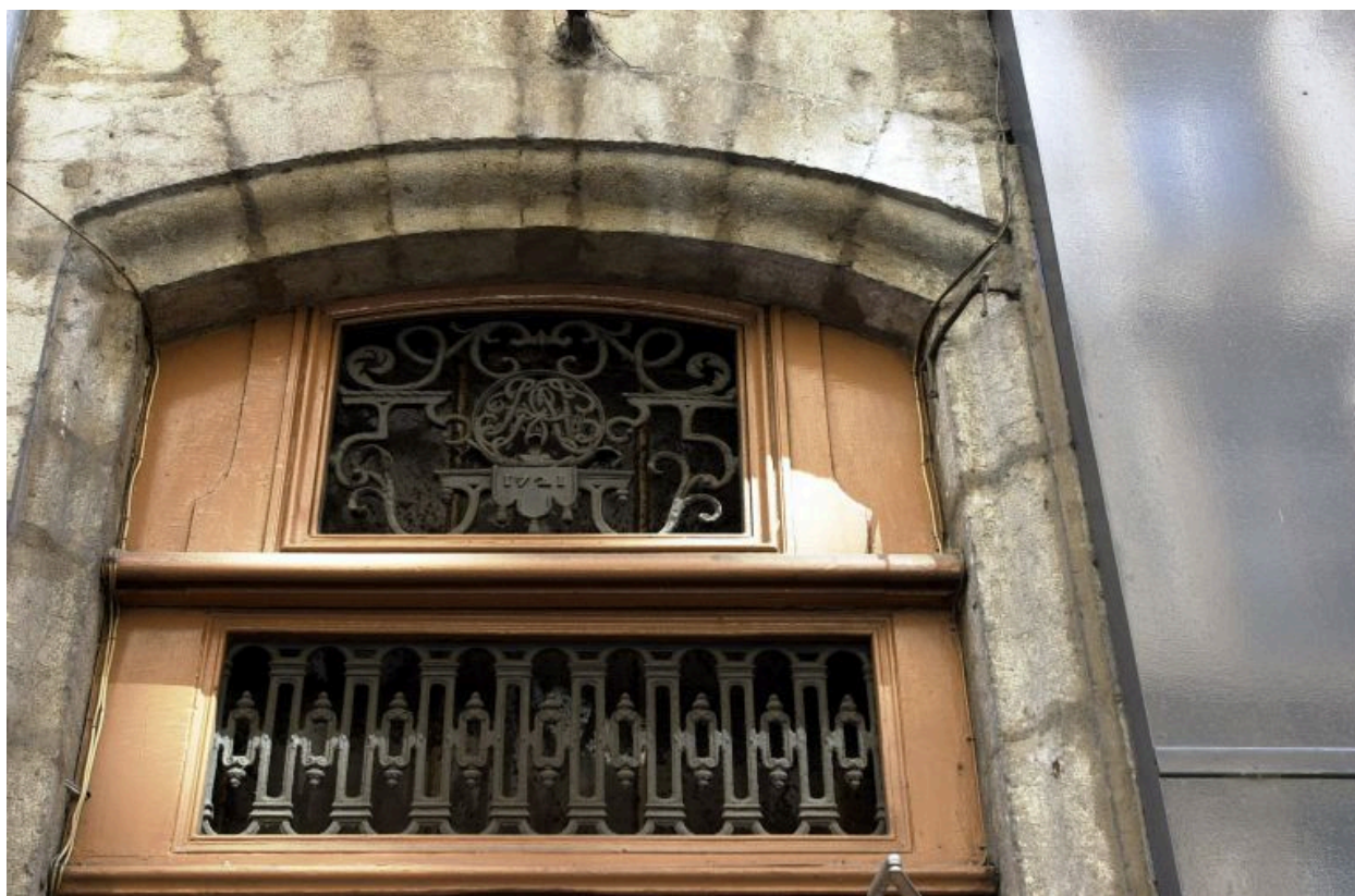
Façade sur rue, porte, détail du tympan de menuiserie