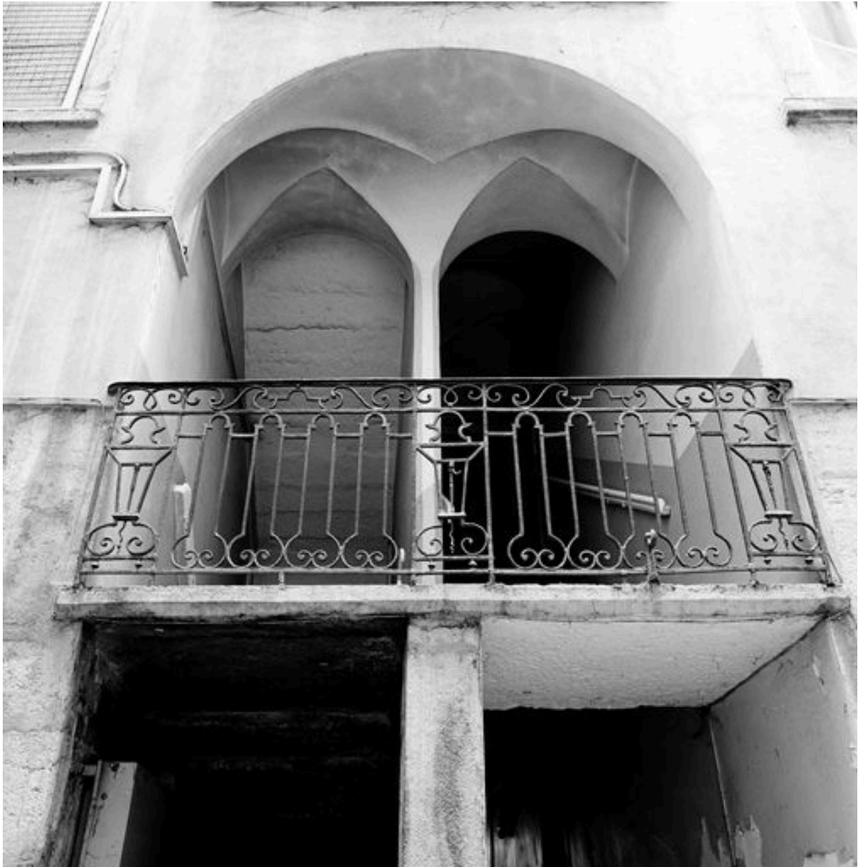
Cour, 1er bâtiment, garde-corps du 1er repos de l'escalier