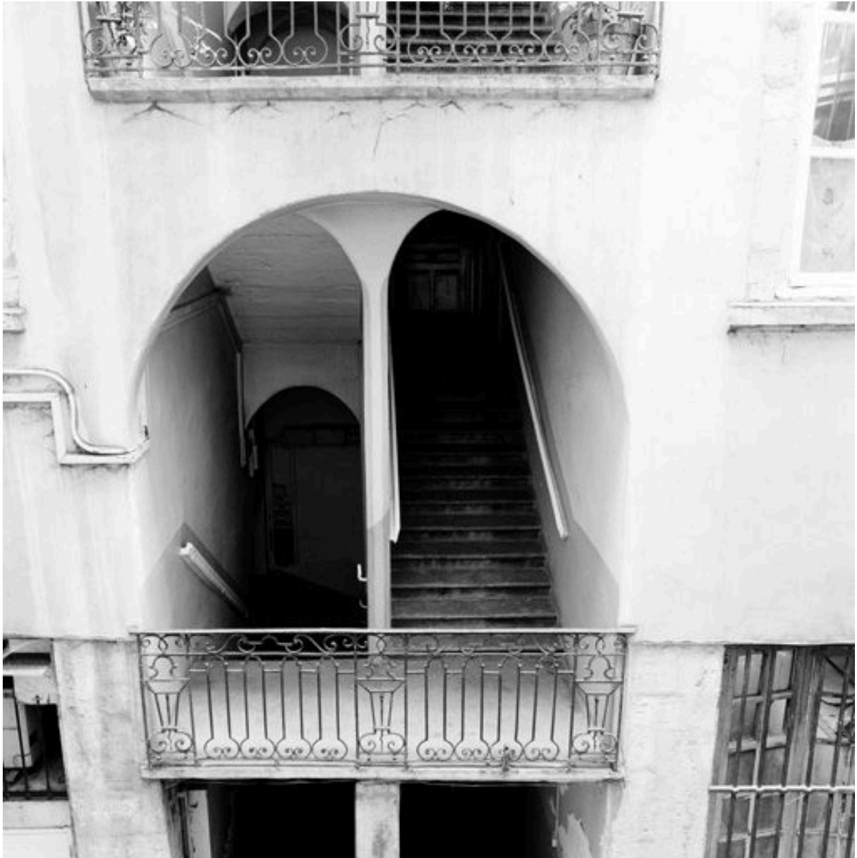
Cour, 1er bâtiment, rez-de-chaussée de l'escalier