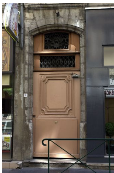
Façade sur rue, porte IVR82_20036901325NUCA