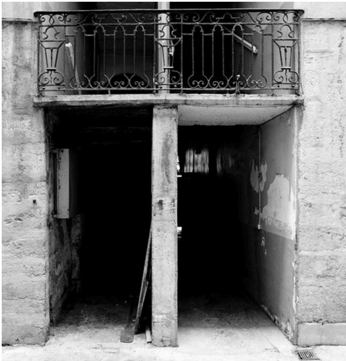
Cour, 1er bâtiment, débouché de l'allée et escalier