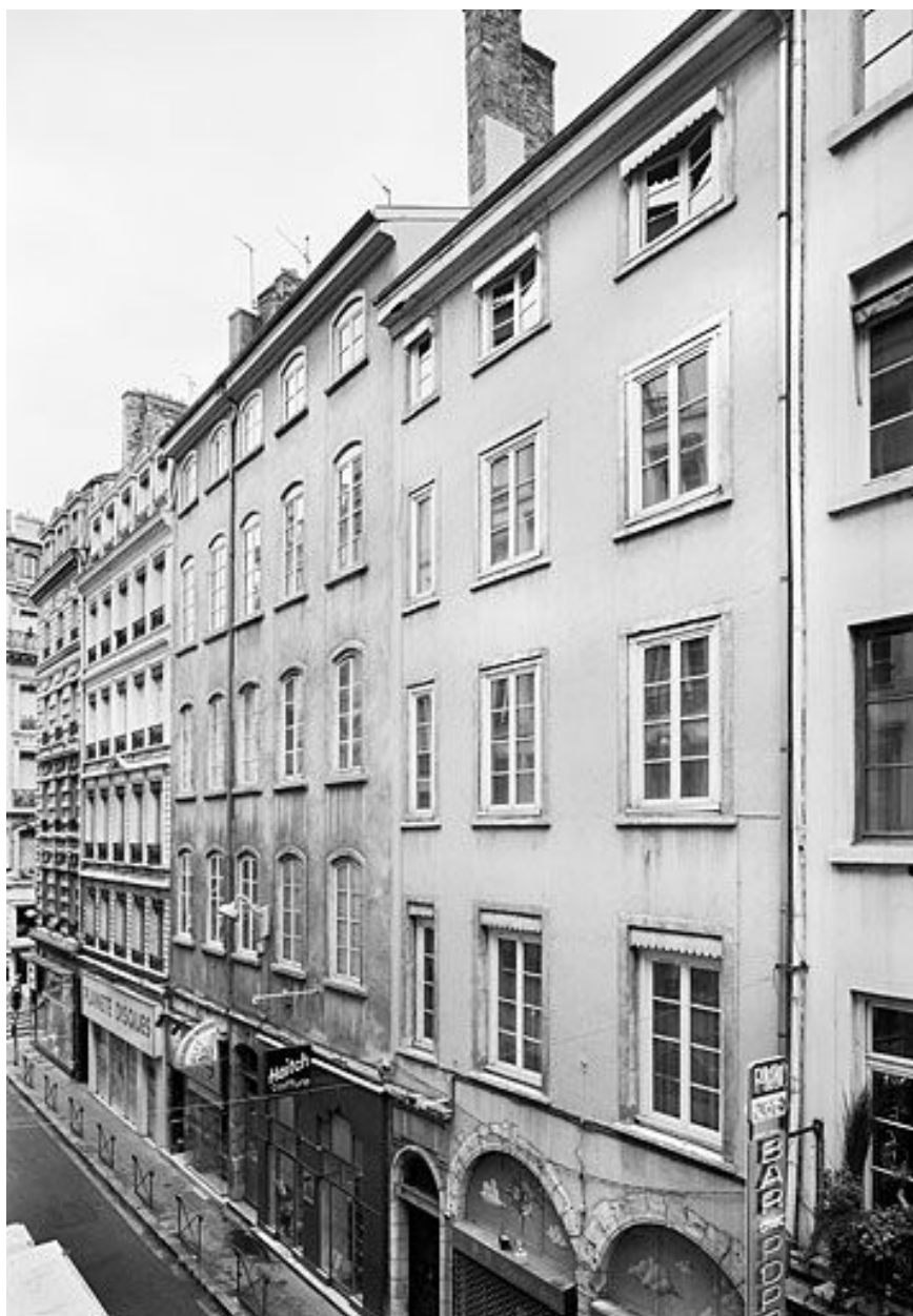
Façade sur rue (à gauche)