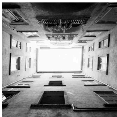
Cour, vue générale par-dessous