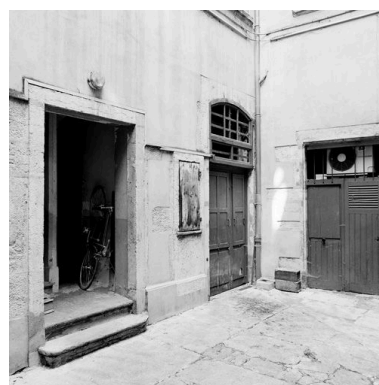
Angle du bâtiment en fond de cour (à gauche) avec l'aile droite. Entrée du 2e escalier et puits IVR82_20056902503X