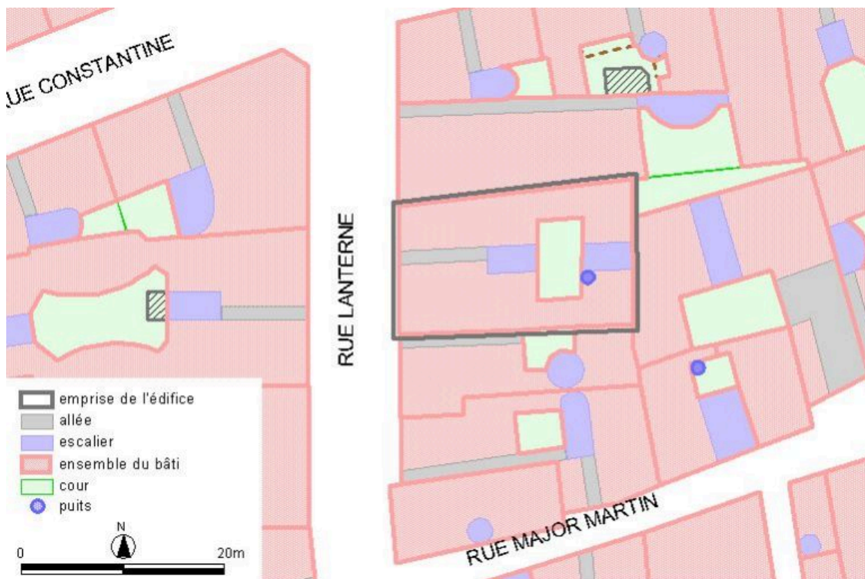
Plan-masse, d'après le système urbain de référence, version 1999