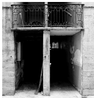
Cour, 1er bâtiment, débouché de l'allée et escalier IVR82_20056902509X