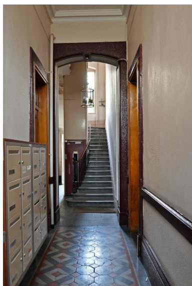
Vue intérieure, l'allée et le départ de l'escalier IVR84_20176901501NUCA