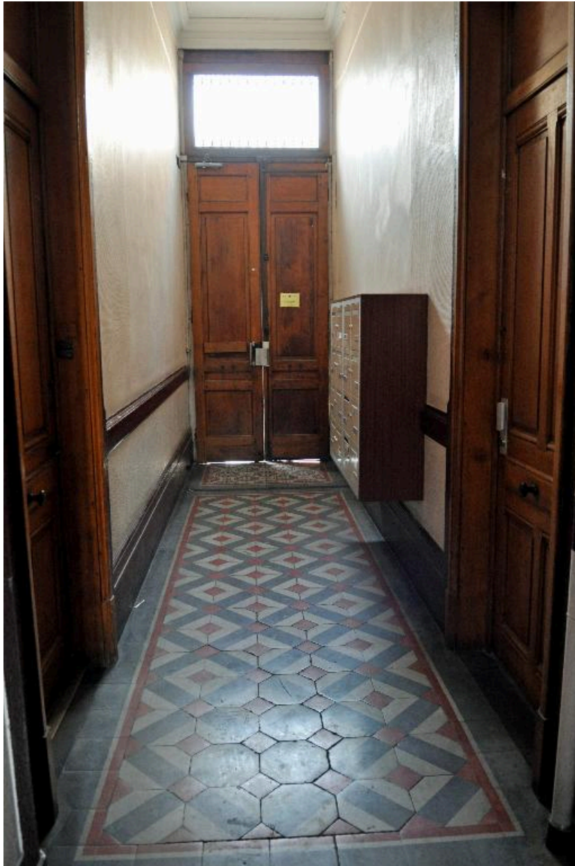
Vue intérieure, l'allée et le revers de la porte bâtarde