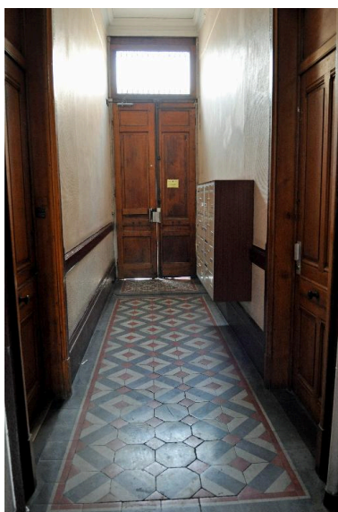
Vue intérieure, l'allée et le revers de la porte bâtarde IVR84_20176901502NUCA