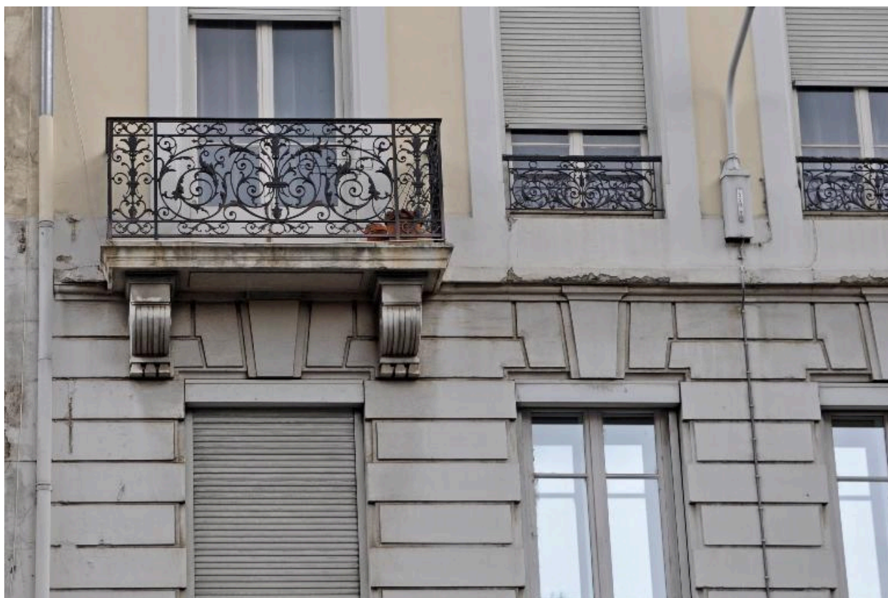
Vue rapprochée d'un des balcons du deuxième étage