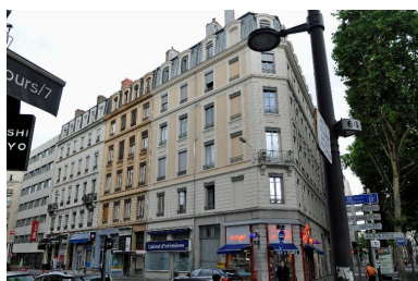
Vue de situation, dans l'ensemble des élévations sur la rue de l'Université (à gauche) IVR84_20176901470NUCA