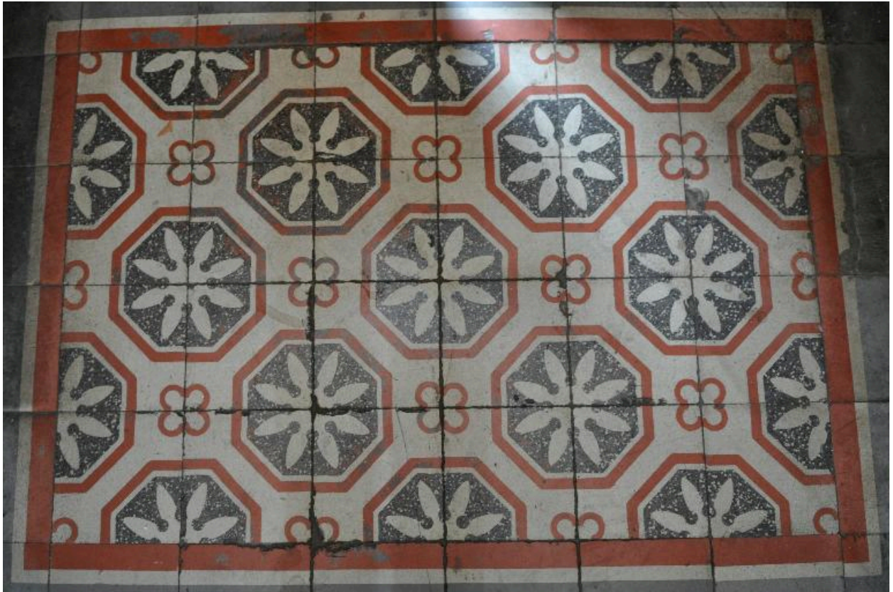
Vue intérieure, détail du pavement de l'allée