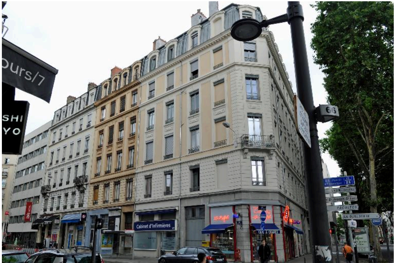
Vue de situation, dans l'ensemble des élévations sur la rue de l'Université (à gauche)