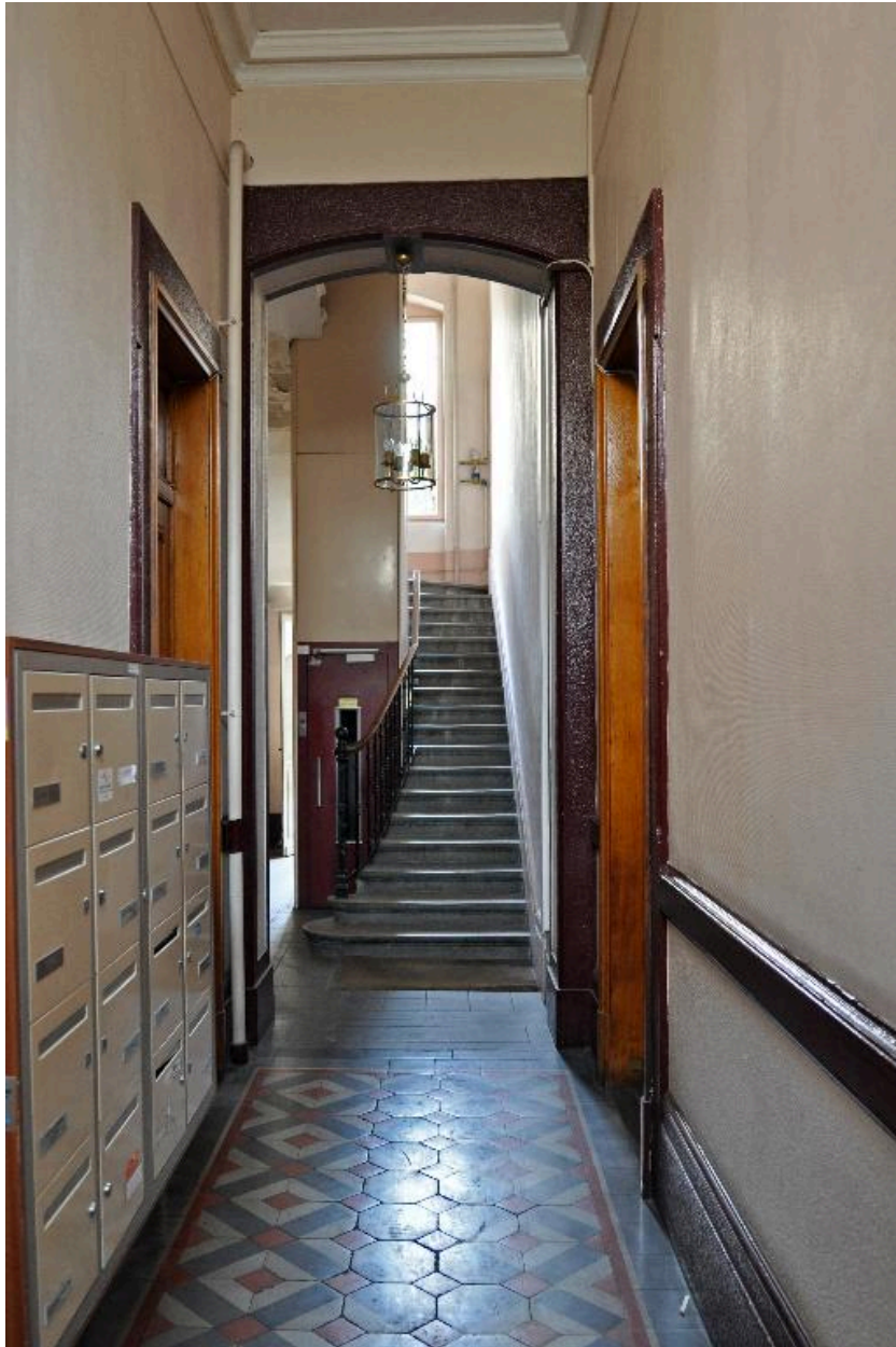
Vue intérieure, l'allée et le départ de l'escalier