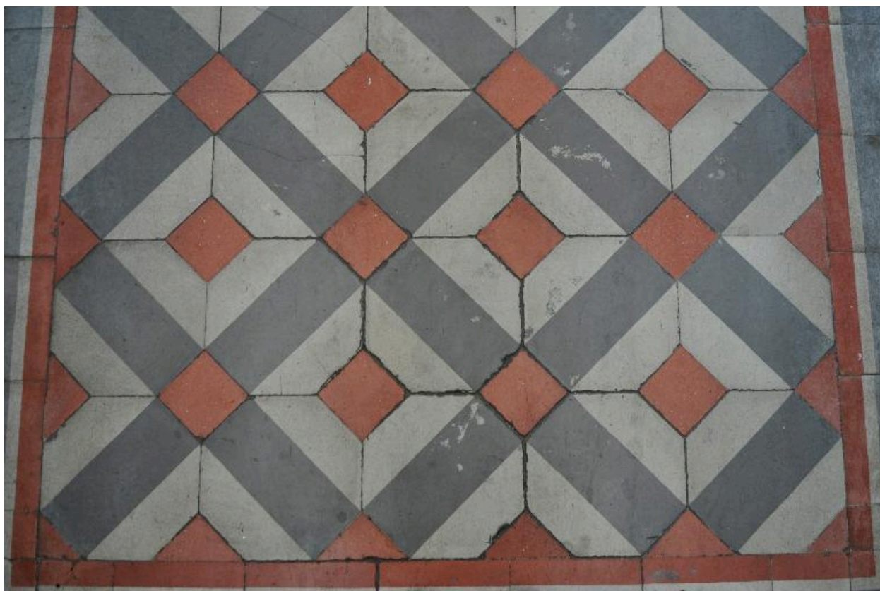
Vue intérieure, détail du pavement de l'allée