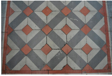
Vue intérieure, détail du pavement de l'allée IVR84_20176901504NUCA