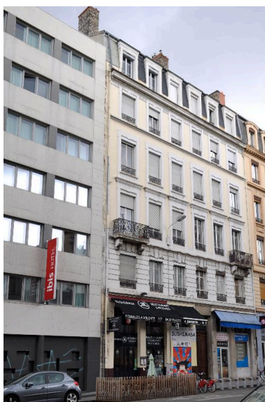
Vue générale, élévation sur rue IVR84_20176901473NUCA