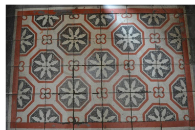
Vue intérieure, détail du pavement de l'allée IVR84_20176901503NUCA