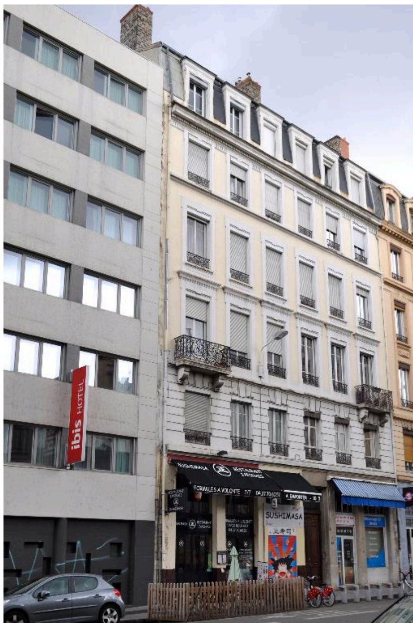
Vue générale, élévation sur rue