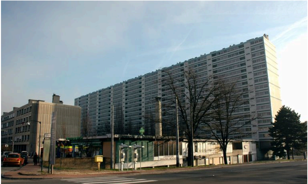
Vue d'ensemble de l'immeuble Balmont-nord, 322-329 rue du Doyen-Chapas et du centre commercial 337 avenue de Balmont