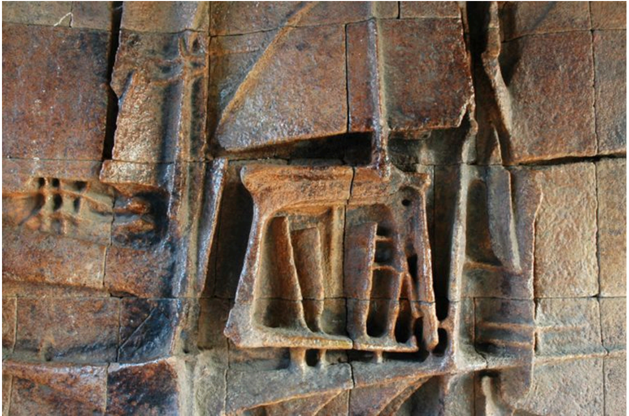
Détail du bas-relief, mur sud du passage couvert, 322 rue du Doyen-Chapas