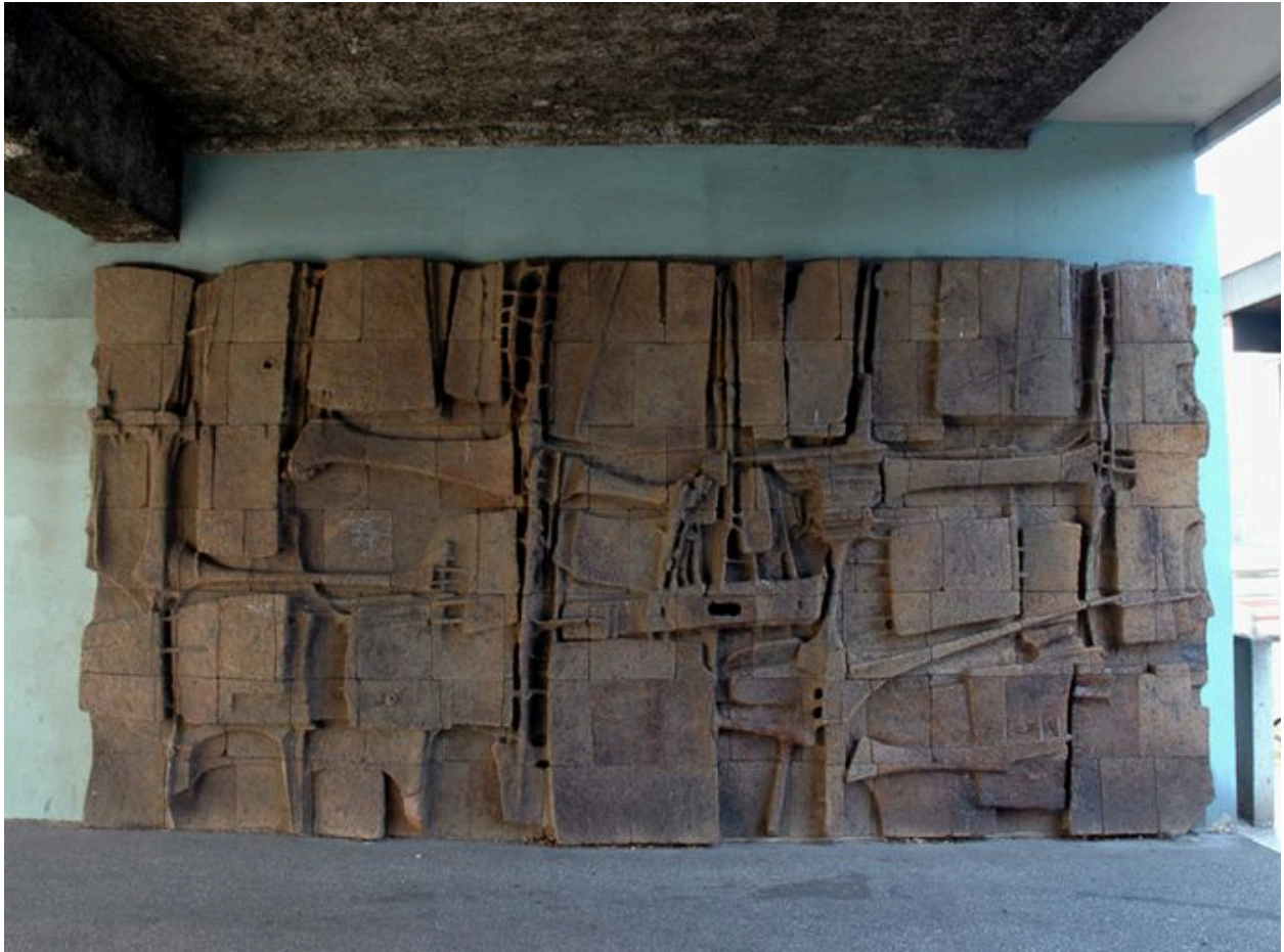
Bas-relief, mur nord du passage couvert, 322 rue du Doyen-Chapas