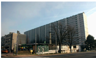
Vue d'ensemble de l'immeuble Balmont-nord, 322-329 rue