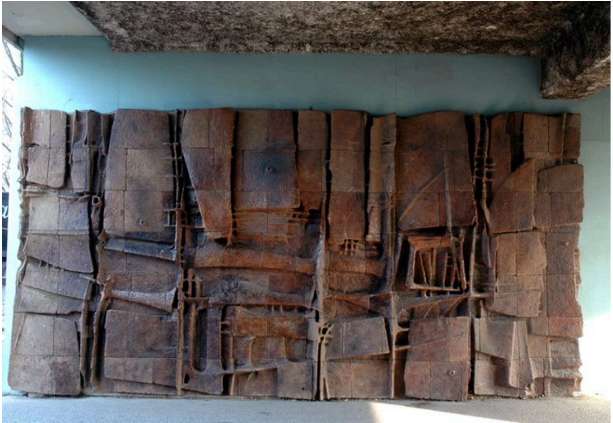
Bas-relief, mur sud du passage couvert, 322 rue du Doyen-Chapas