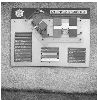
plan du parc d'activité IVR82_20026904474X