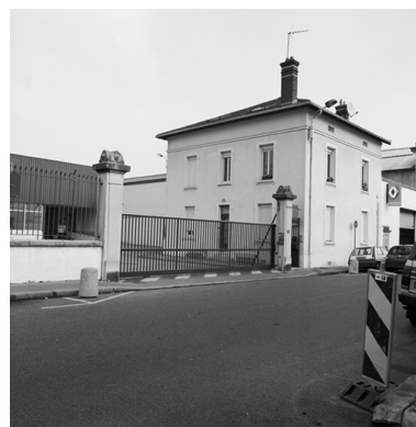
Entrée principale du parc d'activité IVR82_20026904475X