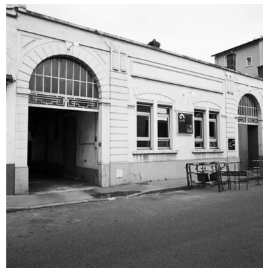
Détail façade