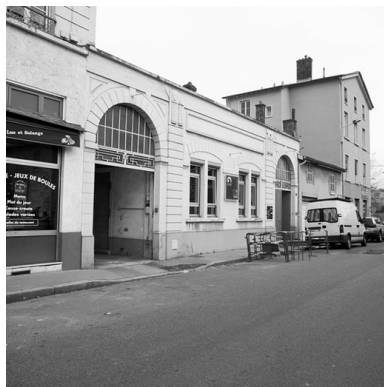
Vue générale IVR82_20026904470X