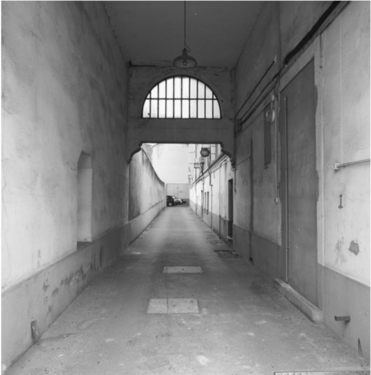
Détail passage traversant nord-sud