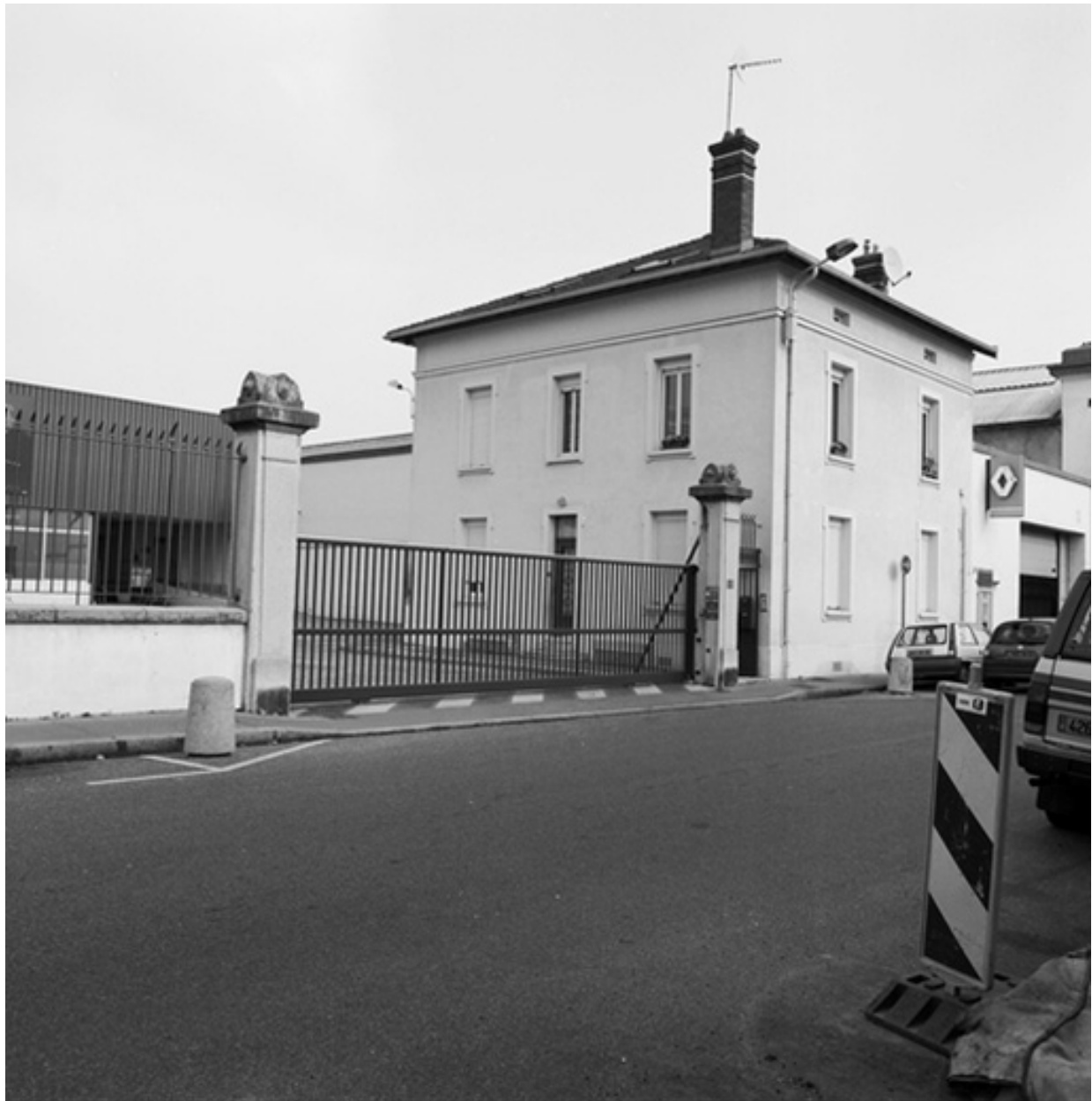
Entrée principale du parc d'activité