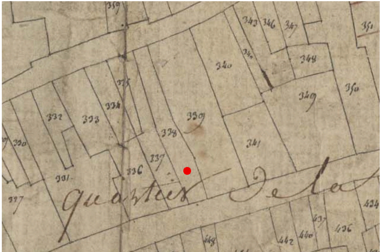
Extrait du plan cadastral de 1809, parcelle E 537.