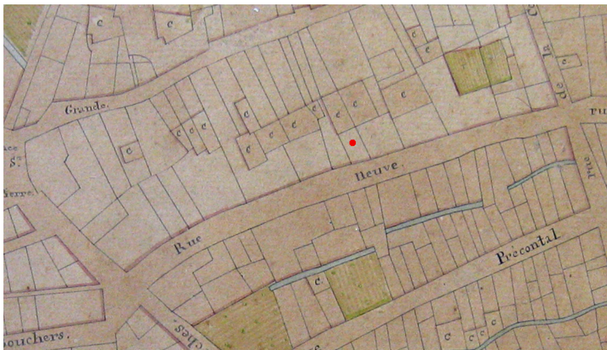
Extrait du plan de Hyacinthe de Boisboissel, vers 1808.