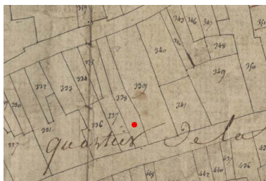
Extrait du plan cadastral de 1809, parcelle E 537.