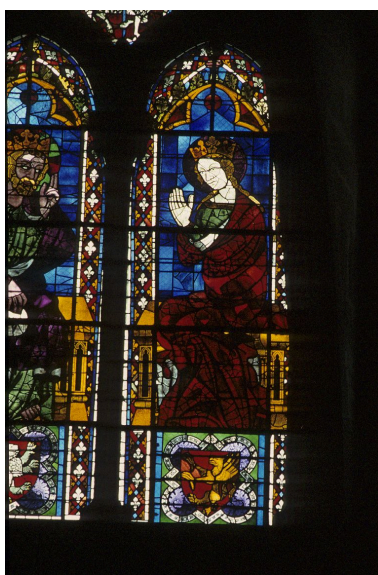
Détail de la Vierge. IVR82_19876902147ZA