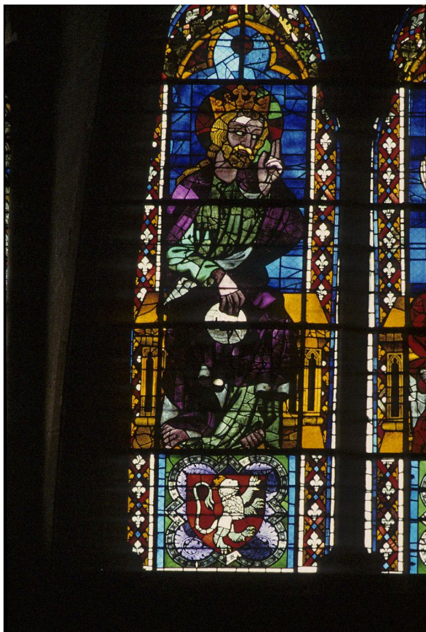
Détail de Dieu le Père.