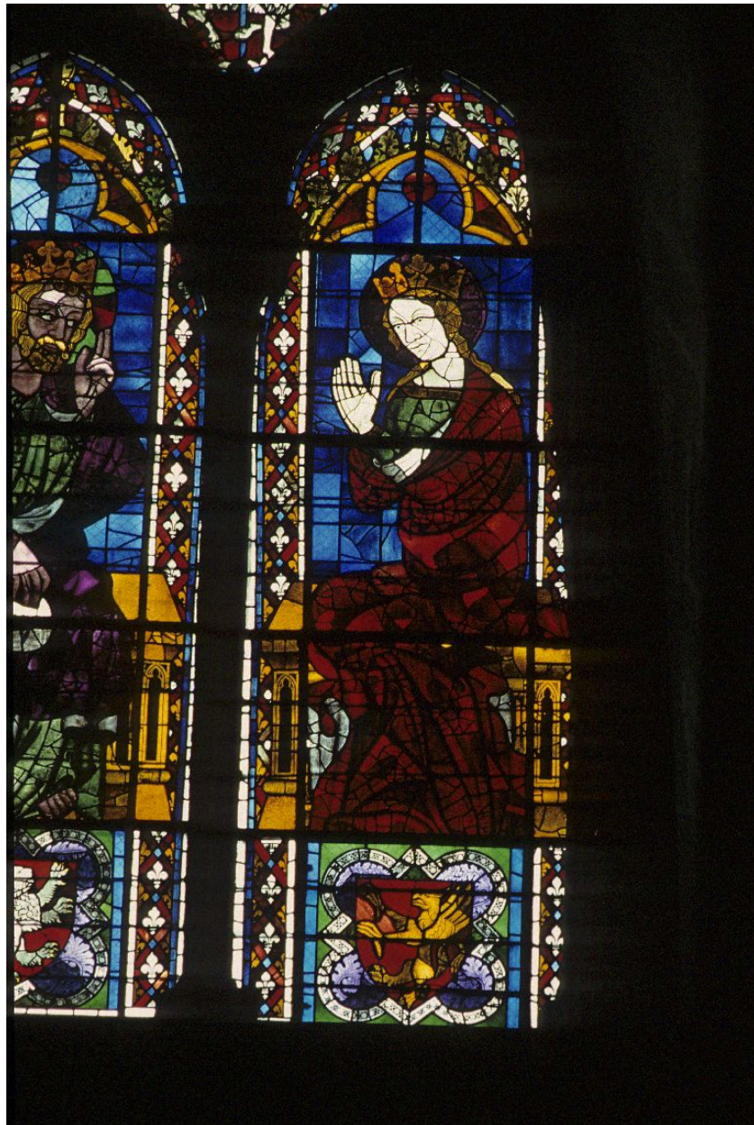
Détail de la Vierge.