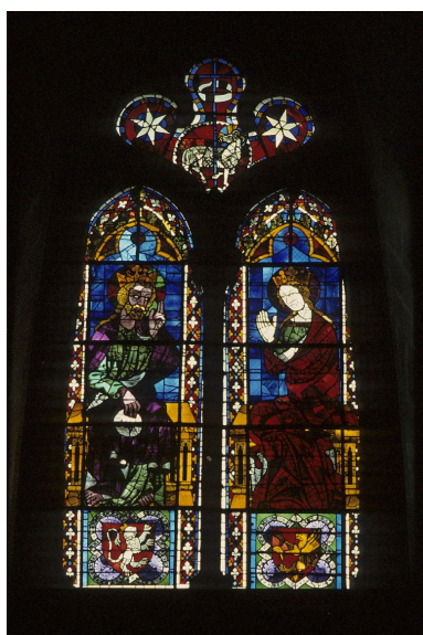
Vue générale. IVR82_19876902146ZA