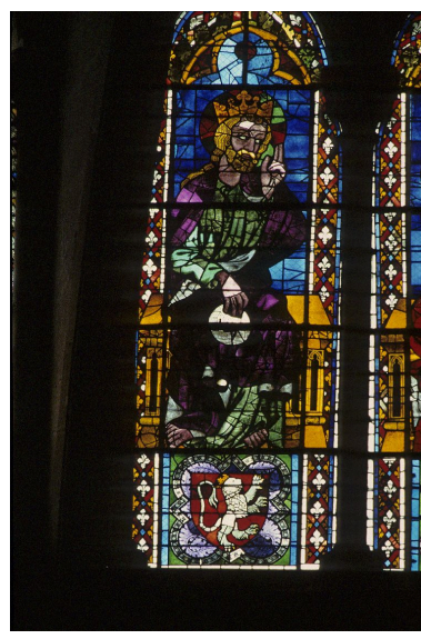
Détail de Dieu le Père.