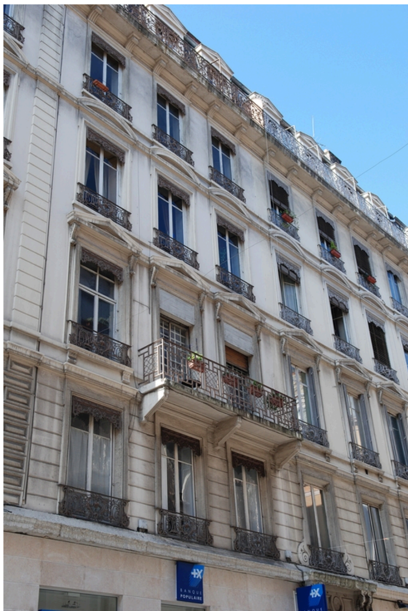
Elévation rue des Archers : les étages carrés