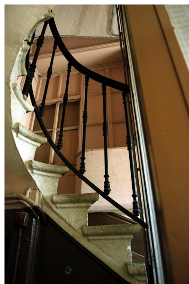
Porte de l'ancienne loge de concierge ouvrant sur la première volée d'escalier ?