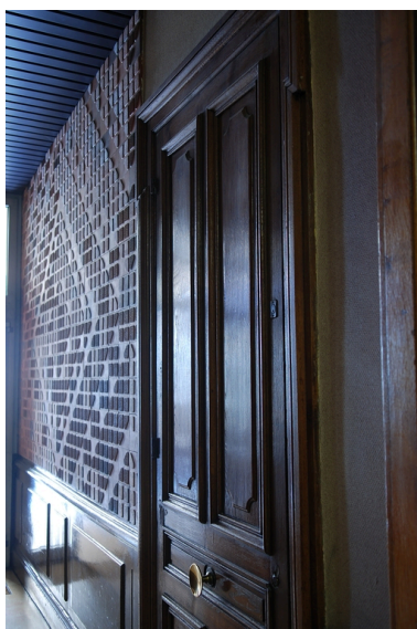
L'allée, vue partielle IVR82_20096904838NUCA