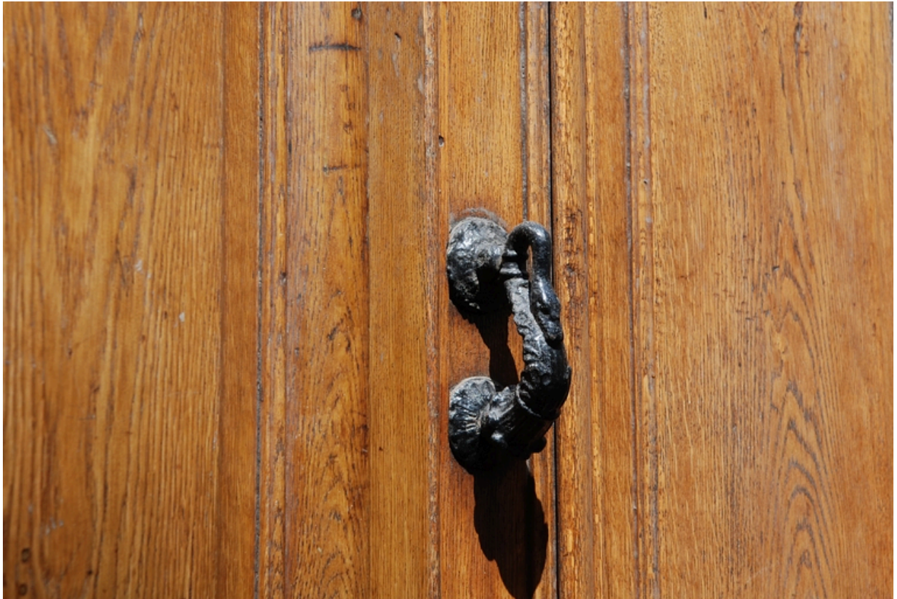
Elévation antérieure : la porte, détail du heurtor