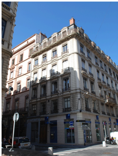
Vue générale IVR82_20096904836NUCA