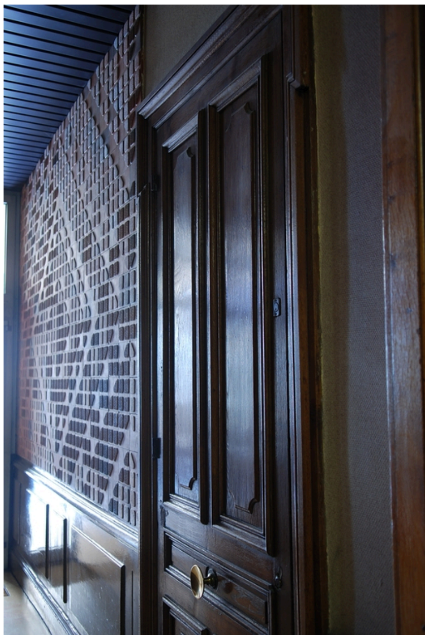
L'allée, vue partielle