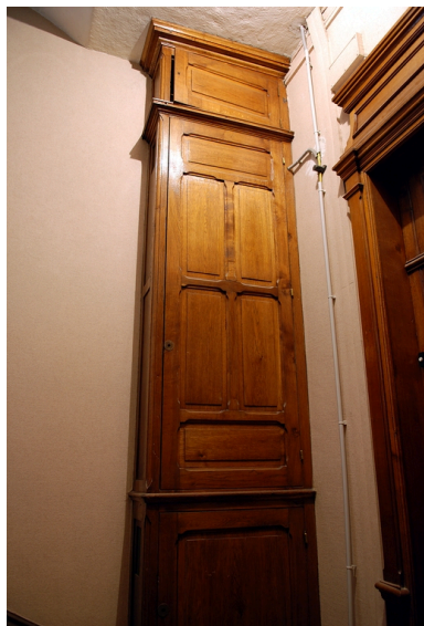
Placard aménagé sur un palier