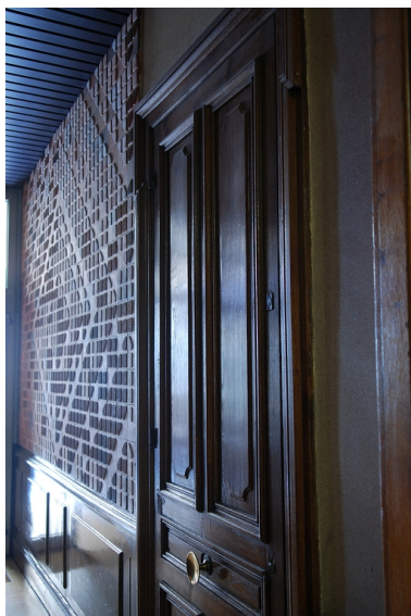
L'allée, vue partielle IVR82_20096904838NUCA