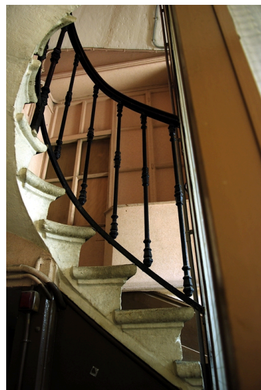
Porte de l'ancienne loge de concierge ouvrant sur la première volée d'escalier ? IVR82_20096904839NUCA