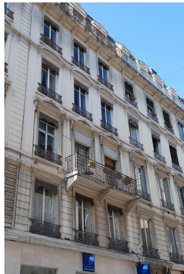
Elévation rue des Archers : les étages carrés IVR82_20096904837NUCA