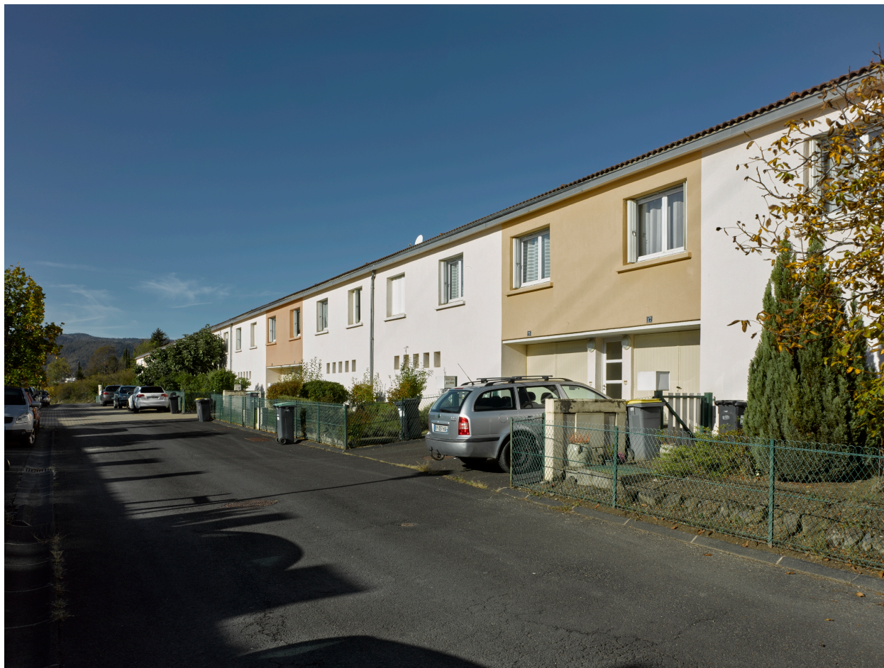
Logements en bande, allée des Fauvettes (parcelles nord, partie basse).