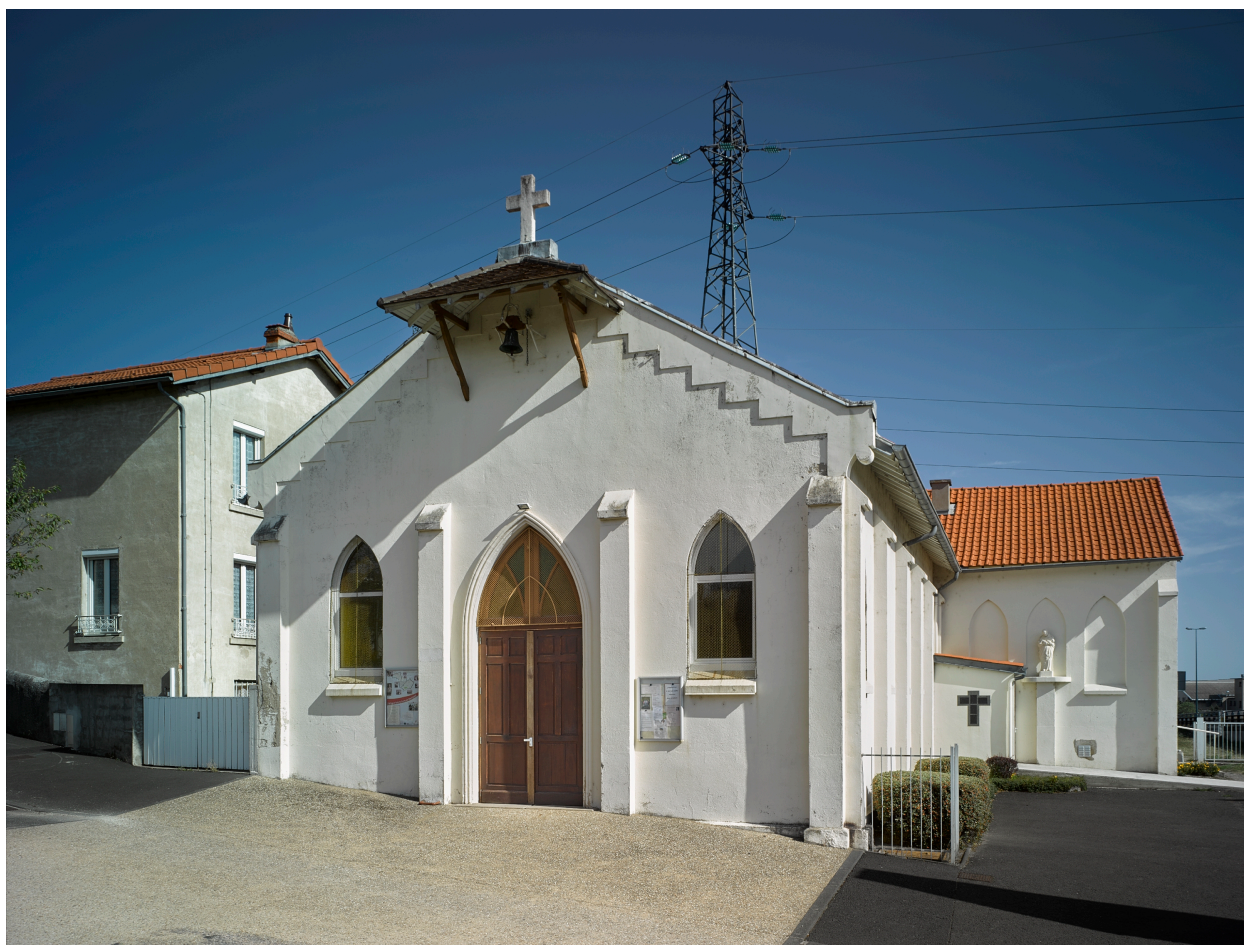
Élévation ouest de l'église Saint-Vincent-de-Paul, au bas de la cité (partie sud-ouest).