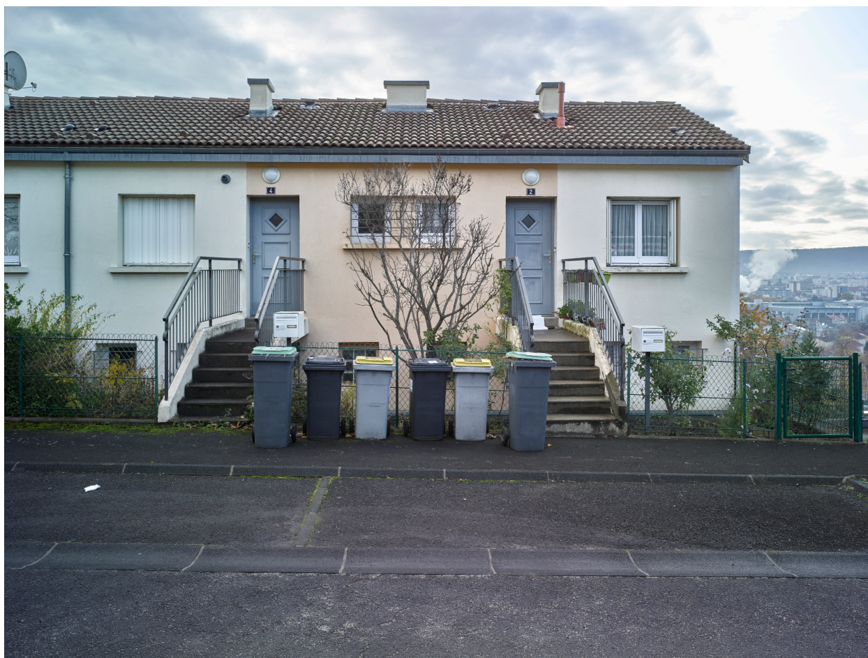
Exemple de maisons en bande avec escalier-passerelle d'accès à l'étage supérieur, depuis le côté haut de la pente.