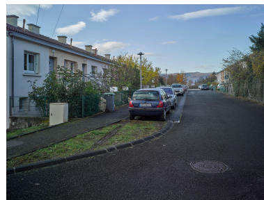
Habitat en bande de l'allée des Fauvettes, du côté haut de la pente. IVR84_20196300398NUC4A