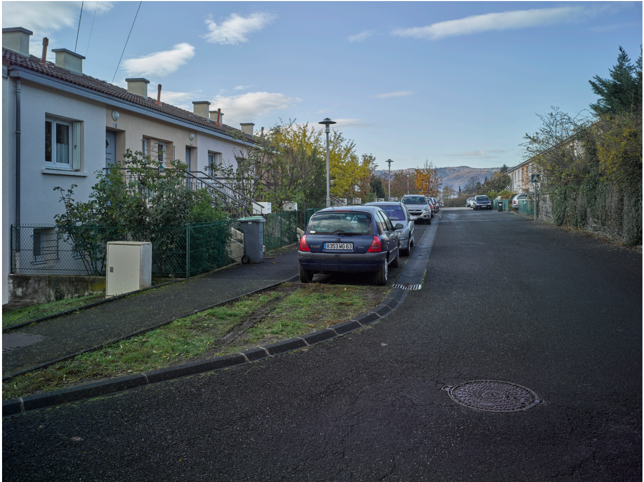
Habitat en bande de l'allée des Fauvettes, du côté haut de la pente.