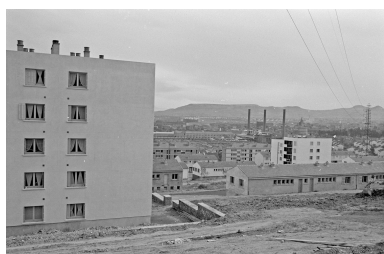
Partie haute de la cité, au nord, avec vue sur l'usine de Cataroux. Vue prise vraisemblablement peu après la fin du chantier de construction, vers 1961-1962. IVR84_20236300153NUC