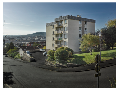
Immeuble collectif de la cité Saint-Vincent, dans la partie haute de la rue de Diane. IVR84_20196300380NUC4A