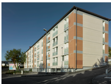
Immeuble collectif de la cité Saint-Vincent, rue du Clos-Chanturgue. IVR84_20196300375NUC4A