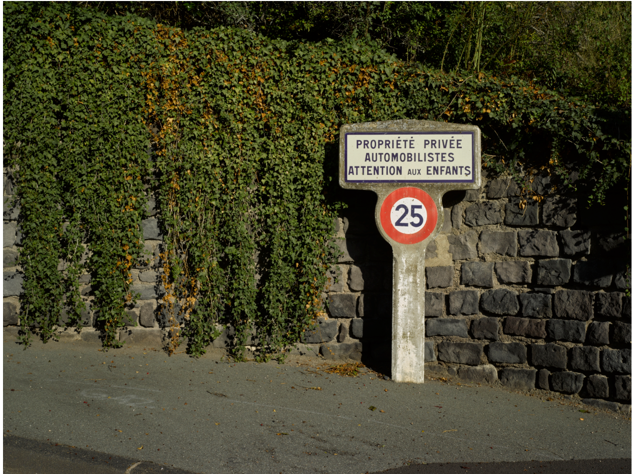
Panneau émaillé Michelin, rue de Diane : "Propriété privée, automobilistes attention aux enfants" et indication de la limitation de vitesse à 25 km/h.