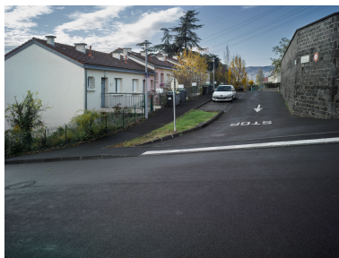
Maisons accolées en bande sur l'allée des Mésanges : élévations du côté haut de la pente avec passerelles d'accès. IVR84_20196300399NUC4A