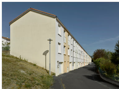
Maisons en bande (une maison par parcelle), allée des Fauvettes. IVR84_20196300377NUC4A