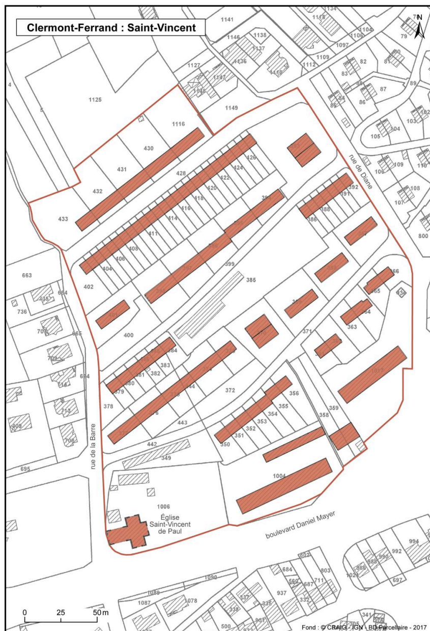
Plan des différents bâtiments d'origine de la cité.