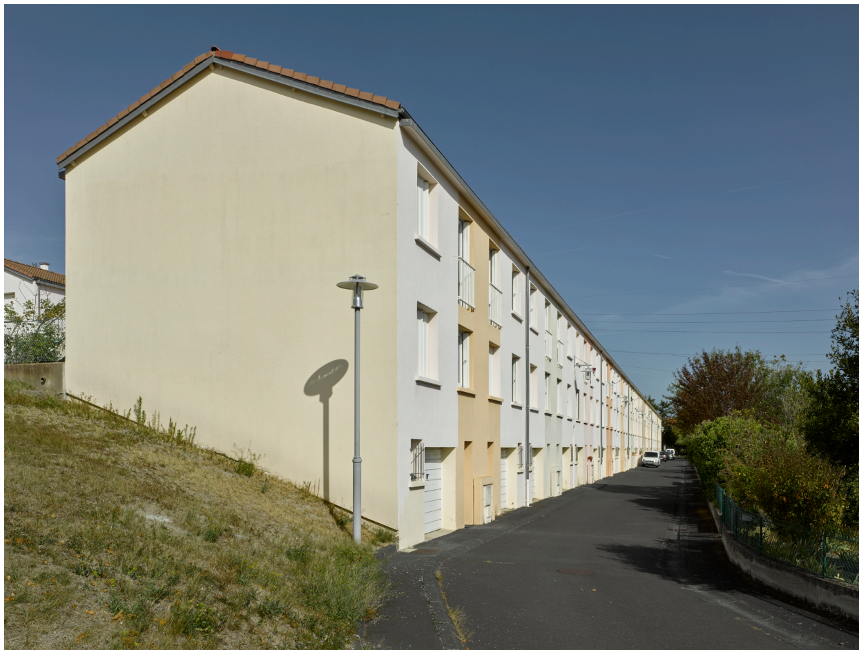
Maisons en bande (une maison par parcelle), allée des Fauvettes.