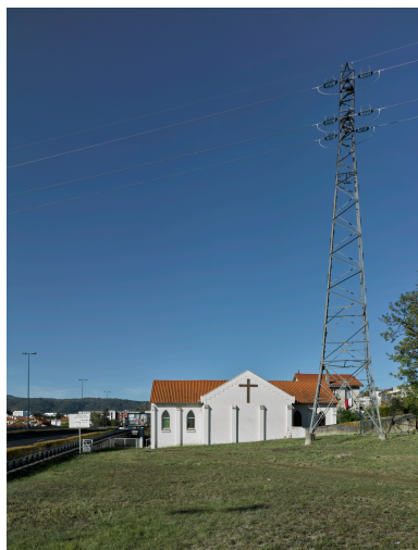
Élévation est de l'église Saint-Vincent-de-Paul, au bas de la cité (partie sud-ouest). IVR84_20196300379NUC4A