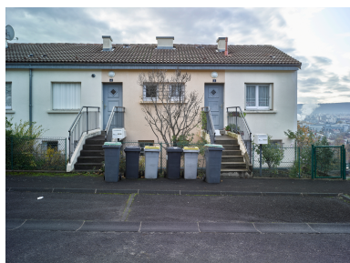
Exemple de maisons en bande avec escalier-passerelle d'accès à l'étage supérieur, depuis le côté haut de la pente. IVR84_20196300397NUC4A