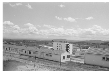
Vue partielle depuis l'allée des Bouvreuils, au nord- ouest. Photographie prise vraisemblablement peu après la fin du chantier, vers 1961-1962. IVR84_20236300156NUC