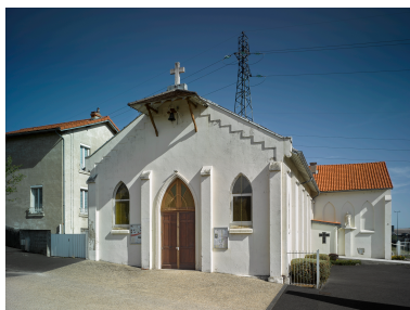
Élévation ouest de l'église Saint-Vincent-de-Paul, au bas de la cité (partie sud-ouest).