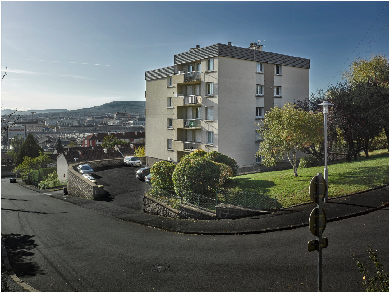
Immeuble collectif de la cité Saint-Vincent, dans la partie haute de la rue de Diane.