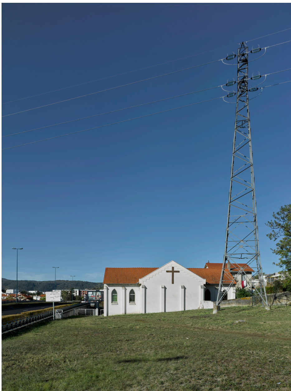
Élévation est de l'église Saint-Vincent-de-Paul, au bas de la cité (partie sud-ouest).