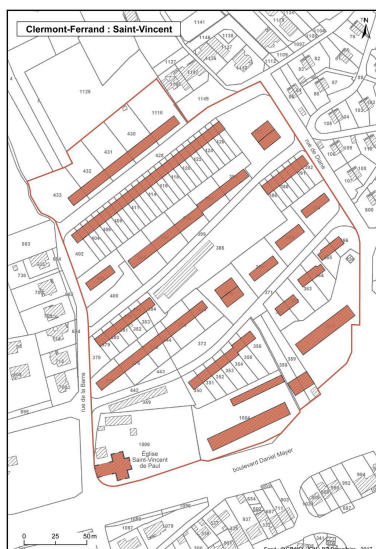
Plan des différents bâtiments d'origine de la cité. IVR84_20216301280NUDA