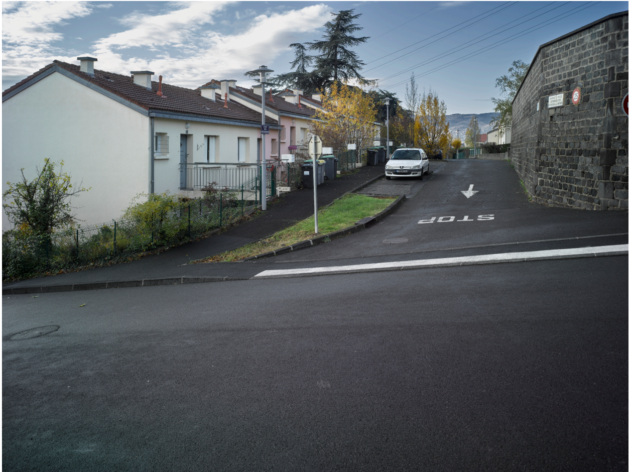
Maisons accolées en bande sur l'allée des Mésanges : élévations du côté haut de la pente avec passerelles d'accès.