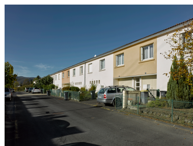
Logements en bande, allée des Fauvettes (parcelles nord, partie basse). IVR84_20196300372NUC4A