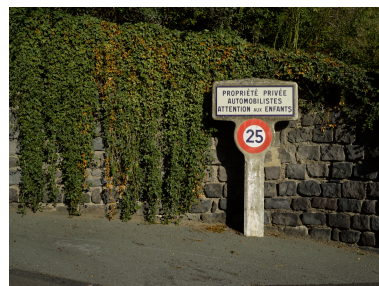
Panneau émaillé Michelin, rue de Diane : "Propriété privée, automobilistes attention aux enfants" et indication de la limitation de vitesse à 25 km/h. IVR84_20196300381NUC4A