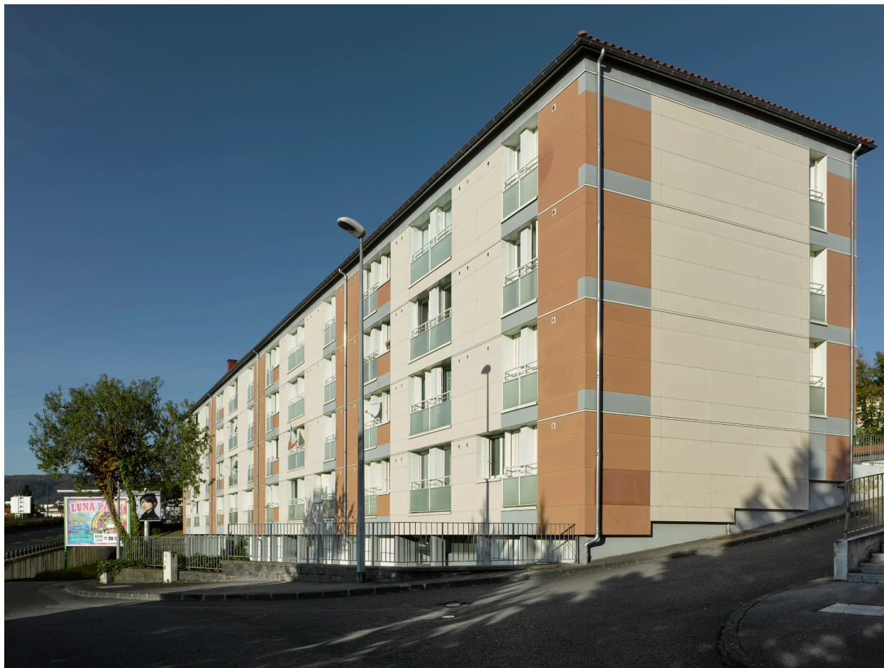
Immeuble collectif de la cité Saint-Vincent, rue du Clos-Chanturgue.