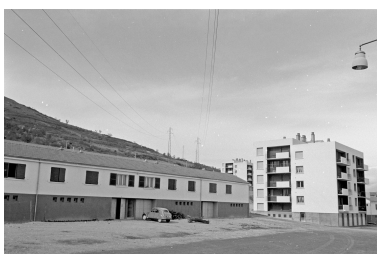
Partie sud de la cité, prise vraisemblablement peu après la fin du chantier, vers 1961-1962 : les parcelles de jardin ne sont pas encore plantées. IVR84_20236300154NUC