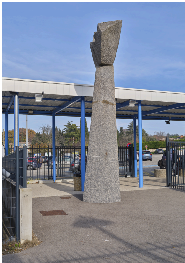
Vue d'ensemble IVR84_20222600012NUCA