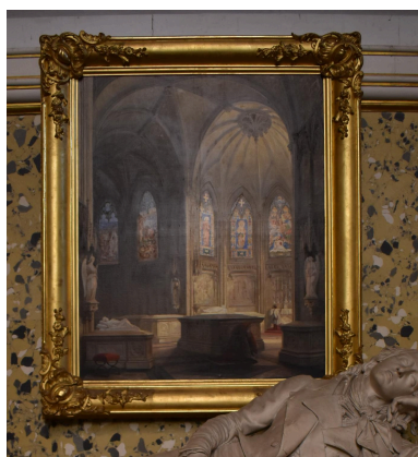
Vue générale IVR84_20226300402NUC4A