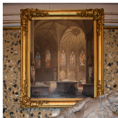
Vue générale IVR84_20226300404NUC4A