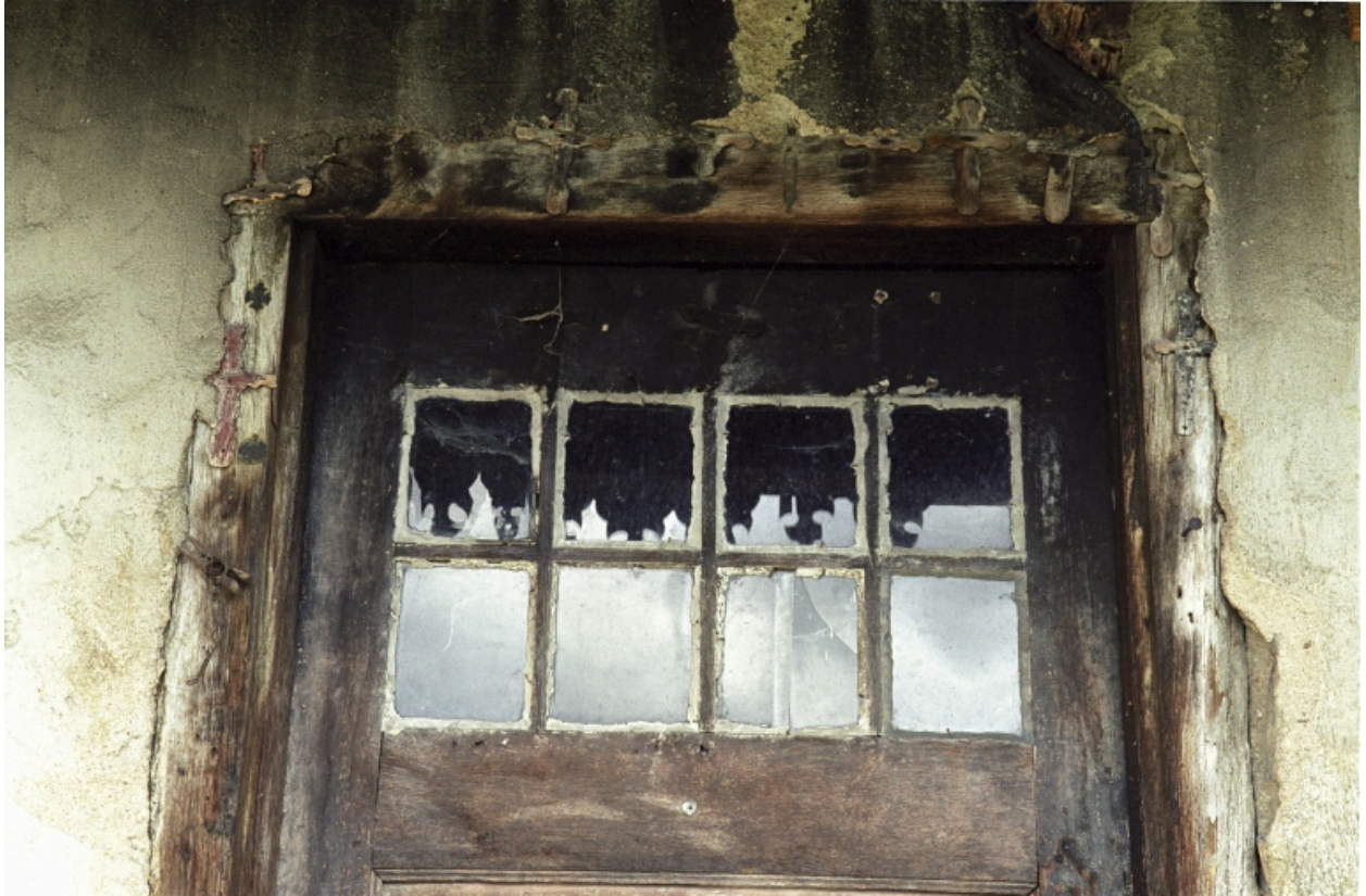
Partie supérieure de la porte d'entrée du rez-de-chaussée.