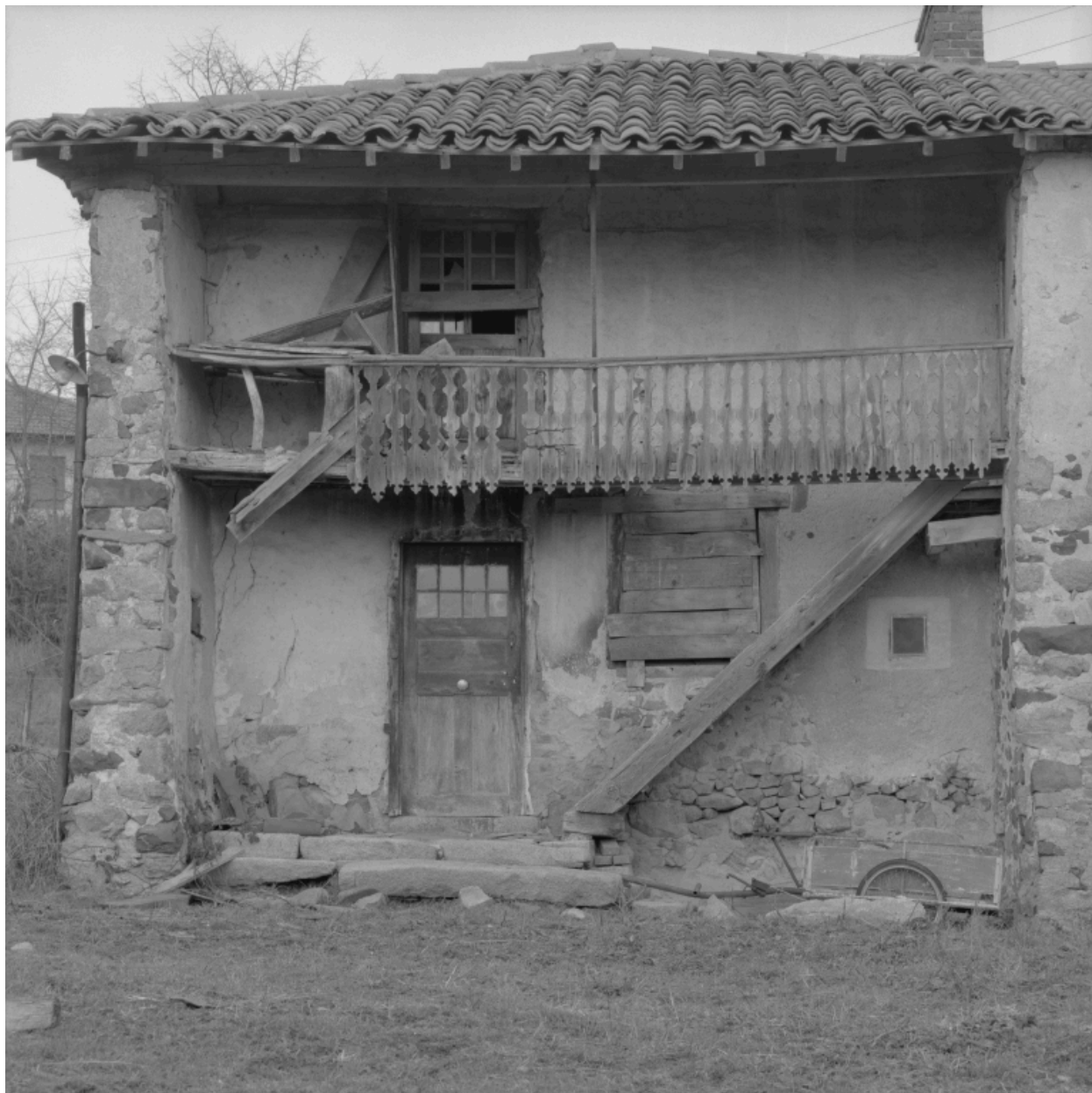
Façade antérieure, détail de la partie gauche.