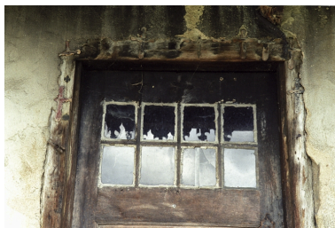
Partie supérieure de la porte d'entrée du rez-de-chaussée. IVR82_20044200593ZE