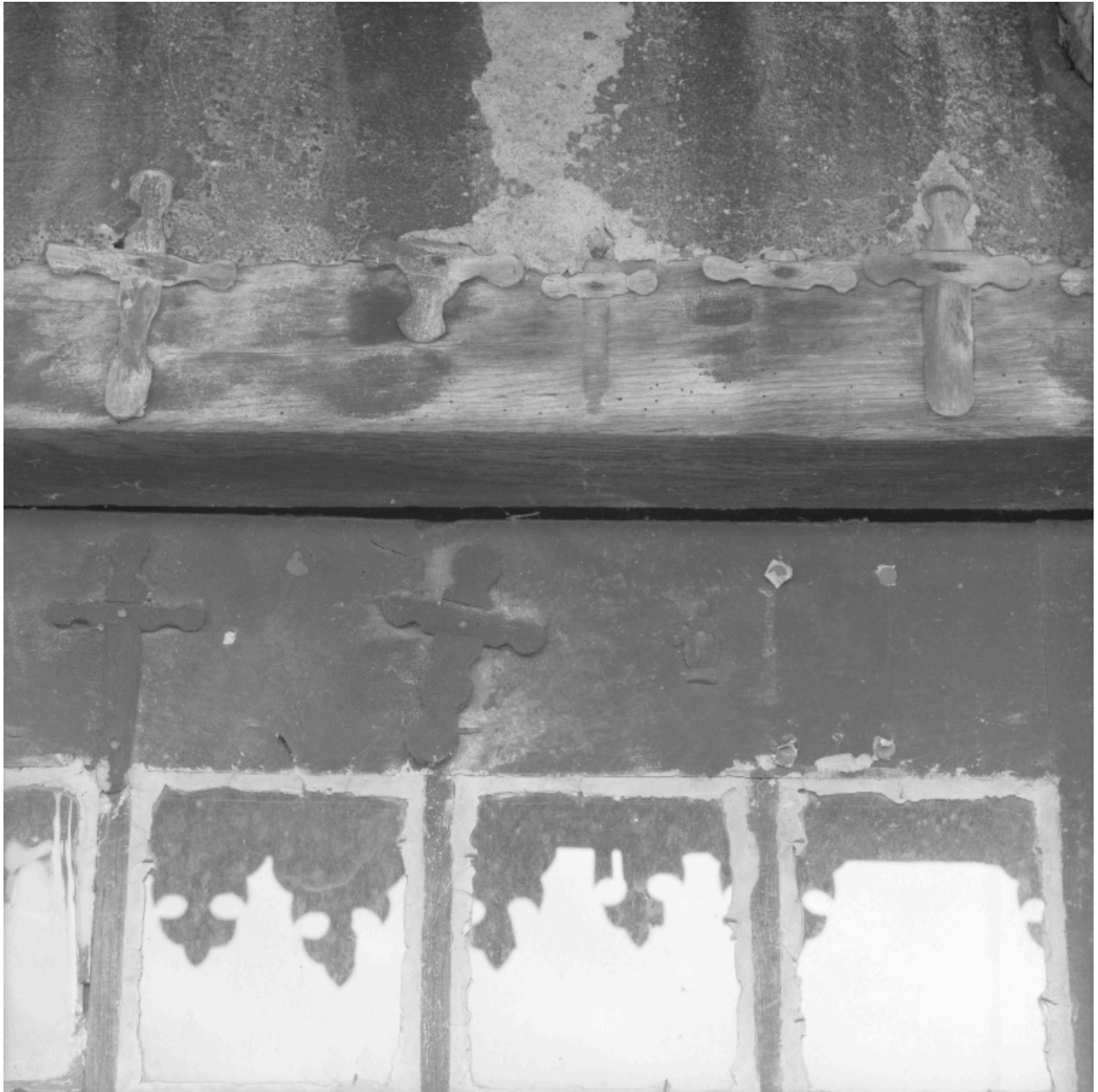
Détail de l'encadrement de la porte du rez-de-chaussée, partie centrale : "croisettes".