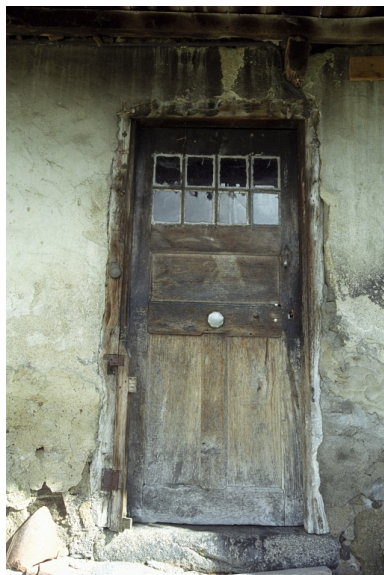
Vue d'ensemble de la porte d'entrée du rez-de-chaussée. IVR82_20044200592ZE