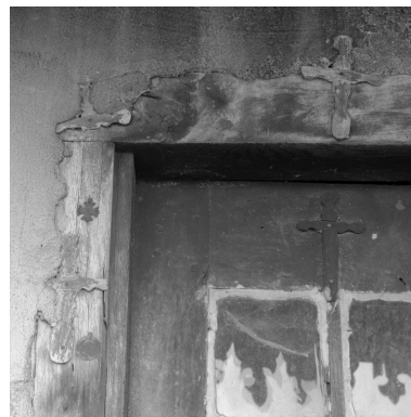
Détail de l'encadrement de la porte du rez-de-chaussée, angle gauche : "croisettes" et médailles prophylactiques. IVR82_20014200616X