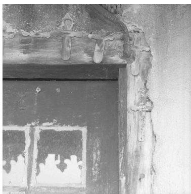
Détail de l'encadrement de la porte du rez-de-chaussée, angle droit : "croisettes". IVR82_20014200618X