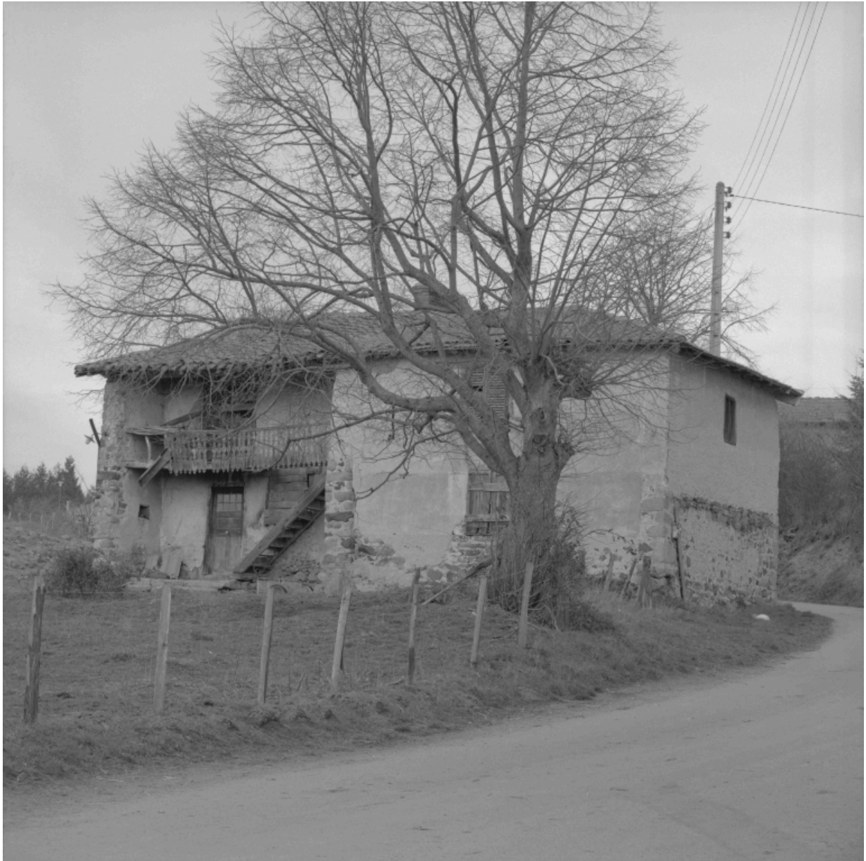
Vue d'ensemble de trois-quarts droite.