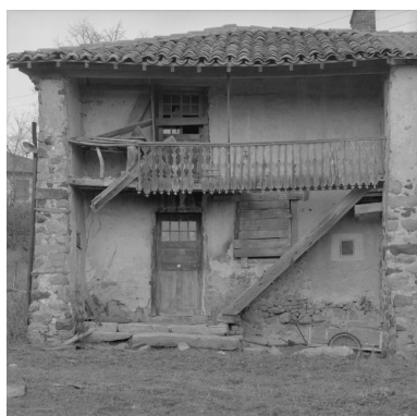
Façade antérieure, détail de la partie gauche. IVR82_20014200614X