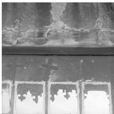
Détail de l'encadrement de la porte du rez-de-chaussée, partie centrale : "croisettes".