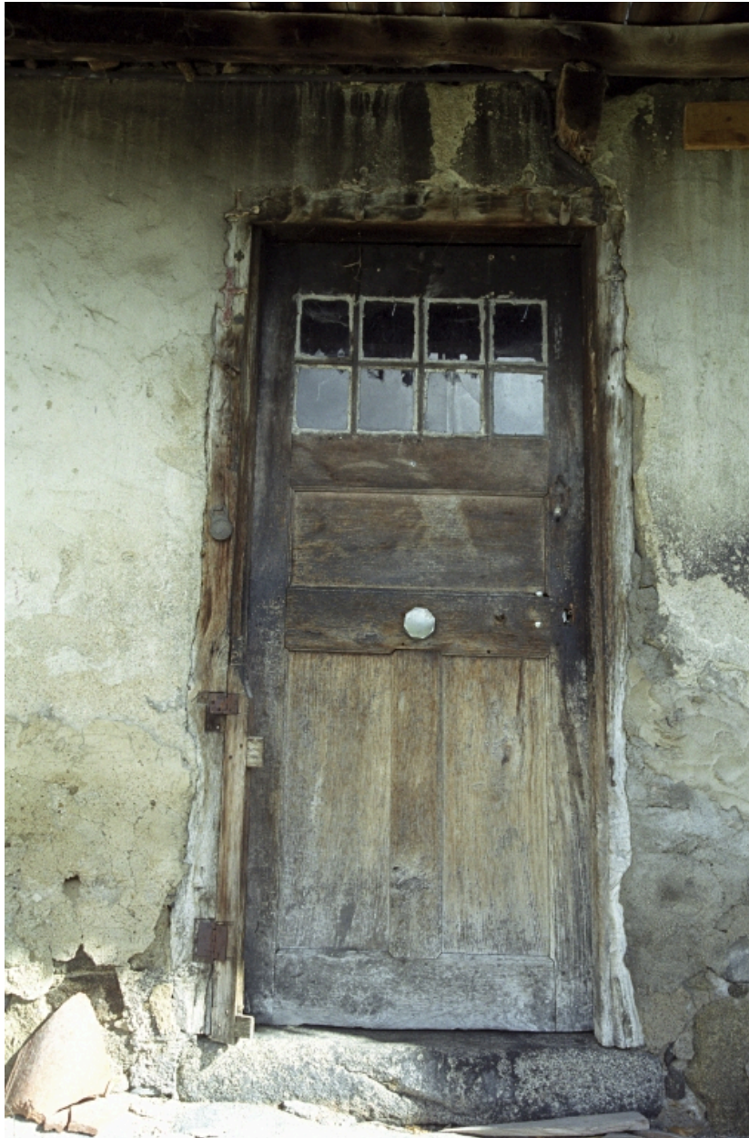
Vue d'ensemble de la porte d'entrée du rez-de-chaussée.