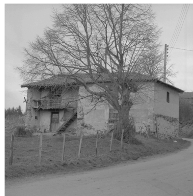
Vue d'ensemble de trois-quarts droite. IVR82_20014200613X