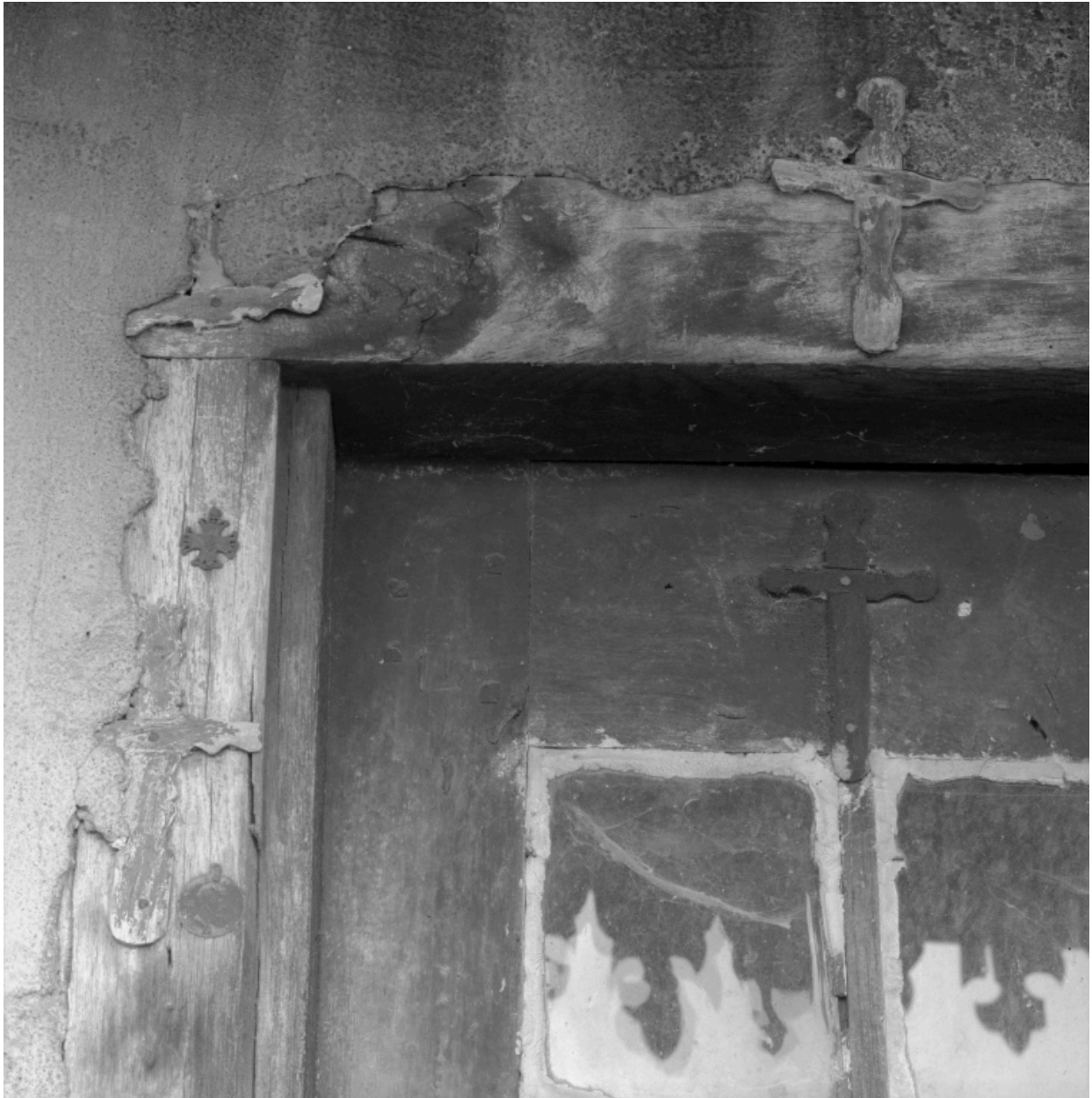
Détail de l'encadrement de la porte du rez-de-chaussée, angle gauche : "croisettes" et médailles prophylactiques.