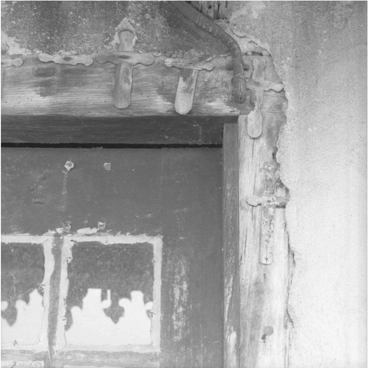
Détail de l'encadrement de la porte du rez-de-chaussée, angle droit : "croisettes".