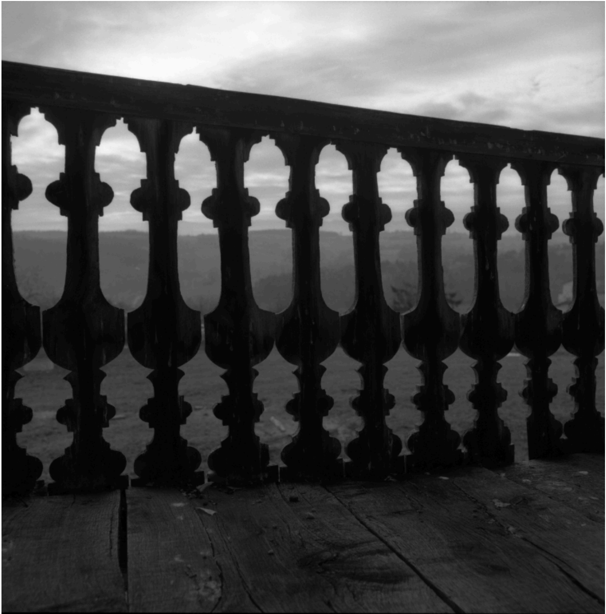
Façade antérieure, détail de la galerie (vue de l'intérieur, vers l'église).