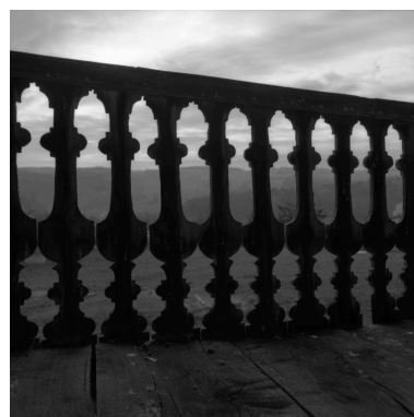
Façade antérieure, détail de la galerie (vue de l'intérieur, vers l'église). IVR82_20014201328X