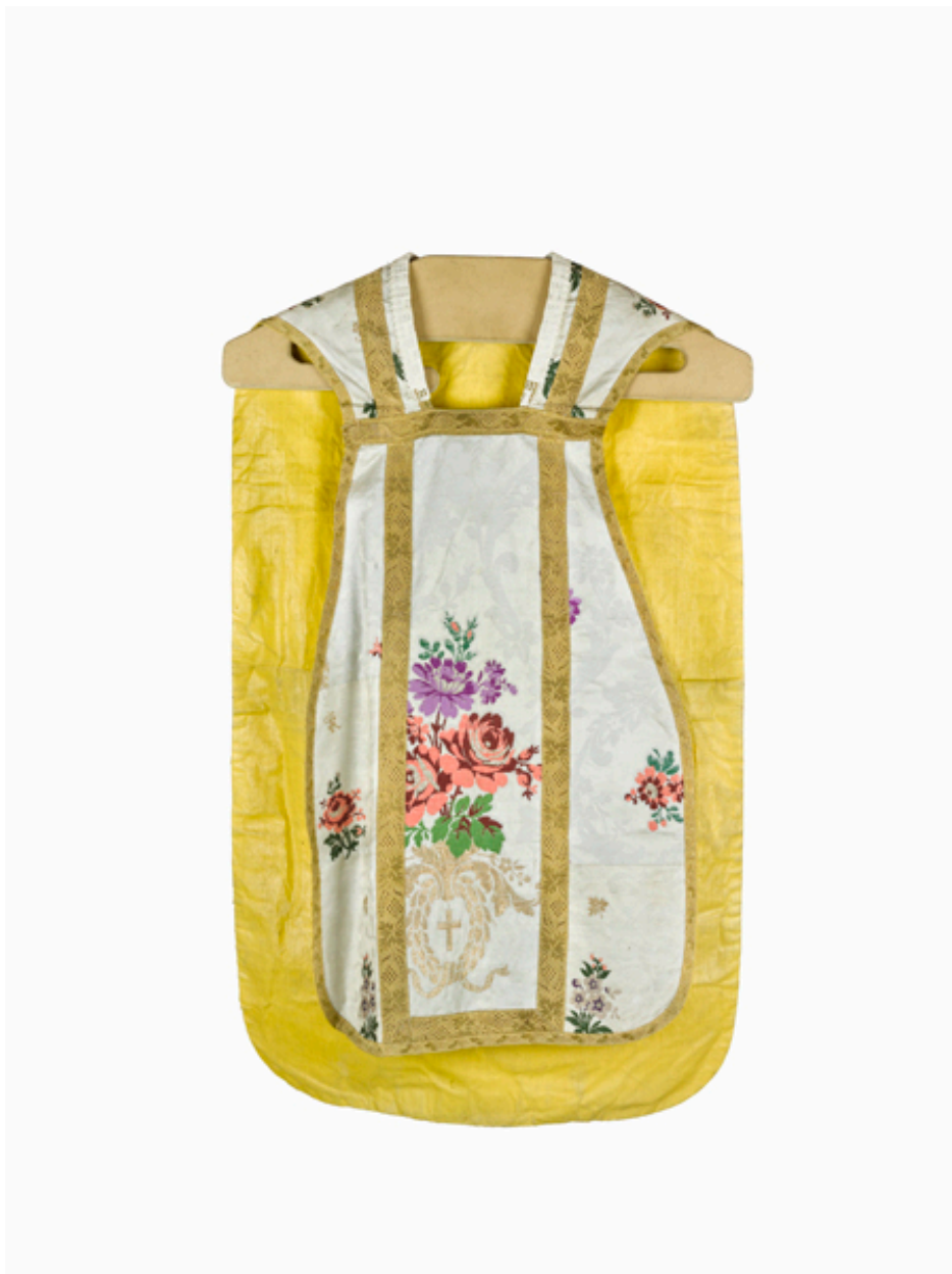
Vue du devant de la chasuble