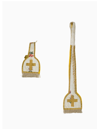
Vue de l'étole et du manipule IVR84_20181500362NUC4A