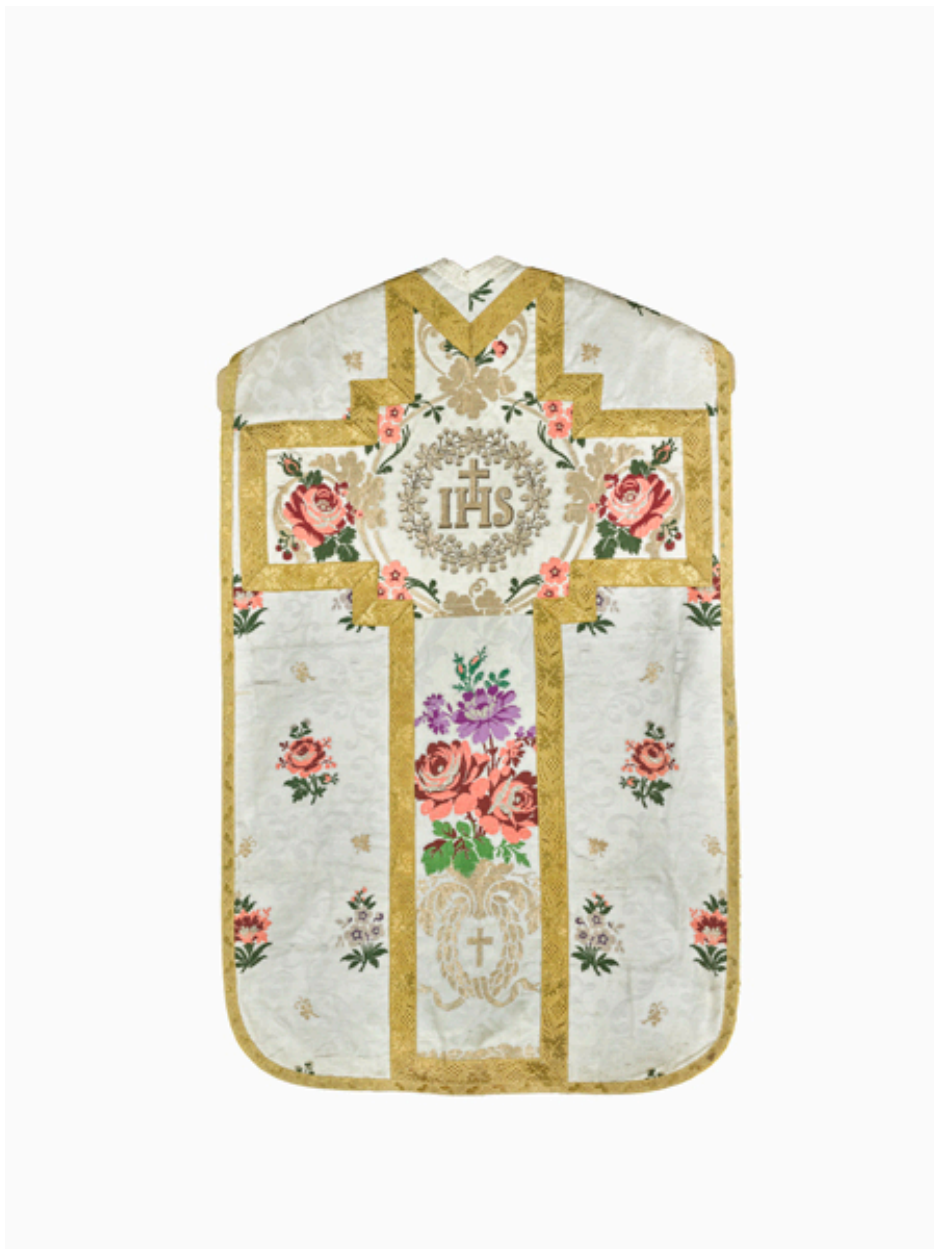
Vue du dos de la chasuble