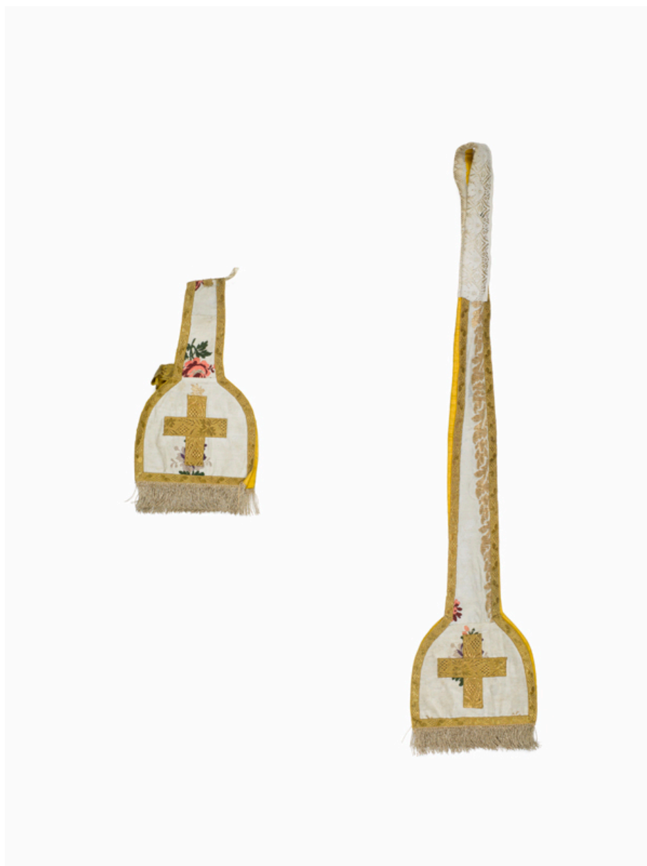
Vue de l'étole et du manipule