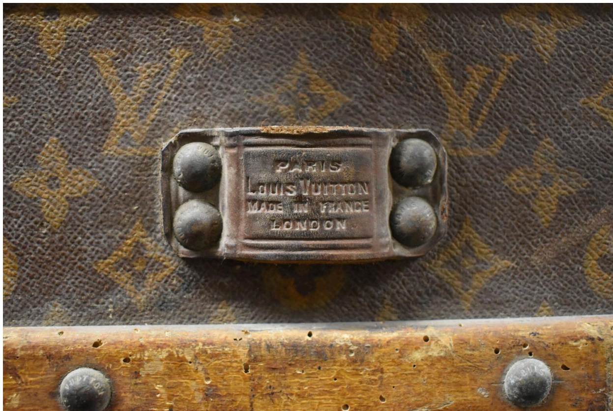
Détail - fabricant