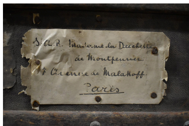
Détail - propriétaire IVR84_20226301084NUCA