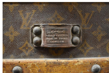
Détail - fabricant IVR84_20226301082NUCA