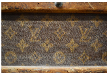
Détail