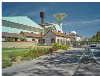
Vue sud du site IVR84_20180300001NUC4A