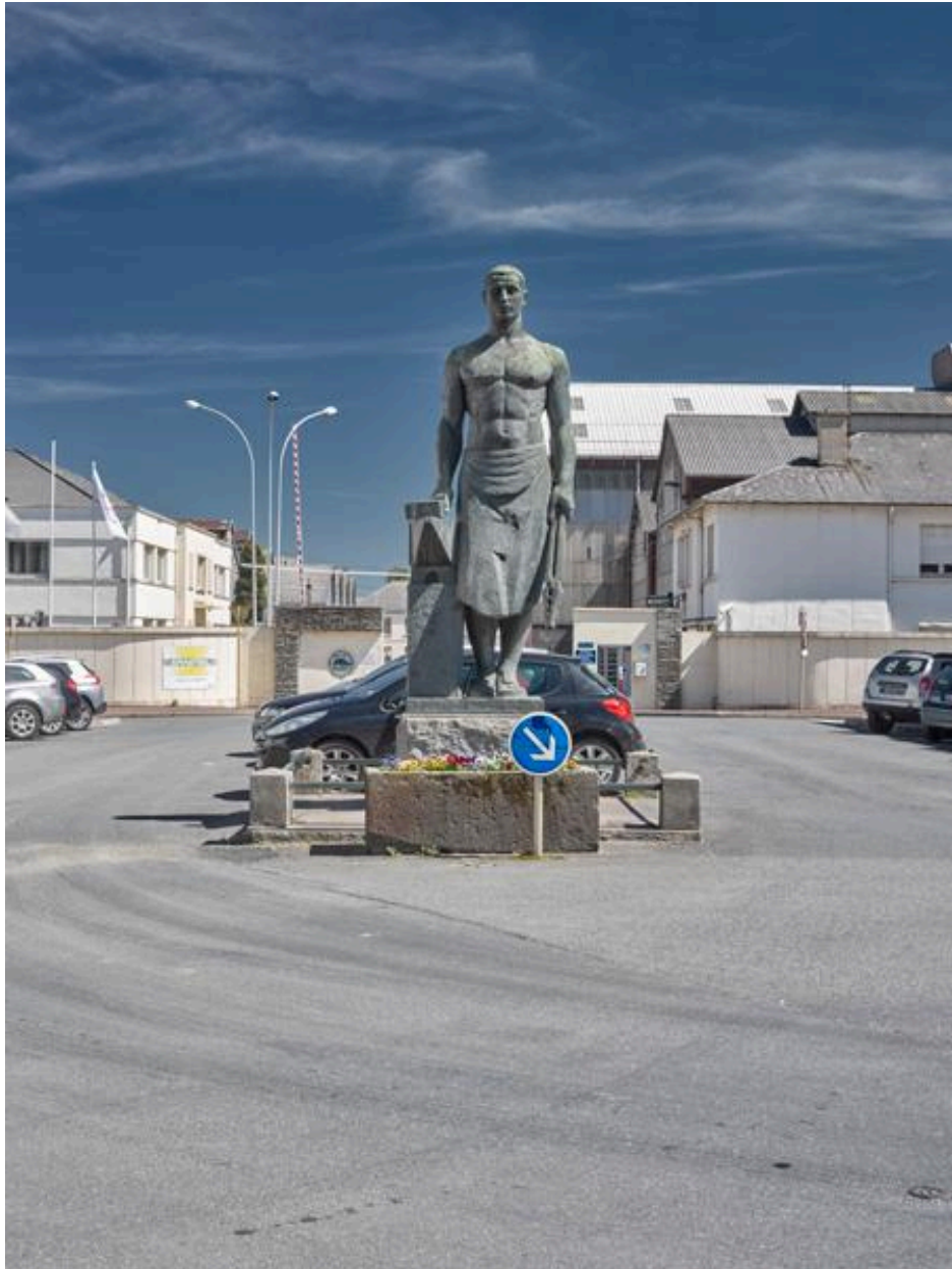
Sculpture monumentale sur la place Martenot