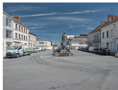
Entrée principale à l'ouest place Martinot