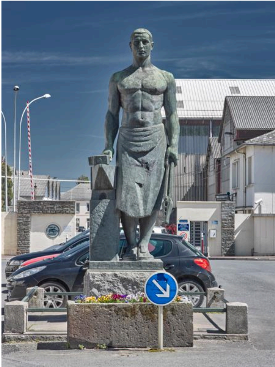
« Le Forgeron », symbole de l'activité industrielle de Commentry.