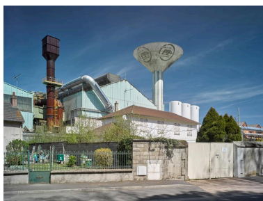
Détail vue sud : château d'eau et cheminée IVR84_20180300002NUC4A