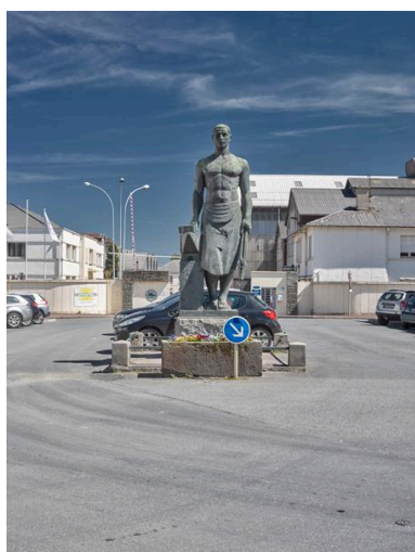
Sculpture monumentale sur la place Martinot