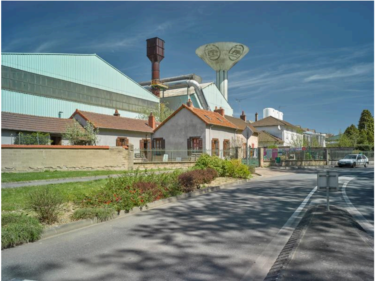
Vue sud du site