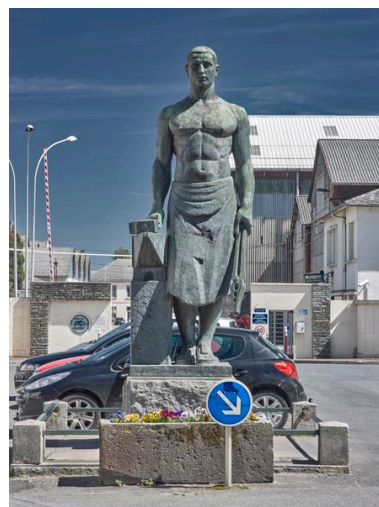
« Le Forgeron », symbole de l'activité industrielle de Commentry.