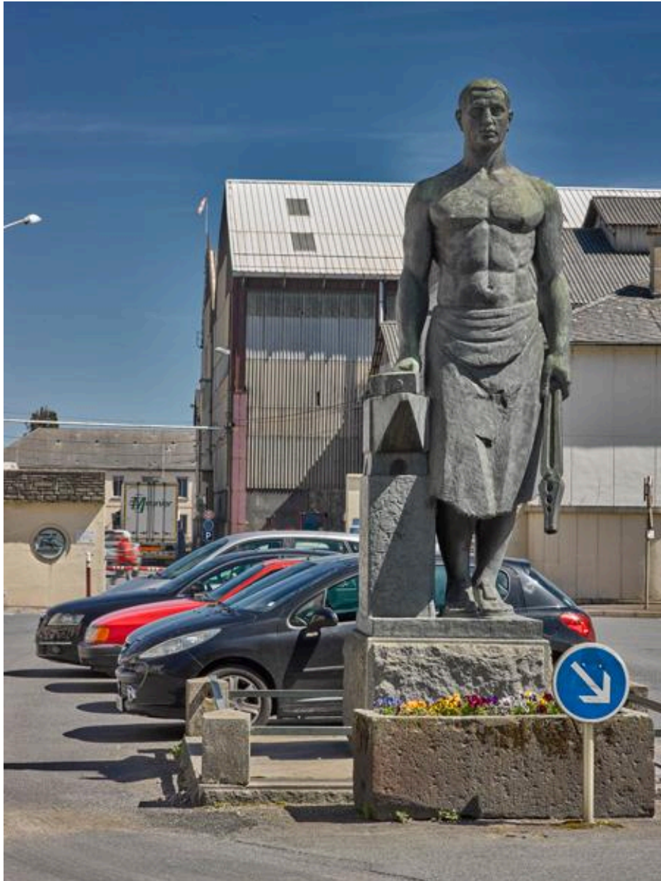
Le Forgeron : sculpture monumentale classée monuments historiques