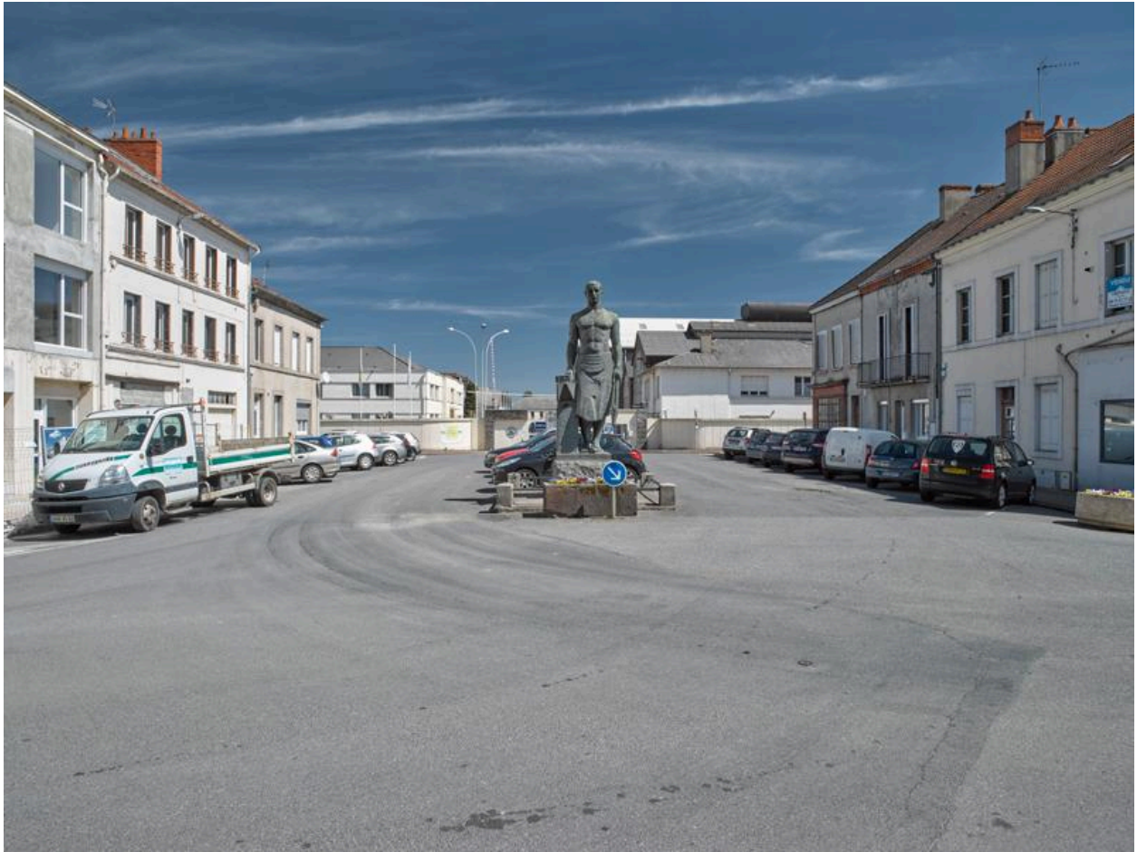
Entrée principale à l'ouest place Martenot