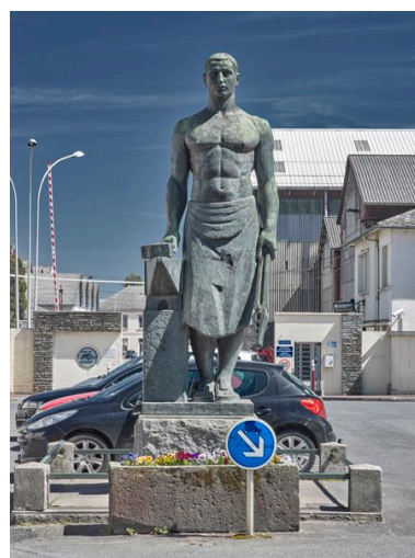
« Le Forgeron », symbole de l'activité industrielle de Commentry. IVR84_20180300004NUC4A