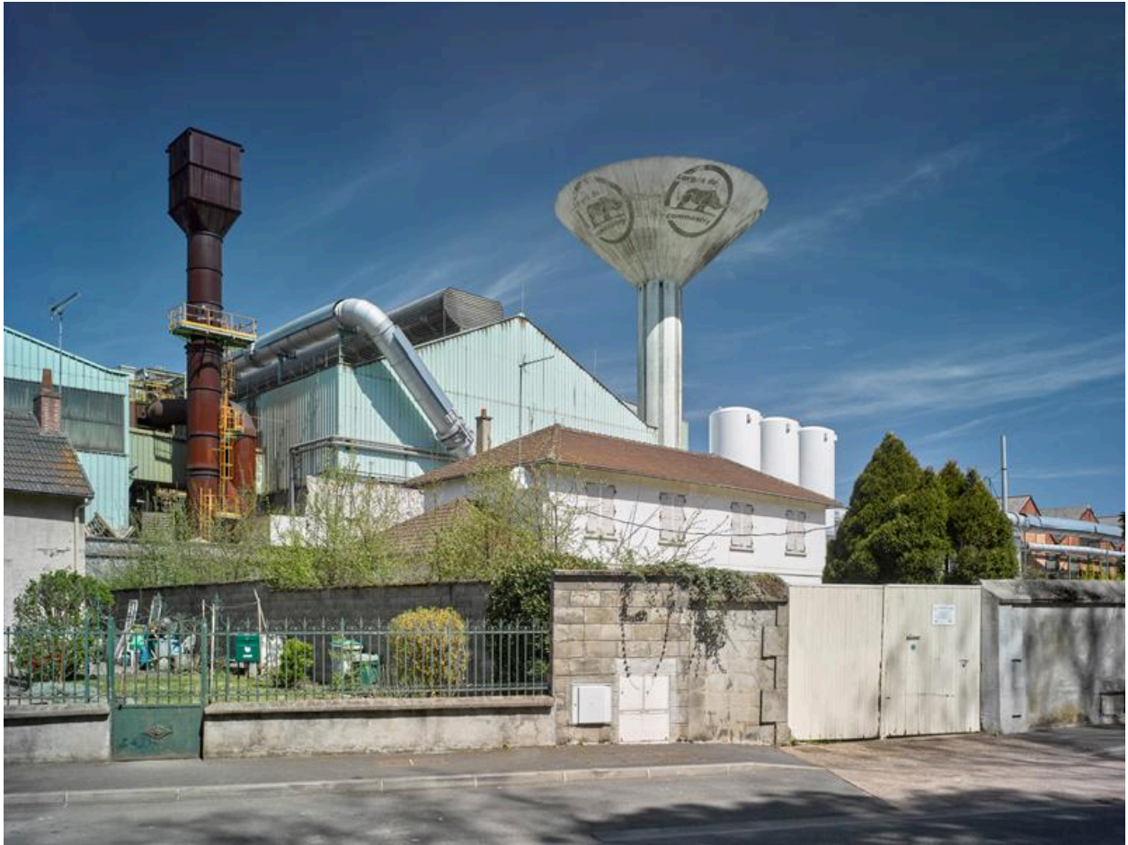
Détail vue sud : château d'eau et cheminée