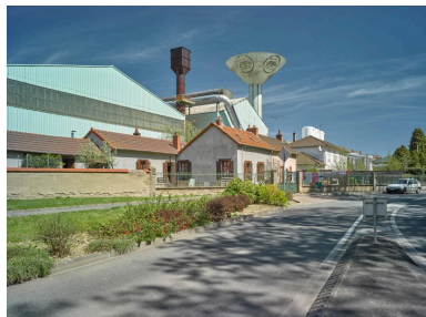
Vue sud du site IVR84_20180300001NUC4A