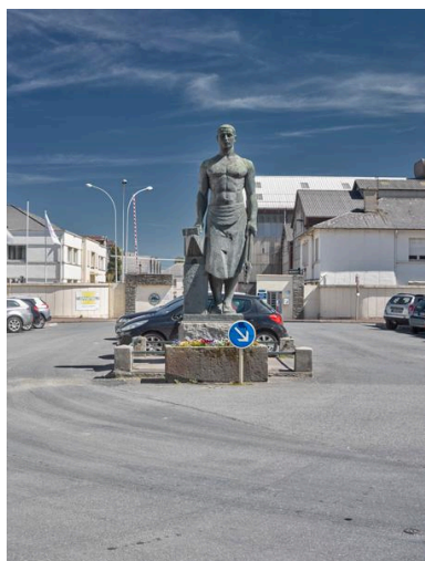
Sculpture monumentale sur la place Martinot