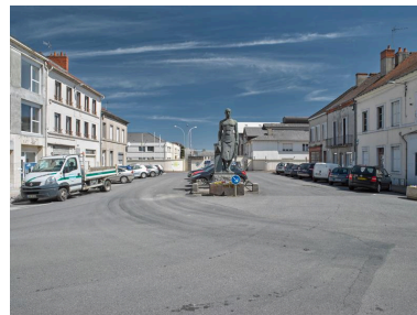
Entrée principale à l'ouest place Martinot IVR84_20180300006NUC4A