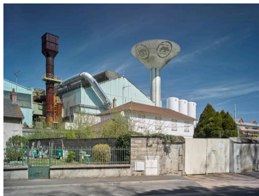
Détail vue sud : château d'eau et cheminée IVR84_20180300002NUC4A