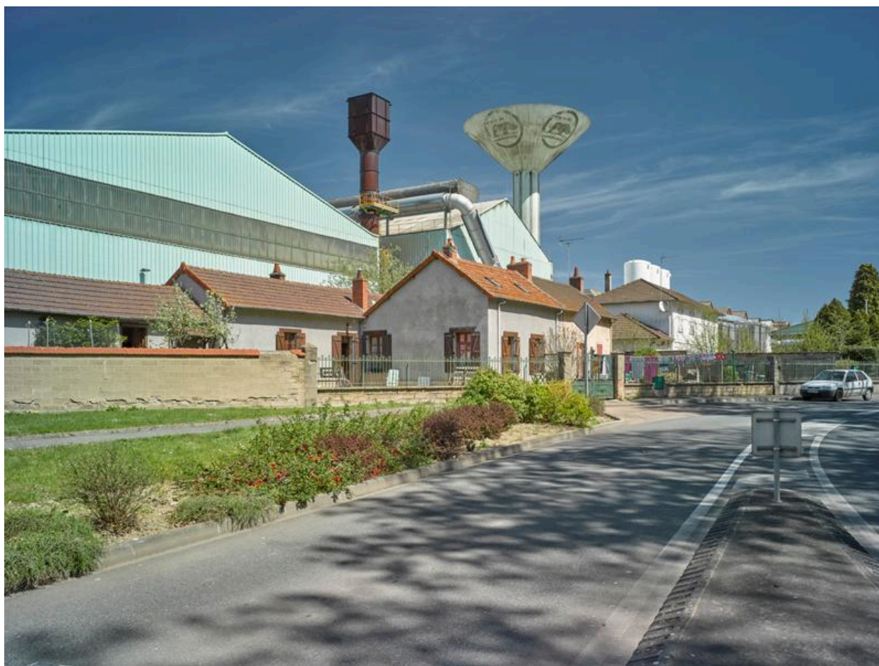
Vue sud du site