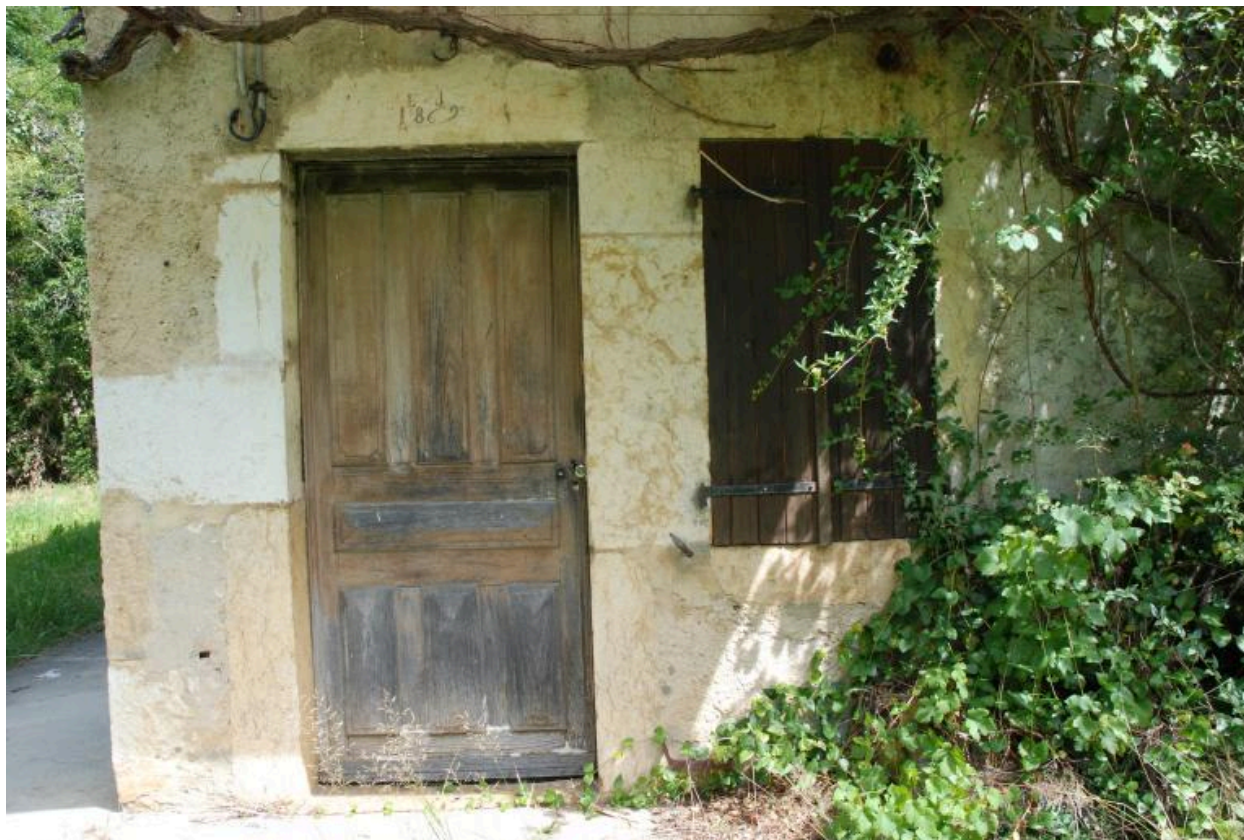
Détail de la porte d'accès du logis de la parcelle 483.