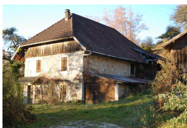
Vue d'ensemble de trois-quarts arrière gauche du corps de bâtiment.