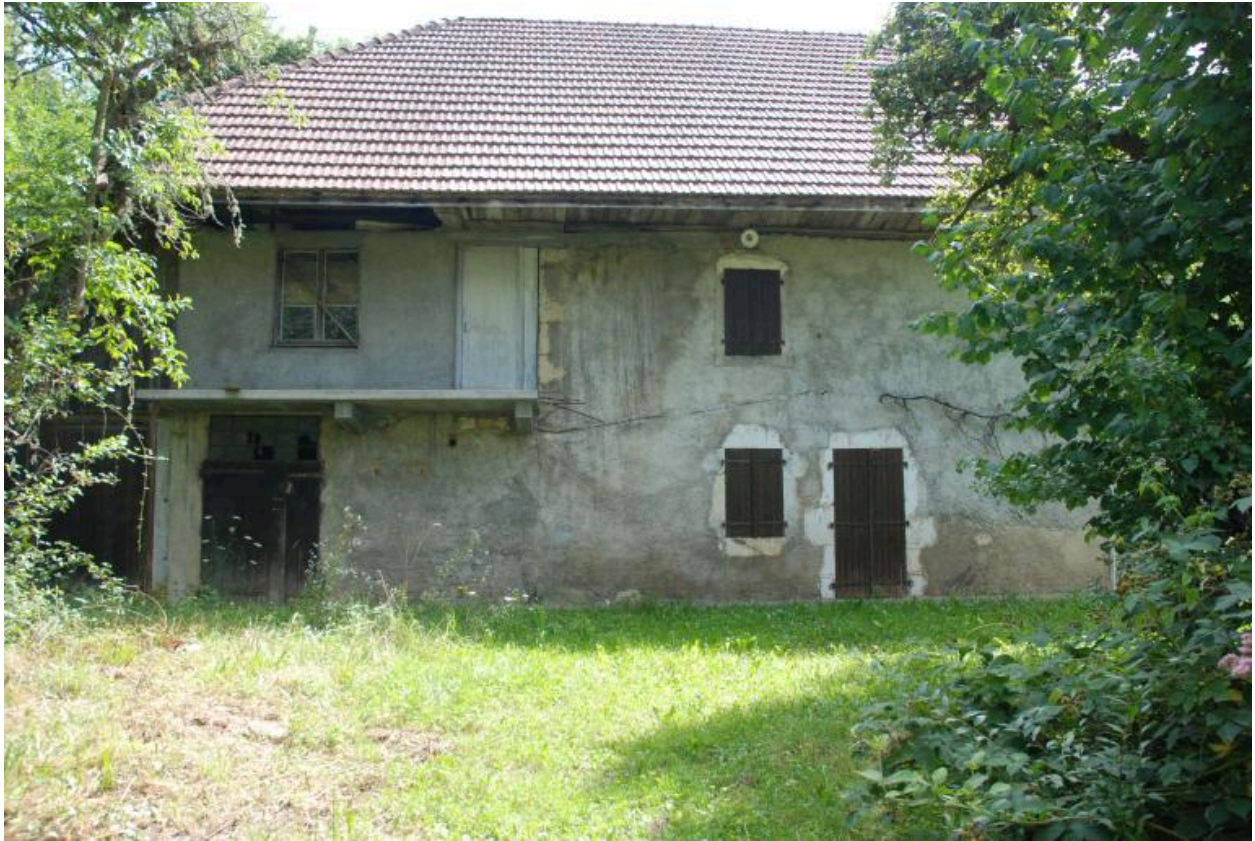
Vue d'ensemble de la façade ouest de la parcelle 957.