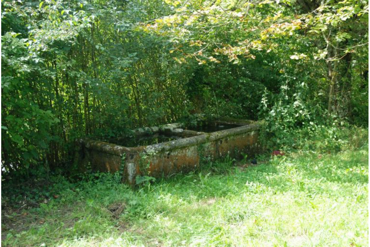
Vue d'ensemble du bassin en pierre.