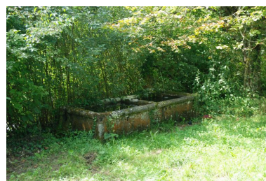
Vue d'ensemble du bassin en pierre.