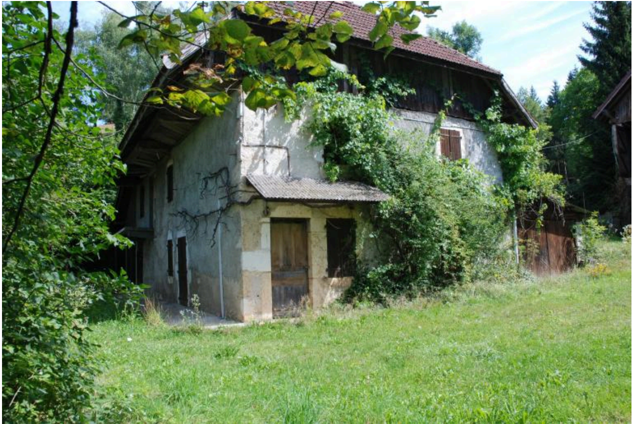
Vue d'ensemble de trois-quarts avant droit du corps de bâtiment.