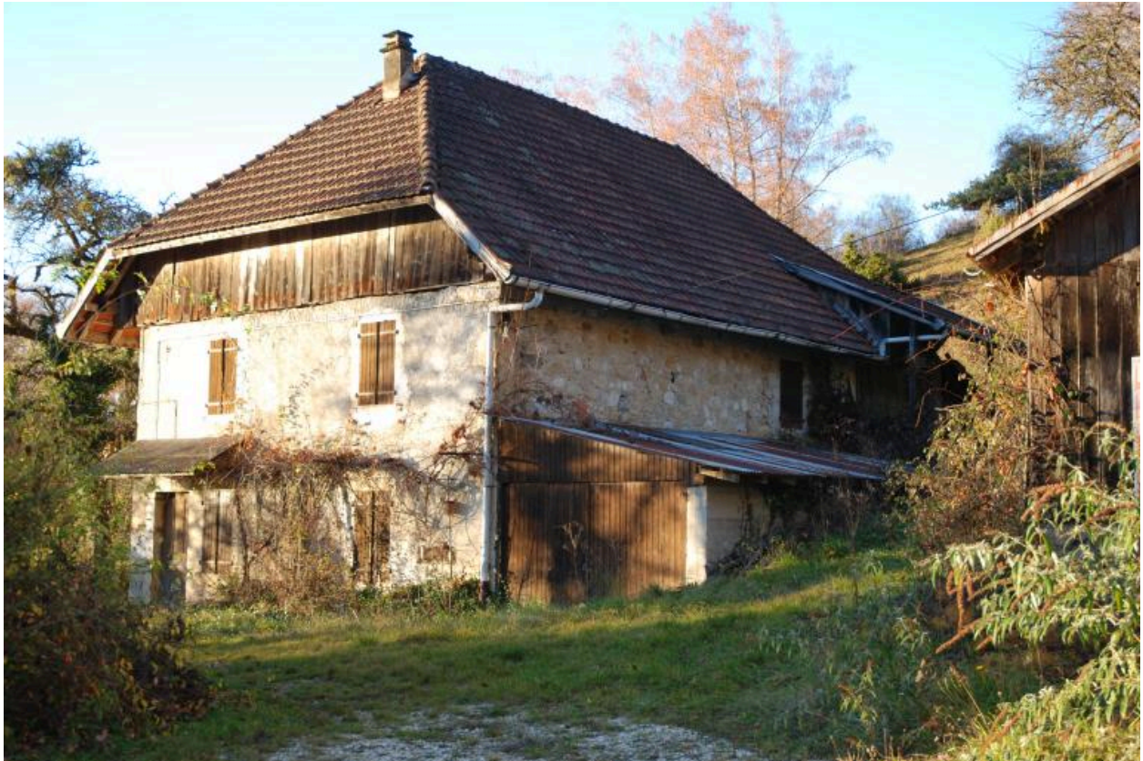
Vue d'ensemble de trois-quarts arrière gauche du corps de bâtiment.