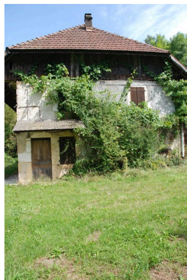
Vue d'ensemble de la façade de la parcelle 483, sur le mur pignon sud du corps de bâtiment. IVR84_20207401921NUCA