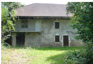
Vue d'ensemble de la façade ouest de la parcelle 957. IVR84_20207401920NUCA