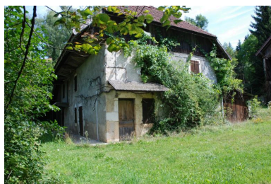
Vue d'ensemble de trois-quarts avant droit du corps de bâtiment.