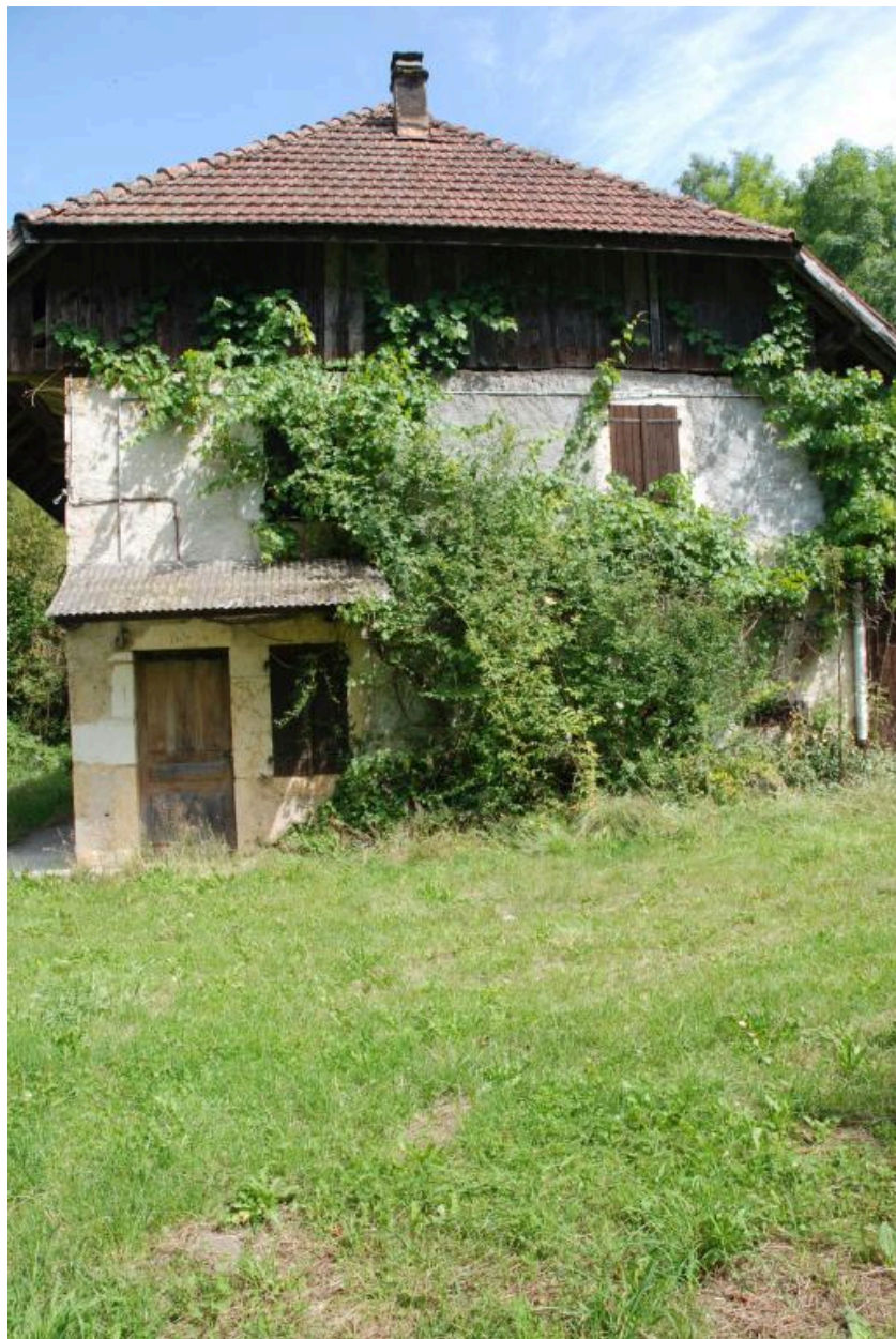
Vue d'ensemble de la façade de la parcelle 483, sur le mur pignon sud du corps de bâtiment.