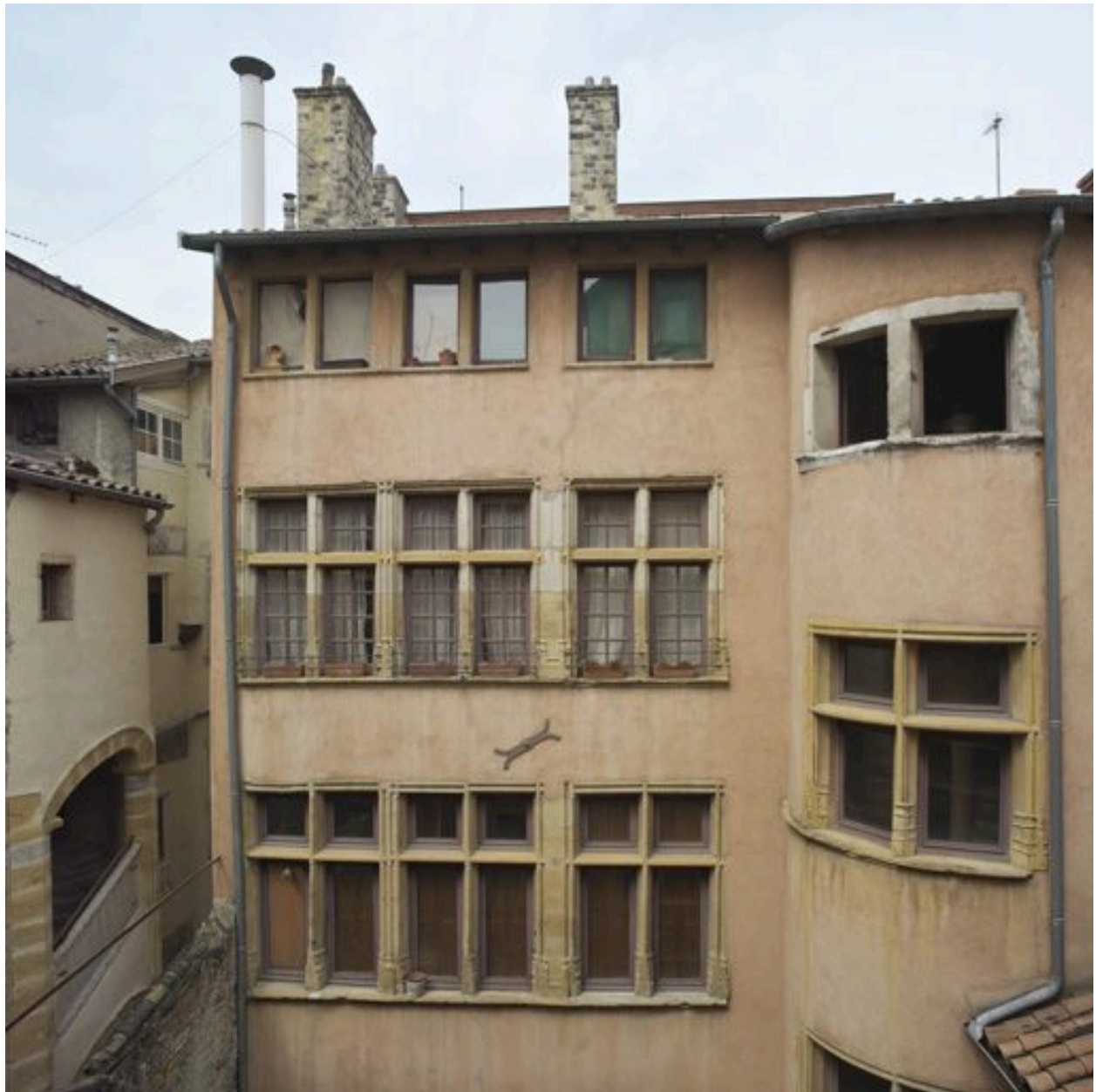
Tout à fait à gauche, la cage d'escalier, la cour et la façade sur cour, depuis la parcelle AE 10 (58 rue Mercière)