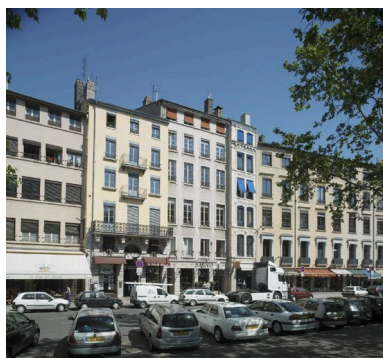
Vue de situation de l'élévation donnant sur le quai Saint- Antoine : il s'agit du quatrième immeuble à partir de la gauche