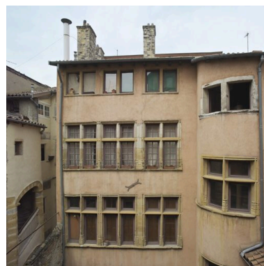
Tout à fait à gauche, la cage d'escalier, la cour et la façade sur cour, depuis la parcelle AE 10 (58 rue Mercière)