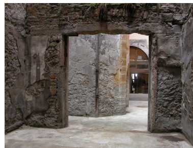
La cour : le rez-de-chaussée IVR82_20066901430NUCA