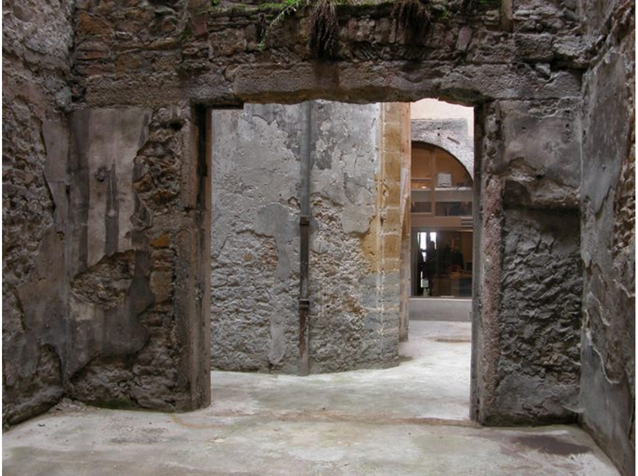
La cour : le rez-de-chaussée