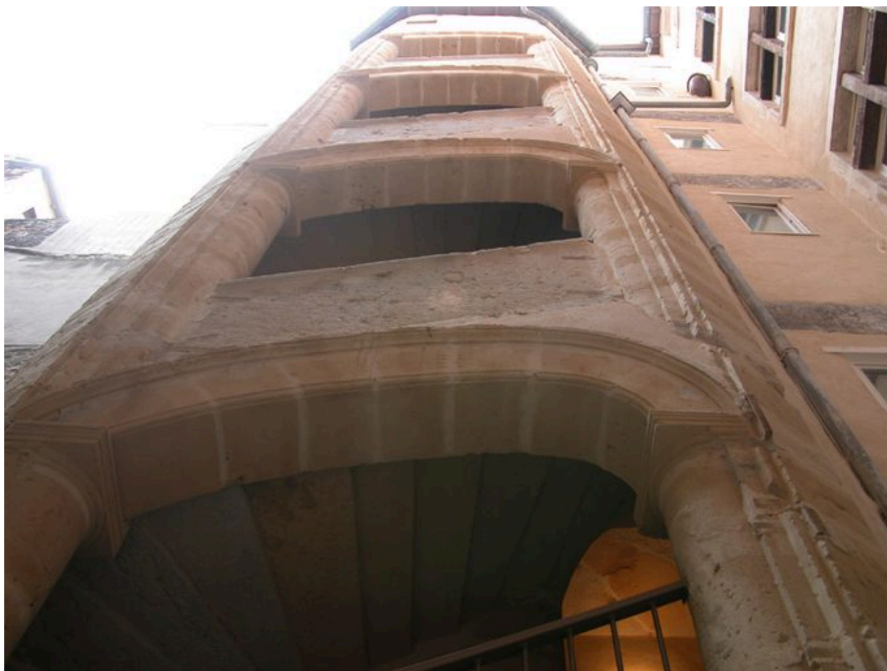
La cage d'escalier depuis la cour