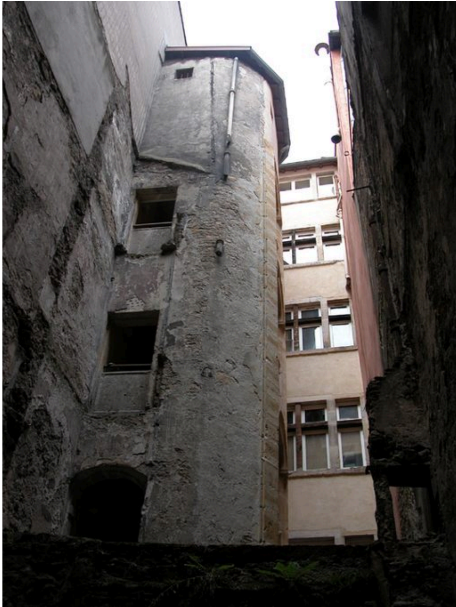
Vue générale des élévations postérieures depuis la cour du 60 rue Mercière