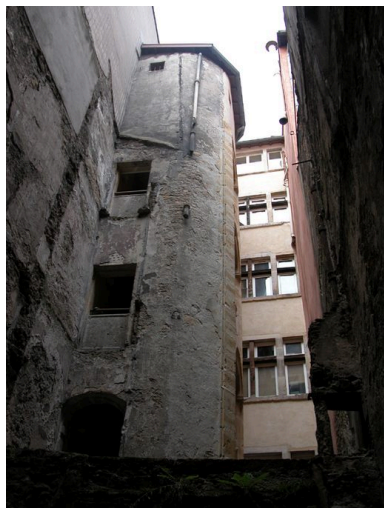
Vue générale des élévations postérieures depuis la cour du 60 rue Mercière