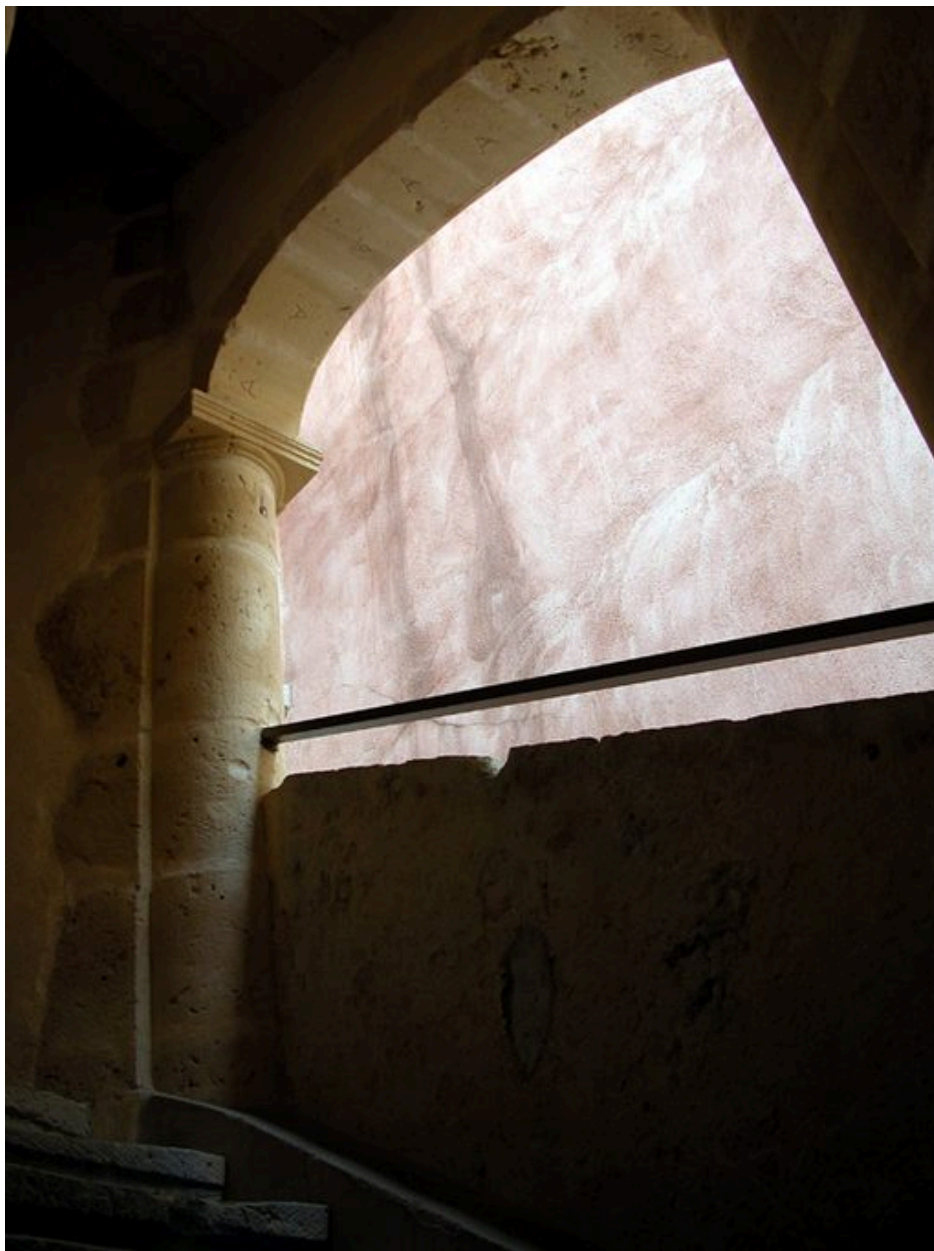
L'escalier : détail d'une arcade et de sa colonne