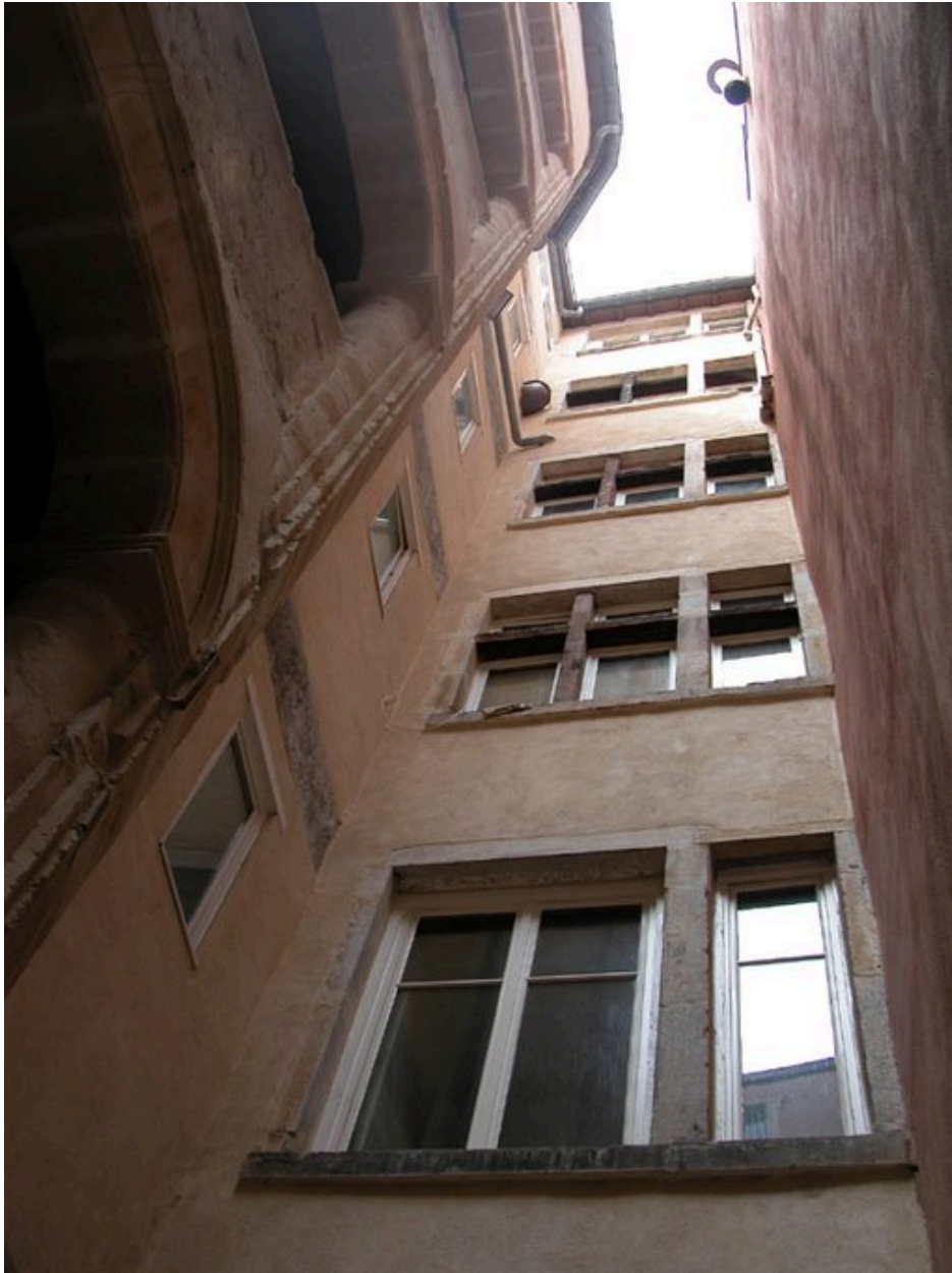
Elévation sur cour du corps de bâtiment principal : partie supérieure