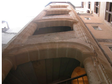
La cage d'escalier depuis la cour