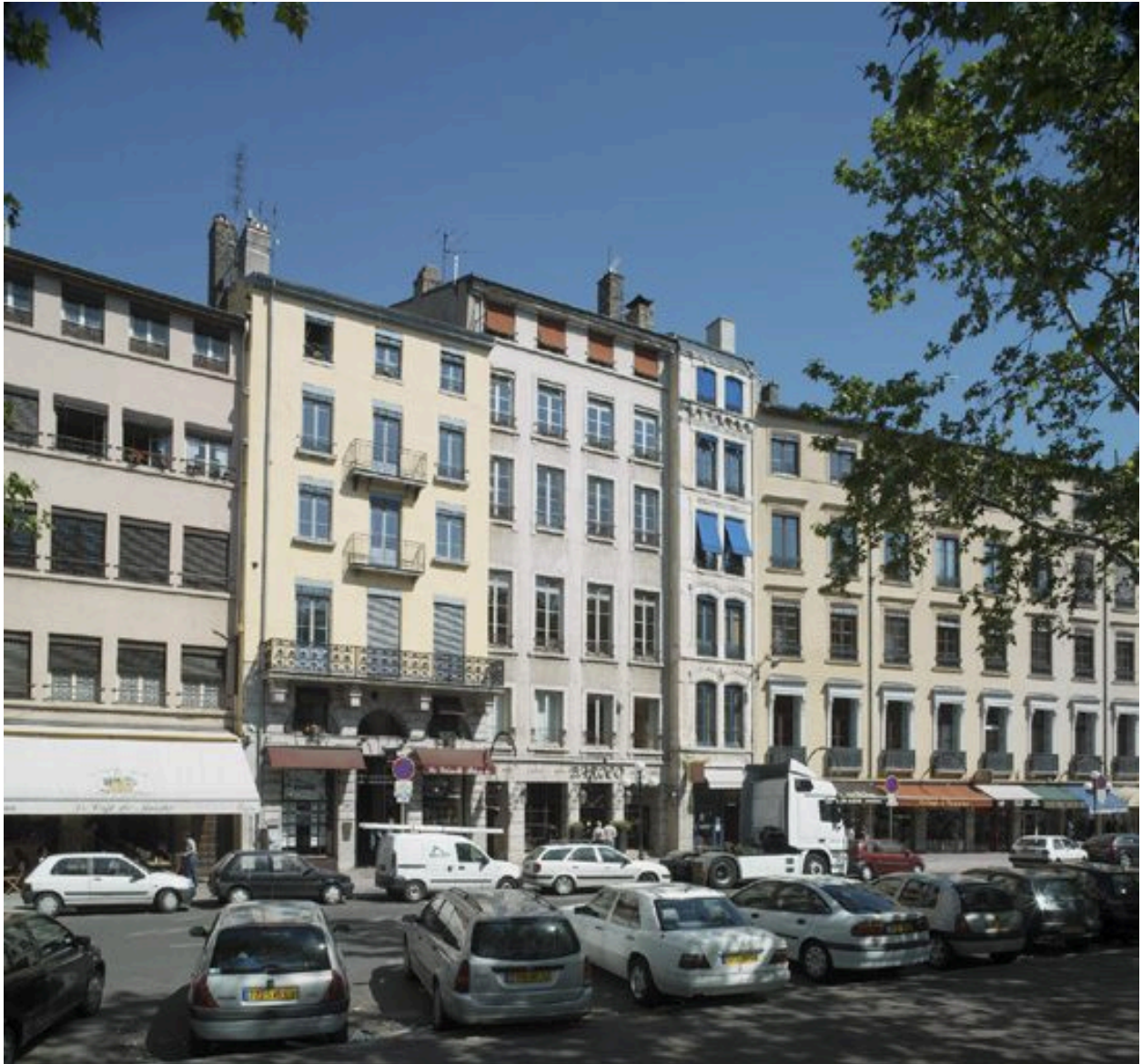
Vue de situation de l'élévation donnant sur le quai Saint-Antoine : il s'agit du quatrième immeuble à partir de la gauche