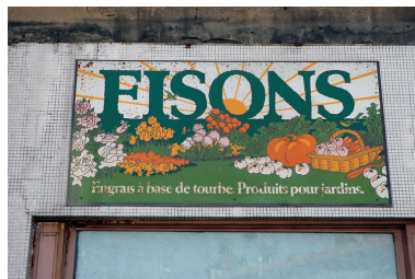
Boutique : détail de l'enseigne IVR82_20076900193NUCA