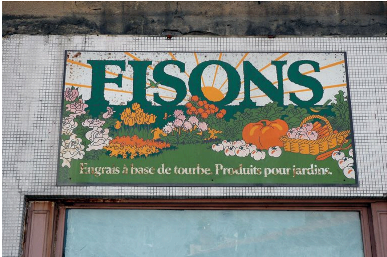
Boutique : détail de l'enseigne