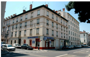
Vue de situation IVR82_20076900192NUCA