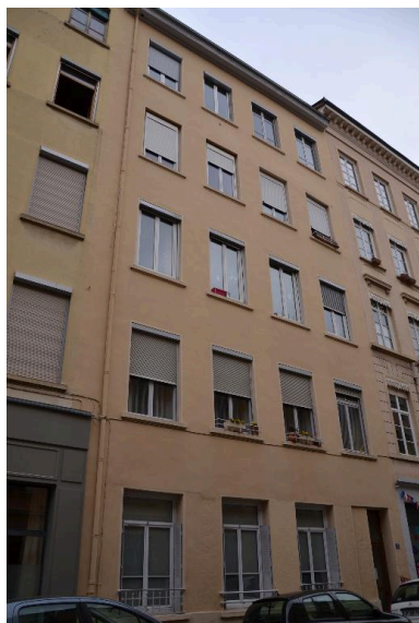
Vue d'ensemble façade sud IVR82_20156900550NUCA