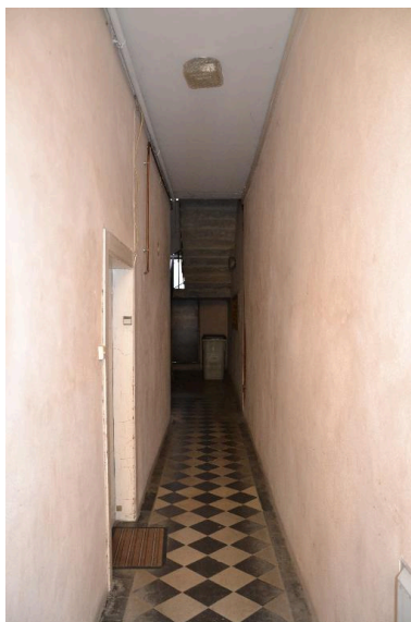
Entrée IVR82_20156900551NUCA