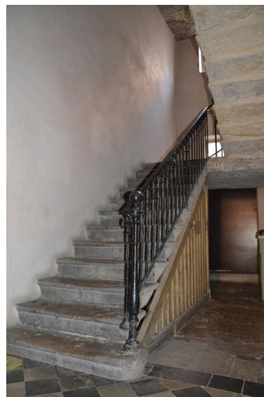
Départ escalier IVR82_20156900552NUCA