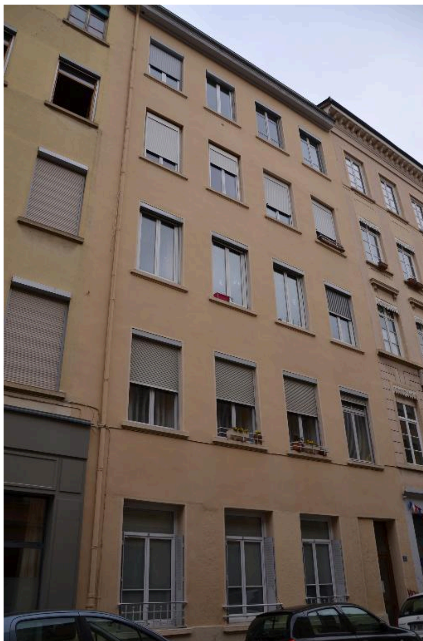
Vue d'ensemble façade sud