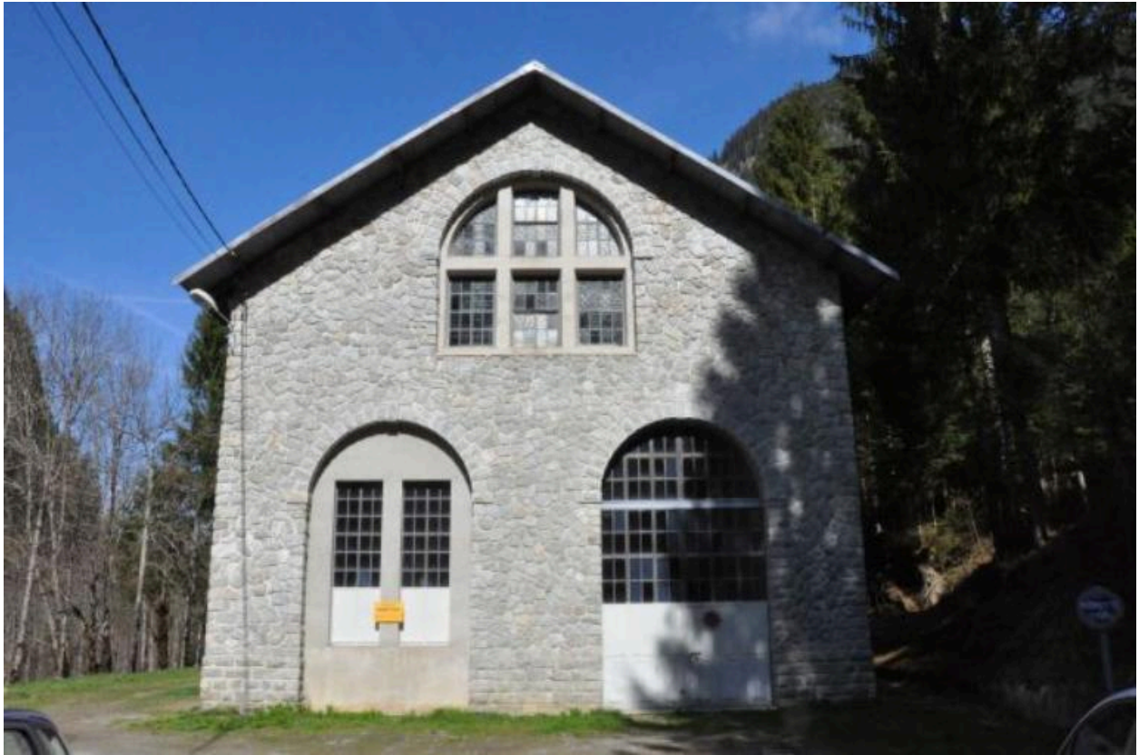
Pignon sud-est de la centrale.