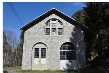
Pignon sud-est de la centrale. IVR84_20177301093NUCA