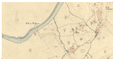
Premier cadastre français, Beaufort, 1935, Section E, feuille 9 (FR.AD073, 3P 7400). IVR84_20177301085NUCA