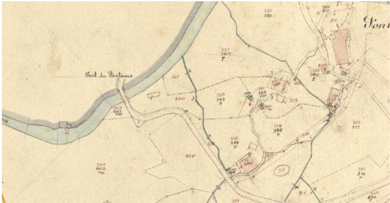
Premier cadastre français, Beaufort, 1935, Section E, feuille 9 (FR.AD073, 3P 7400).