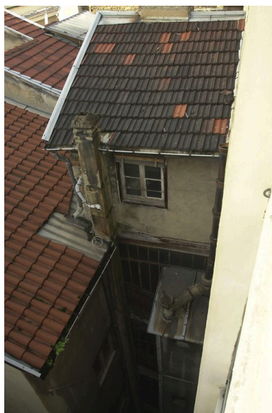
La cage d'escalier depuis l'escalier de l'immeuble sis 10 rue de l'Ancienne-Préfecture IVR82_20076901208NUCA