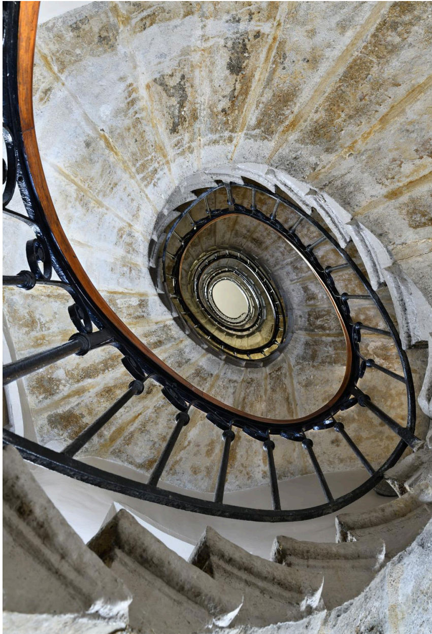
L'escalier : vue en contre-plongée