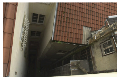
A droite, la cour depuis l'escalier de l'immeuble sis 10 rue de l'Ancienne-Préfecture