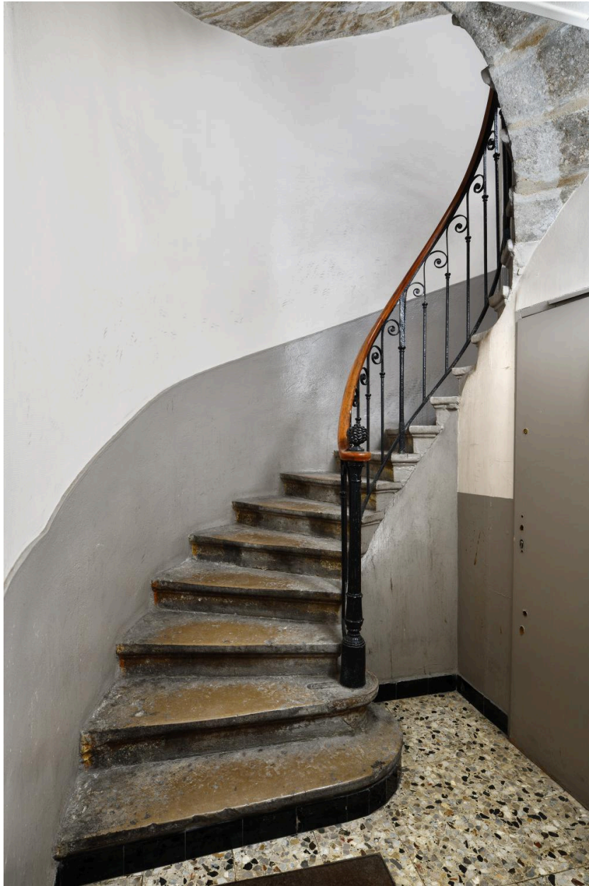
L'escalier : départ