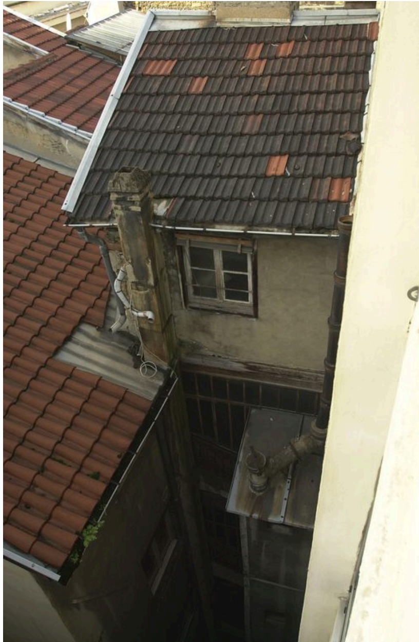
La cage d'escalier depuis l'escalier de l'immeuble sis 10 rue de l'Ancienne-Préfecture