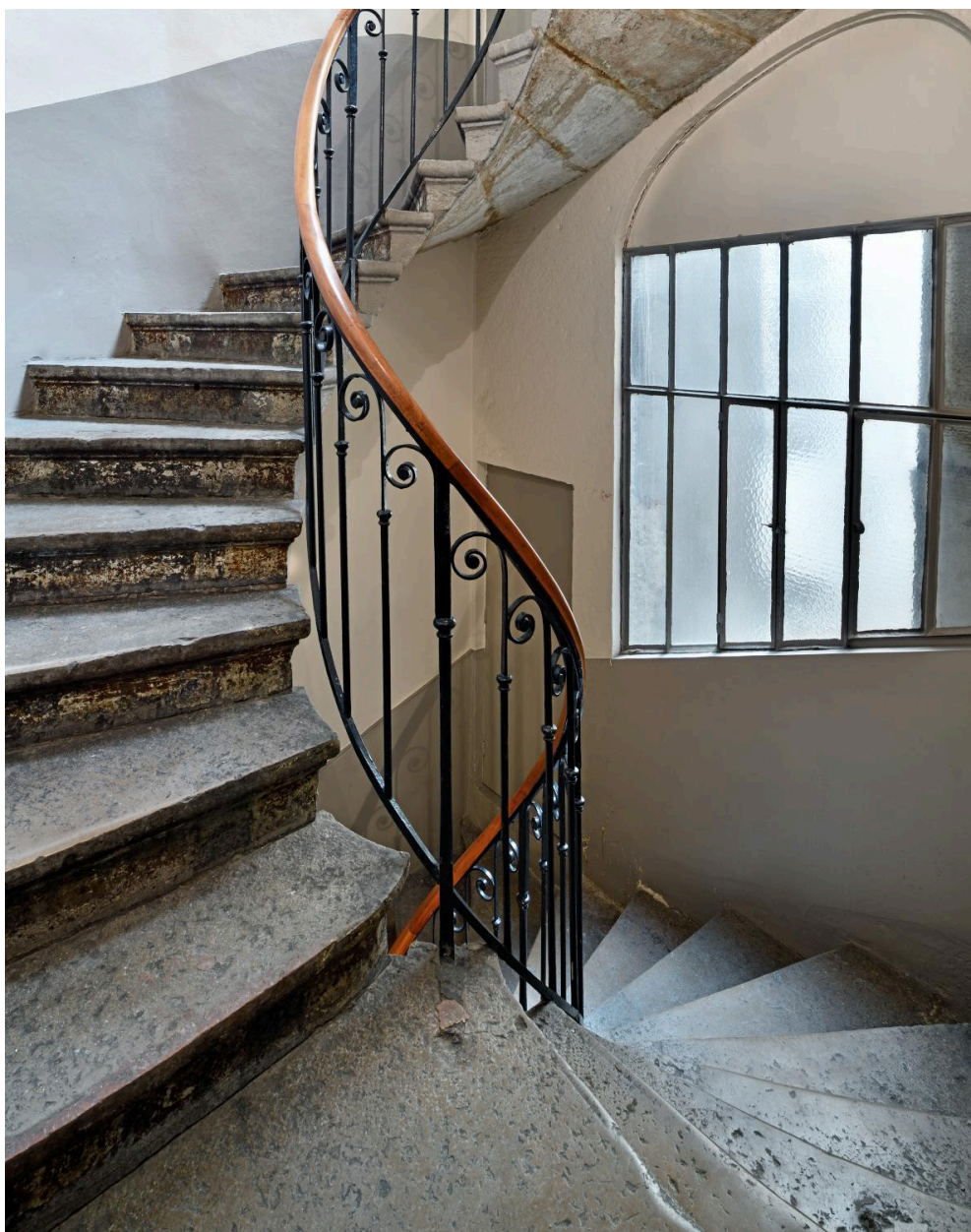
L'escalier : une volée