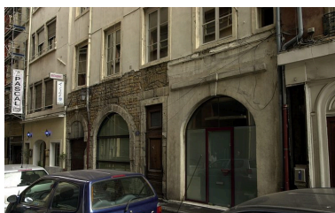
Au fond, les rez-de-chaussée et premier étage IVR82_20086901290NUCA