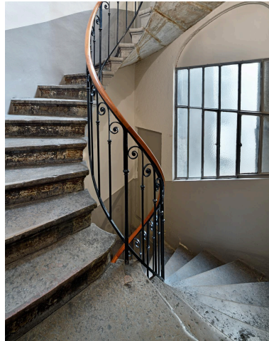
L'escalier : une volée IVR84_20226900519NUCAQ