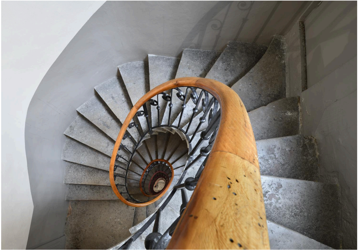
L'escalier : vue en plongée