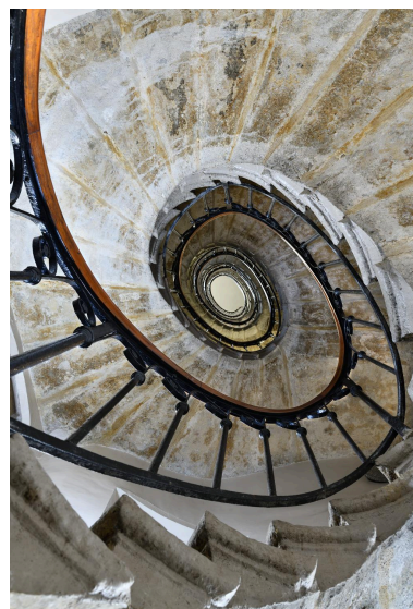
L'escalier : vue en contre-plongée IVR84_20226900532NUCAQ