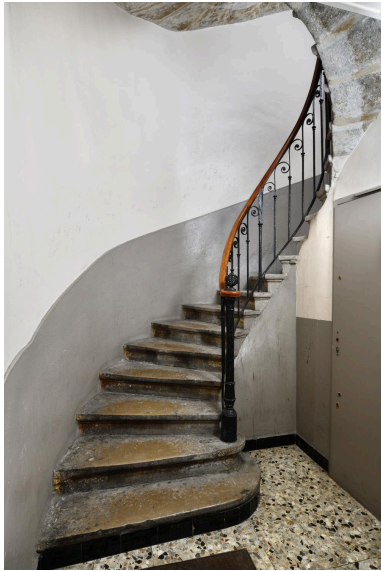
L'escalier : départ IVR84_20226900529NUCAQ