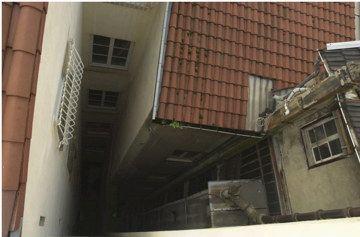
A droite, la cour depuis l'escalier de l'immeuble sis 10 rue de l'Ancienne-Préfecture