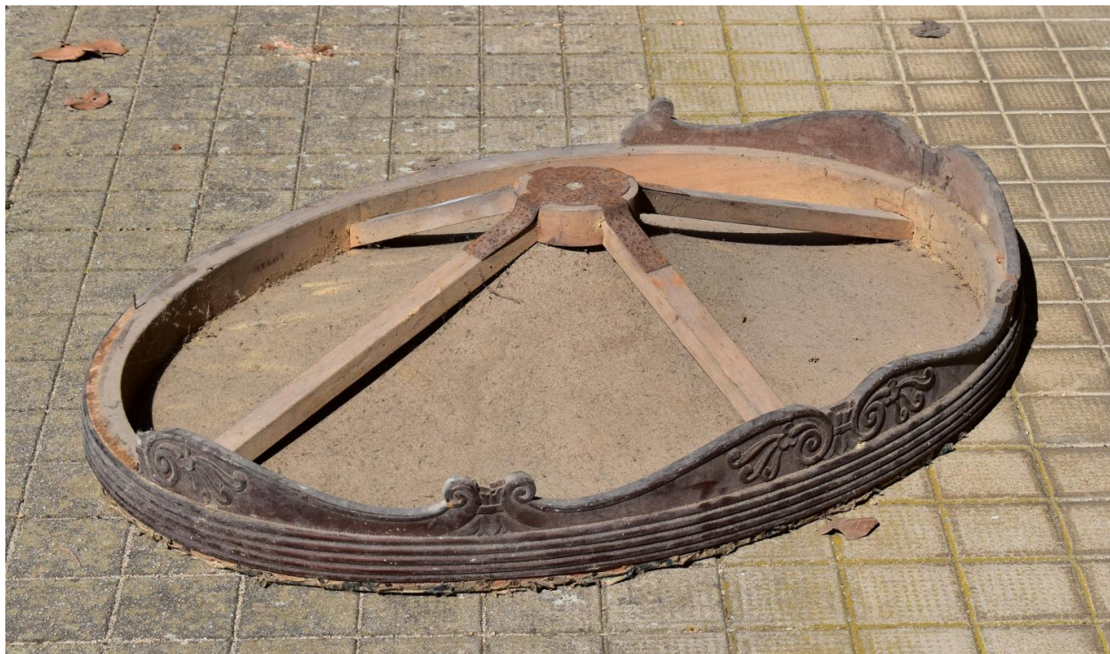
Vue de l'envers