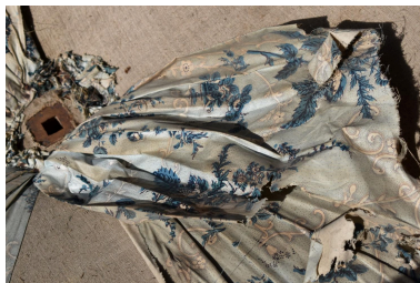
Vue de détail du tissu IVR84_20226300719NUC4A