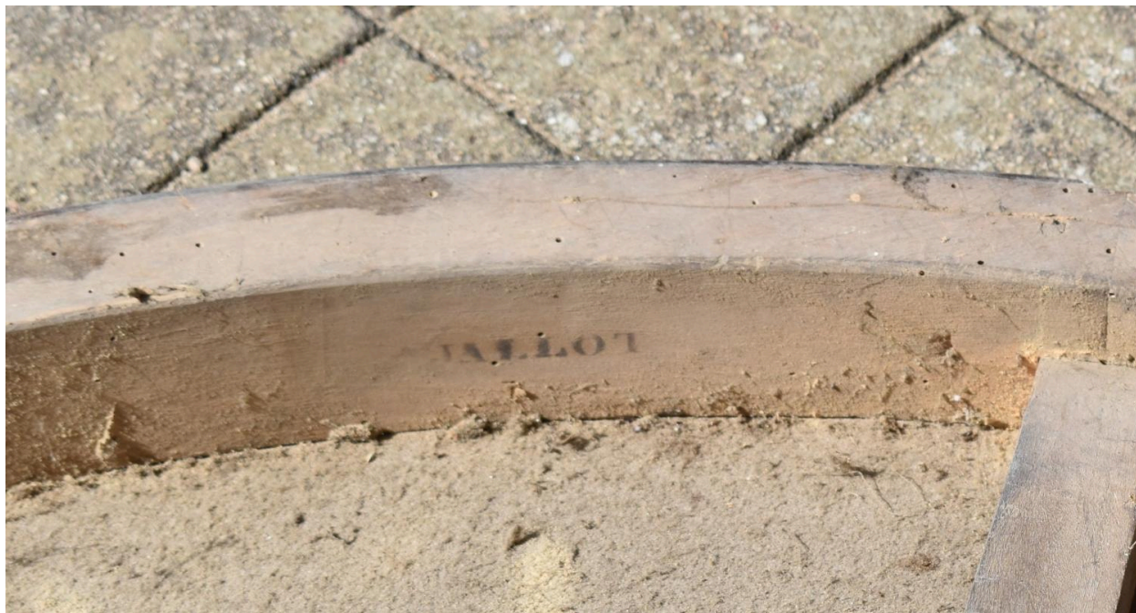
Vue d'une inscription sur l'envers