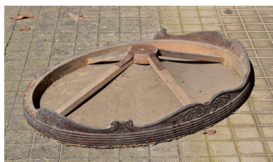
Vue de l'envers IVR84_20226300715NUC4A