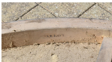
Vue d'une inscription sur l'envers IVR84_20226300716NUC4A