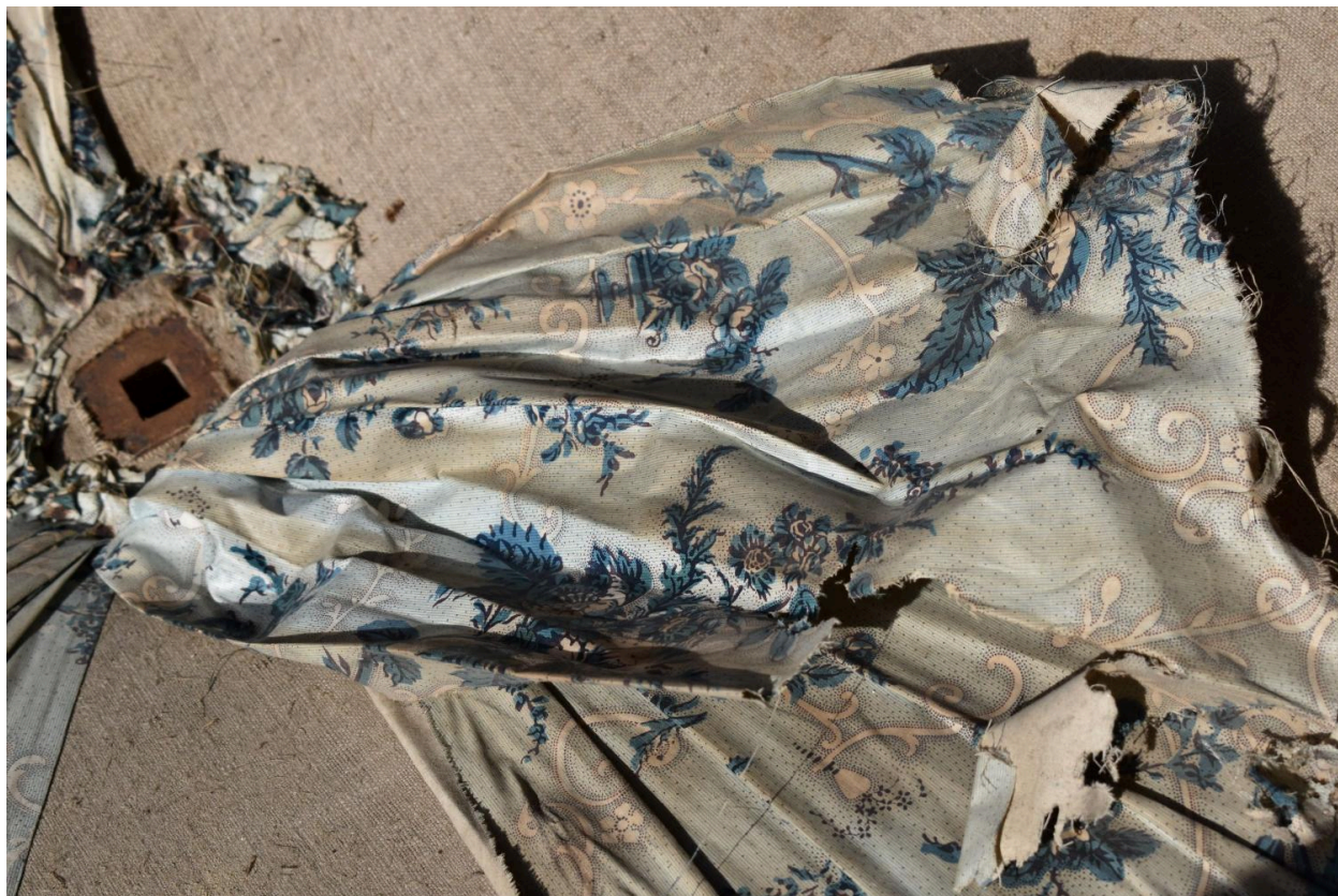
Vue de détail du tissu