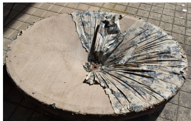
Vue générale IVR84_20226300718NUC4A