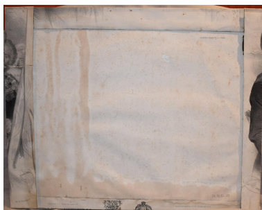
IVR84_20216300979NUCA