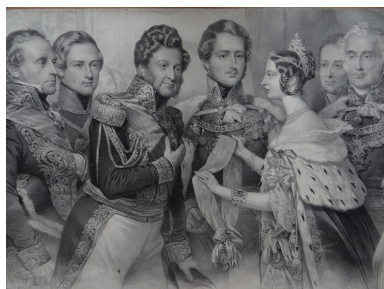
Détail IVR84_20216300978NUCA