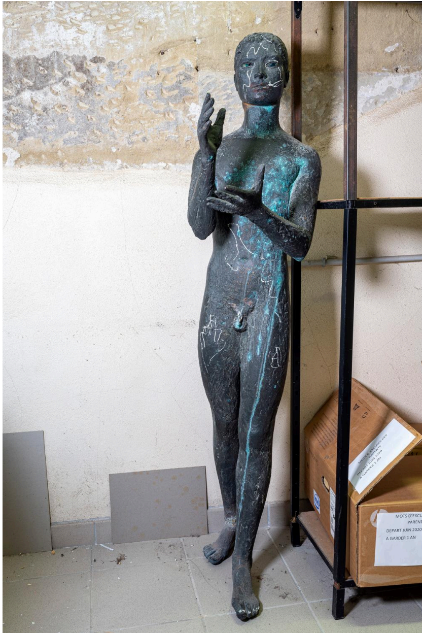
Vue d'ensemble de face.