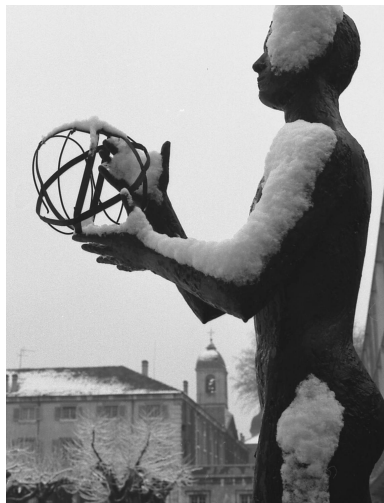
Vue partielle de l'oeuvre in situ, en 1976 (coll. part.)