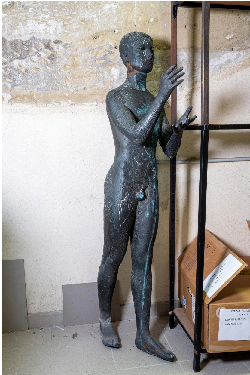
Vue d'ensemble (2020).