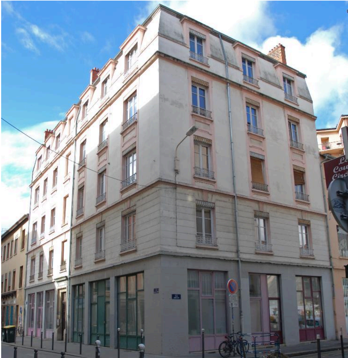
Vue d'ensemble depuis le nord est