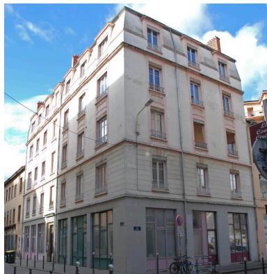
Vue d'ensemble depuis le nord est IVR84_20166901945NUCA