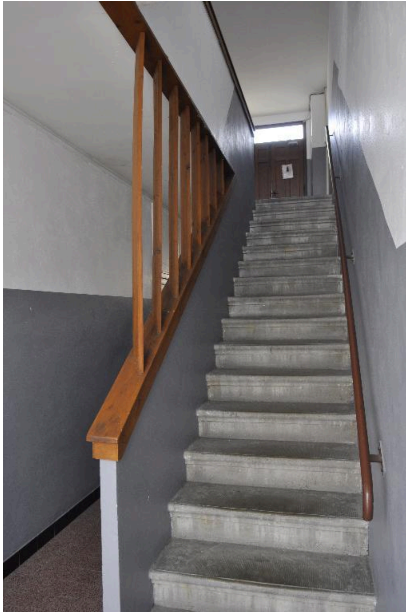
Vue intérieure, départ de l'escalier