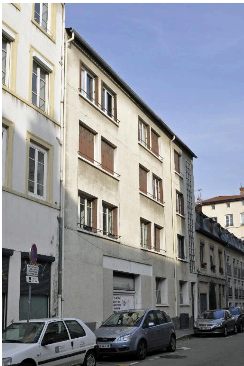
Elévation sur rue, vue générale