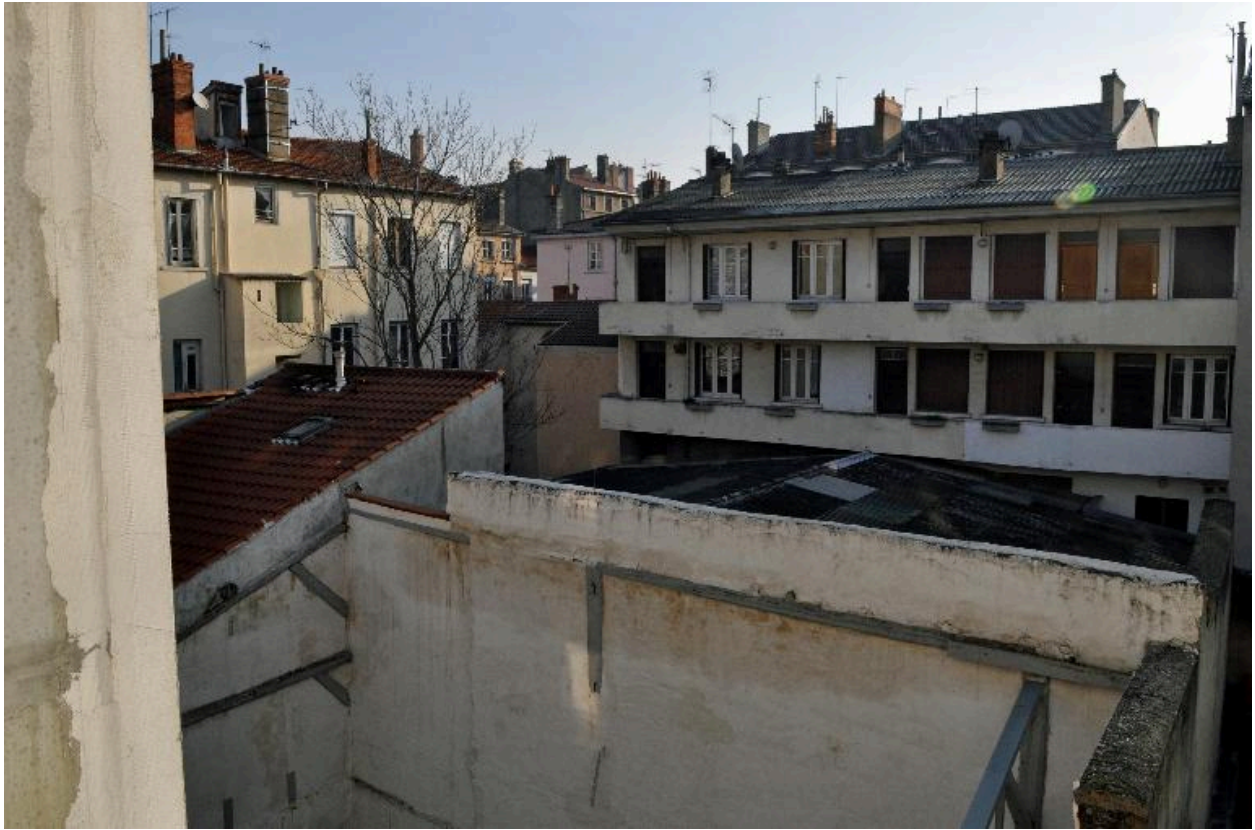
Elévation sur cour, distribution par galeries