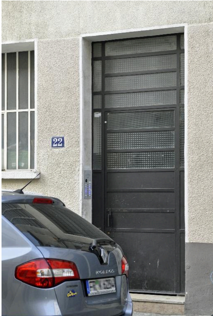
Vue de la porte d'entrée