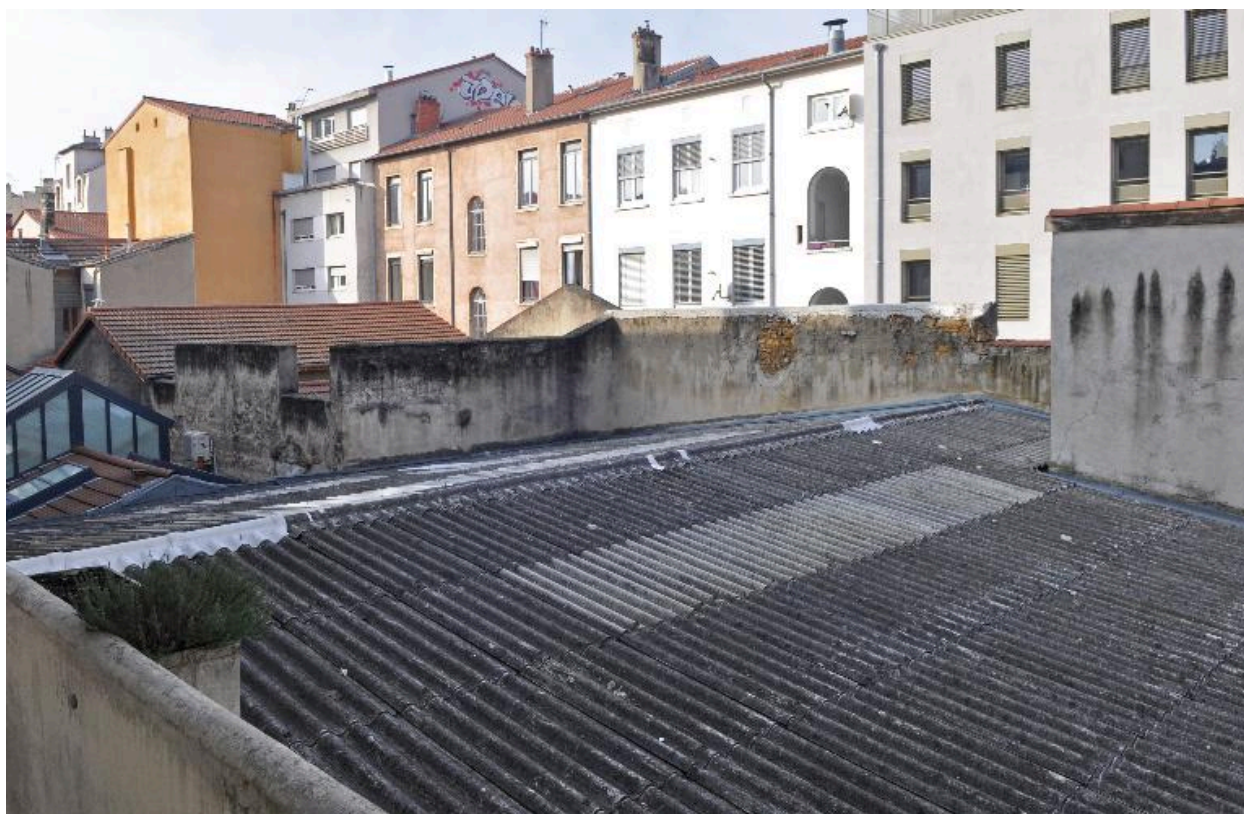
Hangar occupant le fond de parcelle