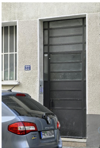
Vue de la porte d'entrée