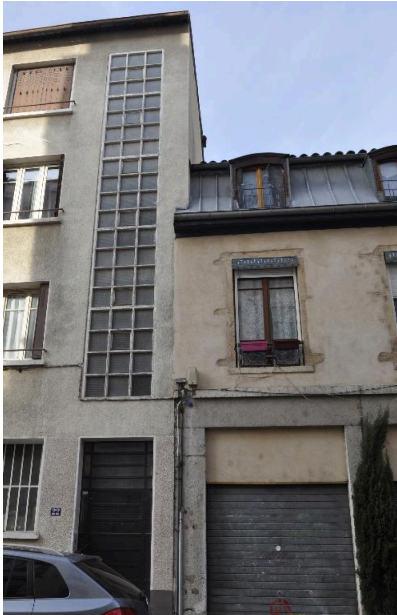
Elévation sur rue, vitrage éclairant l'escalier latéral en revers de façade