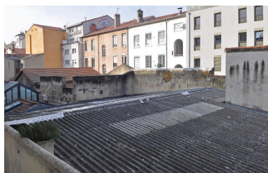
Hangar occupant le fond de parcelle