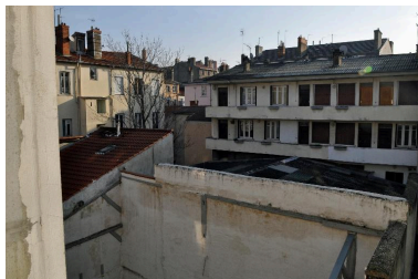
Elévation sur cour, distribution par galeries IVR84_20166902209NUCA