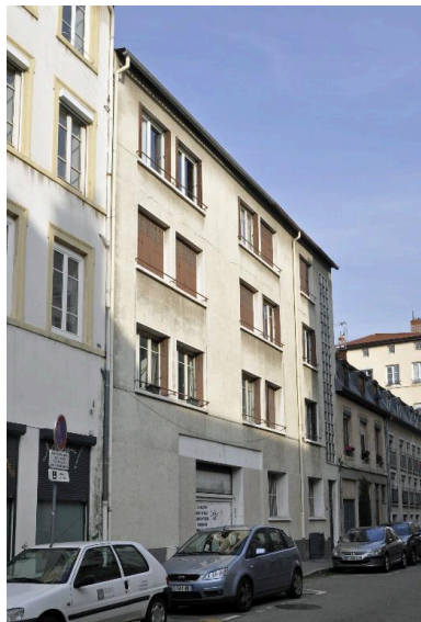
Elévation sur rue, vue générale