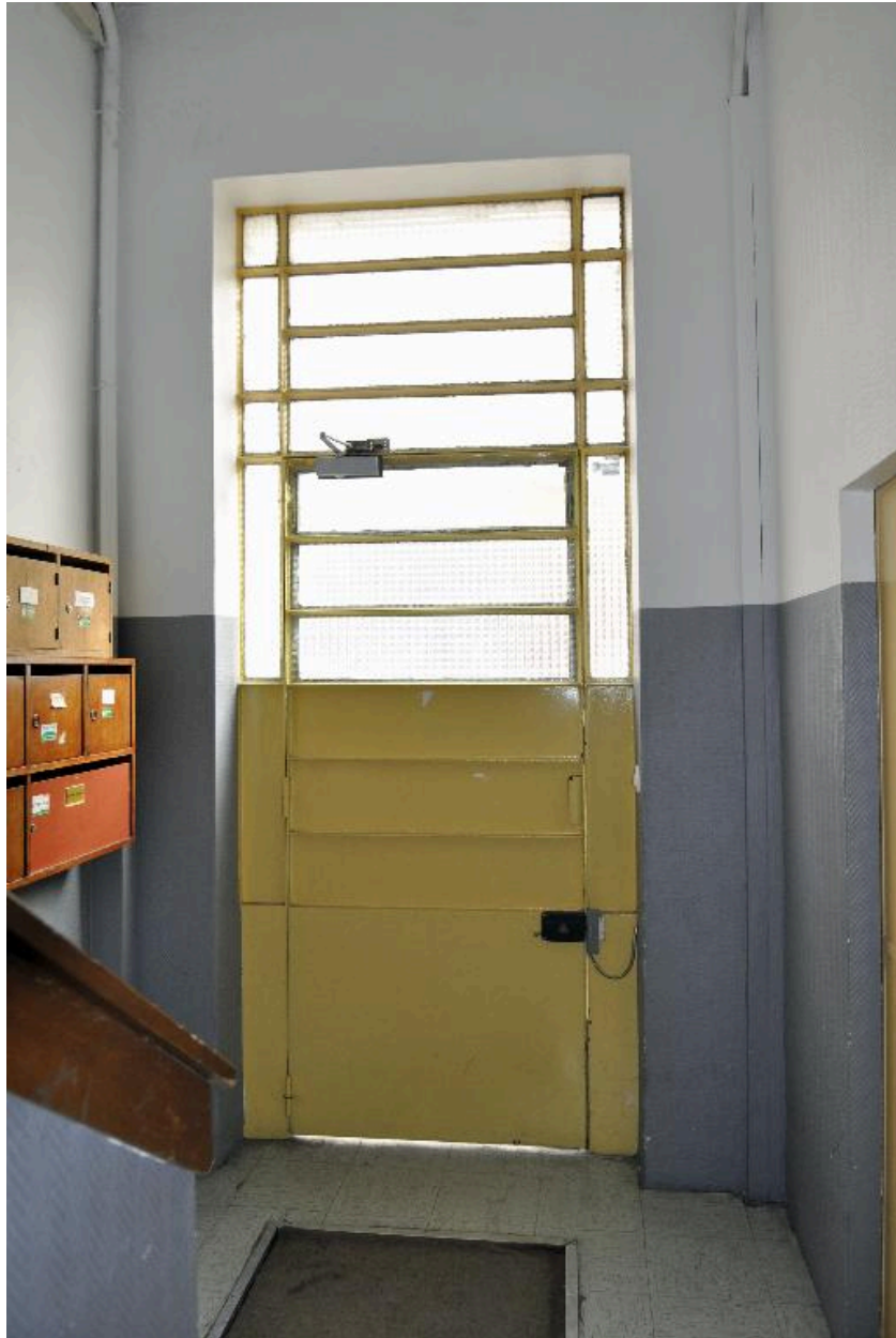
Vue du revers de la porte d'entrée