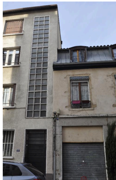
Elévation sur rue, vitrage éclairant l'escalier latéral en revers de façade