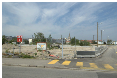
Vue sud du terrain nu IVR82_20086900461NUCA