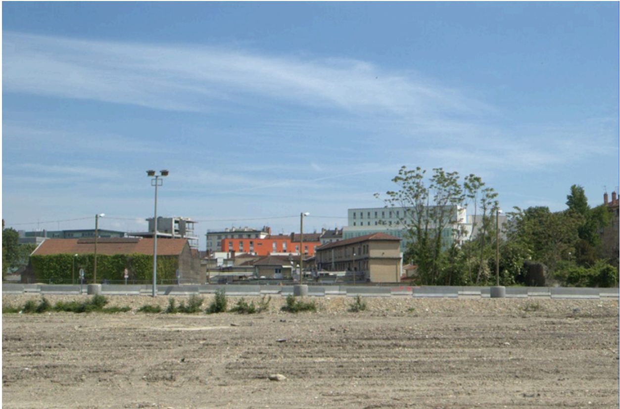
Terrain nu de la Zac du bon lait, derrière le site de Babolat