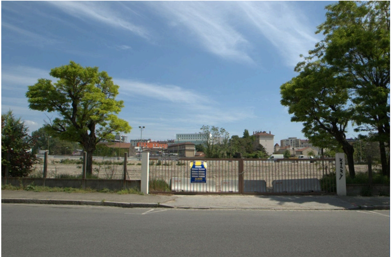
Vue générale ouest, ancienne entrée du site du Bon-Lait