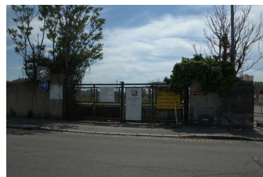
Ancienne entrée du Bon Lait IVR82_20086900466NUCA