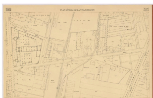
Plan général de la ville de Lyon, 1955, sté Colas (ACL 4S327) IVR84_20256901457NUCA