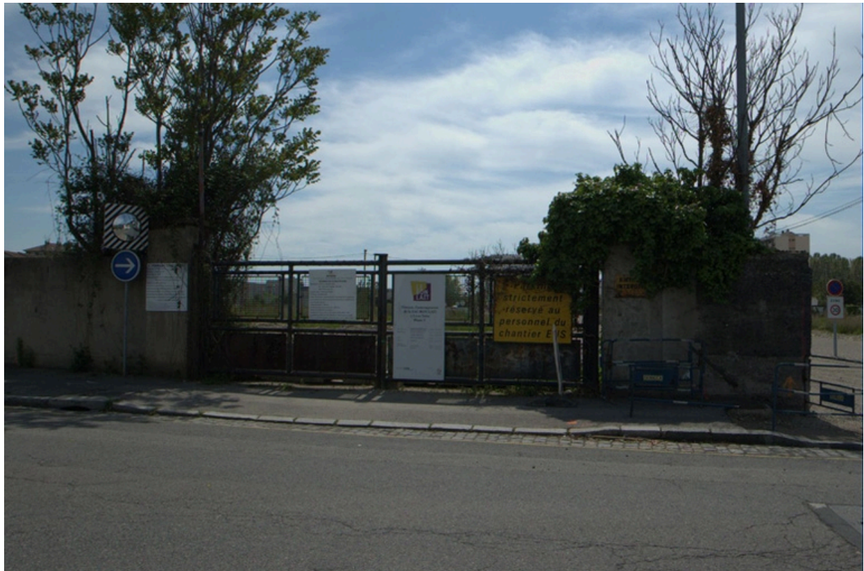
Ancienne entrée du Bon Lait