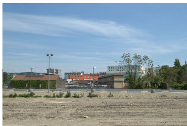
Terrain nu de la Zac du bon lait, derrière le site de Babolat IVR82_20086900463NUCA