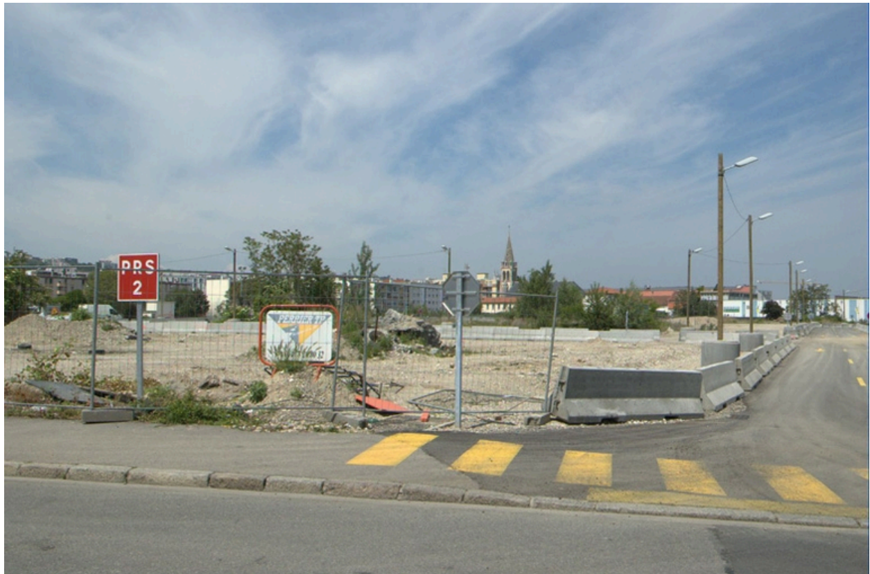
Vue sud du terrain nu