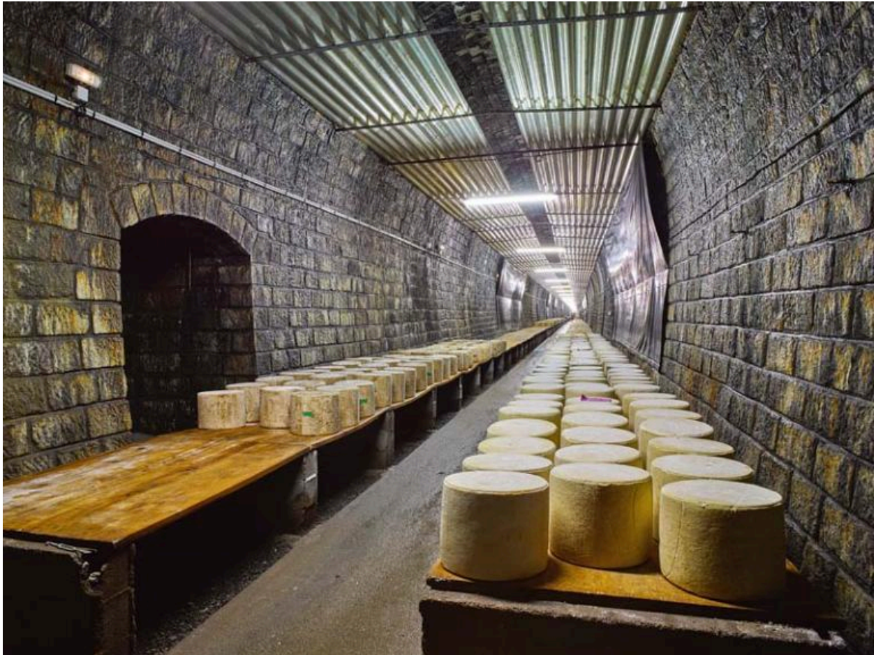
Intérieur de l'ancien tunnel de Montagnaguet, réaménagé en cave d'affinage pour les tomes de Cantal.