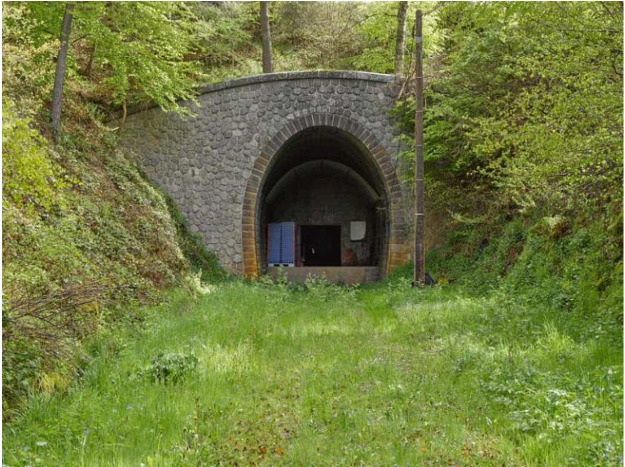
Tunnel de l'ancienne ligne, à proximité de Montagnaguet, réaménagé en cave d'affinage pour fromages.