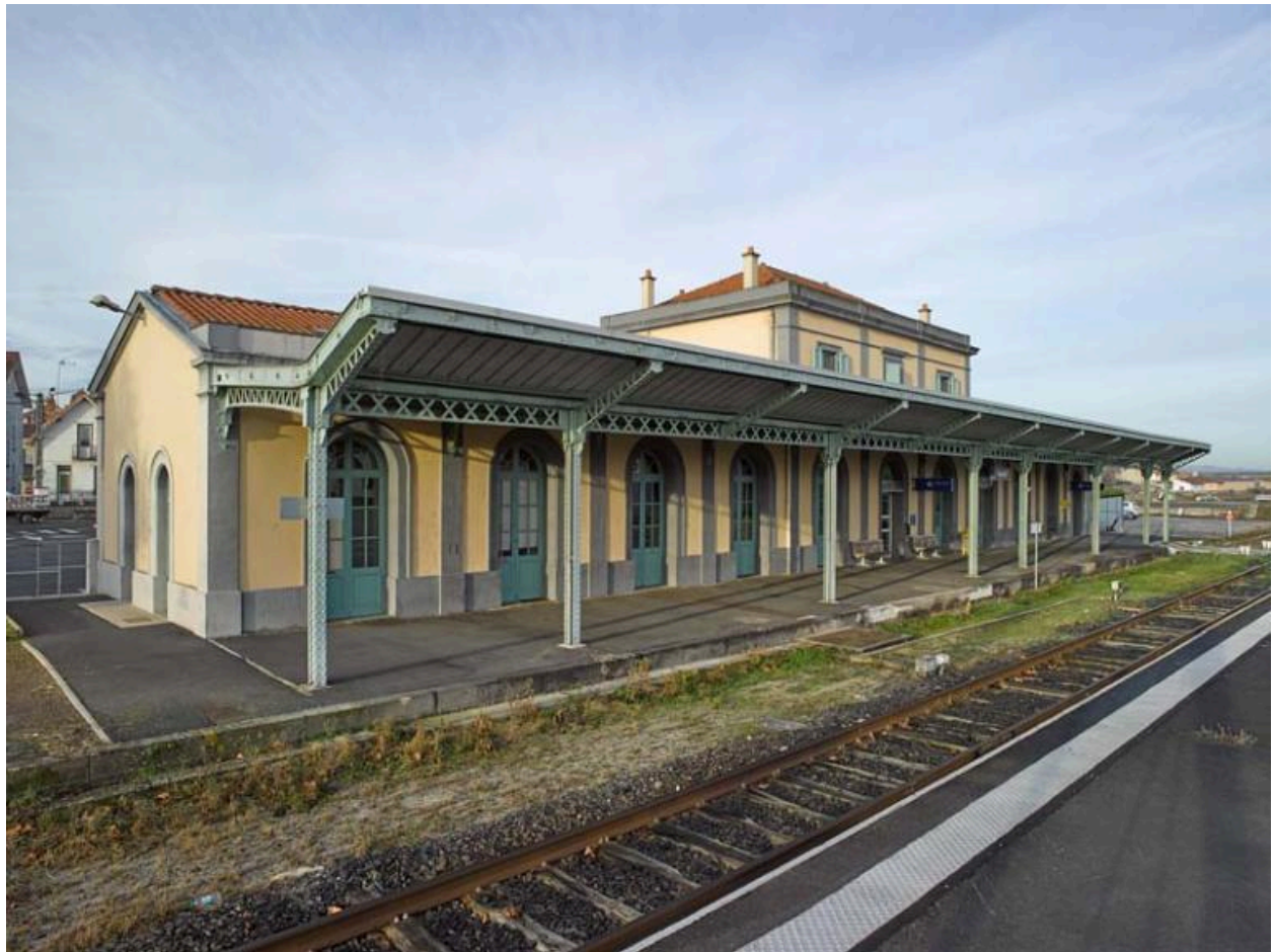
La gare de Brioude et la marquise abritant le quai principal.