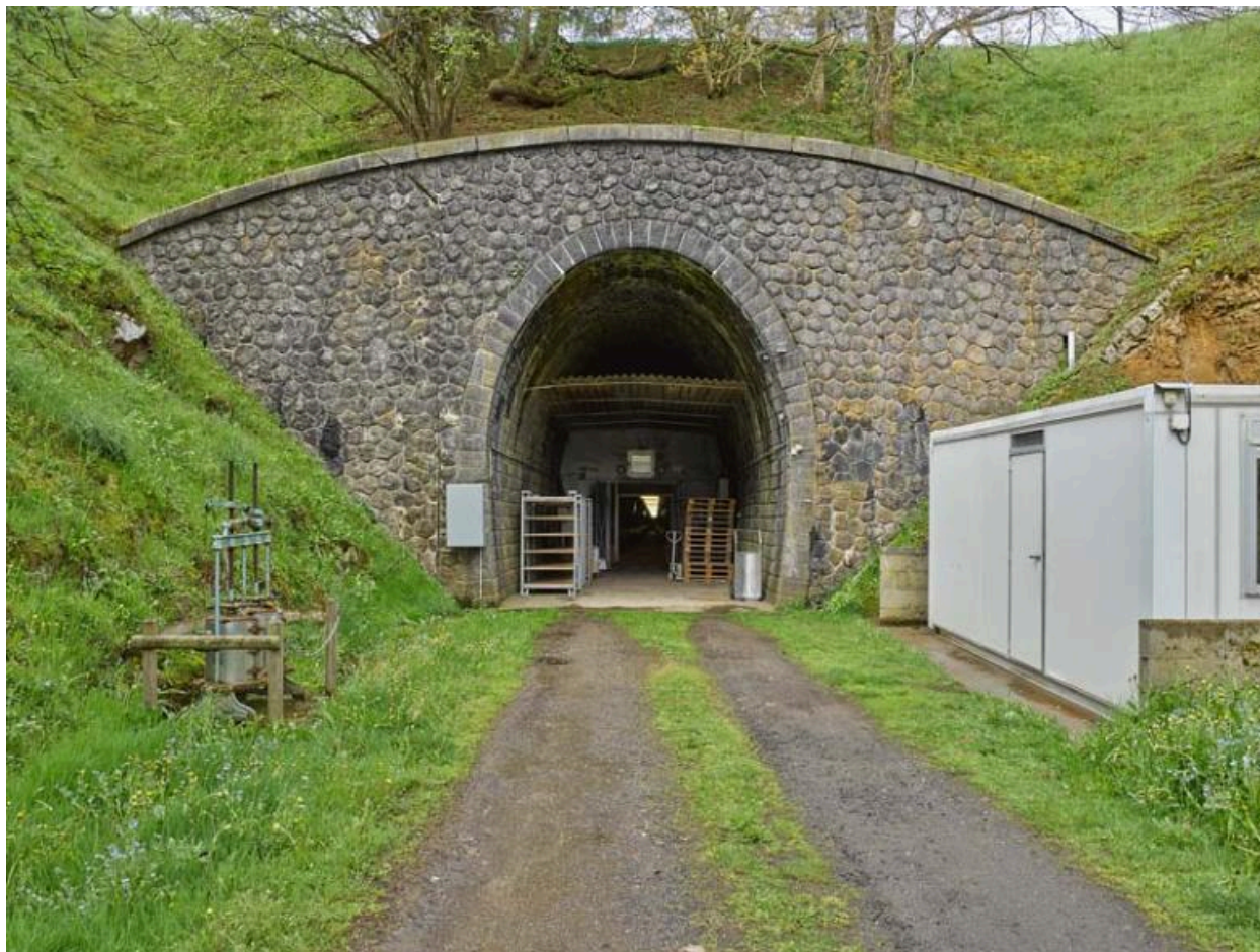
Entrée d'un ancien tunnel ferroviaire désaffecté de la ligne, à proximité de Montagnaguet. Il a été réaménagé en cave d'affinage des fromages de Cantal.