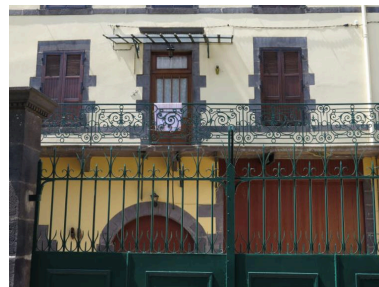
Vue partielle de la façade IVR84_20206300118NUCA