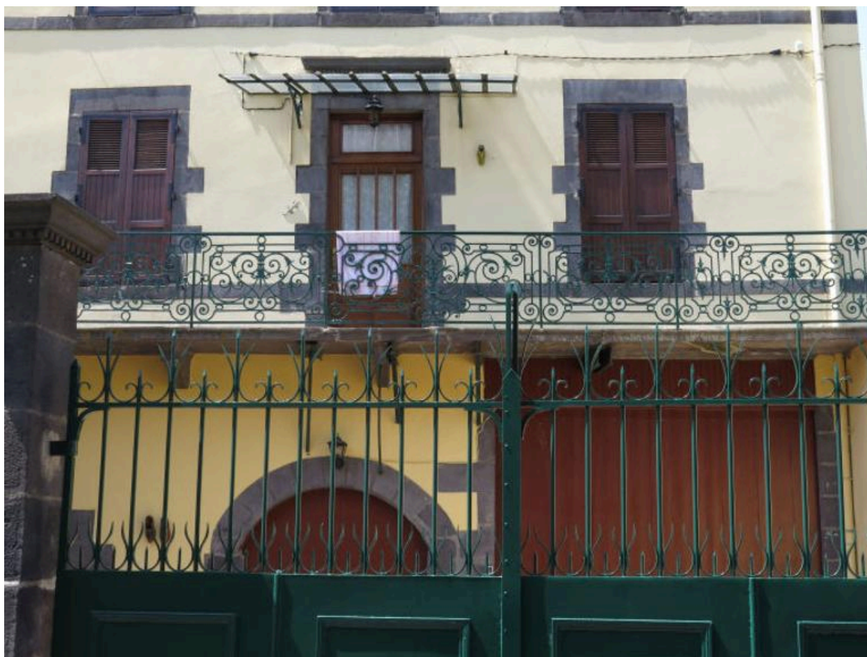
Vue partielle de la façade