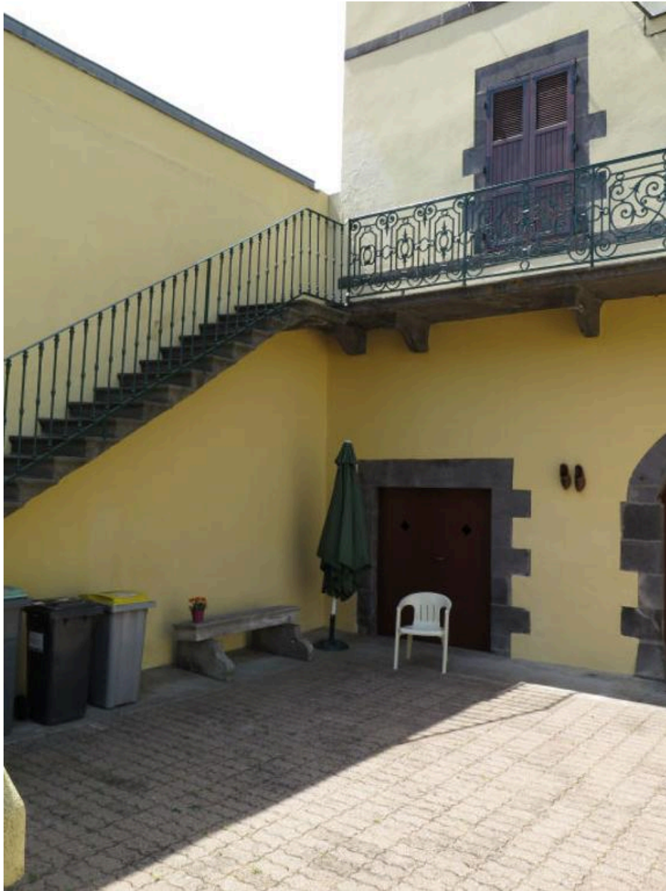
Vue partielle de l'escalier et du balcon