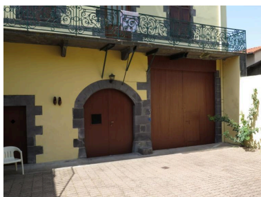
Entrées du cuveau et de la cave IVR84_20206300120NUCA