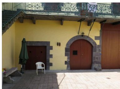
Entrées du chai, situé en niveau de cave