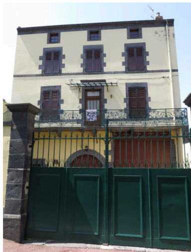
Vue générale de la façade principale