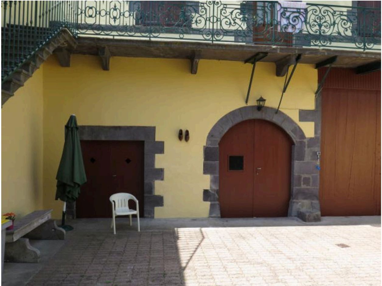
Entrées du chai, situé en niveau de cave