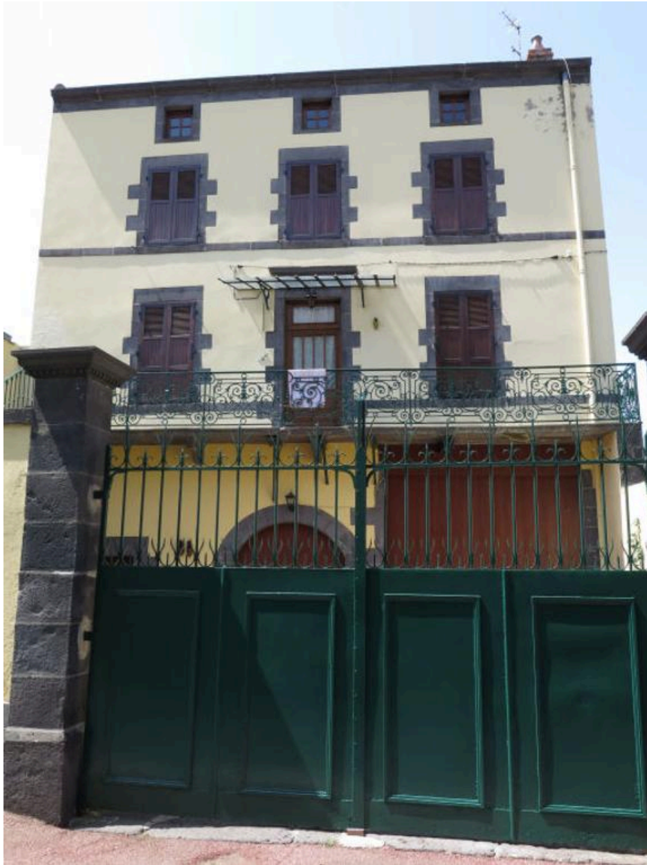
Vue générale de la façade principale