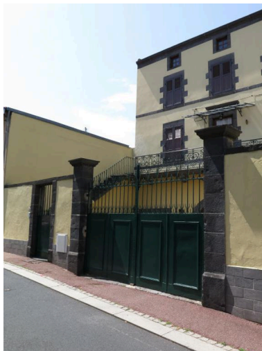
Portails d'entrée IVR84_20206300117NUCA