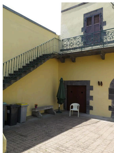
Vue partielle de l'escalier et du balcon