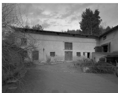
Vue d'ensemble de la cour et des communs.