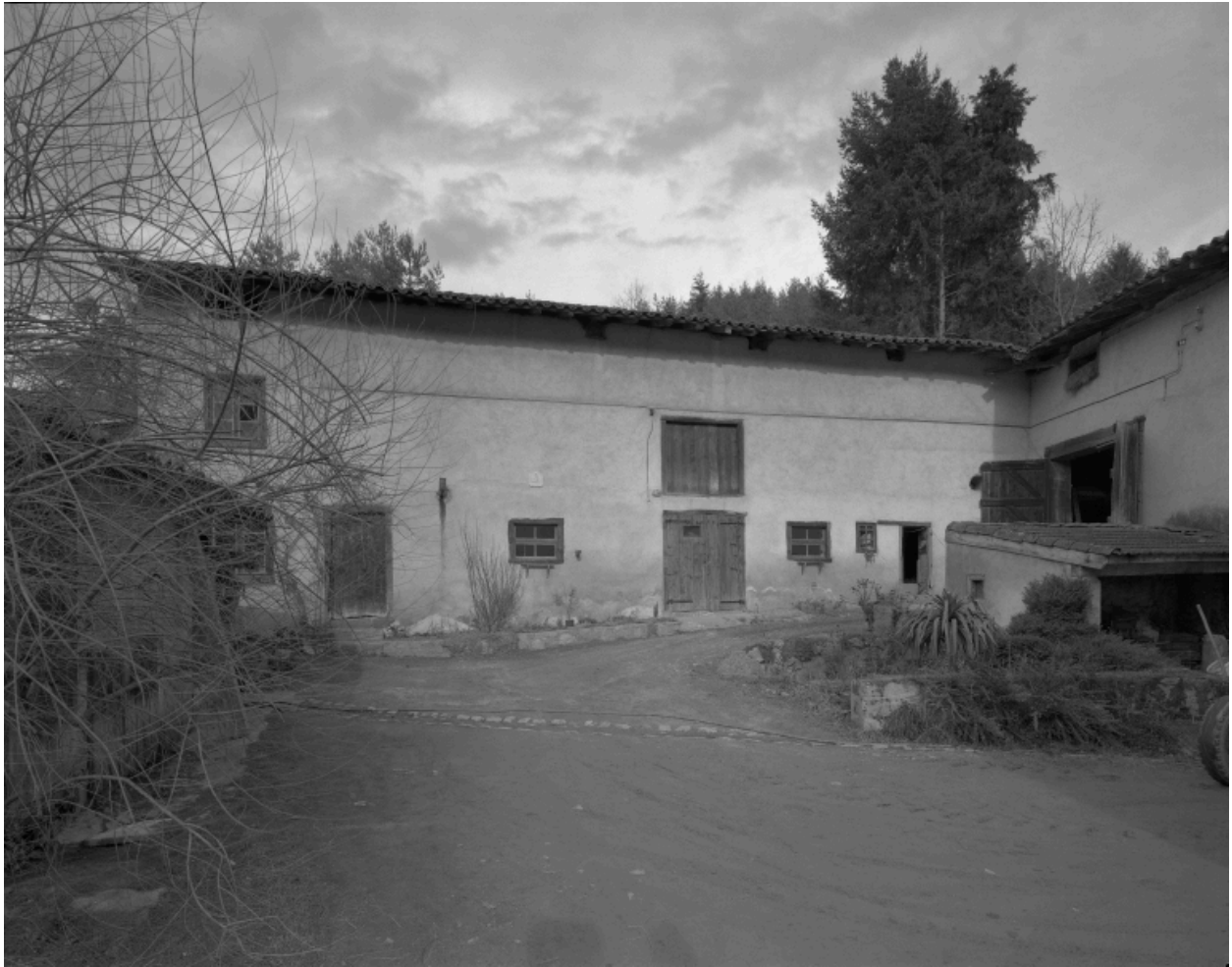
Vue d'ensemble de la cour et des communs.