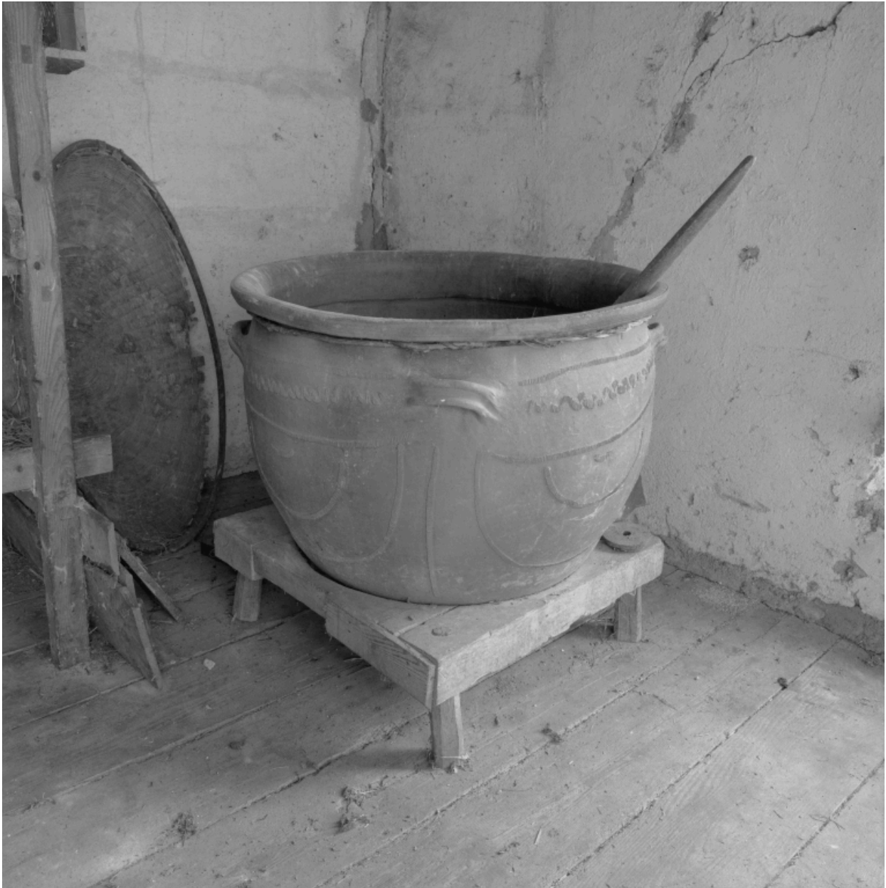
Vue intérieure de la magnanerie : chaudron pour ébouillanter les cocons.