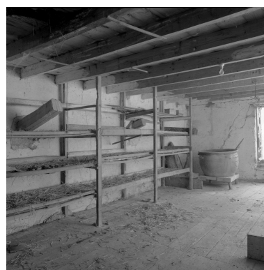
Vue intérieure de la magnanerie : claires pour l'élevage des cocons et chaudron pour les ébouillanter.