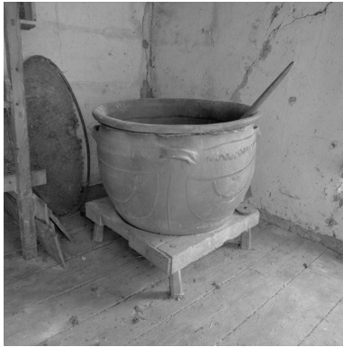
Vue intérieure de la magnanerie : chaudron pour ébouillanter les cocons.