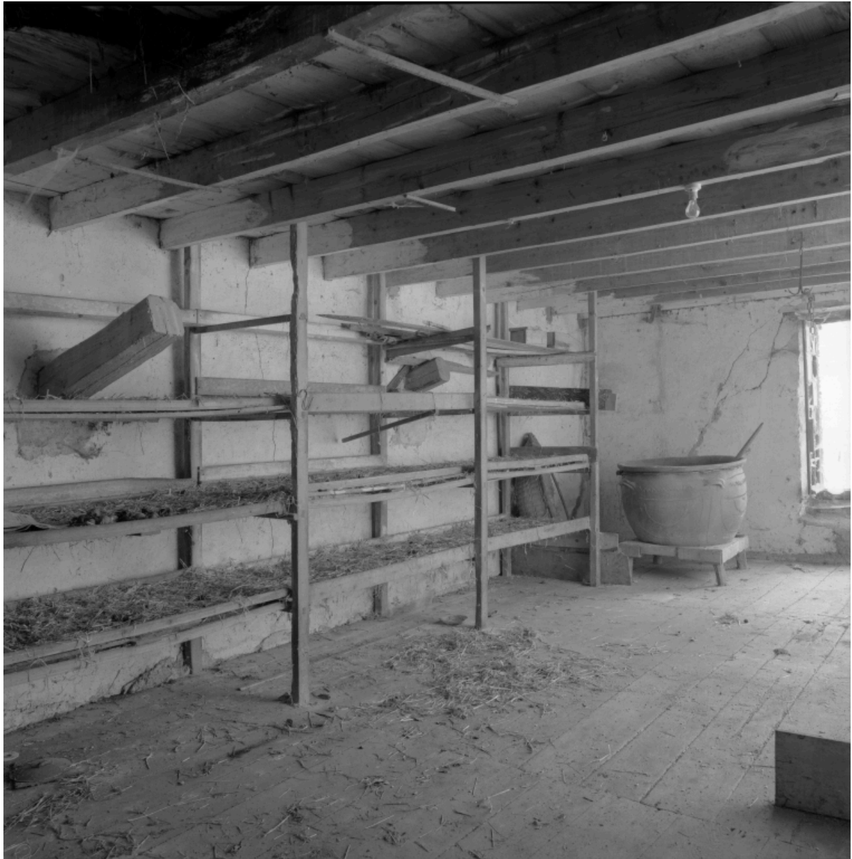
Vue intérieure de la magnanerie : claires pour l'élevage des cocons et chaudron pour les ébouillanter.