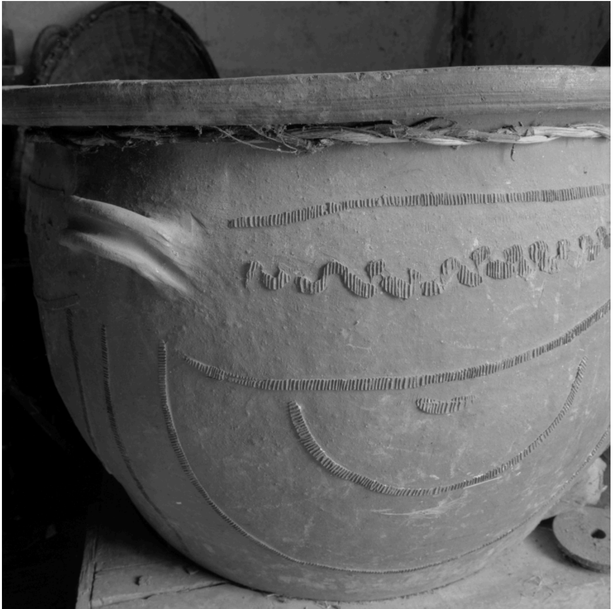
Vue intérieure de la magnanerie : détail du chaudron pour ébouillanter les cocons.