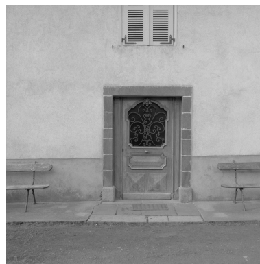
Porte d'entrée du logis. IVR82_20034200953X