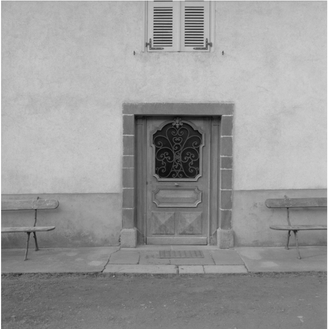
Porte d'entrée du logis.