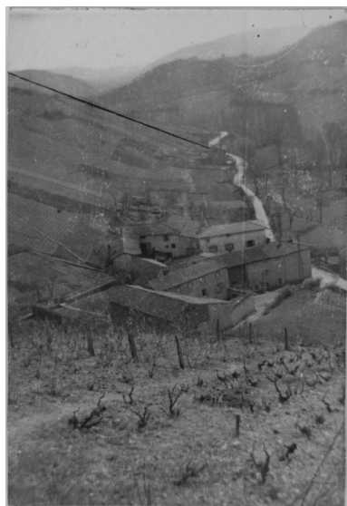
Vue du Ligeay vers 1930. Ferme, avec logis blanc, au début du 20e siècle.