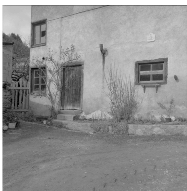
Partie gauche de l'élévation des communs : encadrement de baie inséré horizontalement dans la maçonnerie de pisé.