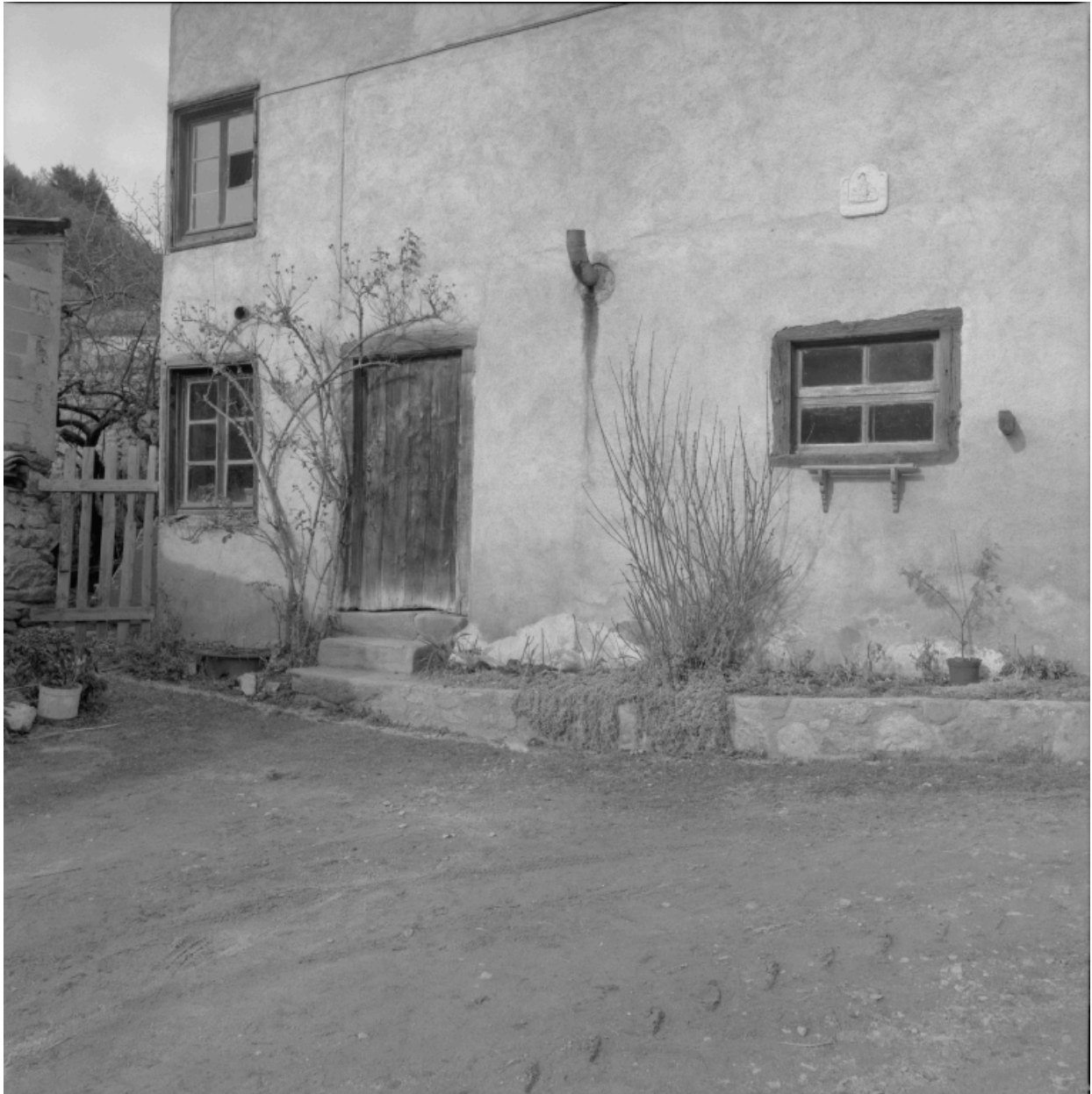
Partie gauche de l'élévation des communs : encadrement de baie inséré horizontalement dans la maçonnerie de pisé.