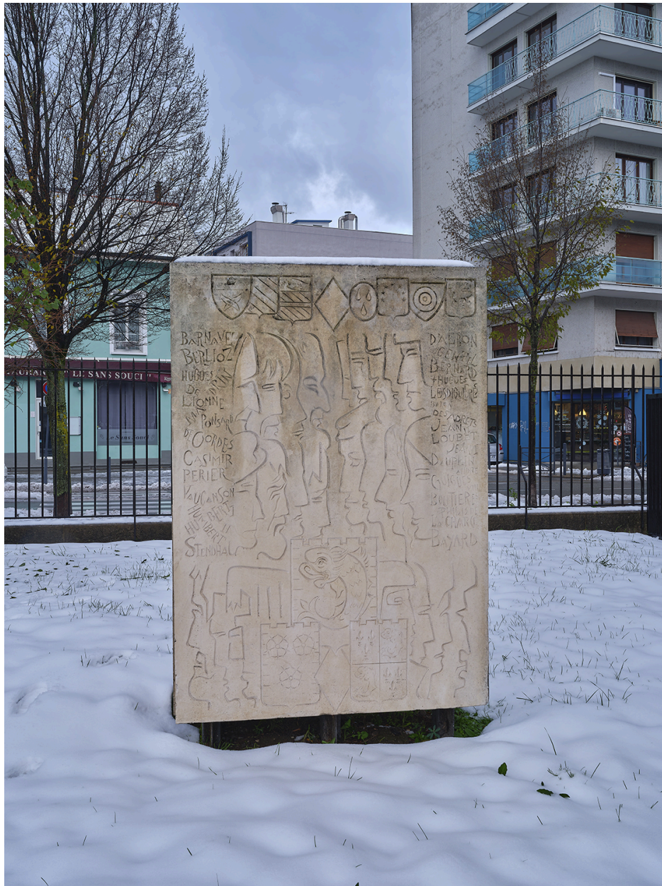
Relief n° 3 : VIE, décembre 2022