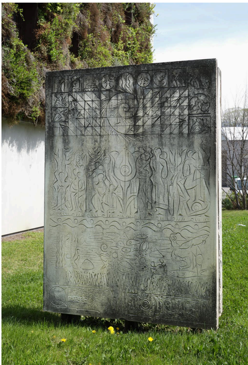
Relief n° 3 : VIE, juillet 2022