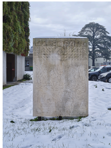
Relief n°2 : Symboles du Dauphiné, décembre 2022 IVR84_20223800138NUCA