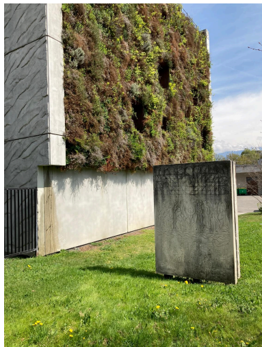
Vue d'ensemble des bas-reliefs n°2 et 3