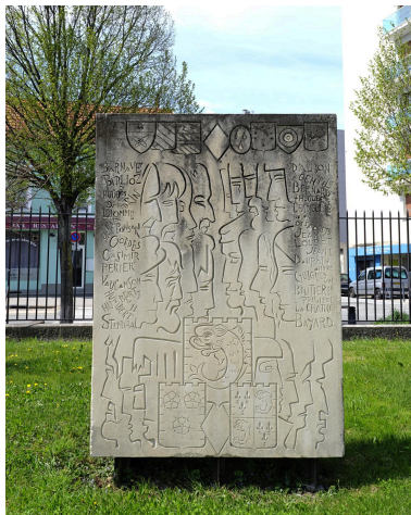
Relief n°2 : Symboles du Dauphiné, juillet 2022 IVR84_20223800068NUCA