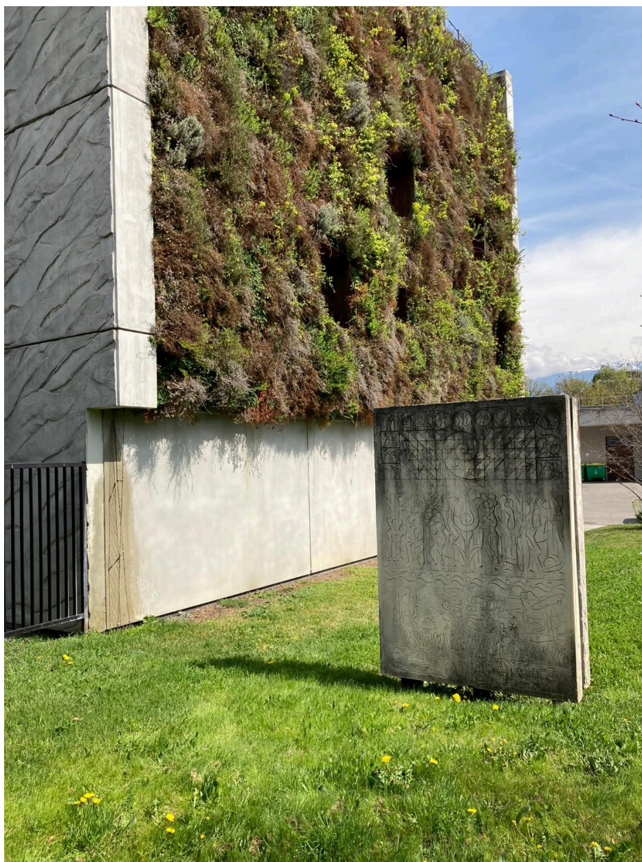
Vue d'ensemble des bas-reliefs n°2 et 3