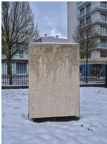
Relief n° 3 : VIE, décembre 2022, IVR84_20223800139NUCA