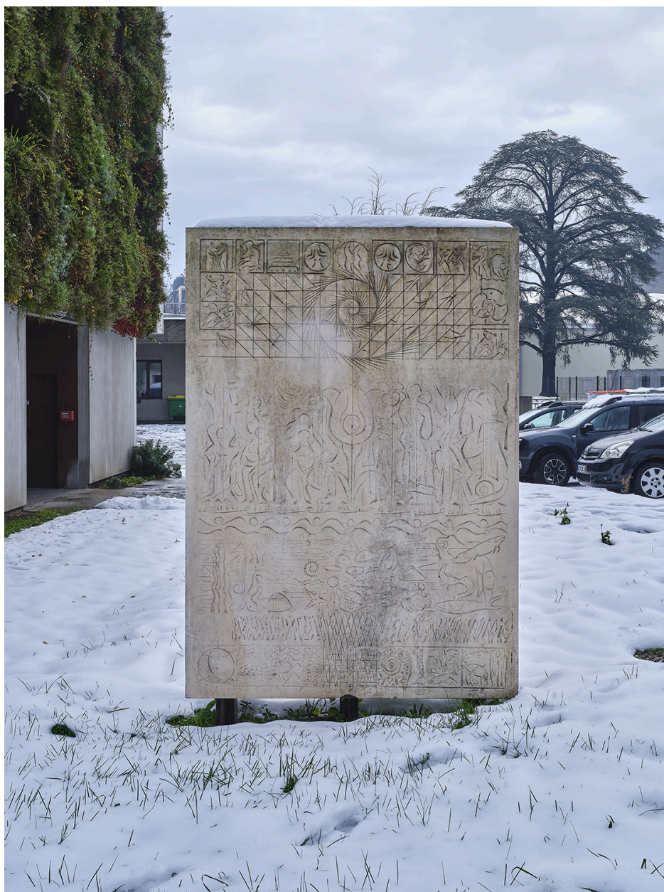
Relief n°2 : Symboles du Dauphiné, décembre 2022