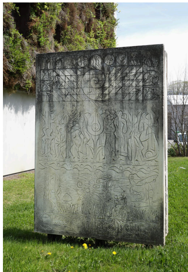
Relief n° 3 : VIE, juillet 2022 IVR84_20223800067NUCA