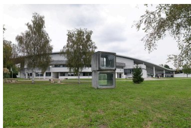
L'installation dans son environnement. IVR84_20203800441NUCAQ