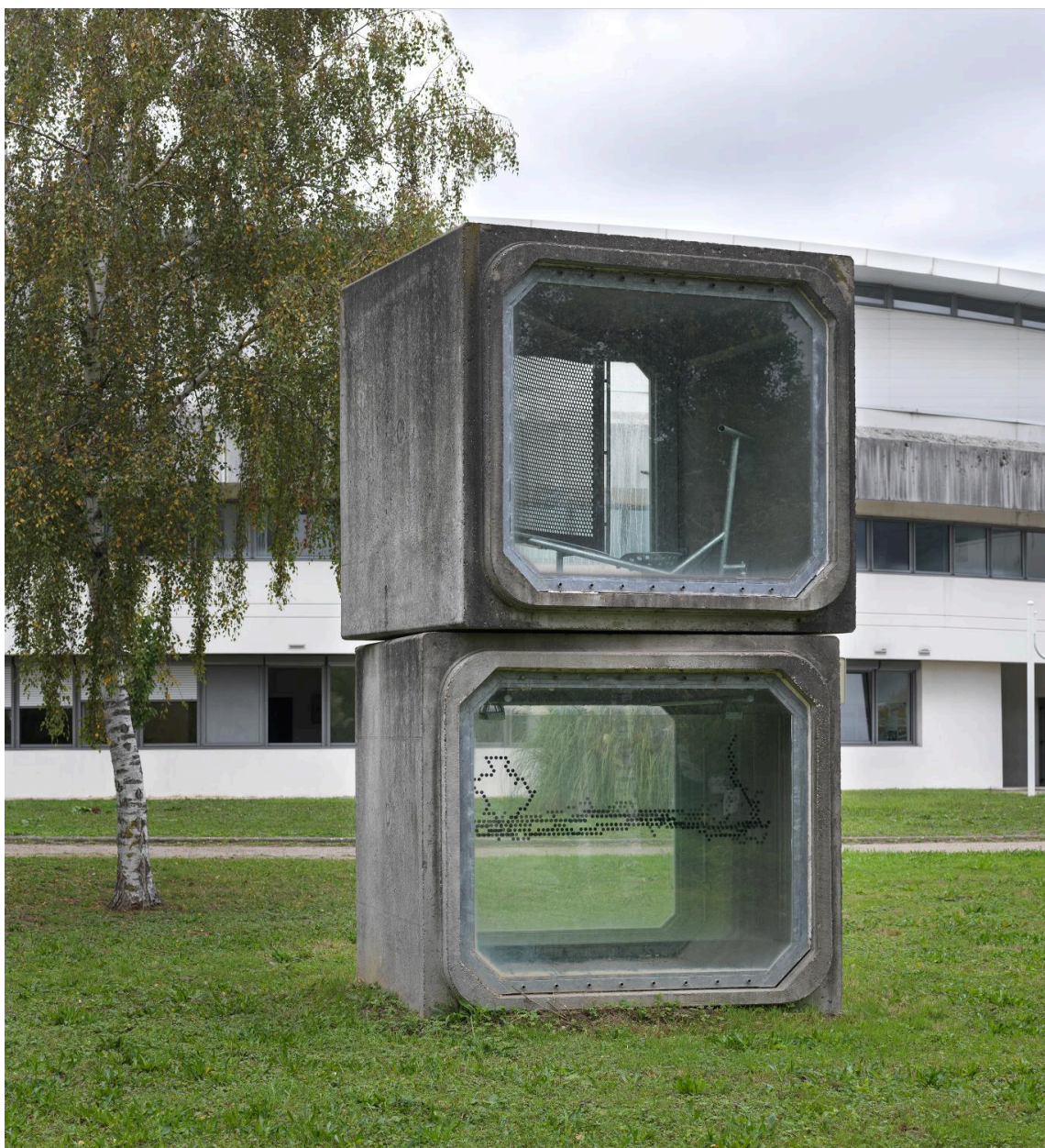
Vue d'ensemble de l'installation par la gauche.