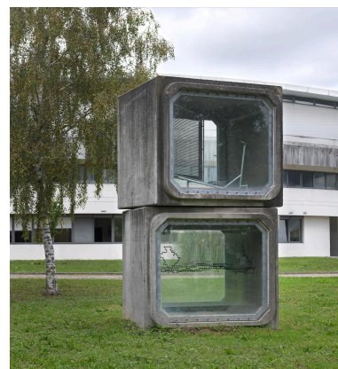
Vue d'ensemble de l'installation par la gauche. IVR84_20203800449NUCAQ