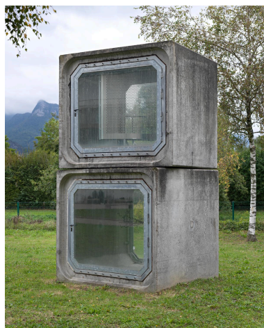
Vue d'ensemble de l'installation par la droite. IVR84_20203800447NUCAQ