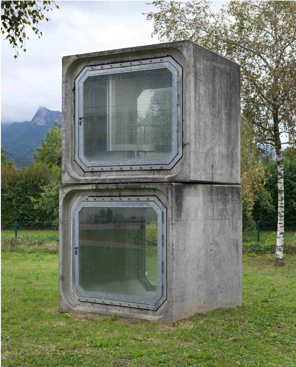
Vue d'ensemble de l'installation par la droite.