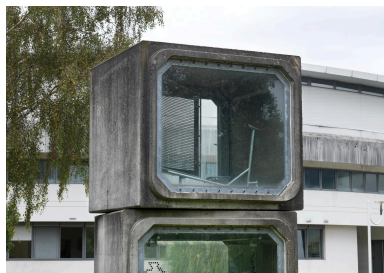
Détail sur le cube supérieur.