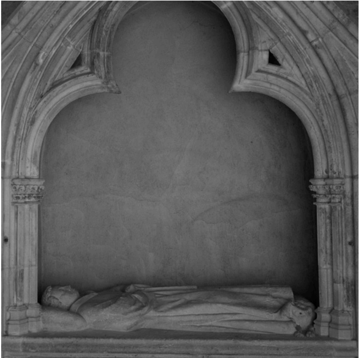
Vue de l'enfeu et du gisant.