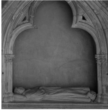
Vue de l'enfeu et du gisant.