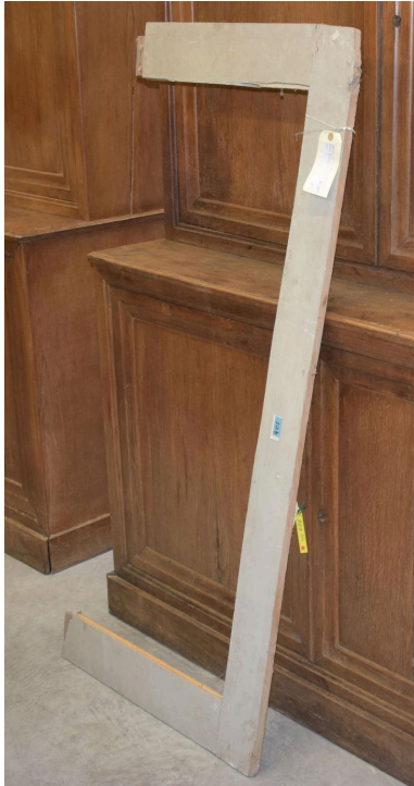
Vue générale IVR84_20226302452NUC4A