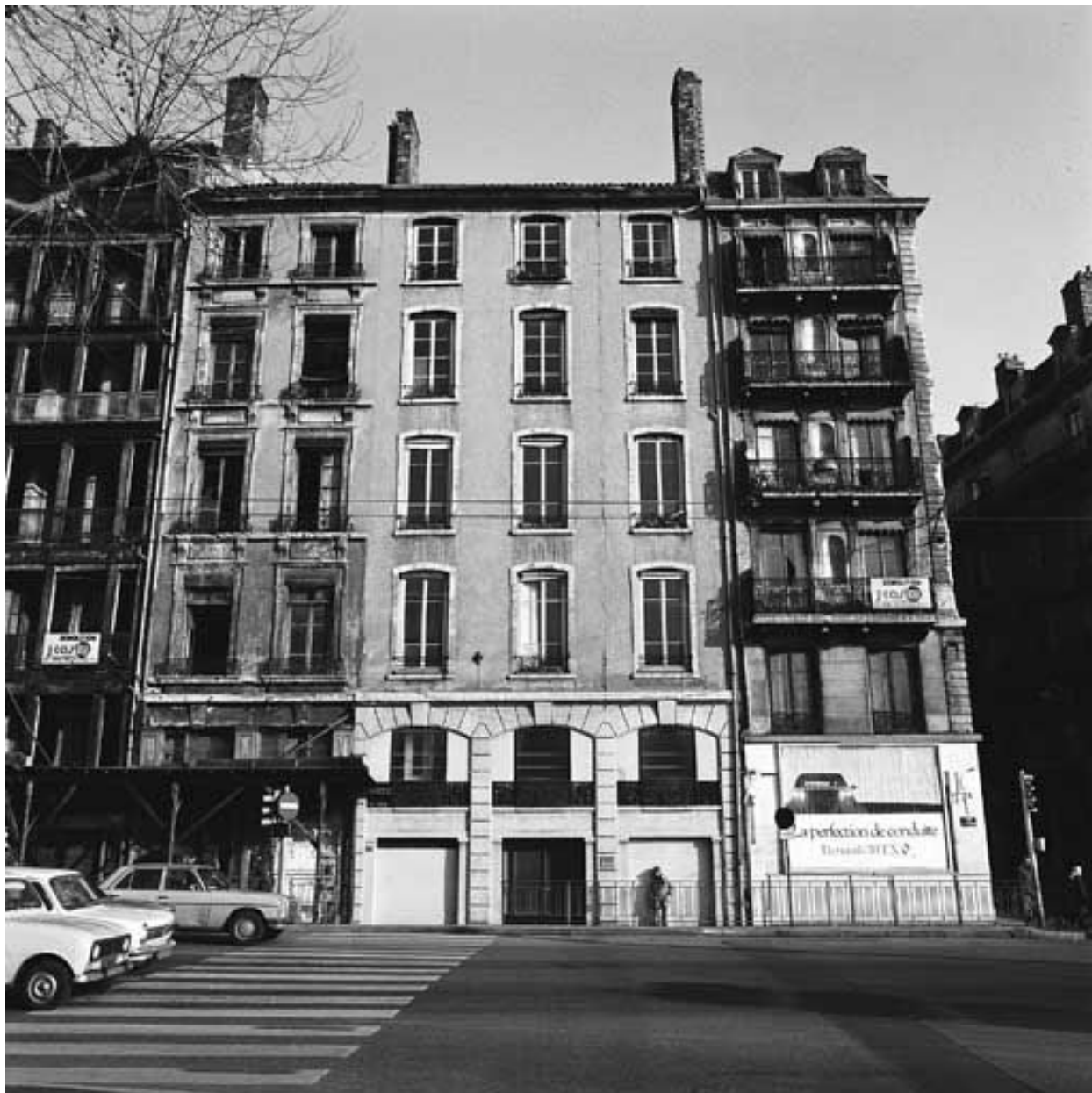
Façade sur le quai, vue générale