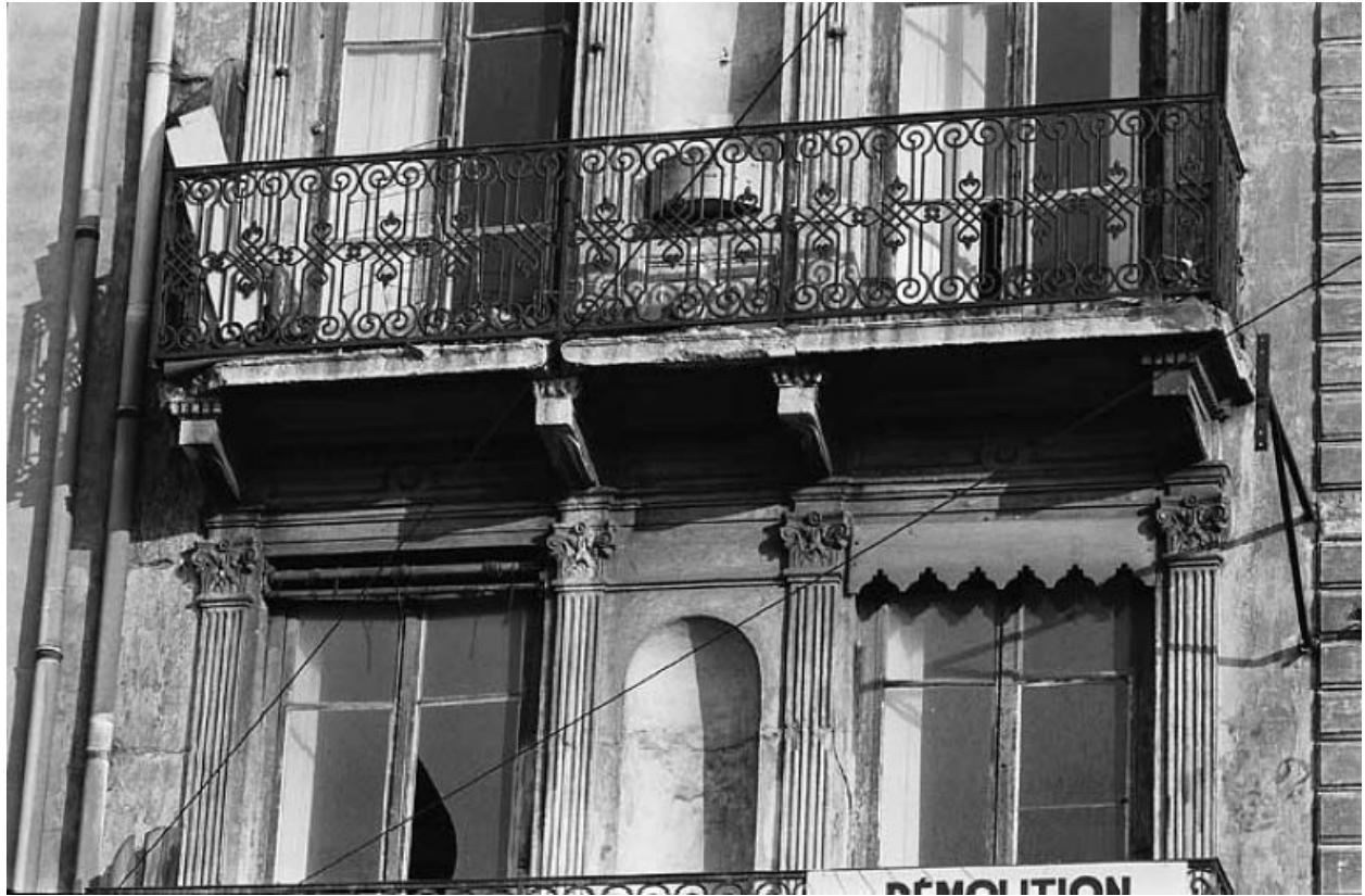
Façade sur le quai, détail du balcon du niveau 4