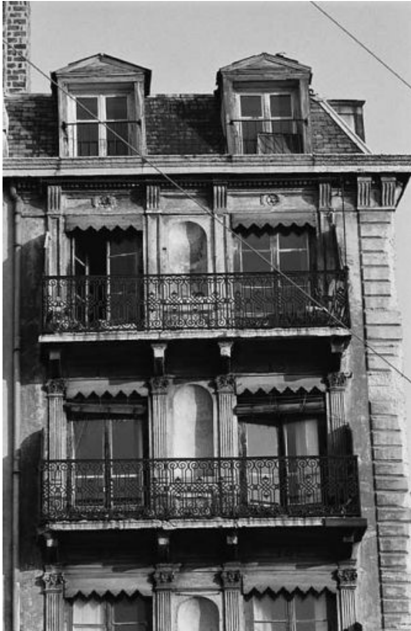
Façade sur le quai, détail des niveaux 5 et 6 et des lucarnes du comble