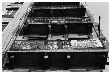
Façade sur le quai, balcons des niveaux 3 à 5 IVR82_19796900055Z

IVR82_19796900060Z