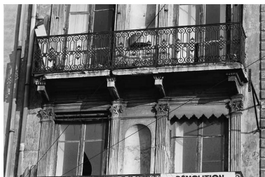
Façade sur le quai, détail du balcon du niveau 4 IVR82_19796900059Z