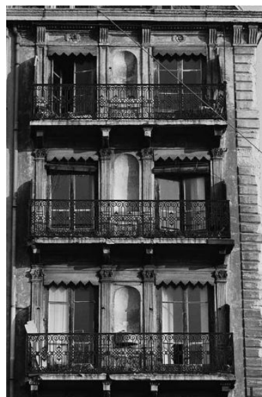
Façade sur le quai, niveaux 4 à 6