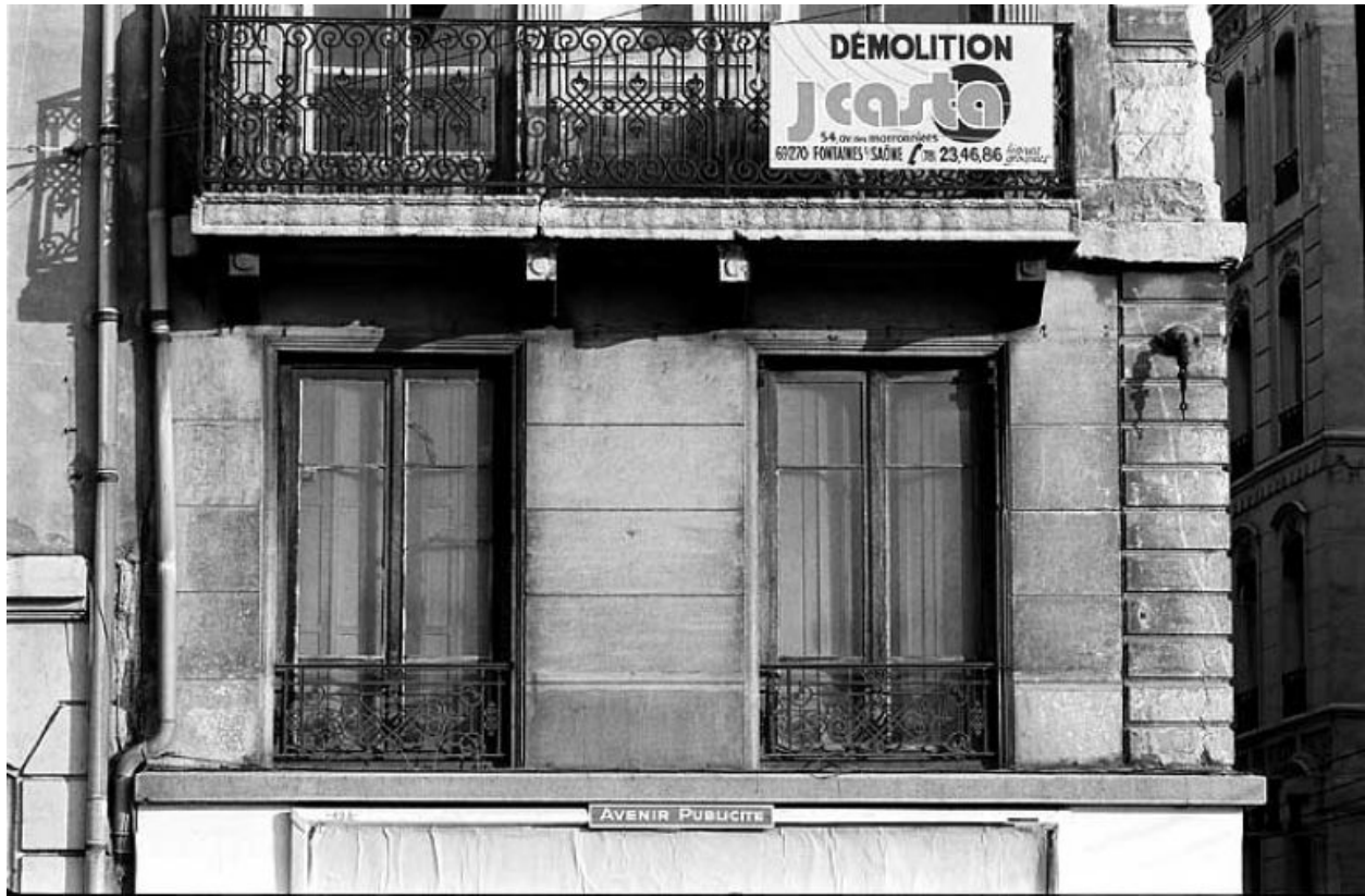
Façade sur le quai, 2e niveau