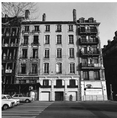
Façade sur le quai, vue générale IVR82_19796900041X

Vue générale des façades sur le quai Saint-Antoine et sur la rue Grenette IVR82_20046900296NUC