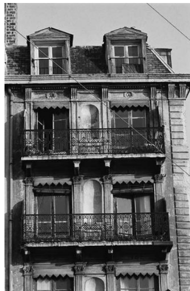
Façade sur le quai, détail des niveaux 5 et 6 et des lucarnes du comble