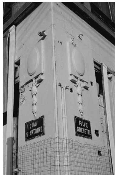
Devanture de boutique du rez- de-chaussée, détail du décor à l'angle du quai et de la rue Grenette IVR82_19796900056Z