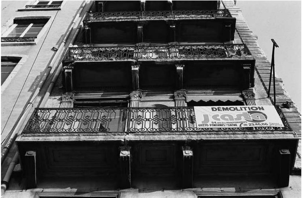
Façade sur le quai, balcons des niveaux 3 à 5