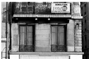
Façade sur le quai, 2e niveau IVR82_19796900058Z