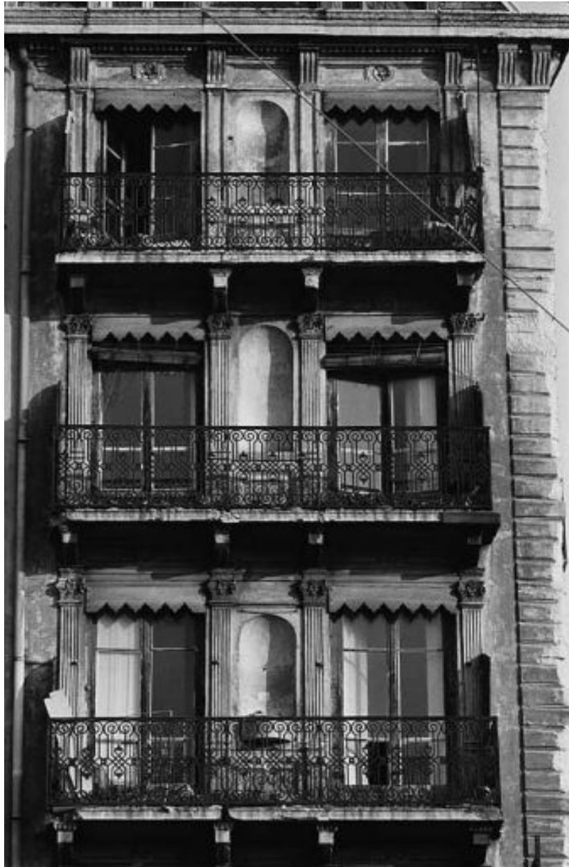
Façade sur le quai, niveaux 4 à 6