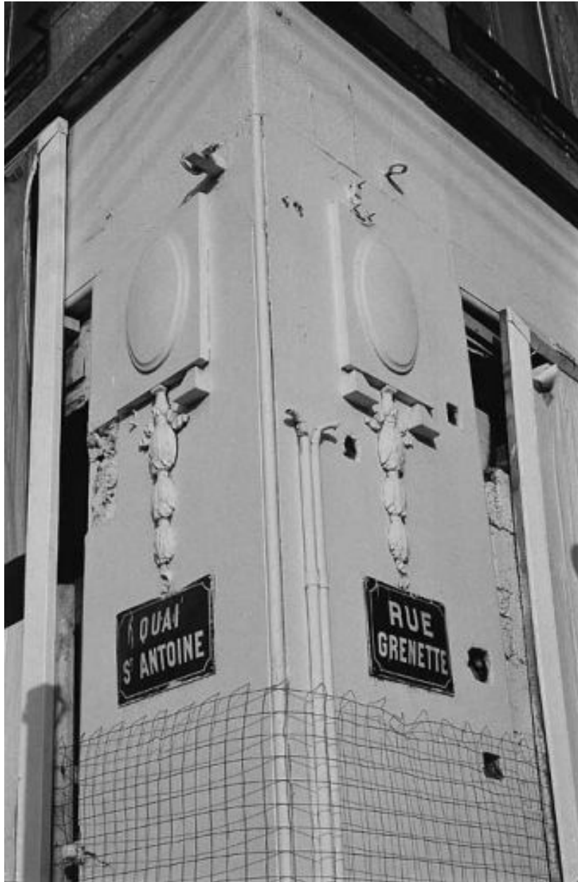
Devanture de boutique du rez-de-chaussée, détail du décor à l'angle du quai et de la rue Grenette