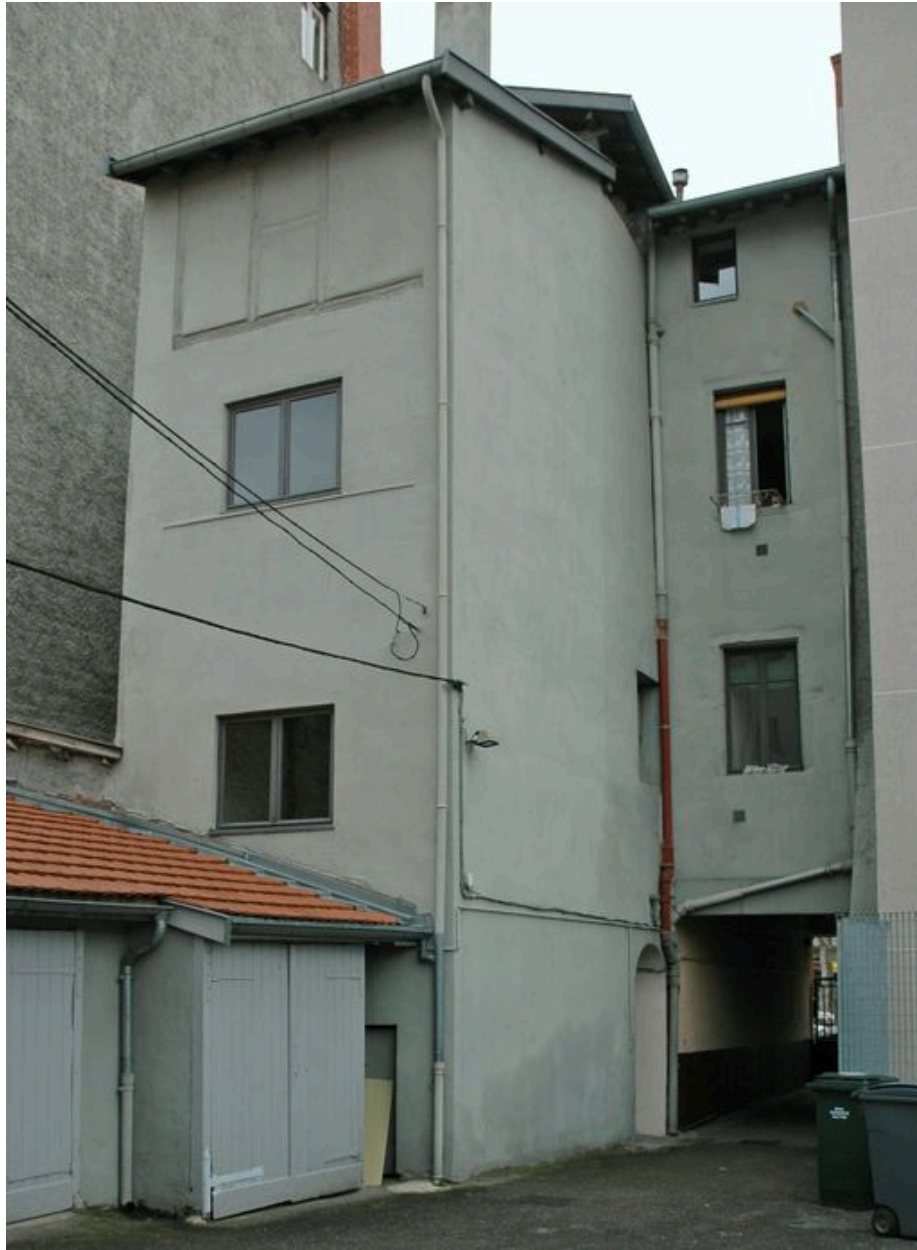
Façade est sur cour avec la cage d'escalier depuis le nord-est de la cour