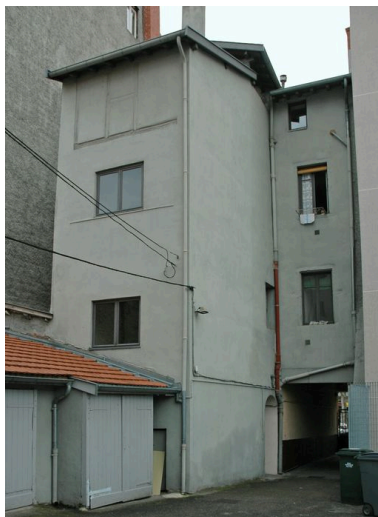
Façade est sur cour avec la cage d'escalier depuis le nord-est de la cour IVR82_20066901388NUCA