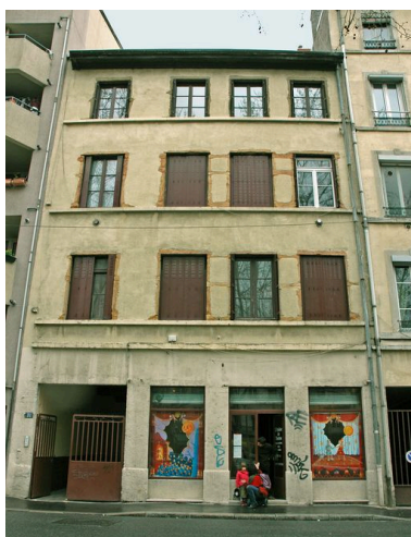
Façade la rue Claude- Boyer vue depuis l'ouest IVR82_20066901390NUCA