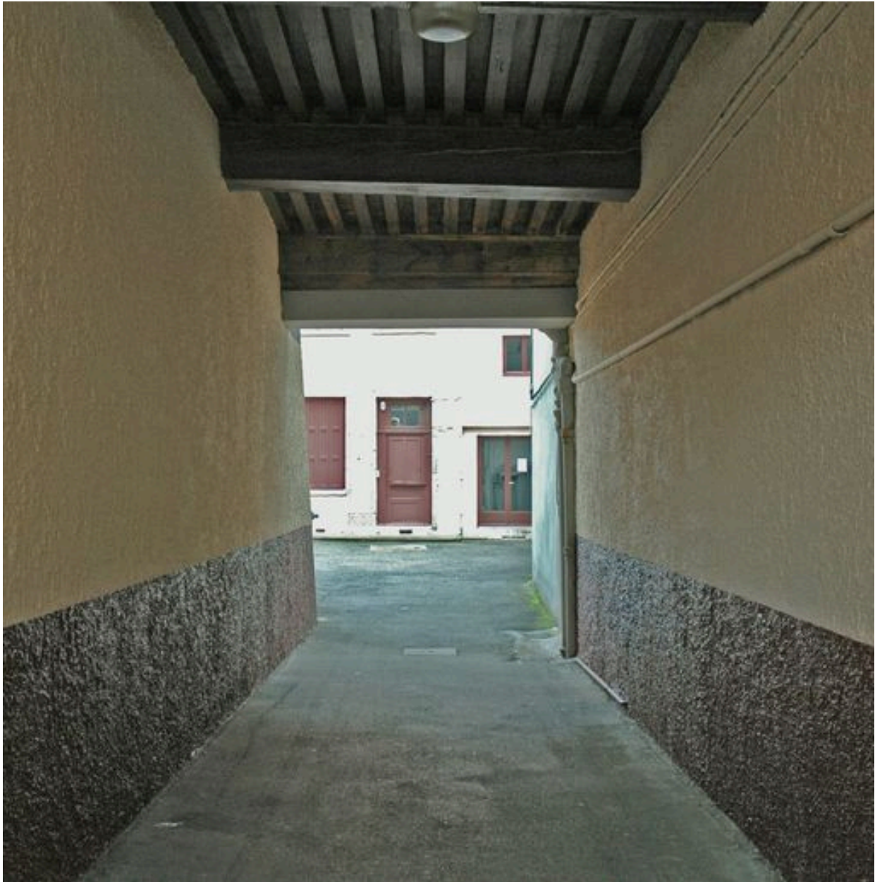
Passage couvert vue depuis l'ouest