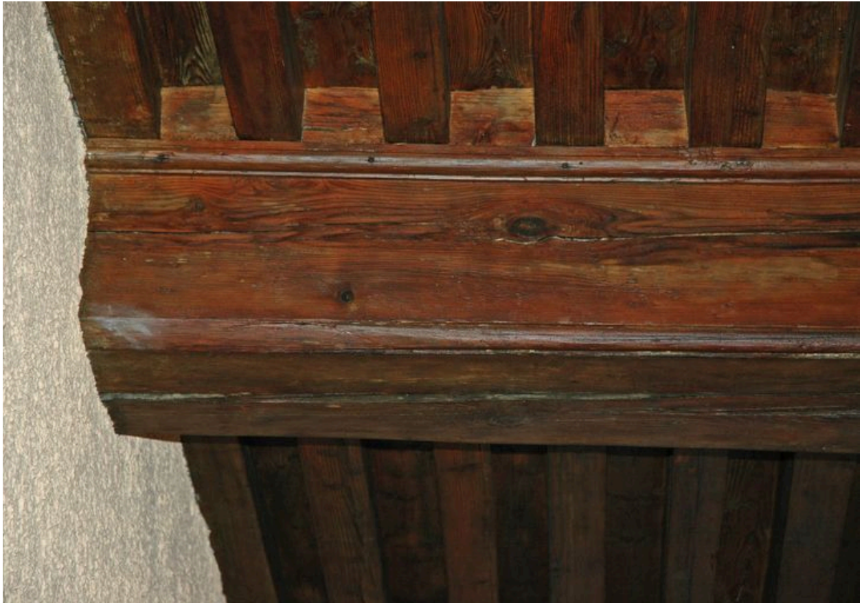
Détail du plafond de passage couvert