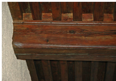
Détail du plafond de passage couvert IVR82_20066901389NUCA