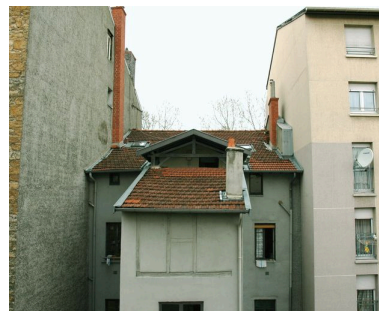
Haut de la cage d'escalier en pan de bois, vue depuis la cage d'escalier de l'immeuble en fond de cour à l'est IVR82_20066901387NUCA