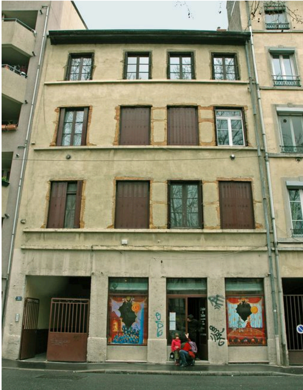
Façade la rue Claude-Boyer vue depuis l'ouest