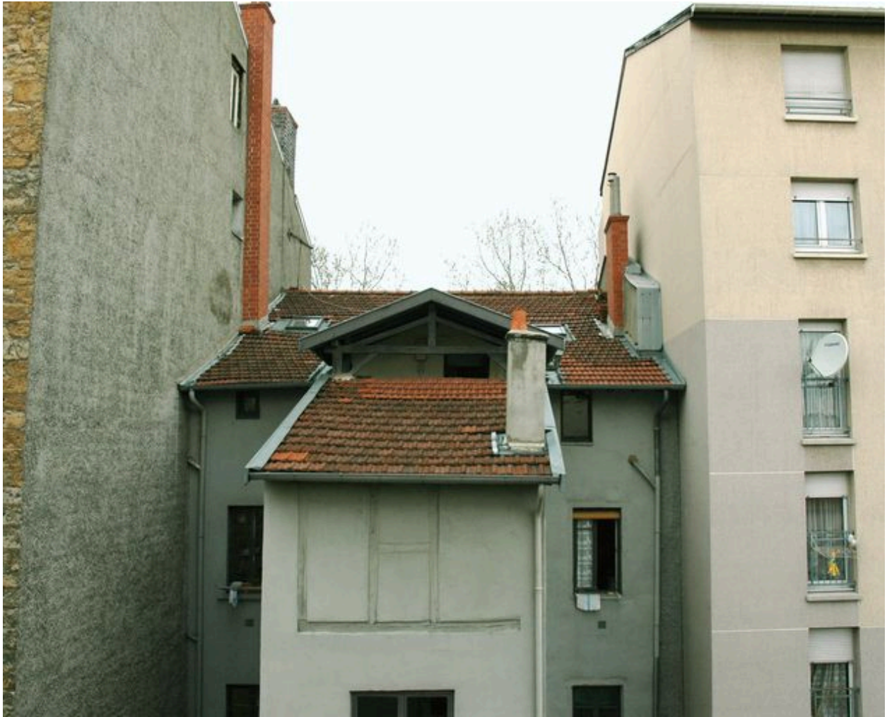
Haut de la cage d'escalier en pan de bois, vue depuis la cage d'escalier de l'immeuble en fond de cour à l'est