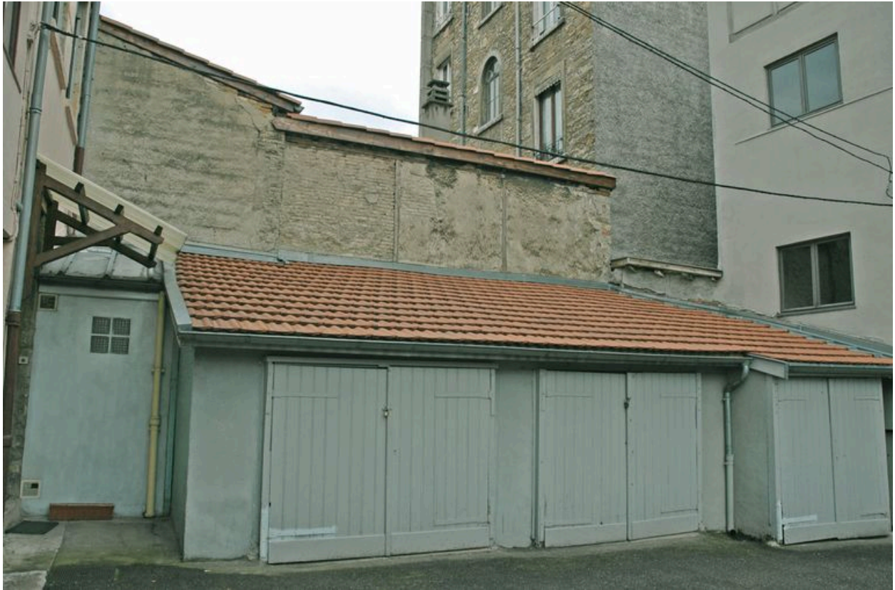
Garages situés le long du côté sud de la cour, vue depuis l'angle nord-est