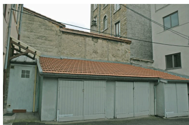
Garages situés le fond du côté sud de la cour, vue depuis l'angle nord-est IVR82_20066901386NUCA