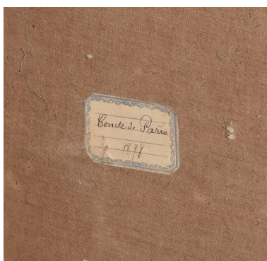
Détail - inscription manuscrite IVR84_20216301644NUCA

IVR84_20216301536NUCA