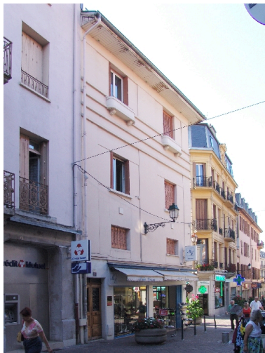
Façade